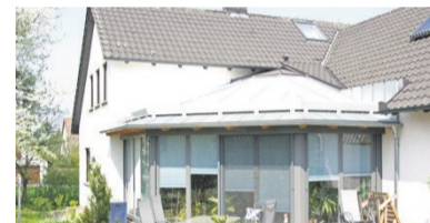
Aluminium-Rollläden reflektieren die Sonnenstrahlen.

Die Lösung: nach Maß gefertigte Aluminium-Rollläden. Die vielseitigen Beschattungshelfer „made in Germany“ reflektieren bis zu 92 Prozent der Sonnenstrahlen, noch bevor diese auf das Fensterglas treffen und schützen so nicht nur vor zu viel Helligkeit, sondern auch vor einem Hitzestau. Völlig im Dunkeln tappen muss zum Glück niemand: Speziell gelochte Lamellen erzeugen ein schönes Streulicht und lassen sich in beliebigen Abständen mit dem Voll-Profil kombinieren. hlc