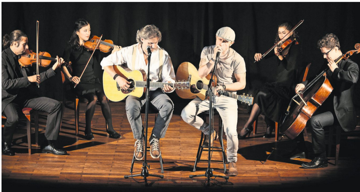
Das Duo Graceland präsentiert die schönsten Klassiker von Simon & Garfunkel.

Laut Mitteilung präsentiert am Sonntag, den 25. Februar, das Duo Graceland mit ihrem Programm „Simon & Garfunkel Tribute meets Classic“ um 19 Uhr im Prisma in Freiberg die schönsten Klassiker des berühmten Folkrock-Duos. Die Veranstaltung wird im Rahmen der Neckar-Enz KulturEvents-Reihe in Koopera-