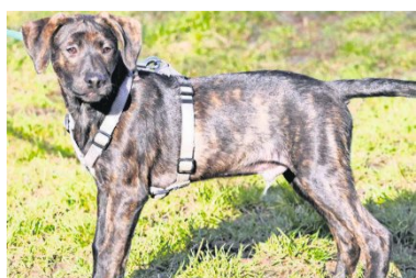
Henry und seine Brüder möchten vollen Familienanschluss.

und Beschäftigung. Katzen: Kätzin Kelly (kastr., 2007 geb.) ist sehr anhänglich und verschmüsst. Die Seniorin ist noch sehr agil für ihr Alter. Ihre Schilddrüsenüberfunktion kann problemlos mit Tabletten übers Futter behandelt werden. Mit katzen erfahrenen Hunden kommt Kelly gut aus. Sie sucht ein Zuhause als Wohnungskatze, mit