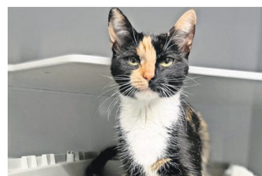
Gwendolyn würde sich über einen Spielgefährten freuen.

Kleintiere: Wellensittich Gabriel ist täglichen Freiflug gewohnt,