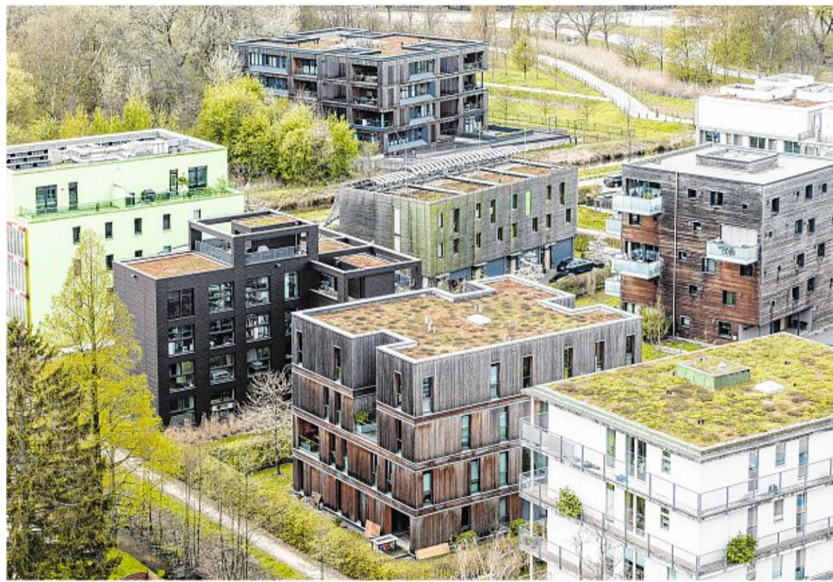
Get abgedeckt: Auch Gründächer eignen sich zur Dämmung von Wohngebäuden. Auf ihnen gedeiht außerdem biologische Artenvielfalt.

Neben anderen Experten gibt der Bund für Umwelt- und Naturschutz Deutschland (BUND) Auskunft darüber welche Dämmstoffe in Frage kommen. Holzfasern zählen dazu. Sie werden aus Schwach- und Resthölzern gewonnen und zu Platten gepresst, die nicht nur dem Wärme-, sondern auch dem Schallschutz dienen. Die Herstellung kann aber energieintensiv sein. Zellulose ist ein weiterer Dämmstoff, er wird aus zerfasertem Altpapier hergestellt und hauptsächlich für die nachträgliche Dämmung von Hohlräumen eingesetzt.