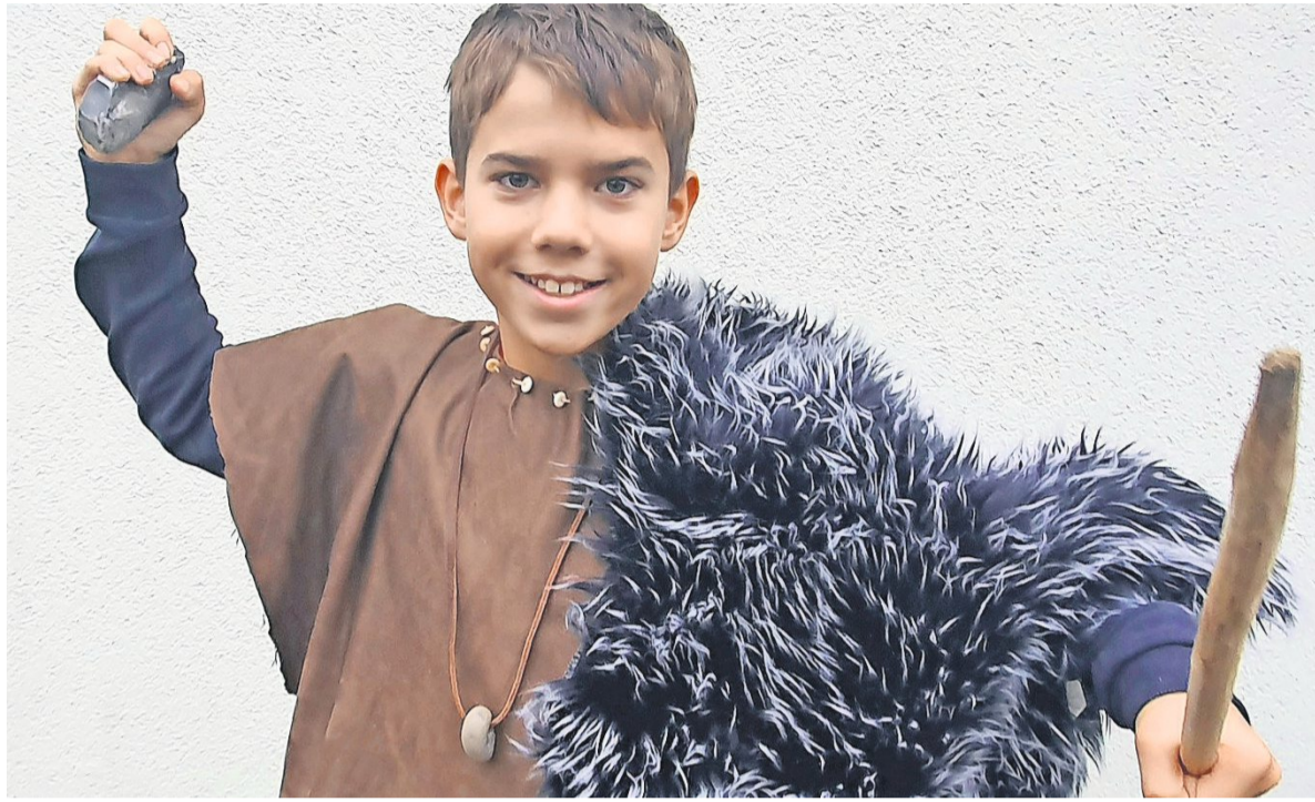
„Japadapaduh!“ Beim Steinzeitaktionstag am 20. Oktober im Museum kann man sich unter anderem als Steinzeitmensch verkleiden.

In den dunklen Monaten, am Freitag, 1. November, und am Samstag, 16. November, jeweils von 19 bis 20.30 Uhr gibt es für