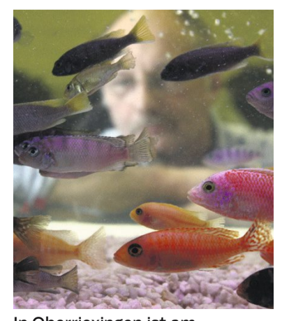
In Oberriexingen ist am 3. März wieder Fisch- und Pflanzenbörse.

www.kleintierzuchtverein-oberriexingen.de