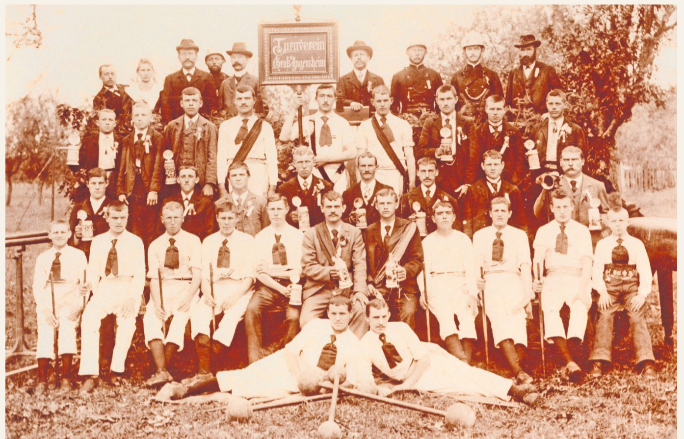
Das Stiftungsfest des Turnvereins Ingersheim wurde am 1. Juli 1900 fotografisch verewigt, ein Jahr nach der Gründung am 1. Juli 1899.

Der Turnverein Ingersheim feiert sein 125-jähriges Bestehen in der SKV-Halle.