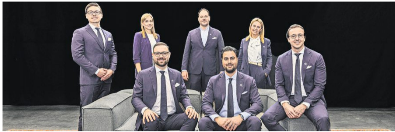
Das Kompetenzteam von Weitblick Immobilien ist Ihr idealer Partner für den Immobilienverkauf.

Andererseits kann die Beauftragung eines erfahrenen Maklers