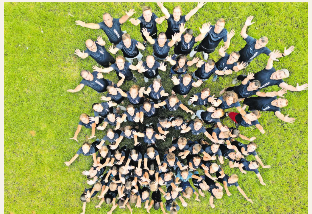
Heutzutage locker und mit viel Spaß dabei: Gruppenfoto der Geräteturnerinnen und Geräteturner.