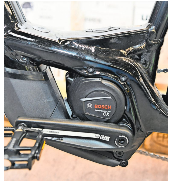
Leistungsstarker E-Motor: ein neuer Bosch-Antrieb mit 750 Wattstunden.

Info Die Saisonöffnung bei Wallner Zweiräder in der Bissingen Carl-Benz-Straße 24 ist am Freitag von 9 Uhr bis 18.30 Uhr und am Samstag von 9 Uhr bis 16 Uhr.