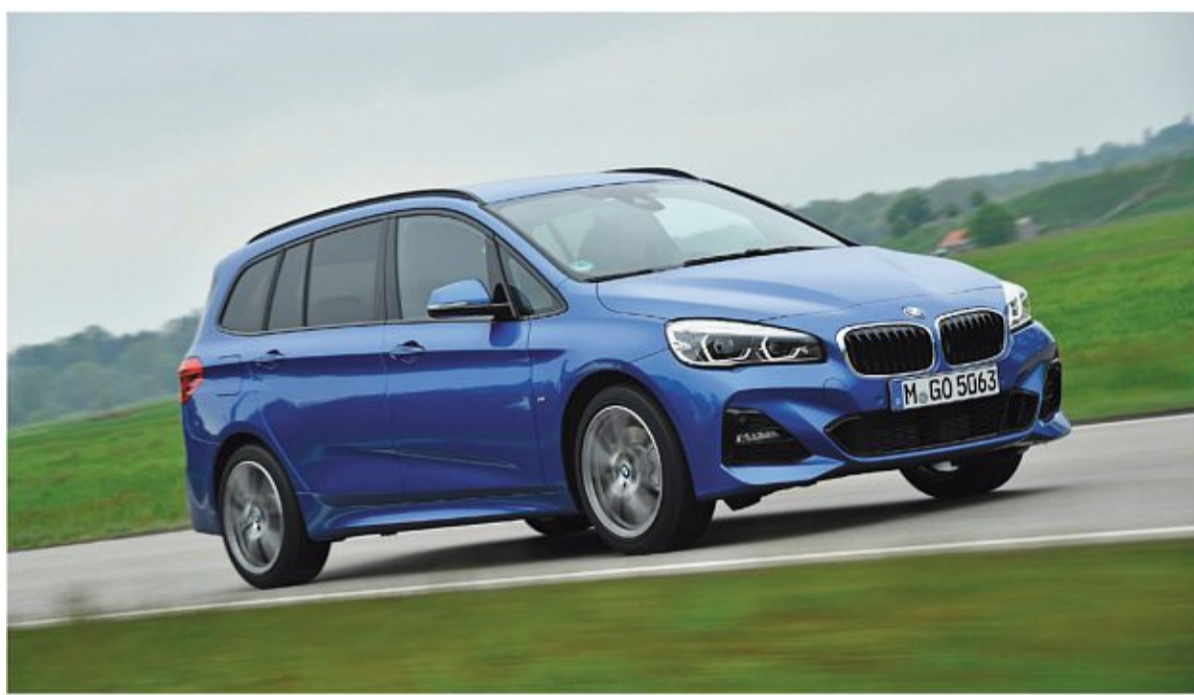
Mit dem Active- und dem GranTourer stieg BMW ins Segment der Kompaktvans ein.

In seinen Abmessungen gibt sich der Van kompakt: Laut ADAC ist die erste Generation 4,34 Meter bis 4,57 Meter lang, 1,80 Meter breit und 1,61 Meter hoch. Der Kofferraum bietet 468 Liter bis 1510 Liter Platz, beim Gran Tourer sind es 645 Liter bis 1905 Liter. Die zweite Generation ist dann nur geringfügig gewachsen: Sie ist 4,39 Meter lang, 1,82 Meter breit und 1,58 Meter hoch. Das