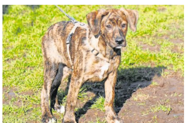
Hans braucht viel Auslauf und Beschäftigung.

Hunde: Henry, Hans und Harvey sind drei freche, zutrauliche Multimixwelpen (9/23 geb.), die Boxergröße erreichen. Sie brauchen aktive, sportliche Hundefreunde, die viel Zeit für die quirligen Frechdaxse haben. Eine sorgfältige, konsequente Ausbildung muss garantiert werden. Die Hundebilder brauchen vollen Familienanschluss sowie viel Auslauf