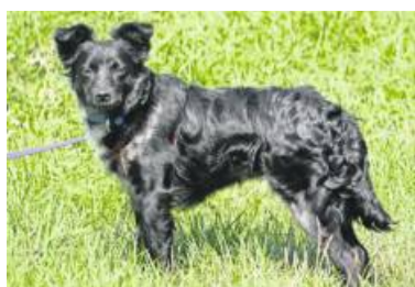
Hundedame Ulli braucht viel Beschäftigung.