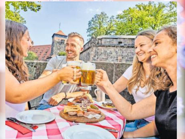
Im Biergarten fällt es leicht, Bekanntschaften zu machen und ins Gespräch zu kommen.

Restaurant in der Rommelmühle, Flößerstraße 60, 74321 Bietigheim-Bissingen, Telefon 0 71 42 / 9 93 84 90