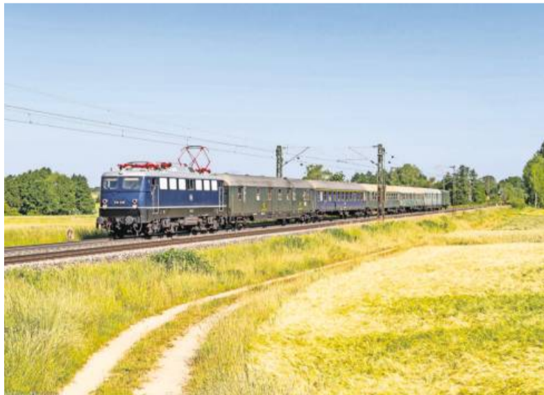
Die E-Lok 110 228 ist mit Baujahr 1961 heute 62 Jahre alt. Sie zieht den Zug.

Der Nostalgie-Sonderzug verkehrt über Ludwigsburg (12.18 Uhr), Bietigheim-Bissingen (12.26 Uhr), Vaihingen (12.38 Uhr), Mühlacker (12.46 Uhr) und fährt über Mannheim und Darmstadt durch das UNESCO-Welterbe Rheintal und befährt dieses bis Oberwesel. Vor Ort bieten sich verschiedene Aktivitäten. Höhepunkt ist das wohl bekannteste und größte Musikfeuerwerk der