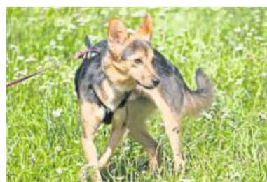
Rabbit liebt ausgiebige Spaziergänge.

geb.) wurden wegen Umzugs abgegeben. Sie sind beide sehr lieb, mögen sich sehr und möchten auch weiterhin zusammenbleiben und ein gemeinsames, neues Zuhause finden. Mavi und Bony zählen eher zu der Kategorie „Faulpelze“, sind also schon etwas ruhiger in ihrer Art und inzwischen auch relativ handzähm. bz