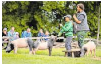
Auch (ehemalige) Haustiere gehören dazu.

Bad Mergentheim. Einer der artenreichsten Wildparks in Europa bietet auch in den Ferien ein abwechslungsreiches Programm für Jung und Alt sowie für die gesamte Familie. Über 70 Tierarten „sehen und erleben“ in naturnah gestalteten Freisichtanlagen heißt es auf mehr als 50 Hektar Fläche. Hier gibt es kaum Maschendraht, Käfige und Gitter – fast alle Gehege sind für eine freie Sicht mit kaum wahrnehmbaren Begrenzungen erbaut. Die Tiere können daher in ihrer natürlichen oder naturnahen Umgebung besonders gut beobachtet werden – man hat den ganzen Tag Zeit und die Aufenthaltsdauer wird nur durch die Öffnungszeiten begrenzt.