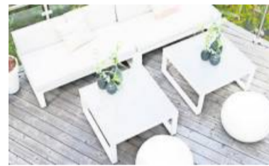
Natürlich schön und extrem robust: Echtholzdielen.

Eine besondere Variante mutet mit sichtbarem Astbild natürlich sowie rustikal an und fügt sich so gut in die umgebende Bepflanzung ein. In Sachen Pflegeleichtigkeit punkten Echtholzdielen ebenfalls, denn neben der herkömmlichen Reinigung benötigen sie keine zusätzliche Behandlung. Außerdem sind sie resistent gegen Fäulnis und Pilze.