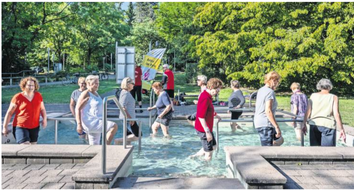
Auch Kneippen gehört zum Programm von „Aktiv im Park“.

Wer Interesse hat, kann einfach spontan vorbeikommen und unverbindlich bei diesem städtischen Angebot mitmachen. Eine