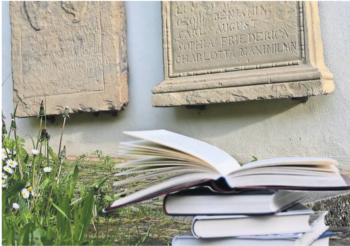
Ein besonderes Erlebnis sind die Lesungen unter freiem Himmel.

Zum Inhalt: Die Kindheit auf dem Gelände einer riesigen Psychiatrie und das Austauschjahr in Amerika liegen hinter ihm, die Schulzeit hat er überstanden, als vor dem Antritt des Zivildienstes das Unerwartete geschieht: Joa-