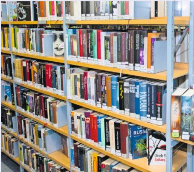
Die Zweigstelle der Bücherei in Bissingen macht Ferien.