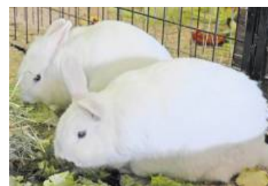
Die Geschwister Mavi und Bony wollen zusammenbleiben.