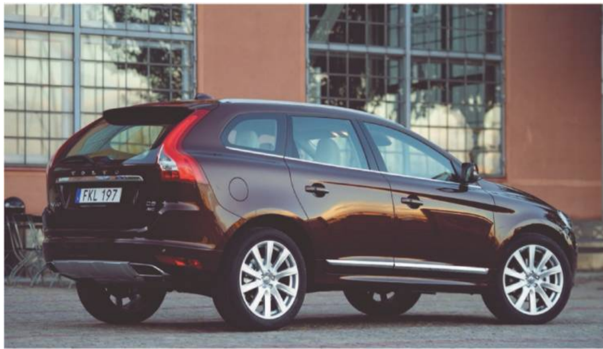
Als Gebrauchtwagen macht der XC60 bei der HU oft eine gute Figur

Zu den Stärken des Schweden zählt die Materialanmutung und fortschrittliche Sicherheitstechnik. „Fast alle Baugruppen sind