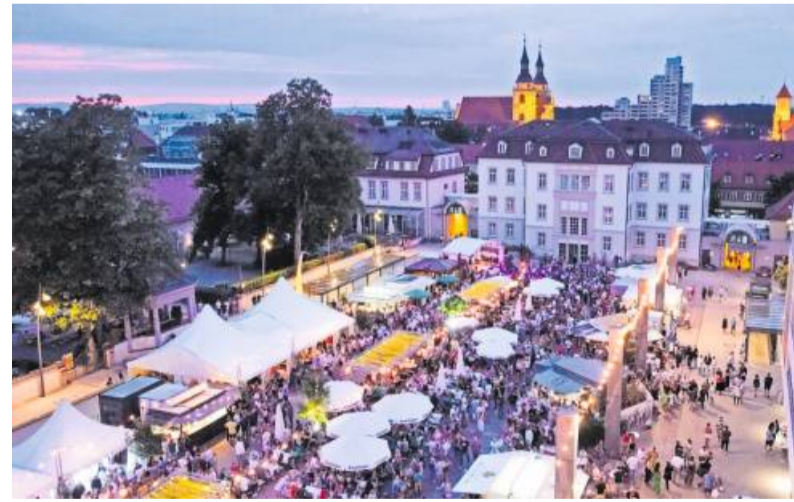
Der Rathausplatz verwandelt sich ab dem 10. August wieder in die Ludwigsburger Weinlaube.

Elegant mit unverwechselbarem Flair – so präsentiert sich vom 10. bis zum 26. August die Ludwigsburger Weinlaube auf dem Rathausplatz getreu dem Motto: „Man sieht sich. Man trifft sich.“ Neben allerlei schwäbischen Köstlichkeiten wird den Besucherinnen und Besuchern abwechslungsreiche Livemusik geboten. Die Ludwigsburger Weinlaube verwöhnt die Besucher auf Top-Niveau mit vielen köstlichen Gerichten – von fangfrischen Austern, über Wildspezialitäten aus der herzoglichen Jagd bis hin zu hausgemachtem Zwiebelkuchen. Dazu gibt es hochkarätige regionale und internationale Weine. Für die Bewirtung der Gäste zeichnen auch diesmal wieder „Die Post Cantz“, „Harald A. Neises“ und „Seybold's Fischhalle“ verantwortlich. „Auf der Speisekarte finden sich neben den Klassikern ofenfrischer Weinlauben-Fleischkäse und dem Weinlauben-