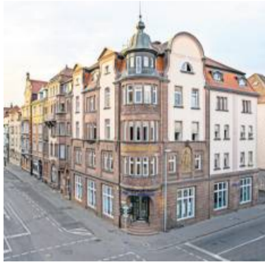
Ihre Immobilienexperten im Landkreis Ludwigsburg sind für Sie da.

Der aktuelle Vorsorgereport eines Lebensversicherungskonzerns zeigt, dass immer mehr Deutsche ihre Altersvorsorge selbst in die Hand nehmen und vermehrt auf Immobilien als Anlageform setzen. Dieser Trend spiegelt sich vor allem in der jüngeren Generation wider, die verstärkt in Immobilien investiert. Doch während eine Immobilie als Vorsorgelösung immer beliebter wird, sind auch Herausforderungen zu bewältigen, um eine nachhaltige und ausgewogene Altersvorsorge zu gewährleisten.