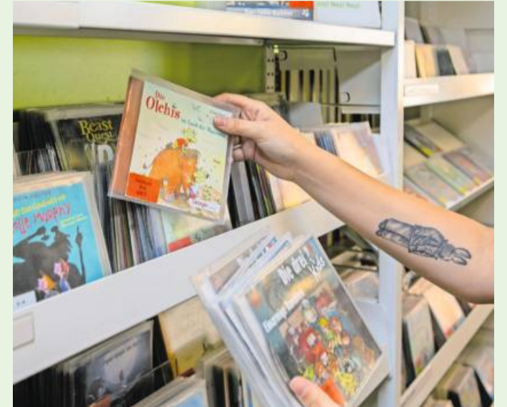
Die Otto-Rombach-Bücherei hat während der Ferienzeit geöffnet.