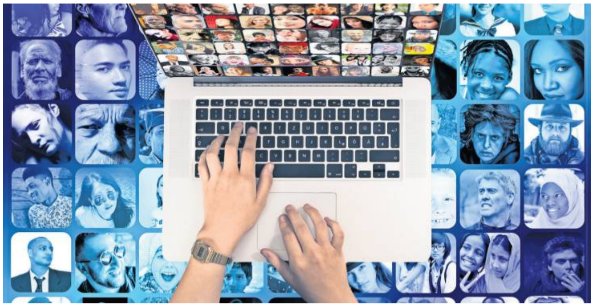
Digitale und gesellschaftliche Vernetzungen sind Kursthemen im neuen vhs-Programm.

Klimaschutz und Nachhaltigkeit bleiben im vhs-Programm aktuelle Themen, zum Beispiel im Workshop „Kleimmöbel upcyceln“. Erstaunliches aus der Tier-