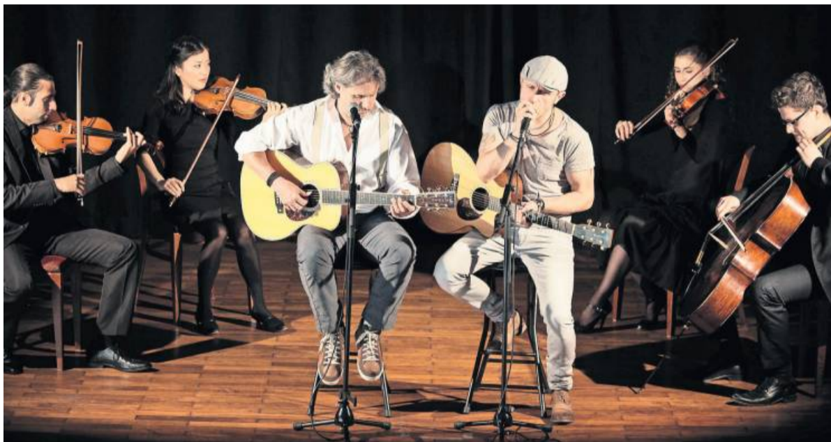
Das Duo Graceland präsentiert die größten Hits von Simon & Garfunkel.

Am Samstag, 12. August 2023, erwartet die Besucher ein besonderes musikalisches Erlebnis, wenn das Duo „Graceland“ mit ihrem Programm „Simon & Garfunkel Tribute meets Classic“ auf die Bühne kommt. Mit ihren Interpretationen der schönsten Klassiker von Simon & Garfunkel, darunter Hits wie „Sound of Silence“ und „Bridge over Troubled