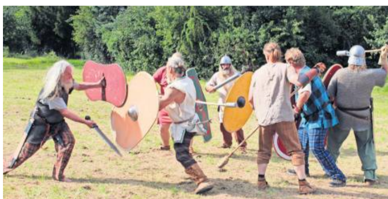
Kelten, Römer und Alamannen kehren am ersten Augustwochenende zurück nach Asperg und zeigen Schaukämpfe.

Vorfürhungen historischen Handwerks wie Brettchenweben, Schmiedekunst, Schuhhandwerk, Färben mit Naturmaterialien und Salzsieden erwartet die Besucher. Auch Schaukämpfe gehören zum Programm. Eine Modenschau erklärt die verschiedenen Gewan-