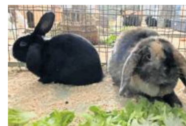
Nicky und Krümel suchen gemeinsam ein neues Gehege.