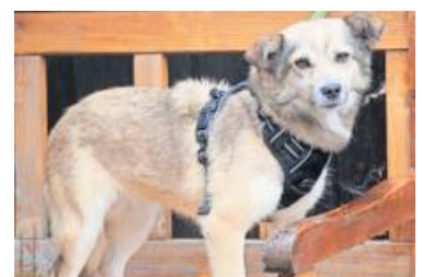
Feli kommt mit Artgenossen sehr gut zurecht.