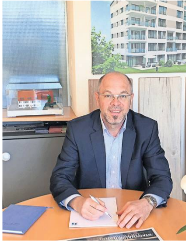
Der Expertentipp von Sven Heuschele, Heuschele Immobilien.

• Das zu versteuernde jährliche Haushaltseinkommen darf die Grenze von maximal 60 000 Euro bei einem Kind, zuzüglich 10 000 Euro je weiterem Kind, nicht überschreiten.