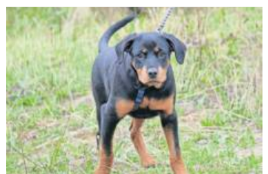
Parker braucht viel Beschäftigung.

Kleintiere: Kaninchendame Nicky (kast., 1/2022 geb.) und ihr Sohn Krümel (kast., 1/2023 geb.) harmonieren nach der Kastration sehr gut miteinander und suchen nun gemeinsam ein neues Gehege, das artgerecht eingerichtet ist. Beide Kaninchen sind zutraulich und vor allem sehr neugierig. bz