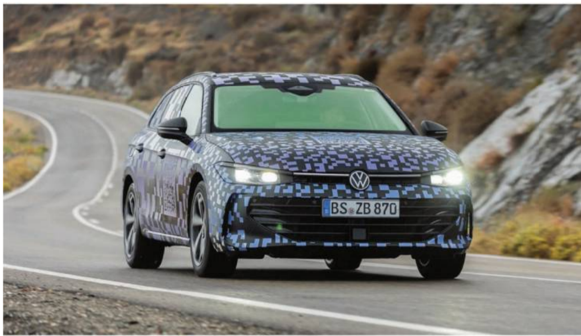
Das Fahrwerk des Passat bietet einen hohen Langstreckenkomfort.

Obwohl vom Design unter der Tarnfolie noch nicht viel zu erkennen ist, macht die neunte Generation des Passat schon als Prototyp einen buchstäblich großen Eindruck. Denn um seinem Ruf als Raumwunder gerecht zu werden, teilt sich die Neuaufgabe ihre Plattform künftig mit dem dann ebenfalls neuen Skoda Superb und streckt sich auf 4,92 Meter. 14 Zentimeter mehr Länge und fünf Zentimeter mehr Radstand – das heißt mehr Platz für die Hinterbänker und für die Koffer: Um 40 auf 690 Liter wächst der Stauraum hinter der Rückbank. Es sind aber nicht nur die großen Dinge, die Eindruck machen, sondern vor allem die vielen Kleinigkeiten, im Innenraum: Weil VW aus den Fehlern beim Golf und den ID-Modellen gelernt hat, ist zum Beispiel die Sliderleiste