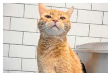
Garfield und sein Freund Smokey suchen ein ruhiges Zuhause.