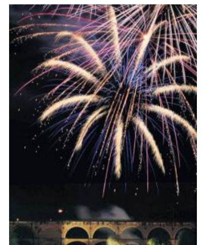
Kein Lichterzauber überm Viadukt mehr.

Bietigheimer Pferdemarkt geben. Für das nächste Jahr werden Anbieter und Möglichkeiten zur Durchführung einer Lichtshow weiter geprüft. Wenn eine gute Lösung zu verträglichen Kosten gefunden werden kann, wird der Gemeinderat darüber erneut beraten. bz