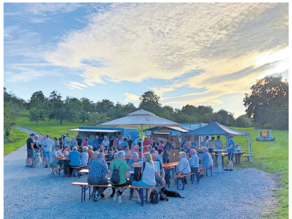
Die idyllische Landschaft mit Weinbergen und Wiesen rund um das Kleiningersheimer Schloss ist die perfekte Kulisse für die Weinwanderung.

An den Probierständen werden neben verschiedenen Weinen