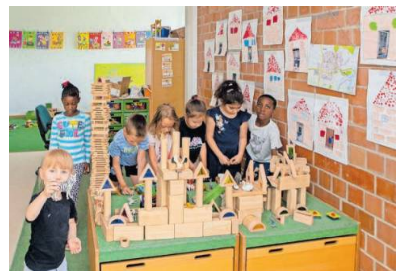
Alle Kinder werden individuell gefördert.