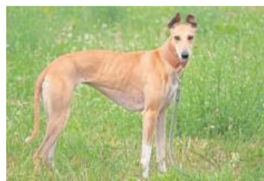
Dascha liebt ausgiebige Spaziergänge.

Marcello (kast., 12/2022 geb.) haben sich im Tierheim angefreundet und suchen nun gemeinsam ein schönes Zuhause. Sie sind noch sehr jung und neugierig, brauchen viel Auslauf und täglich Frischfutter. Die Beiden stehen stellvertretend für über zehn weitere junge, männliche Meerschweinchen, die auf ein neues Zuhause warten. bz