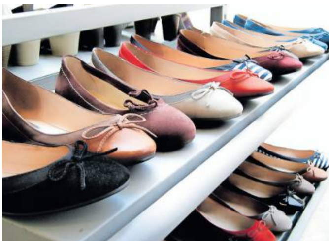
Viele Einzelhändler und Ketten starten nun wieder in den Saisonverkauf. Kunden können hier Schnäppchen machen.

Kunden können daraus ihren Vorteil ziehen: Gibt es in einem Geschäft keine reduzierten Artikel mehr oder ist das Gewünschte nicht dabei, finden sich immer noch genug andere Geschäfte, in denen man die Ware der letzten Saison zu günstigen Prei-