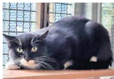
Olga sucht ein neues Heim bei katzenereifere Menschen.