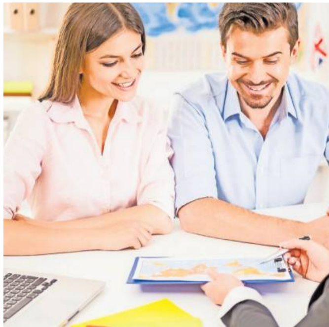
Bevor man sich für einen Reiseanbieter entscheidet, sollte man sich über verschiedene Angebote informieren.

Noch praktischer ist es, wenn Bekannte aus dem Familien- und Freundeskreis Emp-