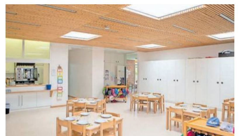
Das Mittagessen wird gemeinsam eingenommen.