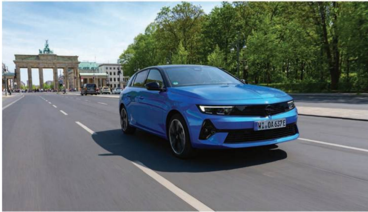
Selbst als Electric bleibt sich der Opel Astra bei der Form treu.

Dazu bietet der Astra alle gängigen Assistenten. Er kann jetzt – wie meist nur die Oberklasse – auch auf Fingerzeig überholen.