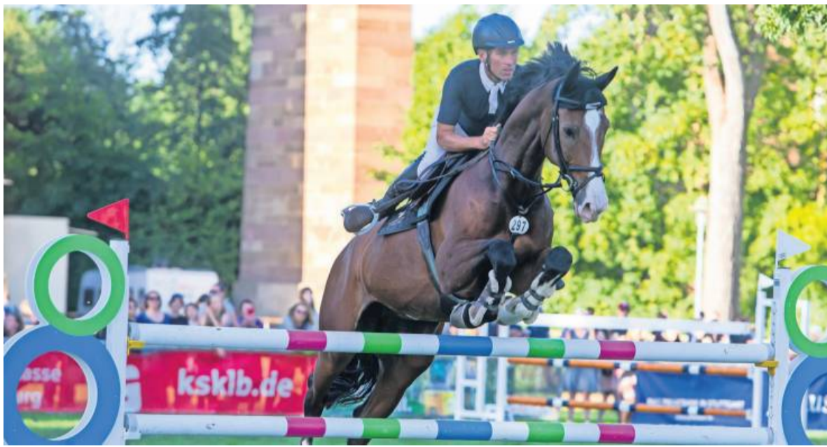
Das Reit- und Springturnier ist sehr beliebt beim Publikum.

Beim großen Reit- und Springturnier des Reitvereins Bietigheim-Bissingen kommen Freunde des Pferdesports voll auf ihre Kosten. Die Geschicklichkeit von