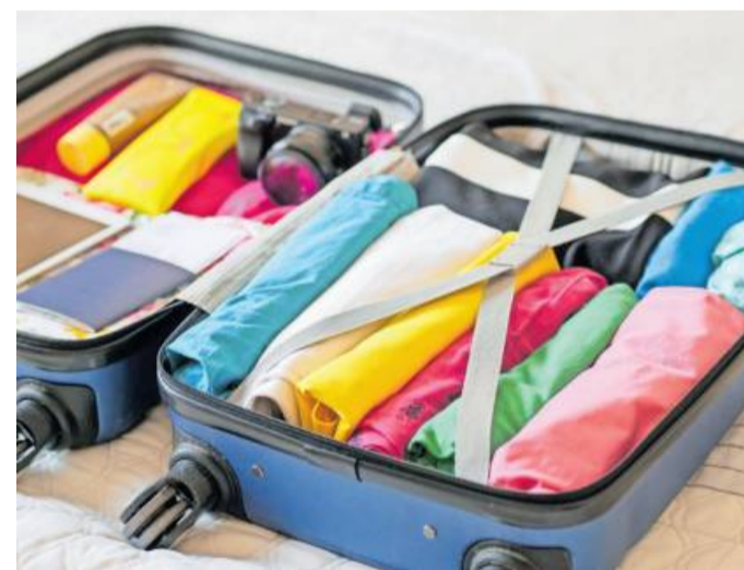
Beim Packen des Koffers verschaffen einfache Packregeln mehr Platz.

Für einen zweiwöchigen Urlaub empfehlen Experten einen klassischen Urtaubskoffer der Größe L. Koffer dieser Größe bieten meistens genügend Stauraum für die Zeit. Zusätzlich kann man beim Packen einige Tricks berücksichtigen, um die gewünschte Kleidung für den Urlaub unterzubringen.