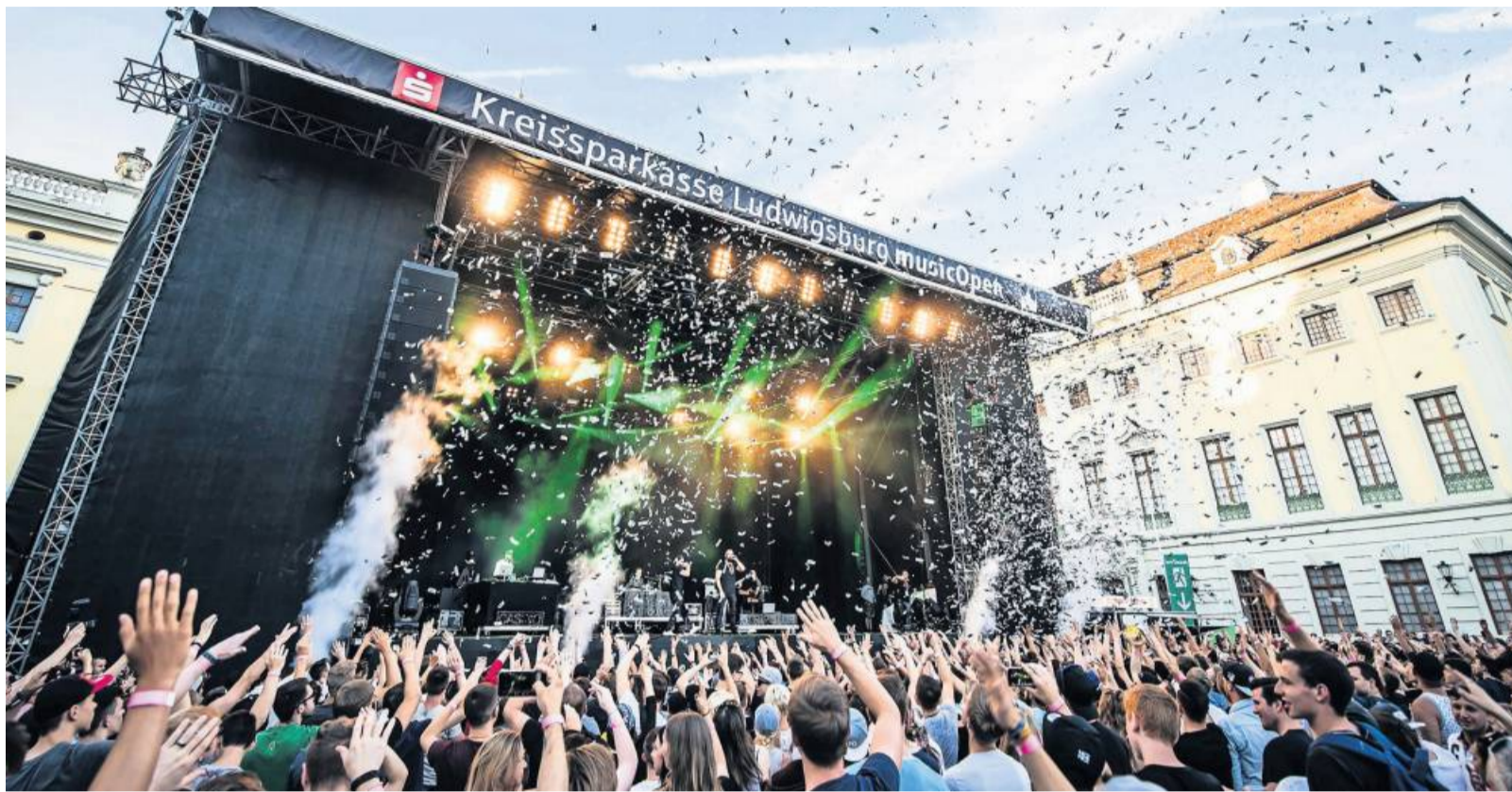
Die KSK Music Open geht in die elfte Runde und startet am 29. Juli 2023.

An gleich zwei Orten verwandelt sich das Residenzschloss in der zweiten Jahreshälfte in eine