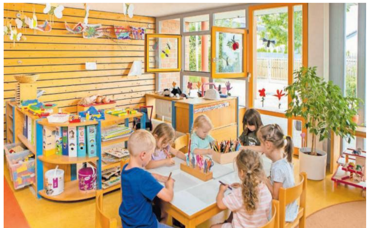
Miteinander spielen, malen und basteln gehört zum pädagogischen Programm und ist sehr wichtig für die Entwicklung der Kinder.

Zu den Höhepunkten des Jubiläumsfests gehören die Aufführung der Kinder des Kinderhauses und ab 13 Uhr Zaubervorstellungen. Für die Kinder selbst bieten Hüpfburg, Kinderschminken, Dosen werfen, Tattoos und Farbschleuder viel Abwechslung. In einer Fotobox kann die ganze Familie ein Erinnerungsfoto machen lassen. Ein Food Truck sorgt für den kleinen Hunger. Kaffee und Kleingebäck und natürlich Popcorn sind ebenfalls im Angebot.