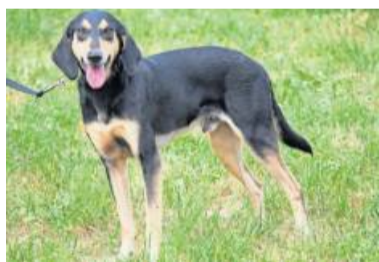
Leon braucht viel Auslauf und Beschäftigung.