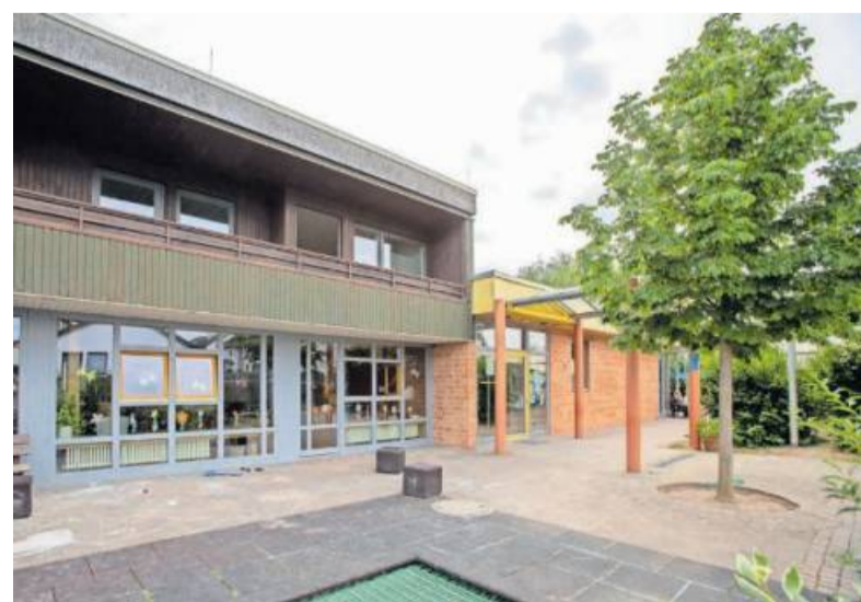
Das Kinderhaus in der Uhlandstraße.