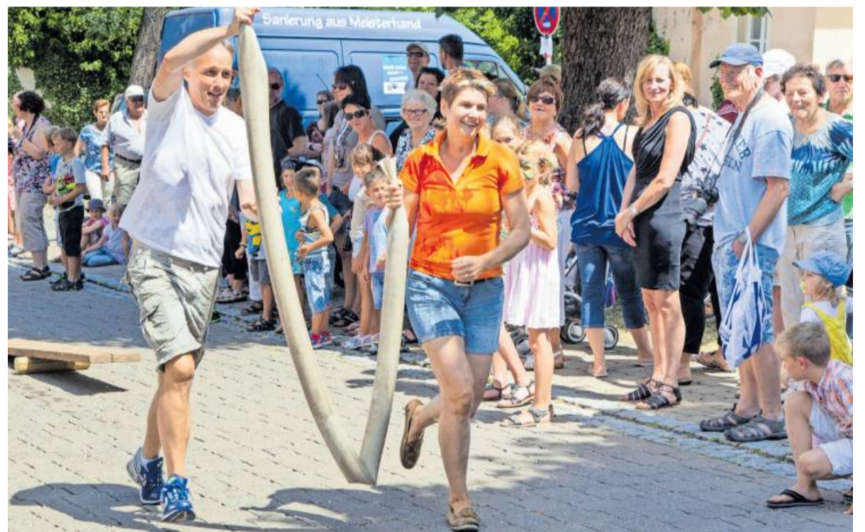
2015 gab es eine Jux-Olympiade, die für sichtlich viel Vergnügen bei den Teilnehmerinnen und Teilnehmern sorgte.

E&P - Ihr Fliesenleger Seestraße 37 74392 Freudental