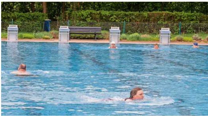
Im Bönningheimer Freibad wagten sich schon die ersten Badegäste ins Wasser.

Den Anfang machten am 1. Mai bereits der Badepark Ellental in Bietigheim-Bissingen und das Mineralfreibad in Bönningheim. Außerhalb des Landkreises Ludwigsburg haben auch schon Oberstenfeld und Steinheim ihre Freibäder am Feiertag eröffnet.