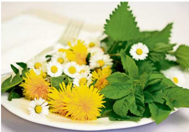
Alles über heimische Wildkräuter erfährt man beim Kräuterspaziergang in Hofen.

Am Sonntag, 7. Mai 2023 um 9.30 Uhr findet eine Fototour durch die Altstadt unter dem Motto „Mit der Kamera die Besonderheiten neu entdecken“ statt. Vorkenntnisse im Fotografieren sind nicht notwendig. Egal ob mit dem Foto oder der Handycamera, Herbert Kruger begleitet die Teilnehmenden mit wertvollen Tipps bei dieser interessanten Tour. Eine Entdeckungsreise, die durch das Objektiv betrachtet zu den schönsten Motiven der Stadt