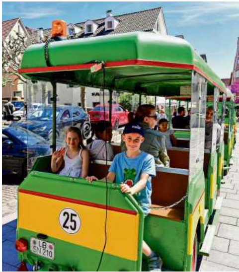
Das traditionelle Messezüge sorgte nicht nur bei den kleinen Besucherinnen und Besuchern für viel Spaß.

Impressionen der 15. AutoMobil Messe aus dem vergangenen Jahr.