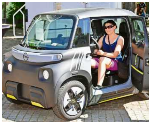
Innovation muss nicht immer groß sein: Der Kleine hier passt in jede Parklücke.