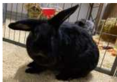
Nera sucht einen neuen Weggefährtin, gern im Außengehege.