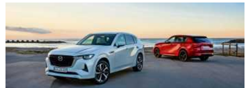
Der neue Mazda CX-60 mit e-Skyactiv D Dieselmotor.

Hinzu kommt der perfekte Massenausgleich und die daraus resultierende vibrationsarme Laufkultur, die der Reihensechszylinder seiner Bauweise verdankt; gleichzeitig liefert er einen klaren, einnehmenden Motorsound. Das hohe Drehmoment ermöglicht eine hohe Anhängellast von 2500 kg. Das Gewicht des neuen Motors liegt aufgrund der vergleichsweise einfachen Struktur eines Reihensechszylinders auf dem gleichen Niveau wie das des 2,2-Liter-Vierzylinder-Dieselmotors Skyactiv D. bz