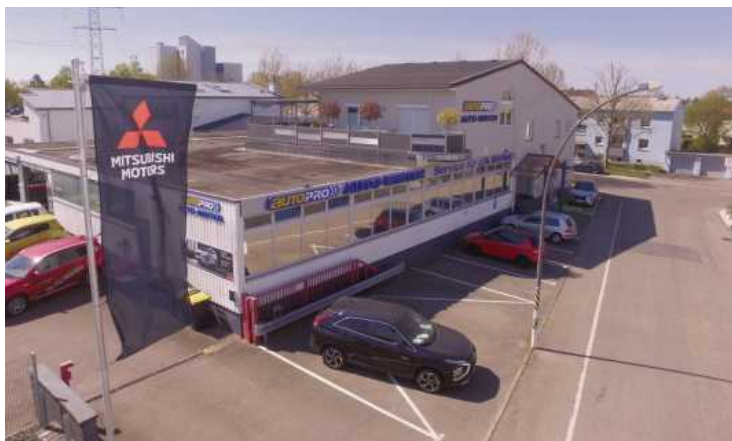
Das Autohaus Winter in Asperg ist der Experte für alle Modelle der Marke Mitsubishi und – ganz neu – der Marken DFSK und BAIC.