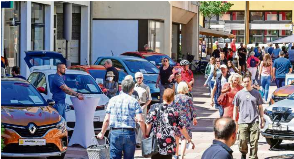
Die AutoMobil Messe zog im vergangenen Jahr wieder viele Menschen in die Bietigheimer Innenstadt.