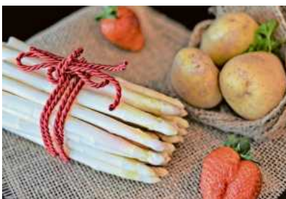
Dünne Spargelstangen mit Verfärbungen der Klasse II schonen den Geldbeutel, aber schmecken genauso gut wie Spargel der Extraklasse.

Die bekannteste Unterscheidung liegt zwischen Handelsklasse I und II. Dabei unterteilt man die Klasse I noch mal in Stangen mit einer Breite über 16 Millimeter und in Stangen zwischen zehn und 16 Millimeter. Die Mindestanforderung an die Länge beträgt zwölf Zentimeter. In Klasse I muss der Spargel einen festen und geschlossenen Kopf haben. Dafür sind leichte Verfärbungen und ein geringes Abweichen vom ge-