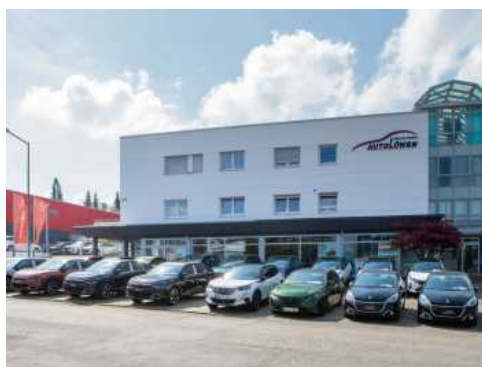
Die Peugeot-Citroën-Filiale vom Autohaus Autolöwen in Ludwigsburg in der Teinacher Straße.

Zum Angebot gehört eine große Auswahl an Neu-, Jahres- und Gebrauchtwagen, Nutzfahrzeugen sowie sämtliche Werkstatt- und Serviceleistungen. „Die Stellantis-Gruppe gilt, was die Elektromobilität angeht, als Vorreiter.“ Davon könne man sich selbst überzeugen bei den E-Fahrzeugen wie zum Beispiel den Citroën e-C4, e-Berlingo, Peugeot e208, e-Rifter, e2008, Opel e-Combo,