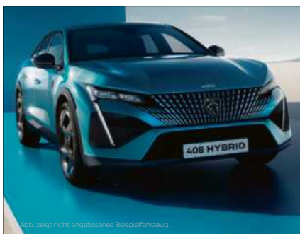
Abb. zeigt nicht angebotenes Beispielfahrzeug.