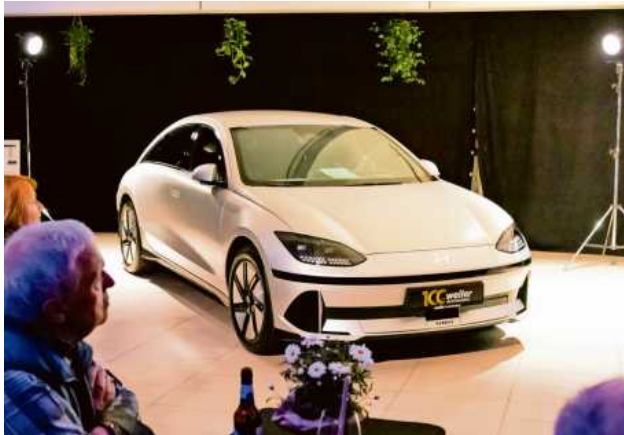
Der neue vollelektrische IONIQ 6 ist innovativ und vielseitig.

Obendrein kam die Kulinarik nicht zu kurz. Die Gäste wurden mit asiatischen Leckerbissen aus schwäbischer