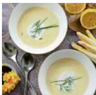
Ein Schuss (Hafer-)Sahne verfeinert die Spargelcremesuppe.

Bei der Vielzahl an Rezepten finden auch Veganer etwas Gutes. Statt der Milchprodukte macht Mandelmilch die Spargelcremesuppe zu einem schmackhaften Erlebnis. lps/ms