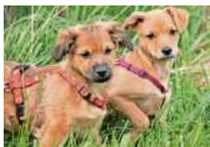
Die Pinschermixwelpen Drago und Ginny sind unternehmungslustig.