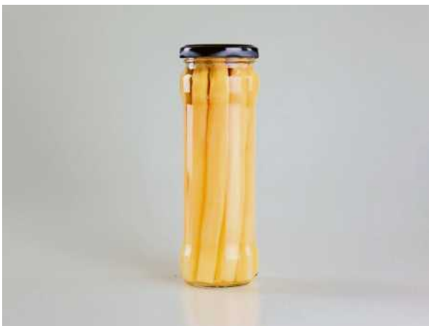
Spargel aus dem Glas ist lange haltbar und spart viel Zeit. Man kann Spargel auch selbst länger haltbar machen.

Das Grundrezept für die Flüssigkeit enthält nur Weißweinessig, Zucker und