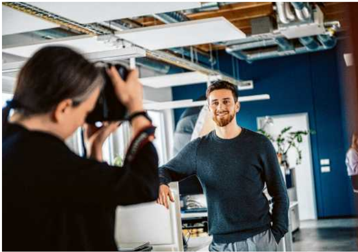
Freude auf den neuen Lebensabschnitt: Ein Bewerbungsbild sollte Souveränität und Offenheit vermitteln. Für ein professionelles Foto muss man etwas Zeit aufwenden.