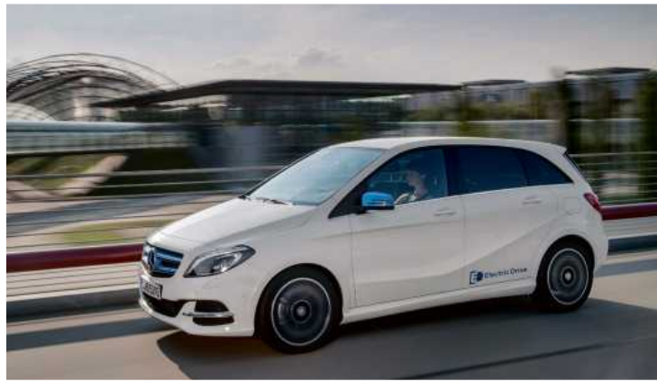
Gebrauchte Mercedes B-Klassen finden mit nahezu allen Antriebsversionen.

Bei den Abmessungen ist die B-Klasse laut ADAC im Laufe der Zeit zumindest in der Länge gewachsen. In der 2. Generation gibt es Platz auf 4,36 Metern bis 4,39 Metern Länge, 1,77 Metern bis 1,81 Metern Breite und 1,56 Metern bis 1,60 Metern Höhe. Das Kofferraumvolumen bietet Stauraum von 488 Litern bis 1547 Litern, beim Erdgas- (NGT) und Elektro-Modell (Electric Drive / 250 e) sind es 501 Liter bis 1456 Liter Kofferraumvolumen. Die 3. Generation ist dann bis zu 4,42 Metern lang, bis 1,80 Meter