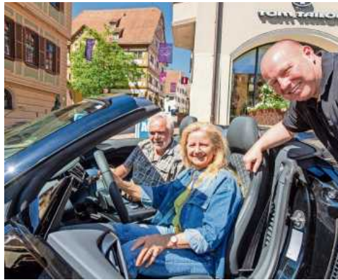
In der Fußgängerzone gab es auch Cabriolets zu bestaunen – probefahren war ausdrücklich erlaubt.