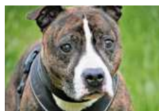
Ilou ist freundlich und schlau.

Kleintiere: Häsin Nera (wird kastriert, 2021 geb.) lebte bisher in einer Wohnung, kann aber an Außenhaltung gewöhnt werden. Sie ist sehr freundlich, neugierig und menschenbezogen. Gern wird sie an einen bereits vorhandenen kastrierten und gut sozialisierten Rammeler abgegeben, der Nera als neue Weggefährtin auch akzeptieren würde. bz