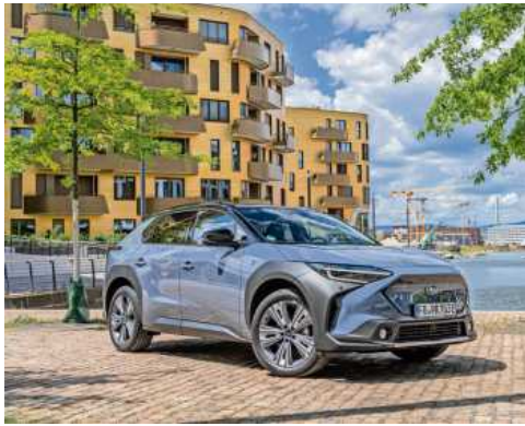
Der neue Subaru Solterra ist ab sofort beim Autohaus Klein verfügbar.

Die innovative Technik ist Teil der umfassenden Serienausstattung. Bereits in der Einstiegsversion wartet das sportlich-elegante Elektro-SUV mit aerodynamischen 18-Zoll-Leichtmetallfelgen, automatisch ankloppenden