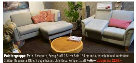
Polstergruppe Polo, Federkern, Bezug Stoff 2 Sitzer Sofa 154 cm mit Aufstehhilfe und Kopfstütze, 3 Sitzer Bogensofa 193 cm Bogenhocker, ohne Deco, komplett statt 4602,- Jubipreis 2299,-