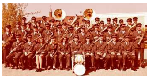
Jubiläumfoto aus dem Jahr 1973.