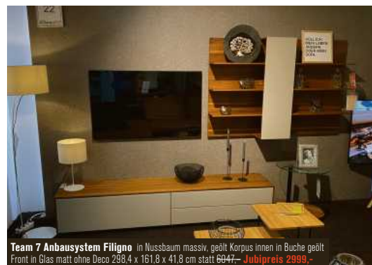
Team 7 Anbausystem Filigno in Nussbaum massiv, geölt Korpus Innen in Buche geölt Front in Glas matt ohne Deco 298,4 x 161,8 x 41,8 cm statt 6947,- Jubipreis 2999,-