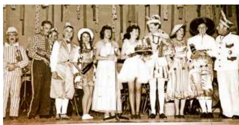
Beim Fasching 1956 ging es lustig zu.