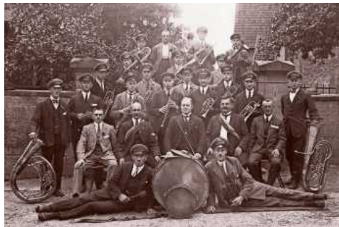
Foto anlässlich des Stiftungsfestes 1925.