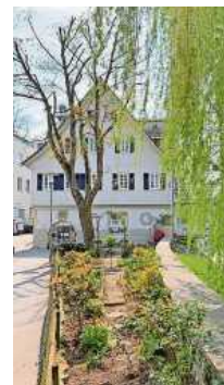
Die Vaihinger Mühle bietet Mehl aus regionalem Getreide und alles rund ums Backen.

Vollkornschrote bei der Vaihinger Mühle mehr als nur Grundnahrungsmittel. Vollwertig und ballaststoffreich, ermöglicht die gute Backqualität der Mahlerzeugnisse ein ausgewogenes und schmackhaftes Backergebnis.