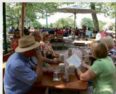
Auch im Biergarten sollte man auf die Nachbarn Rücksicht nehmen.

Dieselbe Vorsicht gilt beim Umstellen der Tische: Wer mehr als einen Tisch benötigt, sollte das Personal bitten, die Garnituren zusammen rücken zu dürfen. Denn der Service kennt seine Laufrichtung, die Tischnummern zum Abkassieren sowie die Fluchtwege für den Notfall. Anders ist es wiederum beim Aufräumen: In Bayern wird beispielsweise der Maßkrug vom Personal oft bereits abgeräumt, wenn noch ein kleiner Rest drin ist – das gilt als Sitte. Anderorts wird noch gewartet, bis man ausge-trunken hat. Hat man Pfand für das Maß bezahlt, dann sollte man es selbst abgeben, wenn man das Pfandgeld zurückhaben möchte. lps/NaD.