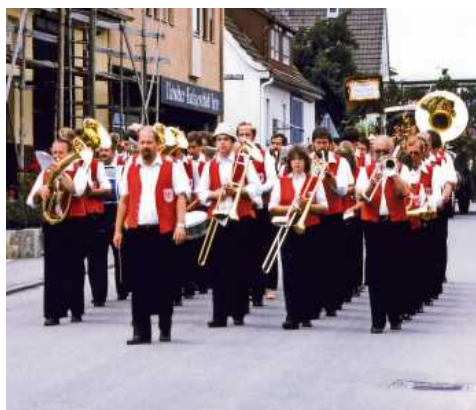
Festzug zum 60. Jubiläum 1983.