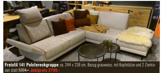
Freistil 141 Polstereckgruppe ca. 244 x 238 cm, Bezug grauweiße, mit Kopfstütze und 2 Zierkissen statt 5294,- Jubipreis 2799,-

* Gültig vom 27.3. - 29.4.23. Nicht auszahbar, sondern nur mit einem Einkauf verrechenbar. Sofortabzug im Aktionszeitraum. Nicht gültig für laufende Aufträge, reduzierte und beworbene Produkte, Lebensmittel, Events und Dienstleistungen. Bei Lager - und Ausstellungsware solange Vorrat reicht. Zwischenverkauf vorbehalten. Alle Preise sind Abholpreise. Lieferung und Montage gerne gegen Aufpreis möglich. Aktion und Rabatte nicht kombinierbar.