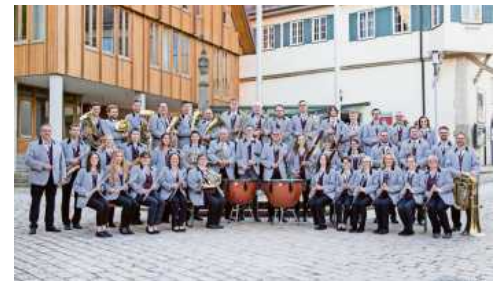
Das Blasorchester im Jahr 2023.