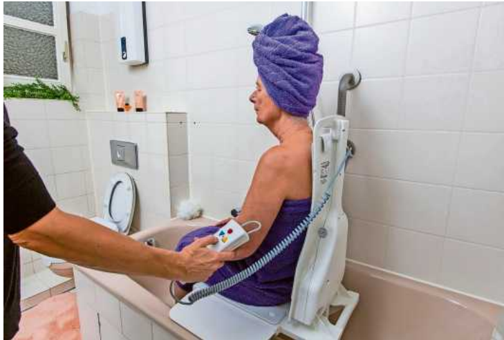
Die selbstständige Körperpflege wird durch Liftsysteme erleichtert.

Im Alter ändern sich die persönlichen Bedürfnisse und haben Auswirkungen auf das Wohnen im eigenen Haushalt.