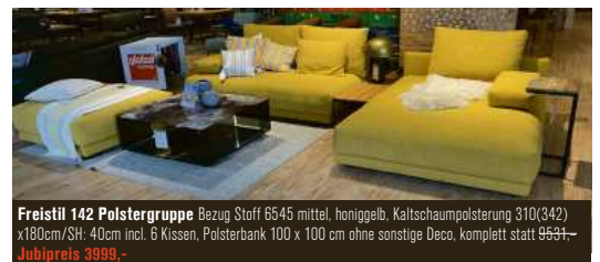
Freistil 142 Polstergruppe Bezug Stoff 6545 mittel, honiggelb, Kaltschaumpolsterung 310(342) x 180cm/SH: 40cm incl. 6 Kissen, Polsterbank 100 x 100 cm ohne sonstige Deco, komplett statt 9531,- Jubipreis 3999,-