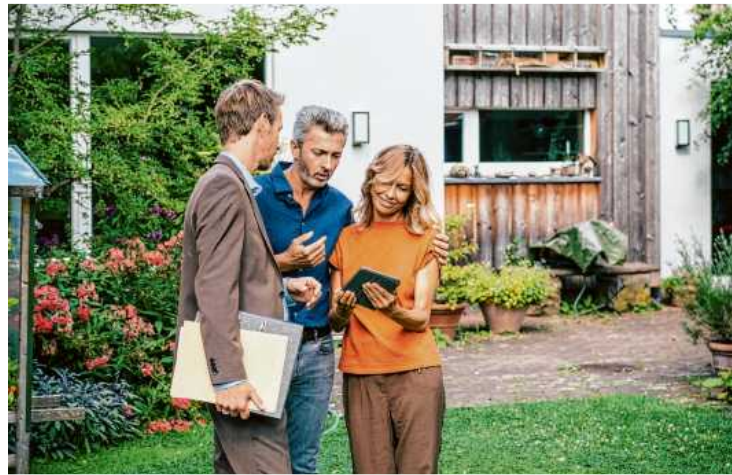
Unterstützung für Bauherren: Mit einer guten Energieberatung im Rücken, können Hauseigentümer selbstbewusst bei der Auftragsvergabe gegenüber Fachfirmen auftreten.

Für die energetische Sanierung hingegen müssen oft besondere bauliche Anforderungen erfüllt werden, die der Berater plant und begleitet. „Das gilt zum Beispiel