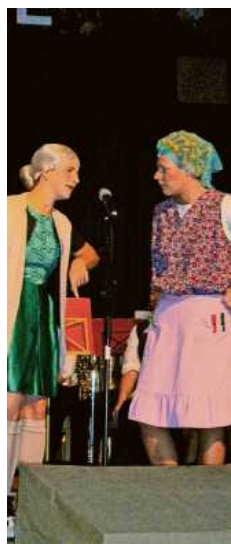
Die Tratschweiber hatten es bei der Kirbe 2007 wichtig.