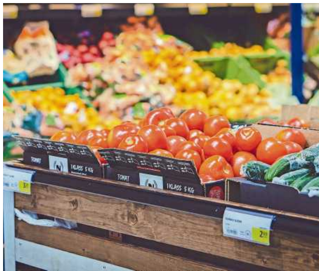
lps/mv. Die große Auswahl im Supermarkt kann oft verführerisch sein.

Da man bei der Anzahl der vielen verschiedenen Lebens-