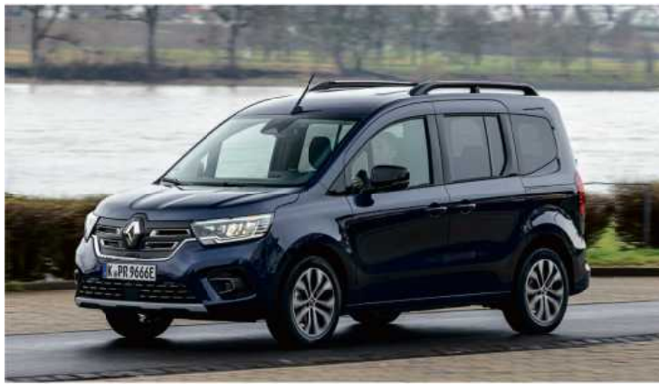
Weil er innen viel Platz bietet, ist der Renault Kangoo besonders bei Familien beliebt.

In der Praxis allerdings hängt die Reichweite sehr vom Einsatz ab: Während der Kangoo im Stadtverkehr reichlich Kilometer schafft, kommt er jenseits des Ortschafts nicht besonders weit. Denn mit seiner großen Stirnfläche erzeugt der Kastenwagen einen hohen Luftwiderstand. Was sich bei höherem Tempo stärker auswirkt und den Akku schnell in die Knie zwingt. Auch das ist ein Grund, weshalb das Spitzentempo auf 132 km/h begrenzt ist. Nicht nur der hohe Verbrauch in Kombination mit dem vergleichsweise kleinen Akku erweist sich als Schwäche, auch an der Ladesäule gibt der Kangoo nicht das beste Bild ab. Serienmäßig gibt es nur einen 11-kW-Lader