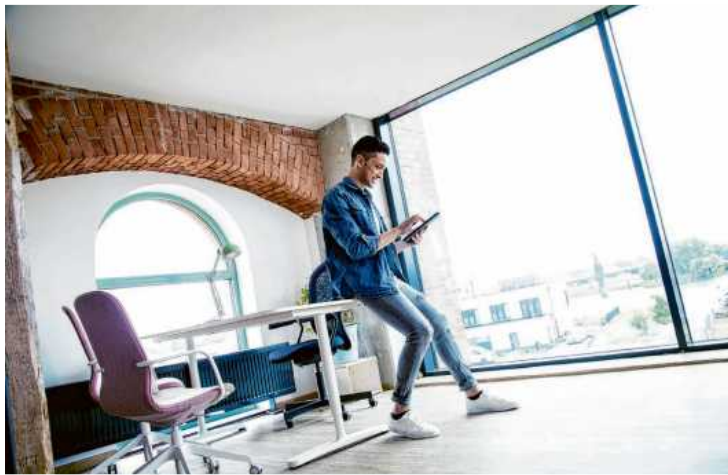
Kompetenzen, Wissen, Selbstvertrauen gewinnen: Nur wer bereit ist, sich auf Neues einzulassen, kann in der persönlichen und beruflichen Entwicklung auf Fortschritt hoffen.

Das beste Beispiel dafür, dass man an Herausforderungen wächst, sind Kinder. „Sie haben etwas, das vielen Erwachsenen verloren geht“, meint Becker. Denn sie wollen ständig ihren Ak-