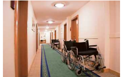
Service-Wohnungen sind immer barrierefrei.

Menschen, für die dieses Konzept infrage kommt, können ihren Alltag noch weitestgehend eigenständig bestreiten. Die Wohnungen sind allerdings barrierefrei konzipiert und einer Pflegeeinrichtung oder einer medizinischen Einrichtung angeschlossen. Sollte Hilfe benötigt werden, ist deshalb immer schnell jemand erreichbar. Für die Wohnung wird ein spezieller Vertrag abgeschlossen, in dem die genaue Bandbreite der jeweiligen Service-Leistungen festgehalten ist.