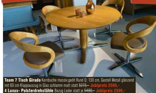
Team 7 Tisch Girado Kernbuche massiv, geölt Rund Q: 130 cm, Gestell Metall glänzend mit 60 cm Klappauszug in Glas schlamm matt statt 5279,- Jubipreis 2599,- 4 Luxus- Polsterdrehstühle Bezug Leder statt je 5490,- Jubipreis 2599,-

ALLE ANGEBOTE SIND EINMALIGE AUSSTELLUNGSSTÜCKE!