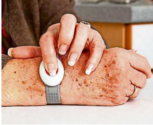
Ein Hausnotruf verschafft ein sicheres Gefühl.

Der Vorteil besteht darin, dass auf diesem Wege auch sofort Informationen über die Medikation weitergegeben werden können. Die Zentrale leitet alle weiteren Schritte