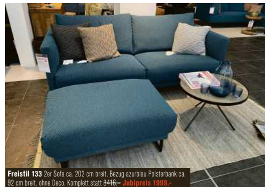
Freistil 133 2er Sofa ca. 202 cm breit, Bezug azurblau Polsterbank ca. 92 cm breit, ohne Deco. Komplett statt 3416,- Jubipreis 1999,-