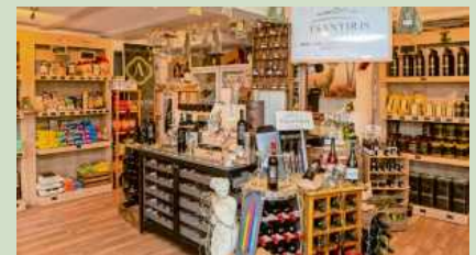
Das Feinkostgeschäft Ambrosia bietet griechische Erzeugnisse in Hülle und Fülle.

Das Fachgeschäft „Ambrosia“ bietet Feinkostprodukte in höchster Qualität.