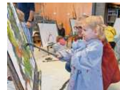
Auch in der Jugendkunstschule Labyrinth gilt der Familienpass.

Ein städtischer Familienpass wird, sofern die persönlichen Verhältnisse dies zulassen, für ein Kalenderjahr ausgestellt. Bei Vorliegen der Voraussetzungen können die Familienpässe um jeweils ein Kalenderjahr verlängert werden. Die Antragsstellung beziehungsweise Verlängerung muss bis spätestens 31. März des laufenden Jahres erfolgen, um die Vergünstigungen rückwirkend zum 1. Januar zu erhalten. Bei Neuausstellung eines städtischen Familienpasses werden die Vergünstigungen ab dem Ersten des Folgemonats gewährt.