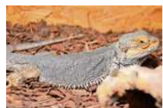
Jonny ist handzahn und sehr ruhig.

Kleintiere: Bartagame Jonny (2009 geb.) gehört zu der Art „Pogona Vitticeps“. Er ist handzahn, ein ruhiger Geselle, der sehr gemächlich durchs Terrarium zieht. Die Futtertiere lässt er sich auch gerne mal direkt vors Maul halten, anstatt selbst auf Jagd zu gehen. Jonny sucht ein neues Zuhause mit artgerecht eingerichtetem Terrarium. bz