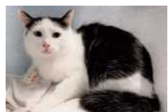
Kala braucht geduldige Zuwendung, um Vertrauen zu fassen.

Katzen: Die schüchterne Kätzin Kala (kast., 2020 geb.) braucht noch etwas Liebe und Geduld, bis sie genügend Vertrauen fasst und zur Schmuskatze wird. Mit anderen Katzen kommt sie sehr gut zurecht. Nach der Eingewöhnungszeit sollte die Möglichkeit auf Freigang in verkehrsberuhigtem Gebiet bestehen. Kätzin Arielle (8/2022 geb.) hatte bisher