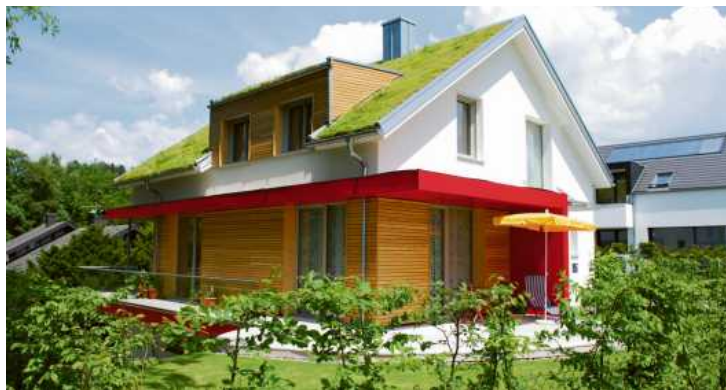
Dachbegrünung tut der Umwelt unheimlich gut.

Jedes Gründach besteht aus mehreren Schichten. Eine Lage Vlies trennt das Dach von der neuen Begrünung. Die zweite Schicht bildet eine wasserdichte Schutzfolie, auf die anschließend eine Speicherplatte gelegt wird. Diese wird mit einer Drainageschicht kombiniert, die einerseits das