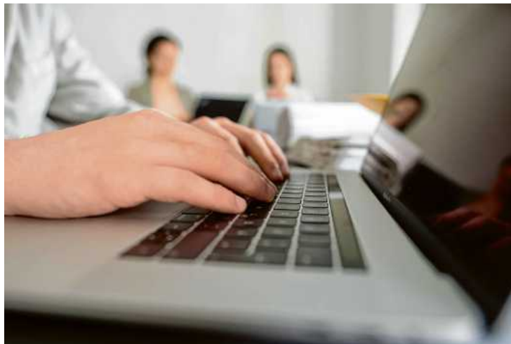
Im finalen Protokoll werden die Stichworte zu ganzen Sätzen formuliert.