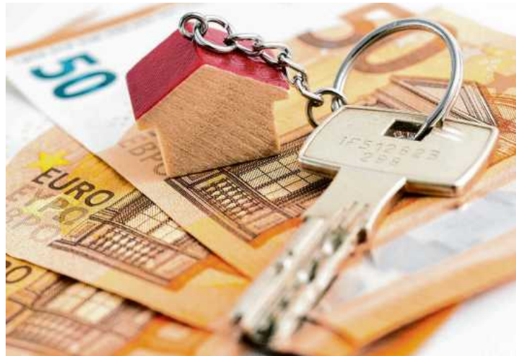
Spätestens mit der Übergabe der Wohnungsschlüssel ist häufig ein Teil der Kautionshöhe fällig. Der Betrag darf vom Mieter auch in bis zu drei Raten bezahlt werden. Zwingend vorgeschrieben ist eine Kautionshöhe nicht.

Nach dem Gesetz muss der Vermieter die ihm überlassene Kautionshöhe bei einem Kreditinstitut mit dreimonatiger Kündigungsfrist zu üblichen Zinsen anlegen. Andere Anlageformen können die Parteien vereinbaren, einzige Voraussetzung: Der Vermieter muss die Anlage vom Privatvermögen getrennt aufbewahren. Welche Art Konto er dafür wählt, bleibt