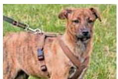
Sunny sucht eine Familie mit viel Zeit für ihn.

Hunde: Die Husky-Malamutemixhündin Cheetah (kast., 10 Monate alt) ist lebhaft und verspielt und sucht Hundefreunde, die sich mit nordischen Hunden auskennen, gerne ausgiebig spazieren gehen und einen eingezäunten Garten besitzen. Der Windhundmixrüde Sunny ist vier Monate alt, freundlich und zutraulich. Er sucht eine Familie, die viel Zeit für ihn hat.