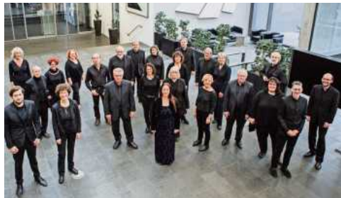
Kammerchor concerto vocale bietigheim präsentiert musikalisch die Passionsgeschichte.

Hauptwerk des Abends ist jeweils das „Via Crucis“ des Komponisten Franz Liszt. Die 14 Stationen des Kreuzweges sind von Liszt in einer großen stilistischen Bandbreite verortet: sowohl der Gregorianische Choral als auch das protestantische Kirchenlied, Choralsätze, die an Johann Sebastian Bach orientiert sind, und expressiv gesteigerte romantische Choralvariationen werden unter anderem verwendet. Besonders beeindruckend ist die bis an die Grenzen gehende spätromantische Harmonik, die die unterschiedli-