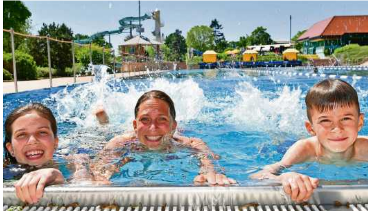
Mit dem Familienpass gibt es Ermäßigung auf die Saisonkarte im Badepark Ellental.

Die Familienpassinhaber erhalten folgende Ermäßigungen: 50 Prozent beim Besuch der Jugendkunstschule Labyrinth, der städtischen Musikschule, der Kindergärten und von städtischen Kul-