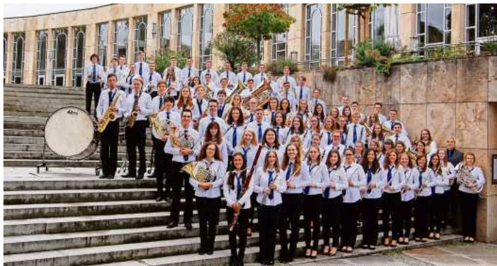
Die Musikerinnen und Musiker freuen sich auf ihren Auftritt.