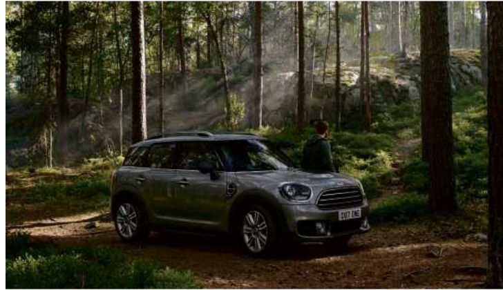
Ein echter Geländegänger ist der Countryman trotz möglichen Allradantriebs nicht.

Die Abmessungen betragen laut ADAC, in der 1. Generation: 4,10 Meter in der Länge bis 4,13 Meter, in der Breite 1,79 Meter und in der Höhe 1,55 bis 1,56 Meter. Der Kofferraum hatte ein Volumen von 350 bis 1170 Liter. Die 2. Generation war hingegen mit 4,30 Metern Länge, 1,82 Meter Breite und 1,56 Meter Höhe etwas größer. Hier lag das Kofferraumvolumen bei 450 bis 1390 Litern (Plug-in: 405 bis 1275 Liter). Die Stärken des Countryman offen-