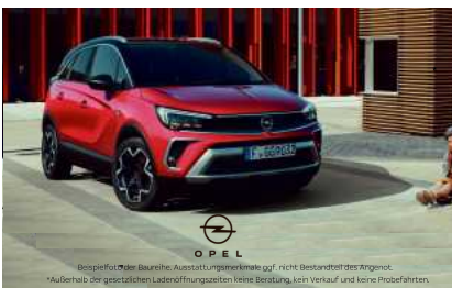
Beispiel für die Berechnung des „effektiven Jahreszins“ (eJZ) nach dem Gesetz zur Berechnung des effektiven Jahreszins (EjZG). Außerhalb der gesetzlichen Leihfristgrenzen keine Beratung, kein Verkauf und keine Probefahrten.

Technischer Hintergrund: Sobald jemand den Türgriff eines mit Keyless-go ausgestatteten Autos betätigt, wird ein Signal an den Schlüssel gesendet. Befindet sich dieser in der Nähe, gibt er die Tür frei. Befindet sich der Schlüssel weiter entfernt, etwa zu Hause am Schlüsselbrett, nutzen Langfinger spezielle Funkreichweitenverlängerer. Die Kriminellen stellen sich an Hauswände oder Wohnungstüren und horchen den Schlüssel aus, während ein Komplex das Signal am Autotürgriff auslöst. dpa