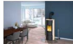
Ein wasserführender Kaminofen.

Wer seinen Kamin anfeuert, heizt damit den Aufstellraum und sorgt für angenehme Temperaturen und eine einzigartige Atmosphäre. Andere Räume im Haus bekommen davon leider kaum bis gar nichts ab. Daher müssen Kaminbesitzer häufig auch auf ihr herkömmliches Heizsystem zurückgreifen, wobei die Verbrauchskosten dafür auf top zum Kaminbrennstoff finanziert werden müssen. Kaminexperten haben eine Kombi-Lösung in petto, die nicht nur den Geldbeutel schont, sondern auch einen Beitrag zum Klimaschutz leistet, da weniger Energie durch herkömmliche Quellen aufgebracht werden muss. Ein wasserführender Kamin funktioniert als Wärmequelle und unterstützt die Heizanlage mit rund 70 Prozent seiner Verbrennungswärme – eine profitable Verbindung, die sich außerdem optisch jedem Interieur anpasst.