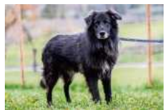
Zeus liebt ausgiebige Spaziergänge.

Kleintiere: Wüstenrennmaus Sunny (11/2020 geb.) sitzt allein in ihrem Terrarium und sucht ein neues Gehege, in dem bereits ein männlicher, kastrierter Mäuserich wohnt, mit dem Sunny den Rest ihres Lebens verbringen darf. bz