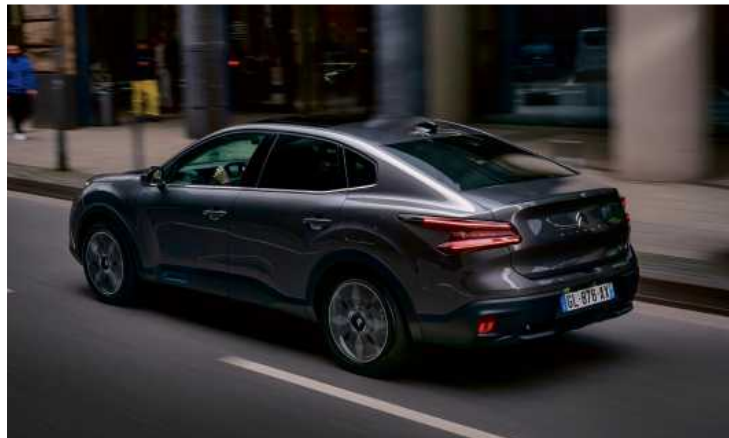
Der e-C4X streckt sich auf 4,60 Meter und kratzt damit an der Mittelklasse.

Während die Passagiere im e-C4X nun mehr Komfort genießen, ändert sich für den Fahrer nichts. Auch das Cockpit ist vertraut: Neben den digitalen Instrumenten befindet sich ein großer Touchscreen. Ein eigenwilliger Fahrtrichtungsschalter ersetzt den früher üblichen Schalthebel. Die verwendeten Materialien sind durchweg solide. Wer den C4 kennt, für den ist all das keine