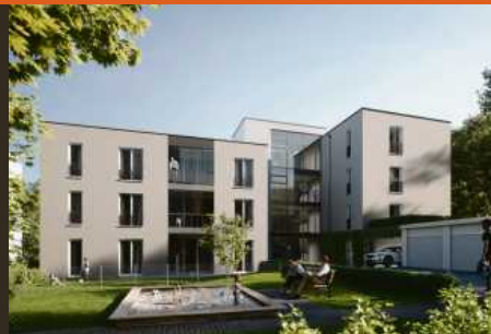
Illustrationen der Weilmordorfer Str. 24/5, Ditzingen