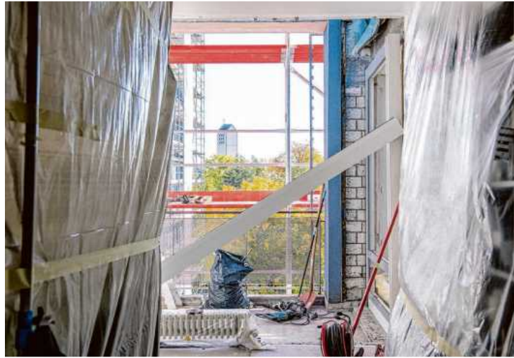
Verwaiste Baustelle: Unterbrochene oder verspätet fertiggestellte Arbeiten können bei Auftraggebern zu Verdruss führen. Im schlimmsten Fall kann dem Handwerker der Auftrag entzogen werden.

Darüber hinaus ist auch eine „Kündigung aus wichtigem Grund“ möglich. Dazu kann es kommen, wenn das Vertrauensverhältnis zwischen Kunde und