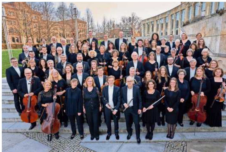
Das Sinfonieorchester Ludwigsburg ist ein ambitioniertes Amateurochester, das sich aus 80 Musikerinnen und Musikern aus dem Großraum Ludwigsburg zusammensetzt.

Wie kaum ein zweiter Komponist im 19. Jahrhundert vertonte Felix Mendelssohn Bartholdy farbenfroh, klangreich und originell die alttestamentlichen Psalmen. Neben A-capella-Sätzen hinterließ er fünf große Orchesterpsalmen, darunter den Psalm 95 „Kommt, lasst uns anbeten“. Das Werk beginnt mit einem Aufruf, den Herrn anzubeten, geht dann aber über in