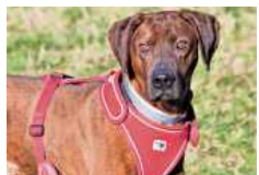
Thommy braucht sinnvolles Training für seine Spürnase.