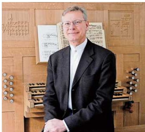
Ludger Lohmann gehört weltweit zu den prominentesten Organisten.

Legendar ist seine Unterrichtstätigkeit von 1982 bis 2020 an der Stuttgarter Musikhochschule, die zahllose begabte Studenten aller Nationalitäten angezogen und Generationen von ebenfalls erstklassigen Interpreten, Kirchenmusikern und Hochschullehrern her-