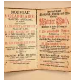
Mehrsprachiges Wörterbuch.

Bei dem Rundgang wird ersichtlich, wie bis heute internationale Beziehungen und Kulturaustausch im Großen wie im Kleinen die Stadt prägen und immer wieder verändern.