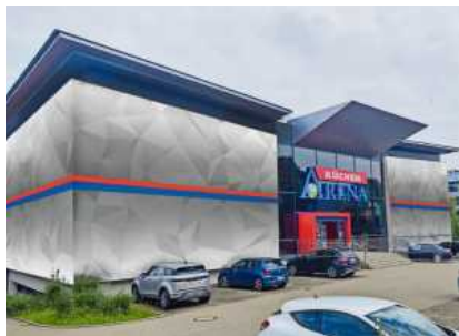
Der Standort Ludwigsburg überzeugt mit einer interessanten Fassade.

Ludwigsburg. Es wurde ganze Arbeit geleistet und es hat sich gelohnt: Die KüchenArena in Ludwigsburg wurde mit einer neuen Fassade ausgestattet und erscheint in neuem Glanz. Der moderne Look wird durch zwei Farbbänder unterbrochen. Diese spiegeln die Farbgebung des Logos wider und sorgen für die Wiedererkennung. Mit der neuen Fassade soll der Trend der Ausstellung auch nach außen transportiert werden, so das Unternehmen.