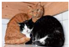
Guido und Medusa suchen nun gemeinsam ein neues Zuhause.