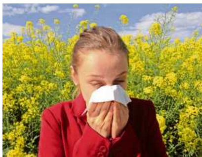
Die Homöopathie ist ein Weg, unangenehme Symptome bei Heuschnupfen zu lindern.

Die Heuschnupfensaison lässt sich kaum noch eingrenzen - Pollen fliegen früher, länger und intensiver. Und in vermeintlich pollenarmer Zeit können dann auch noch Tierhaare und Hausstaubmilben Probleme machen. Unangenehme Begleiterscheinung sind Symptome wie Müdigkeit, Konzentrationsschwäche, gedrückte Stimmung und werden zum Dauerzustand - und setzen die Messlatte in Sachen Behandlung hoch. Homöopathie kann da eine sanfte und nachhaltige Allergietherapie bieten, laut Mitteilung der Deutschen Homöopathie-Union (DHU).