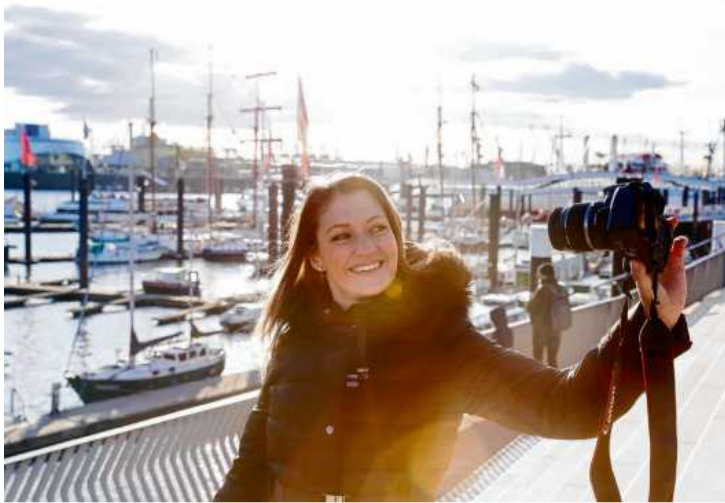
„Gute Leistung zu bringen, ist die Basis“: Wer Karriere machen will, muss aber vor allem daran arbeiten, positiv wahrgenommen zu werden.