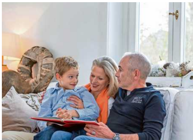
Wer gut hört, muss sich beim Verstehen von Sprache weniger anstrengen und hält seine Ohren und die kognitiven Fähigkeiten fit.

Da gerade die leichten Hörminderungen den wenigsten Betroffenen bewusst sind, erklären sie sich ihr Unbehagen in Gesprächen schnell mit schlechter Tagesform, Wetterfühligkeit oder anderen Umständen. Auch für die Missverständnisse müssen weit verbreitete Erklärungen inhalten: die Mitmenschen nuscheln oder sprechen zu leise und zu undeutlich. Diese Begründun-