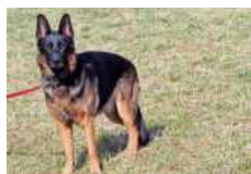
Rüde Graf sucht erfahrene Hundefreunde.