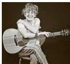
SONiA kommt nach Wahlheim.

Vom Opernhaus in Sydney über Schutzräume in Israel bis zum Woody Guthrie Festival: überall stand die mehrfach in der ersten Grammy-Runde nominierte Sängerin schon auf der Bühne, auf der sie in hebräisch, spanisch,