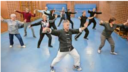
Die Tai Chi Chuan-Gruppe beim Training.

Beim Bereich Tai Chi Chuan des Karate Dojo Bietigheim e.V beginnt ein neuer Inklusionskurs.