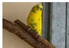
Wellensittich Piepser wünscht sich neuen Anschluss.