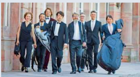
Die Ludwig Chamber Players gastieren in der Schlosskeller.

Die Ludwig Chamber Players (LCP) stehen für begeisterte Spielfreude, gepaart mit einer mitreißenden Virtuosität. Ihre unterschiedlichen musikalischen Einflüsse, die Musiker stammen aus sieben verschiedenen Nationen, führen dabei zu den besonderen Interpretationen des Ensembles. Die Ludwig Chamber Players haben sich der vielfältigen Kammermusik für gemischte Streicher-Bläserbesetzungen des 18. und 19. Jahrhunderts verschrieben. Aber auch Werke zeitgenössischer Komponisten finden Einzug in ihre Programme. Da-