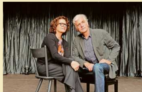
Die renommierten Schauspieler Walter Sittler und Barbara Auer lesen am 11. März in der Lauffener Stadthalle aus dem warmherzigen Roman „Unsere Seelen bei Nacht“.

Barbara Auer, 1959 in Konstanz geboren, und Walter Sittler, 1952 in Chicago, gehören zu den renommiertesten, mit Filmpreisen überhäufteten Akteuren im deutschsprachigen Raum. Umso verwunderlicher ist es, dass sie