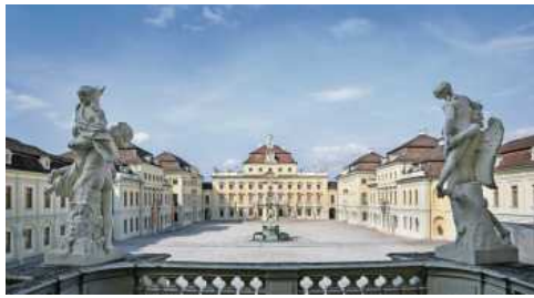
Bei der neuen Führung gibt es zahlreiche besondere Räume zu sehen.