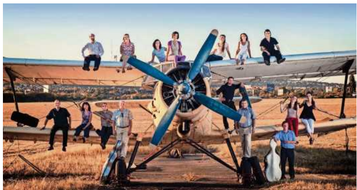
Das Ungarische Kammerorchester gastiert im Kronenzentrum.

Das im Oktober 2011 gegründete Ungarische Kammerorchester setzt sich aus den renommiertesten Musikerinnen und Musikern