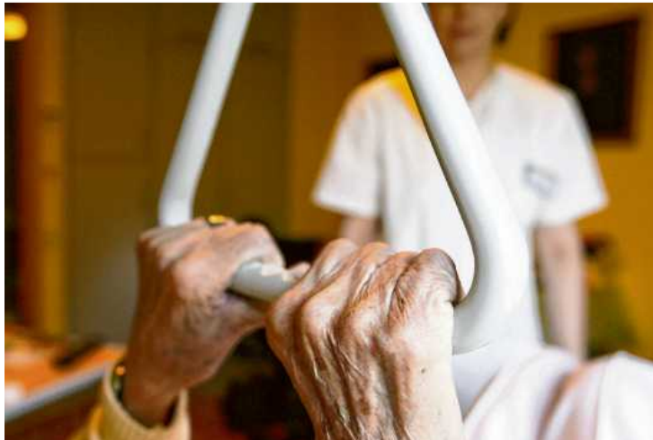
Äußerst vielseitig sind die Aufgaben einer Pflegehelfkraft – die Unterstützung Bedürftiger beim Aufstehen gehört dazu. Qualifizierte Hilfskräfte verfügen über eine anerkannte Berufsausbildung.

Neben den Hilfskräften gibt es qualifizierte Pflegehelfer und Pflegeassistenten. Tätig sind sie in Krankenhäusern und Heimen oder bei ambulanten Diensten.