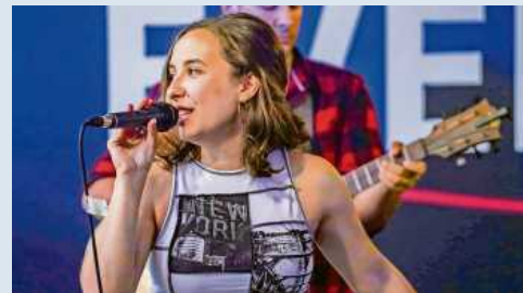
Die Liveband „Evermind“ spielt im KulturKeller in Bönningheim.