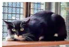
Olga ist sehr scheu und braucht geduldige Katzenfreunde.