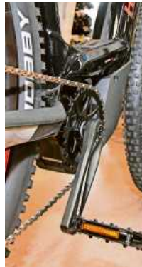
Die neueste E-Motoren Technik.

Info Die Saisonöffnung bei Wallner Zweiräder in der Bissingen Carl-Benz-Straße 24 ist am Freitag von 9 Uhr bis 18 Uhr und am Samstag von 9 Uhr bis 16 Uhr.