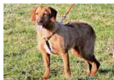
Angi liebt Spaziergänge und braucht eine gute Ausbildung.