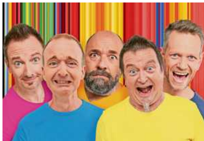
„Füenf“ machen auf ihrer Abschiedstournee auch Station in Vaihingen.

Höhepunkte aus 25 Jahren Endlich Schluss mit lustig? Geht den Maulhelden Endlich mal die Puste aus? Werden diese Kindsköpfe Endlich erwachsen? Tja, scheint so. Wohl auch die schönste Zeit währt nicht ewig. So kommt nun auch die Ära „Füenf“ auf die Zielgerade für den Endspott der Besinglichen!