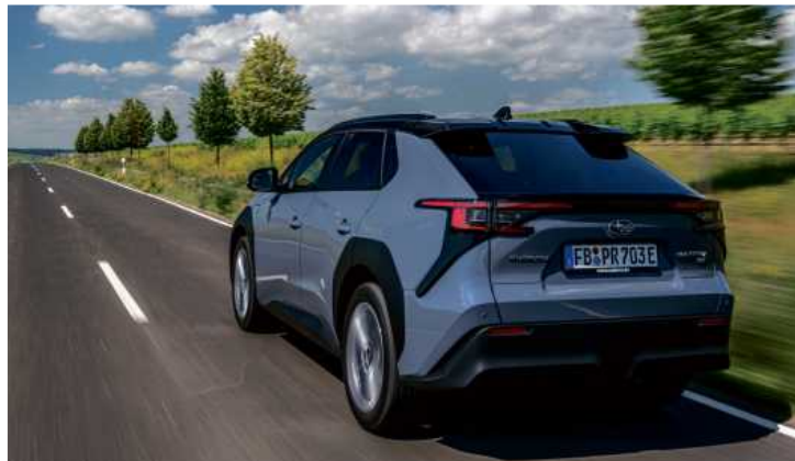
Der Subaru Solterra hat viel Ähnlichkeit mit dem Toyota Bz4X.

Damit die Ladepausen nicht allzu häufig werden, hilft der Solterra mit einem smarten Bremspedal beim Stromsparen: Es gibt mehrere Stufen der Rekuperation, mit denen man die konventionelle Bremse schonen und viel Energie zurückgewinnen kann.