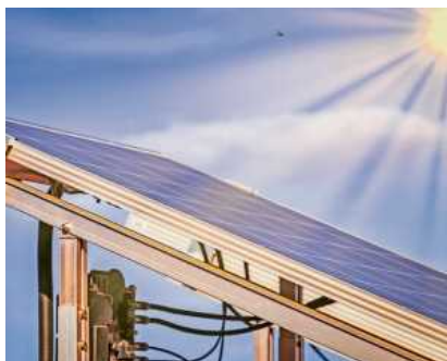
Balkonkraftwerke sind kostengünstige Solarmodule. Der Strom wird sofort ins Hausnetz eingespeist.

Umweltschutz darf keine Frage des Geldes sein. Das Zeitalter der fossilen Brennstoffe ist besiegelt und die Verwendung erneuerbarer Energien rückt immer mehr in den Vordergrund. Eine große Rolle spielt dabei die Solarenergie, bei der die Energie der Sonnenstrahlung in Strom oder Wärme umgewandelt wird, um sie im Haushalt nutzbar zu machen. Dabei entstehen weder klimaschädliches Kohlendioxid noch sonstige giftige Abgase. Außerdem ist Solarenergie unabhängig von Rohstoffpreisen nutzbar.