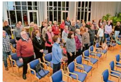
Annähernd 50 Sangesfreudige nahmen am zweiten Herdensingen im Enz pavillon Bietigheim teil.

Zum dritten Mal Herdensingen im Bietigheimer Enz pavillon.