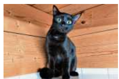
Knorr sucht mit ihrer Mutter Ebly ein gemeinsames Zuhause.

Kleintiere: Großkaninchen-Dame Charleen (6/2022 geb.) ist menschenbezogen und neugierig. Sie sucht ein neues Gehege, das für Großkaninchen ausgelegt ist und bereits von einem kastrierten Rammeler bewohnt wird oder eine größere Gruppe. Außenhaltung ist ab dem Frühjahr möglich. bz