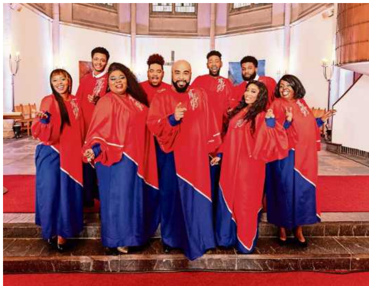
Die New York Gospel Stars machen Station in Ludwigsburg.

Die New York Gospel Stars sind so unverwechselbar wie ihre Heimatstadt New York. Lebendig, dynamisch, immer in Bewegung und unterlegt mit ihrem eigenen, speziellen Sound.