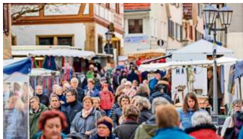
Die Bietigheimer Altstadt wurde bewertet.

Wie die Stadtverwaltung zum Ergebnis mitteilt, landete die Stadt in der Gesamtbewertung bei der Schulnote sehr gut bis gut, ebenso das Einzelhandelsangebot der Stadt. Bietigheim-Bissingen liege weiterhin ganz vorne – wie auch schon 2014, 2018 und 2020, als die Stadt bereits an dieser Umfrage teilnahm. In nahezu allen Fragen sei die Stadt mit sehr