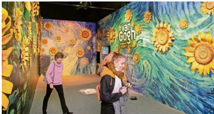
Die farbenprächtigen „Sunflowers“ sind van Goghs Markenzeichen.

Die Technologie wurde von Lichtexperten neu entwickelt. In der Inszenierung taucht der Besu-