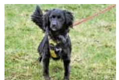
Joshi sucht aktive Menschen, die ihn beschäftigen können.

kommt bestens mit Menschen und anderen Hunden zurecht. Katzen: Katze Tullsta (kast., 2019 geb.) ist eine verwilderte Hauskatze, die mit etwas Geduld schon menschliche Nähe zulässt. Auch wenn sie die Streicheleinheiten noch nicht richtig genießen kann, hat sie das Potenzial zur Schmusekatze. Tullsta sucht ein neues Zuhause, in dem sie nach gründlicher Eingewöhnung wieder die Möglichkeit auf Freigang in verkehrsberuhigtem Gebiet hat. Katze Ebly (kast., 2021 geb.) und ihre Tochter Knorr (kast., 10/2021 geb.) sind noch sehr scheu. Beide suchen ein gemeinsames, ruhiges Zuhause bei gedulden und katzenfreundlichen Menschen. Nach der Eingewöhnung sollten sie wieder die Möglichkeit auf Freigang in verkehrsberuhigtem Gebiet haben.