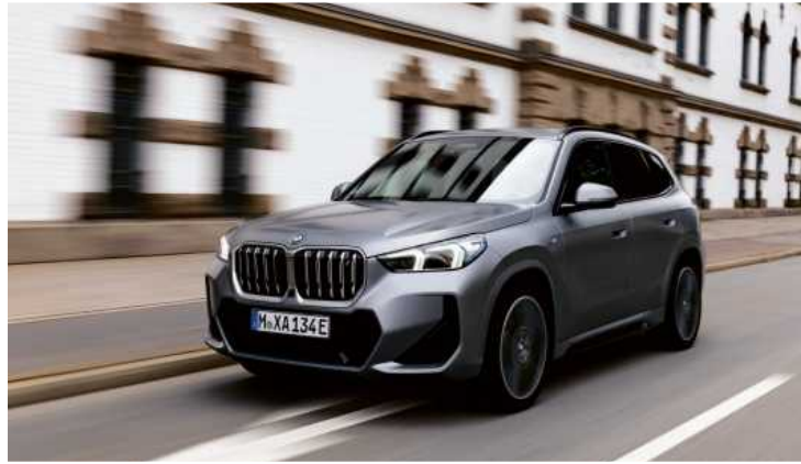
Der iX1 schickt sich an in würdiger Form die Nachfolge des i3 anzutreten.

Dass der iX1 bei 180 km/h aber schon wieder eingebremst wird, daran müssen sich BMW-Fahrer erst gewöhnen. Zumindest unter den Stromern geht der iX1 trotzdem noch als Sportler durch. Zwar fährt der iX1 deutlich enga-