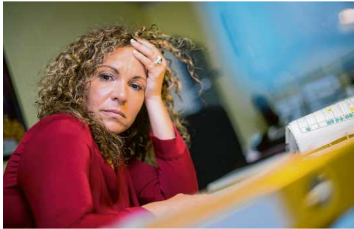
„Der Arbeitsplatz ist eine Quelle des Selbstwerts“: Geht der Job verloren, gilt es, sich auf eigene Stärken zu besinnen – und eventuell die Gelegenheit zur beruflichen Neubestimmung zu nutzen.