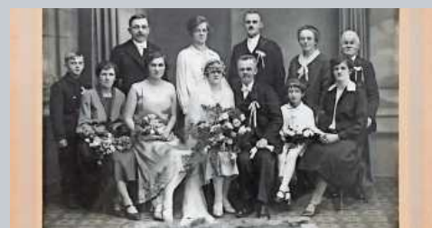
Eine vornehme Hochzeit Anfang 1920.

Der Eintritt ist frei, Spenden sind willkommen. bz