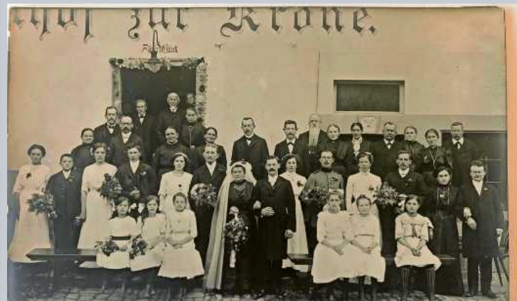
1890 heiratete der Müllersohn von der Laukenmühle in Mainhardt. Damals war noch das schwarze Brautkleid in der Bevölkerung üblich.

Der Verein für Heimatgeschichte Sachsenheim e.V. lädt am 24. Februar um 19 Uhr zu einem Vortrag über Hochzeitsbräuche ein.