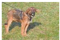
Henry braucht viel Zeit mit seinen Menschen.

Hunde: Der vier Monate alte, zutrauliche und freche Multimixwelpen Henry sucht liebevolle Menschen, die viel Zeit für ihn haben und ihn vernünftig erziehen können. Der lebhaftes Spanielmix Joshi (kast., 2020 geb.) sucht aktive Menschen, die mit einem jagdlich motivierten Hund klar kommen und ihn körperlich und geistig auslasten können. Er