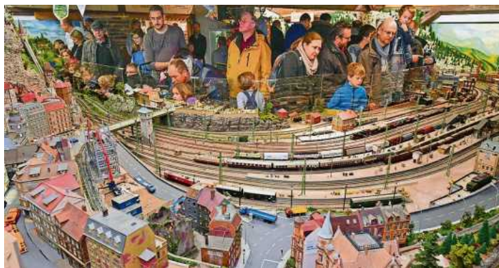
Auch 2019 war die Begeisterung der Besucher groß für die Modellbahnausstellung.

Weiter bietet das Programm einen Stand der Gesellschaft zur Erhaltung von Schienenfahrzeu-