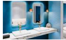
Ein modernes Badkonzept.

Region. So wuselig der Familienalltag auch ist, er beginnt und endet für alle Parteien gleich: mit einem Besuch im Bad. Im Sortiment von Experten gibt es ein langlebiges, hochwertiges und nachhaltiges „Familienbad“, das Maßstäbe setzt. Etwa mit einem zum Patent angemeldeten WC, das beim Gebrauch einer vierköpfigen Familie bis zu 19700 Liter Wasser pro Jahr spart – und dabei äußerst hygienisch ist. Eine tolle Formensprache bei Waschbecken & Co. sowie Möbel mit praktischem Stauraum lassen Groß und Klein sich gerne im Lieblingsraum Bad aufhalten. Und das nicht zuletzt auch dank ergonomischer Wannen. Aus hochwertigem Material hergestellt, sind sie besonders kratzfest und farbbeständig. Übrigens: Smarte Lichtspiegel sorgen zu jeder Tageszeit und Situation für die richtige Beleuchtung und erschaffen so die jeweils passende Atmosphäre. hlc