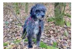
Marley geht sehr gern spazieren.

verkehrsberuhigtem Gebiet ausleben können. Die beiden Kater Legolas (2022 geb.) und Thranduil (kastr., 2020 geb.) sind sehr lieb und verschromst. Legolas ist altersbedingt noch etwas aktiv. Die beiden spielen und kuscheln ständig miteinander. Deshalb suchen sie auch nur gemeinsam ein neues Zuhause in Wohnungshaltung mit gesichertem Balkon. bz