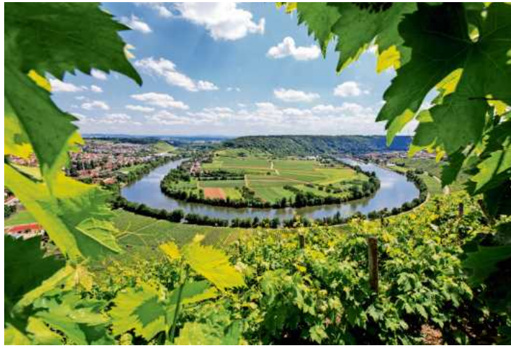
Der 3B-Reisebegleiter 2023 führt auch nach Mundelsheim.

Ein Höhepunkt im 3B-Jahresprogramm stellt sicherlich wieder der Genuss-Wandertag „3B-Wein-Höhepunkte dar. Der genussreiche Wandersonntag findet kommenden Jahr am 13. August statt. Weinliebhaber sollten sich diesen Termin auf jeden Fall schon mal vormerken.