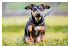
August sucht eine nette Familie mit viel Zeit für ihn zum Spielen.