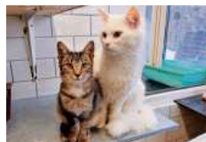
Legolas und Thranduil suchen gemeinsam ein neues Zuhause.