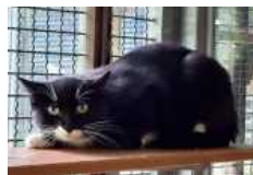
Olga braucht viel Geduld, um Vertrauen zu fassen.