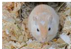
Sunny sucht ein neues Gehege mit einem lieben Mäuserich.