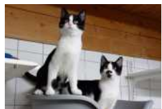
Shanna und Sheba suchen nun gemeinsam ein neues Zuhause.