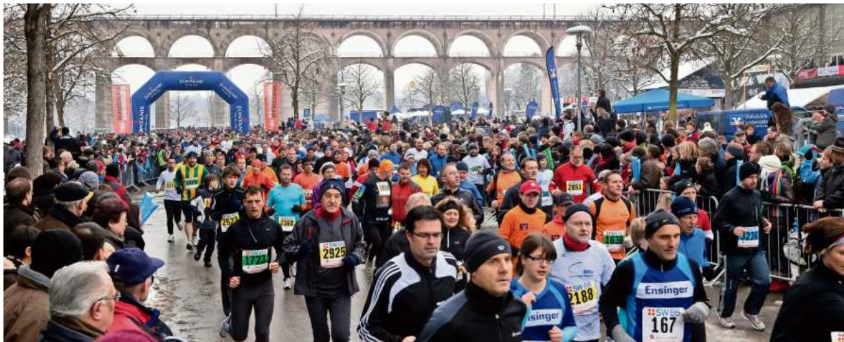
Der Silvesterlauf 2010. Dieses Jahr gehen die Läufer an Silvester um 14 Uhr auf dem Festplatz unterm Enzviadukt zum 40. Mal an den Start.