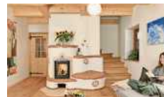
Wer mit Holz heizt, kommt warm und gemütlich durch den Winter.

Region. Holz ist eine gut verfügbare, erneuerbare Energiequelle, um seine eigenen vier Wände zu heizen. Knistert das Holz erst einmal munter im Kachelofen, stellt sich bald Gemütlichkeit ein und man nimmt gerne vor der Feuerstätte Platz oder kuschelt sich auf den mulligen warmen Ofenbänken zusammen. In Kachelofen-Werkstätten entstehen noch heute in echter Handarbeit Kachelöfen als Unikate aus den Wünschen und Vorstellung der künftigen Ofenbesitzer einerseits und der Handwerkskunst der Ofenbauer andererseits. Ihr zeitgemäßes Design mit den organisch-weichen, naturgeprägten Formen und einem Mix aus fröhlich-bunten sowie erdfarbenen keramischen Fliesen ist direkt von Gaudi und Hundertwasser inspiriert. Ohne Ecken und Kanten gestaltet, fügen sich die Kachelöfen stilvoll und ganz natürlich in das Wohnambiente ein. hlc