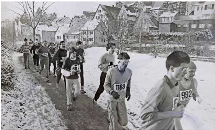
1986 ging es bei Schnee und Eis auf die Strecke.