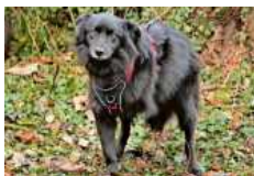
Frodo „Dreibein“ ist sehr zutraulich und lieb.

Kleintiere: Die Mongolische Wüstenrennmaus Sunny (Alter unbekannt) sucht ein neues Gehege, in dem bereits ein männlicher, kastrierter Mäuserich wohnt, mit dem sie gern den Rest ihres Lebens verbringen möchte. bz