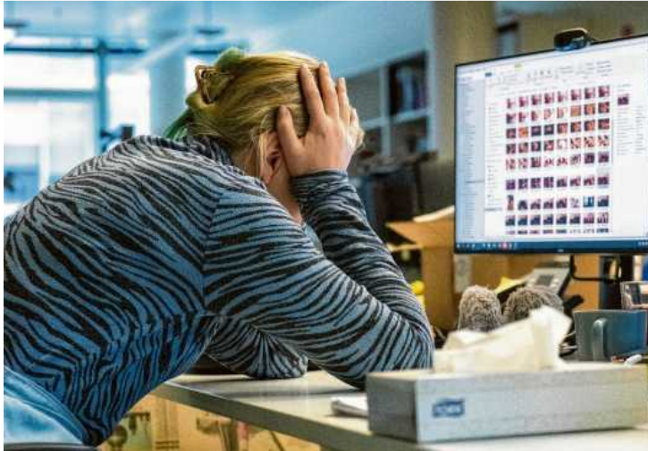
„Gerechtigkeit herstellen“: Werden die eigenen Erwartungen an den Arbeitgeber nicht erfüllt, folgt bisweilen die innere Kündigung. Nach dem Motto: Schaut doch, wie ihr ohne mich zurechtkommt.

Auch strukturelle Gründe können eine Rolle spielen. „Personalabbau, eingeschränkter Aufgabebereich, unklare Strukturen