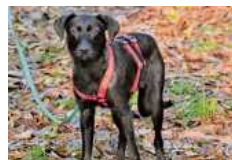
Nick freut sich auf geduldige Hundellebhaber.