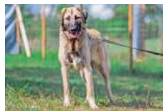
Hazel möchte endlich in ein eigenes Zuhause.

Kleintiere: Arielle (kastriert, 2021 geb.) und ihr Freund Hoppel (kastriert, 2020 geb.) haben im Tierheim zueinander gefunden und mögen sich sehr. Sie suchen nur gemeinsam ein neues Aufgehege, das artgerecht eingerichtet und marder- und fuchssicher ist. bz