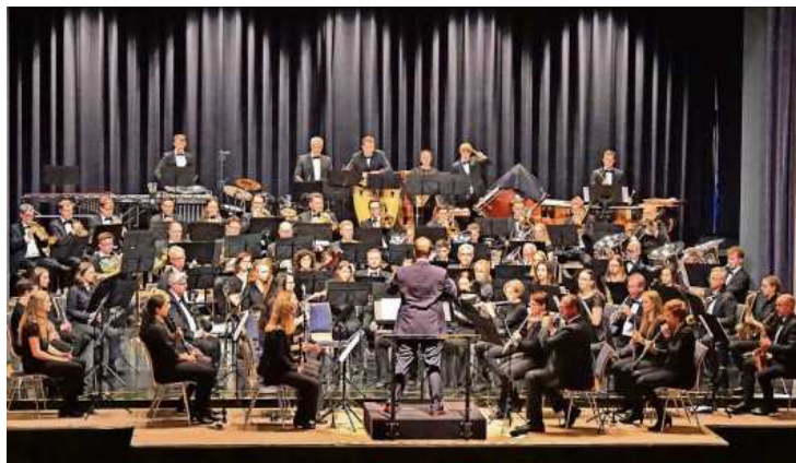
Der Musikverein Vaihingen spielt Mitte Januar sein Neujahrskonzert.