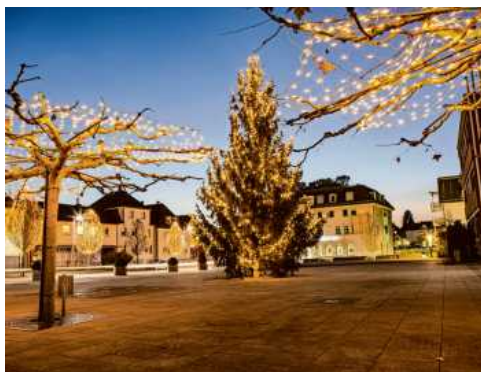
Zum erstem Mal findet der Tammer Weihnachtsmarkt rund um das Rathaus statt.

Am zweiten Advent öffnet der Tammer Weihnachtsmarkt nach zweijähriger Corona-Pause wieder seine Pforten: Der Weihnachtsmarkt findet am Sonntag, 4. Dezember 2022 dabei von 11 Uhr bis 20 Uhr zum ersten Mal rund um das Rathaus statt, mit noch mehr Ständen, Essens- und Getränkeangeboten und einem schönen Kinderprogramm.