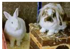
Hoppel und Arielle suchen ein gemeinsames neues Zuhause.