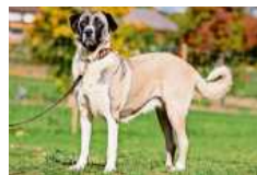
Lady und ihr Gefährte Askan wollen zusammenbleiben.