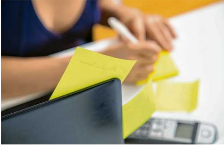
„Man sollte die To-do-Liste stets vor Augen haben“: Dadurch wird man nicht nur an seine Pflichten erinnert, man kann man sich auch darüber freuen, wenn wieder eine Tätigkeit abgehakt werden kann.