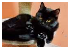
Nscho-Tschi ist sehr anhänglich und verspielt.