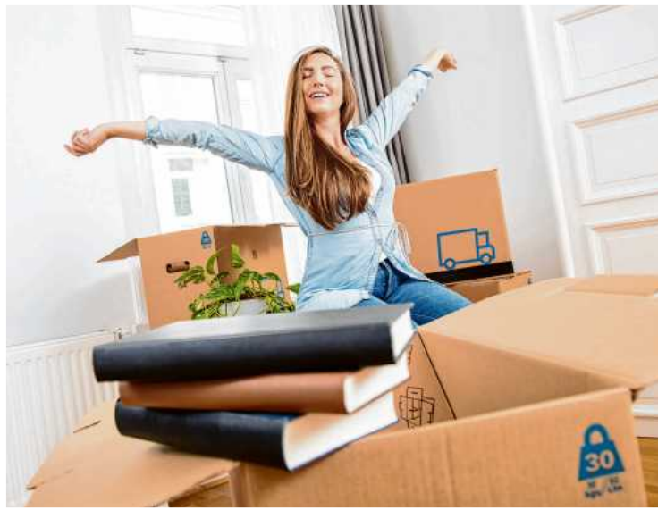
„Kann ich mir das wirklich leisten?“ In Inseraten wird meist nur die Kaltmiete einer Wohnung angegeben. Die zusätzlichen Kosten können erheblich sein, deshalb lohnt ein genauer Blick in den Mietvertrag.