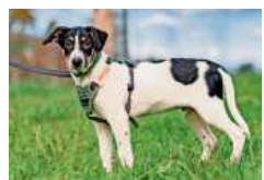
Oliver sucht eine aktive, sportliche Familie.