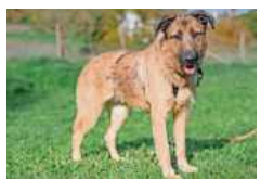
Schäfermischlingshündin Dely ist schlaue und neugierig.

Charly und Alan (schwarz/weiß und beige/weiß) wurden in einem kleineren Einkaufszentrum in einer Box aufgefunden. Sie sind noch nicht ganz ausgewachsen und sind wahrscheinlich etwa vier bis sechs Monate alt. Charly & Alan sind sehr zutraulich und möchten nur gemeinsam in ein artgerecht eingerichtetes Nagarium umsiedeln. bz