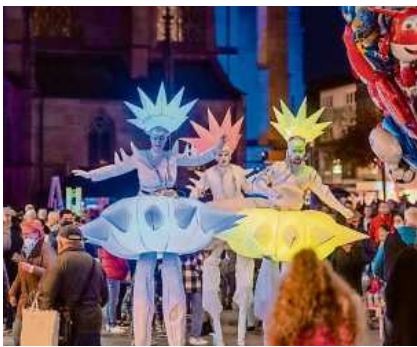
In Heilbronn gibt es am 28. Oktober wieder einen Lichterzauber mit Nightshopping.