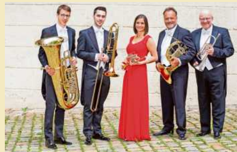
Harmonic Brass spielen in Lauffen.

Den ganzen Advent ist das Ausnahme-Quintett in ganz Deutschland unterwegs. Am Sonntag, 4. Dezember, sind sie in der Lauffener Stadthalle zu Gast. Beginn ist um 19.30 Uhr. Mit seinem berühmt-strahlenden Sound präsentiert Harmonic Brass die großen Weihnachtsklassiker: Musik von J.S. Bach und Georg Friedrich Händel, berührende Choräle, gloriose Akrobatik an den Piccolotrompeten und Weihnachtsüberraschungen aus aller Welt. Dazu eine charmante Moderation mit herrlichen Geschichten rund ums Fest. Nichts wird dem Zufall überlassen. Alles ist in diesem