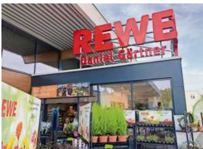
Der neue Kobold VK7 Akku-Staubsauger wird am Samstag im Rewe-Markt in Gemmrigheim vorgeführt.

Am Samstag wird das neue Gerät im Rewe-Markt Gemmrigheim präsentiert.