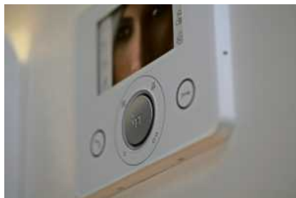
Eine Video-Gegensprechanlage mit elektronischer Zutrittskontrolle bietet Sicherheit.

Mit der neuen Online-Suche unter www.k-einbruch.de können Nutzerinnen und Nutzer zum einen nach Betrieben für den fachgerechten Einbau von mechanischer Si-