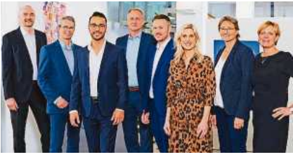
Das Team der Finanzagentur Bietigheim freut sich darauf, seine Kund*innen ab Dezember in den neuen Räumlichkeiten begrüßen zu können.

Ab 1. Dezember 2022 in der Freiburgerstraße 3 in Bietigheim-Bissingen.