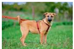
Kenia ist noch Welpe und sehr verspielt.

Die seltene Treppennatter Sky braucht Haltung bei einem Profi.