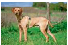
Fury liebt ausgiebige Spaziergänge.