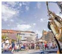
In Heilbronn ist es wieder Zeit für „Jazz & Einkauf“.

Heilbronn. Hochkarätiger Jazz und ein entspanntes Einkaufserlebnis, dafür steht seit mehr als 25 Jahren „Jazz & Einkauf“ in Heilbronn. Am Sonntag, 9. Oktober, bietet das weit über die Region hinaus bekannte Musik-Event wieder Pop, Jazz, Swing und Lounge-Musik vom Feinsten, die Geschäfte sind von 13 bis 18 Uhr geöffnet.