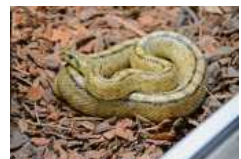
Die seltene Treppennatter Sky braucht Haltung bei einem Profi.