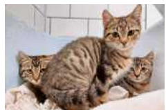
Karlson, Kermit und Kirby suchen ein ruhiges Zuhause.