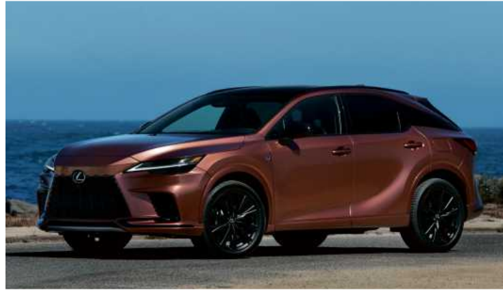
Die fünfte Generation des Lexus RX wird ab 2023 ausgeliefert.

Auch beim Antrieb beweist Lexus Eigensinn: Als Tochter des