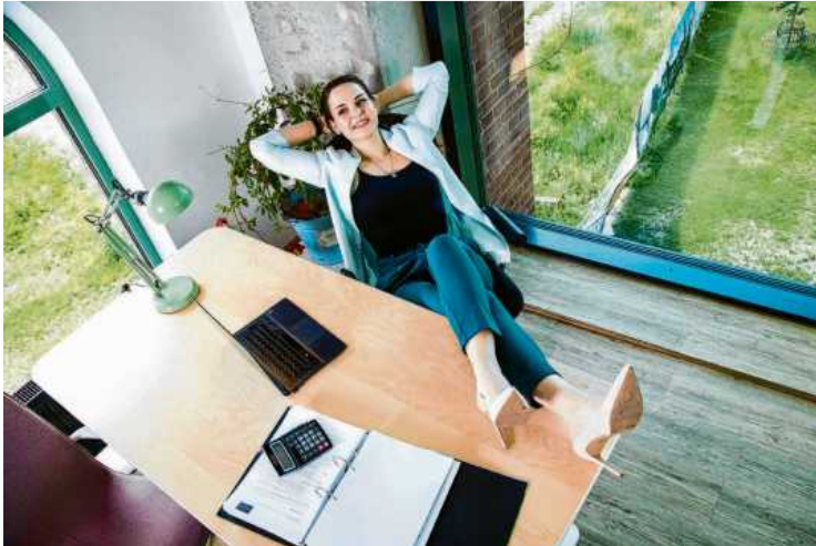
„In den ersten Tagen verstärkt Pausen einbauen“: Nach dem Urlaub muss sich der Körper erst wieder auf den Arbeitsrhythmus umstellen.

Kaufmann rät etwa, den Urlaub so zu legen, dass man in der Wochenmitte zurück an den Arbeitsplatz kommt. Das verkürzt die erste Arbeitswoche. Bestimmte Prozesse sollten im Idealfall vor der Auszeit abgeschlossen werden, etwa wichtige Projekte oder Präsentationen. Ein weiterer