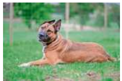
James braucht erfahrene Hundefreunde.

gewöhnung die Möglichkeit auf Freigang in verkehrsberuhigtem Randgebiet haben. Kleintiere: Die Farbmaus-Mädchen Mozzarella, Milka, Milky und Julie suchen nur gemeinsam ein neues Terrarium auf Lebenszeit. Sie sind zwischen fünf Monaten und einhalb Jahren alt, an Menschenhand gewöhnt, zahm und bewegungsfreudig. bz