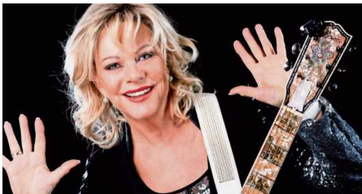
Lisa Fitz tritt mit ihrem Jubiläumsprogramm in Sachsenheim auf.

Lisa Fitz gilt als Ikone des Kabarets und kommt am Samstag, 8. Oktober ins Schulzentrum nach Sachsenheim. Sie kann auf 4000 Sologastspiele zurückblicken und hat gut 200 Songs geschrieben. „Dauerbrenner – das große Jubiläumsprogramm“ ist das 16. Kabarettprogramm der beliebten Künstlerin – aber ganz sicher ist sie nicht, ob es nicht doch mehr waren. Auch nach einer über 40 Jahre währenden Vita des Erfolgs mit jährlich 100 Gastspielen in ebenso vielen Städten ist die Lust am Kabarett bei der temperamentvollen Powerfrau mit dem bayerischen Charme und der scharfen Zunge ungebrochen. Lisa Fitz lebt für die Bühne und das spüren die begeistertsten Zuschauer bei jedem Auftritt.