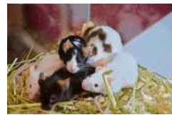
Die Farbmäuse möchten auf jeden Fall zusammenbleiben.