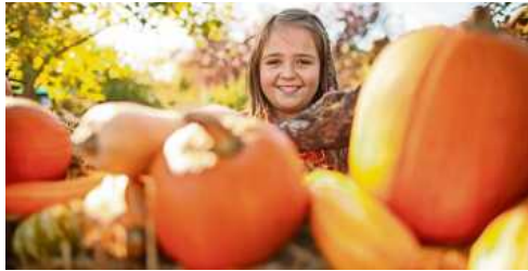
Im Erlebnispark Tripsdrill ist alles auf Herbst eingestellt.

Mit geschmückten Erntewagen, Kürbispiramiden, Holzdrachen in den Bäumen und Vogelscheuchen ist im Erlebnispark Tripsdrill alles auf Herbst eingestellt. Erst kürzlich wurde der abwechslungsreiche thematisierte Park zum siebten Mal mit dem European Star Award aus bester Freizeitpark Europas ausgezeichnet.