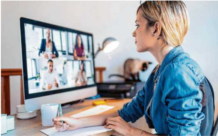
Kürzere Studiendauer, niedrigere Kosten: Ein Mini-MBA spart Zeit und Geld, führt aber nicht zu einem akademischen Abschluss.