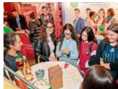
Besucherinnen bei der BANE 2019.

Durch die teilweise unsichere internationale Lage gewinnt eine Veranstaltung wie die BANE zusätzlich an Bedeutung, sind sich die Veranstalter sicher. Besigheims Bürgermeister Steffen Büh-