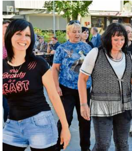
Der Indian Summer sorgt für viel gute Laune bei den Besucherinnen und Besuchern.

Zwei Tage abwechslungsreiche Programm für die ganze Familie.