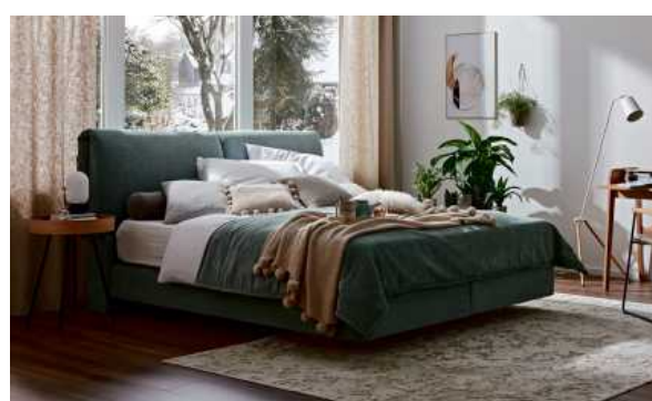
NATURA HOME Alpin Boxspringbett, Bezug: Stoff grau-grün (100% Polyester), bestehend aus: AP50 ohne Verstellung, Box mit Schwebeloptik, Kopfhaupt AP04, 2 Matratzen Alpin Elastic TFK26 H2/H3, Liegefläche ca. 180x200 cm, geteilt, BHT ca. 200x114x230 cm, ohne Deko, Kissen und Bettwaren, 2799,-**