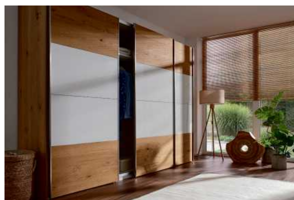
NATURA HOME Colorado Schwebetürenschränk, Front: Eichefurnier geölt und Glas weiß, Korpus: Premiumweiß mit Abschlussseiten in Eichefurnier, Griff: Aufclipprofile edelstahlfarbig, BHT ca.: 306x236x65 cm, 2599,-**