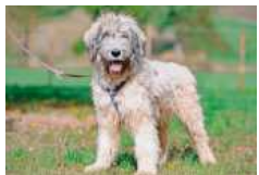
Buschka braucht genügend Platz und Auslauf.