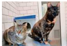
Willi und Tapsi suchen nur gemeinsam ein neues Zuhause.