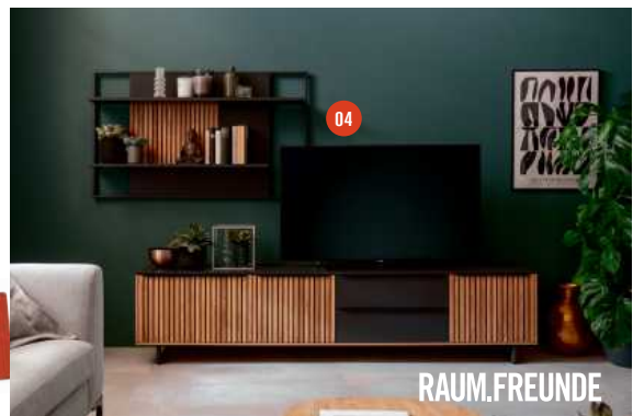
04 RAUM.FREUNDE STAV WOHNWAND bestehend aus Wandpaneel und Lowboard auf Metallkufen mit 3 Türen; und 2 Schubladen BHT ca. 234x166x50 cm, ohne Deko, 1999,- 05 RAUM.FREUNDE STAV SIDEBOARD auf Metallkufe mit 1 Tür, 2 Klappen, 3 Schubladen und offenem Fach, BHT ca. 168x85x40 cm. 2399,- ohne Beleuchtung, 2199,-

Stylische Stauraummöbel mit Massivholz-Lamellen aus Astsche Made in Germany