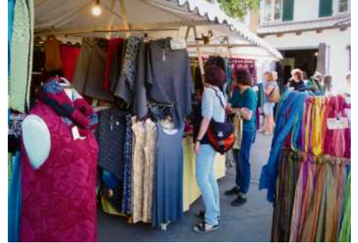
Große Auswahl nicht nur für Kleidung findet sich in der Eibensbacher Straße

Am Sonntag ist „Souzas Traum – urban cat music“ für die musikalische Umrahmung zuständig und präsentiert Balkan- und Klezmermusik von 1920 bis heute. Souzas Traum sind eigentlich ein Kleinstorchester. Harmonien in