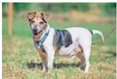
Senior Jacky freut sich auf ein Zuhause.