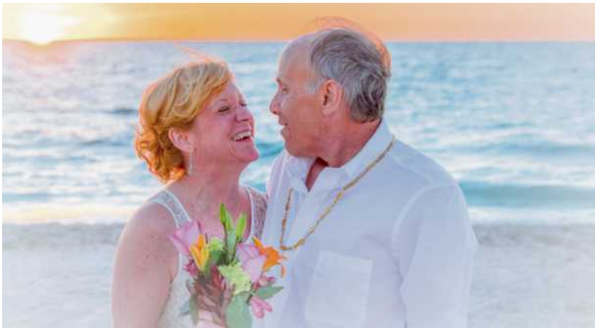
Auch im fortgeschrittenen Alter hat man ein Recht darauf, sich durch eine Heirat in Liebe partnerschaftlich verbunden zu fühlen und gemeinsam das Leben zu genießen.

Obwohl eine Hochzeit in jedem Alter ein Anlass für ein großes Fest sein kann, entscheiden sich viele ältere Brautpaare für eine kleinere Feier. Dafür mieten sie zum Beispiel einen Saal in dem Restaurant, in dem sie sich bei einem Rendezvous zum ersten Mal geküsst haben. Seitens vieler Gastronomen wird ein Angebot für die Hochzeitsfeier unterbreitet, welches Saalmiete, Dekoration, Menü und die musikalische Unterhaltung be-