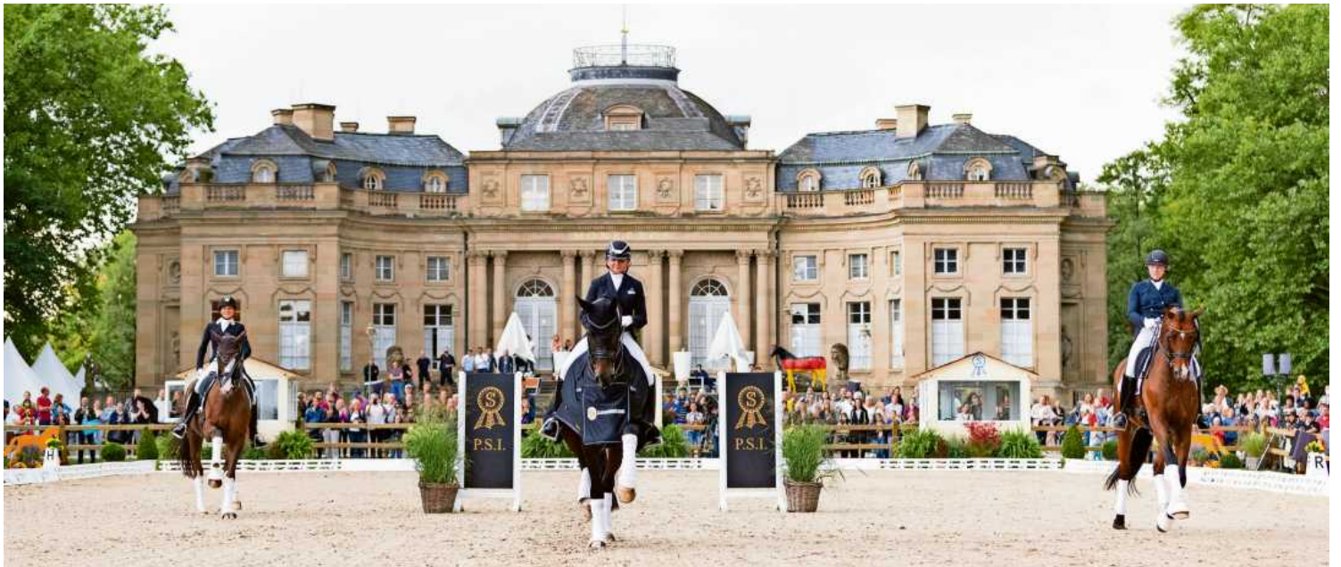
Vor der Kulisse des historischen Seeschlosses Monrepos wird das zweite Internationale Ludwigsburger Dressurfestival ausgetragen: ein besonderes Event mit allen, was in der Reiterwelt Rang und Namen hat, in entspannter Atmosphäre, und vor einem begeistertem Publikum.