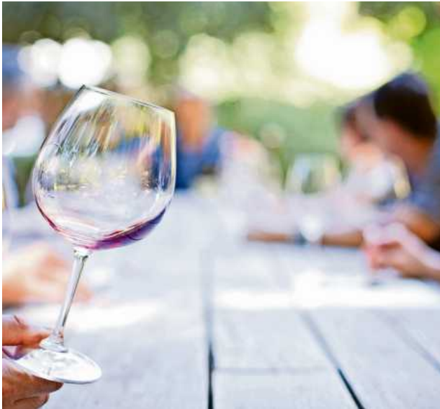
Weinseminare helfen den Gastgebern bei der kundigen Auswahl von Weinen.

Im Gegensatz zu einer vertrauten Runde mit Freunden empfiehlt es sich, bei offiziellen Anlässen wie beispielsweise einem Abendessen mit dem Vorgesetzten die Tischmanieren beim Weintrinken zu berücksichtigen. Gerade wenn eine höhere Karriereposition angestrebt wird oder man sich am Ende eines Auswahlverfahrens für Führungskräfte befindet, stehen nicht selten gemeinsame Abendessen mit den Entscheidenden auf dem Programm. Die Tischmanieren sollten nicht zu einem Stolperstein auf dem Karriereweg werden.