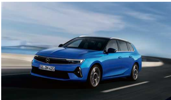
Der Astra Sports Tourer überzeugt auch durch seine Geräumigkeit.

Den hat der Astra auch im Innenraum. Denn Herzstück ist hier das sogenannte Pure Panel. Dank des neuen Cockpit-Konzepts prangen die digitalen Instrumente nun als einheitliches Displayelement über Lenkrad und Mittelkonsole. Alles in Allem kann das Opel-System durchaus mit der Innentechnik des VW Golf konkurrieren. Zumal es sehr viel einfacher und zielsicherer funktioniert. Doch der Sports Tourer lebt nicht vom modernen Image allein, sondern beweist auch Neh-