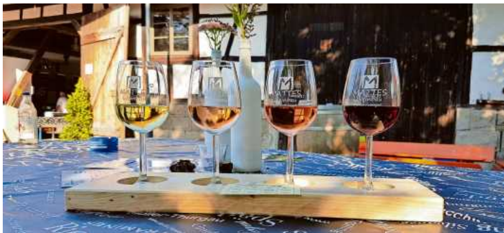
In geselliger Runde den Lieblingswein bei diversen Weinproben entdecken: die Urigen Weinnächte des TSV Unterriexingen bieten dazu ausgiebig Gelegenheit.

Für Besucher und Gäste aus nah und fern hat man sich einiges einfallen lassen. Für das leibliche Wohl ist bestens gesorgt mit kleineren Gerichten wie zum Beispiel