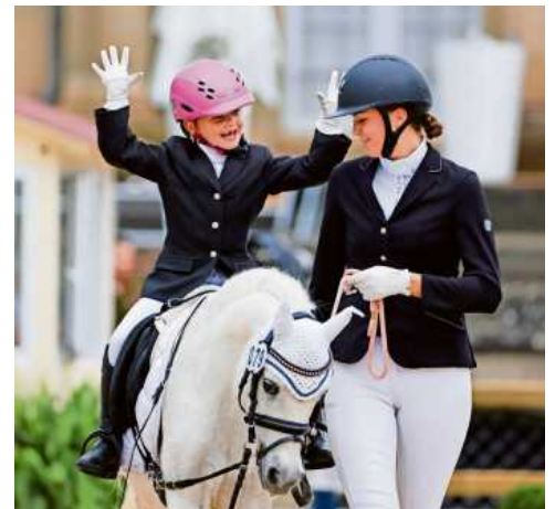
Auch der Dressur-Nachwuchs übt sich schon früh im Wettkampf mit seinem Pony.

Ein Gastronomiebereich und eine Ausstellung rund um Reitsport und Lifestyle unter den großen Kastanienbäumen vor dem Seeschloss Monrepos sorgen für eine perfekte Festival-Atmosphäre für die ganze Familie. Der Eintritt ist frei an allen Tagen. bz