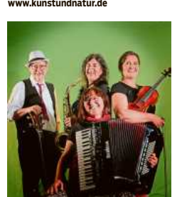
Souzas Traum präsentieren Balkan- und Klezmermusik.

Zuschauer. Dazu kann jeder, der Lust hat, auch unter seiner Anleitung einmal selbst das Jonglieren ausprobieren. bz