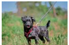
Chilli ist sehr zutraulich und verspielt.

Kleintiere: Die Kaninchen-Dame Harley (wird kast., 2021 geb.) und Harry (kast., 2018 geb.) wurden ausgesetzt und zum Glück schnell gefunden. Sie sind aufgeweckt und sehr neugierig, springen und toben gern. Sie wollen auf jeden Fall zusammenbleiben. Ihre neue Unterkunft sollte artgerecht gestaltet sein und ihnen den nötigen Platz zum Spielen bieten. bz