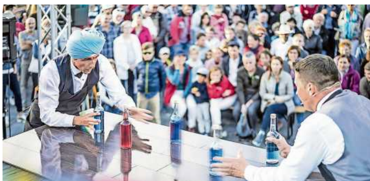
Klirr Deluxe bieten mit ihrem „Fest der Flaschen“ – ein energiegeladenes Spektakel mit Jonglage, Tanz, Zauberei und einem flammenden Showdown.

Digger & Dig (D) „Acapulco“ – eine musikalische Reise voller Komik G. Traberproduktion (CH) „Heinz baut“ – eine „himmlische Sondierbohrung nach Erkenntnis“ Pikzpalace (B) „Boucherie Bacul“ – köstlich düstere Sideshow, nichts für schwache Nerven Felice & Cortes (D) „Selling Stories“ – eine Geschichte aus Musik und Artistik Klirr Deluxe (D/NOR), „Das Fest der Flaschen“ – ein energiegeladenes Spektakel mit Jonglage, Tanz, Zauberei und einem flammenden Showdown Die lebende Musikbox (D), „Hits vom Vordersitz“ – Sie wünschen, wir spielen – live! Osadia (ES) „Hair Sculptures“ – originelle und gewagte Haarkunst mit aktiver Mitwirkung des Publikums