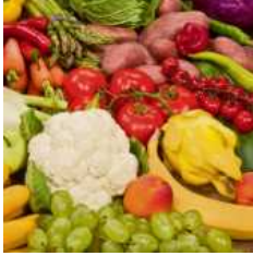
Gesundes Obst und Gemüse genießen.

Die Stände der regionalen Erzeuger mit vielen kulinarischen Köstlichkeiten - von gegrillter Forelle, über hausgemachte Spätzle, feine Liköre, Holzofenbrot, regionale Fleischgerichte, Crepes und