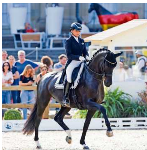
Mannschafts-Olympiasiegerin und Deutsche Meisterin Dorothee Schneider verzauberte das Publikum 2021.

Aller Championaterfolg hat seinen Anfang in der Nachwuchsförderung und im Reitsport haben sich zwei bekannte Serien dabei besonders hervorgetan. Der Nürnberger Burg Pokal für sieben- bis neunjährige Dressurpferde hat schon mehr als 155 vierbeinige Medaillengewinner bei nationalen und internationalen