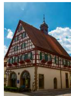
Das Alte Rathaus ist ein besonderer Blickfang.

schöne Steinmetzarbeiten in Form von Ornamenten und Schriftbändern. 1991 wurde das Alte Rathaus umfassend renoviert, heute finden hier standesamtliche Trauungen und Veranstaltungen statt. bz