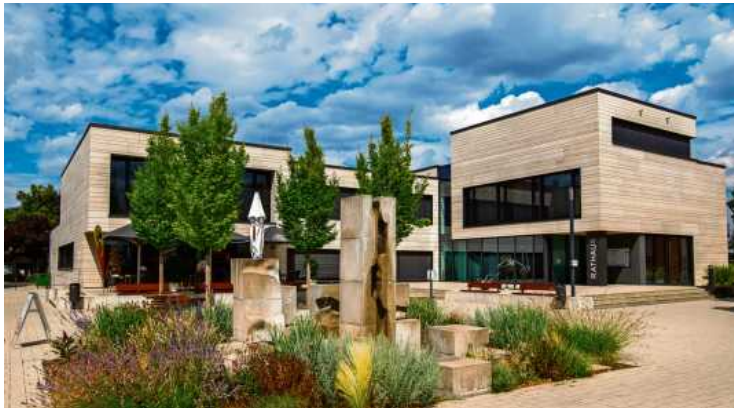
Das 1971 eingeweihte neue Rathaus wurde komplett renoviert und glänzt seit 2019 nach dem Umbau mit einer neuen, modernen Fassade.

Mit Beginn des 16. Jahrhunderts erlebte Pleidelsheim einen großen wirtschaftlichen Aufschwung.