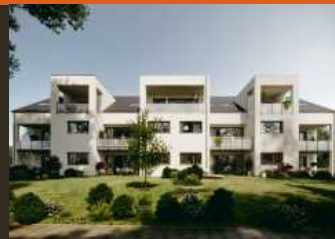
Bietigheim-Bissingen, Birkenweg 10