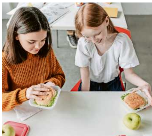
Ein vollwertiges Pausenbrot sorgt für langanhaltende Konzentration.

L ernen verbraucht Energie. Damit diese zur Verfügung steht, sind ausgewogene und regelmäßige Mahlzeiten wichtig. Um solche zu gewährleisten, gibt es ein paar Leitfäden, die helfen, den Pausensnack gesund und vollwertig zu gestalten. Süße Fertigprodukte sind bei Kindern oftmals sehr beliebt. Allerdings führt der hohe Gehalt an Einfachzucker dazu, dass der Blutzuckerspiegel so rasch in die Höhe schnell, wie er anschließend wieder absinkt. Zunächst übersprudelnde Energie mit einem anschließenden Leistungs- und Konzentrationstief sind die Folgen. Damit der Blutzucker langfristig konstant bleibt, sollte daher eher auf komplexe Kohlenhydrate gesetzt werden, wie sie zum Beispiel in Vollkornprodukten zu finden sind. Auch der Zuckergehalt in frischem Obst ist nicht mit Industriezucker vergleichbar und wird im Körper anders verarbeitet. Sowohl Vollkornprodukte als auch Obst und Gemüse liefern wichtige Vitamine und Mineralstoffe. Zusätzlich sind sie aufgrund ihres Ballaststoffreichtums gut für die Darmtätigkeit. Ein Schultag beginnt früh und so mancher ABC-Schütze mag um diese Zeit noch nichts zu sich nehmen. Zumindest eine Kleinigkeit sollte es aber doch sein und das Pausen-