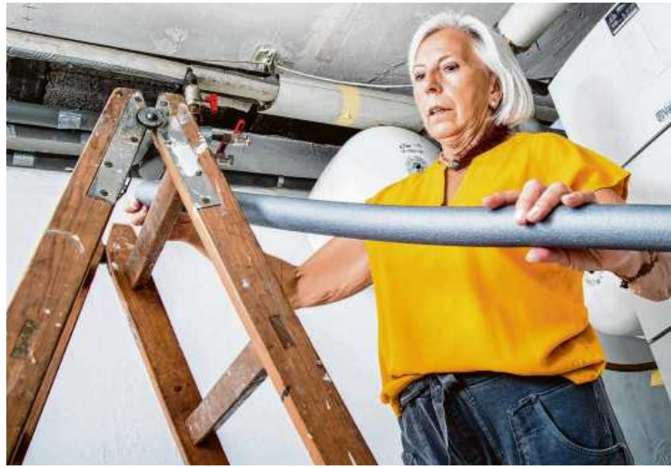
Beim Eigentümerwechsel eines alten Gebäudes besteht eine Sanierungspflicht für Käufer und Erben. Dazu zählt auch das Dämmen von Rohrleitungen.

Wer einzelne Modernisierungsmaßnahmen plant, wie etwa den Heizungsaustausch oder die Sanierung der Gebäudehülle, muss die Förderung beim Bundesamt für Wirtschaft und Ausfuhrkontrolle (Bafa) beantragen. Wer das komplette Gebäude sanieren möchte, erhält seine Förderung in