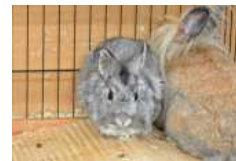
Harley und Harry wollen auf jeden Fall zusammenbleiben.

In Teilausgaben der heutigen Ausgabe finden Sie folgende PROSPEKTBEILAGEN