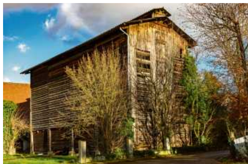
Der Tabakrockenschuppen ist eine reine Holzkonstruktion mit Dachlüfterhaube.

Der Anbau der Kulturpflanze prägte die Entwicklung der Gemeinde über drei Jahrhunderte entscheidend mit.