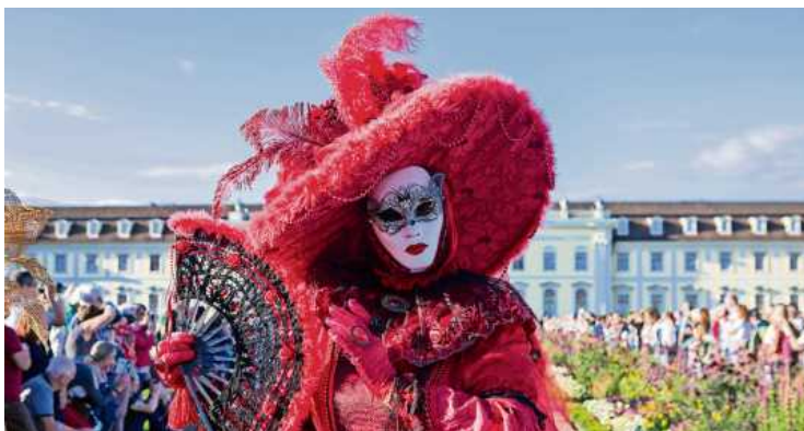
In Ludwigsburg ist vom 9. bis 11. September wieder Venezianische Messe.