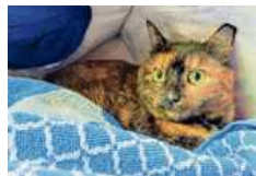
Mich sucht als Einzelkatze ein Zuhause in einer Wohnung.