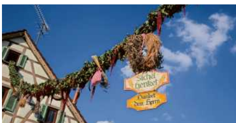
Vereine und Gemeinde freuen sich auf viele Besucher der Mundelsheimer Sichelhenket.

Feiern – genießen – wohlfühlen ist das Motto am 27. August und 28. August 2022 rund um den Mundelsheimer Marktplatz, wenn die Gemeinde und die Vereine zur traditionellen Sichelhenket einladen. Bereits zum 24. Mal ist das Fest der guten Unterhaltung mit schwäbischen Spezialitäten aus Küche, Keller und vom Grill der Höhepunkt im Terminkalender der Mundelsheimer und lockt auch zahlreiche Besucher aus Nah und Fern in die Weinbaugemeinde.