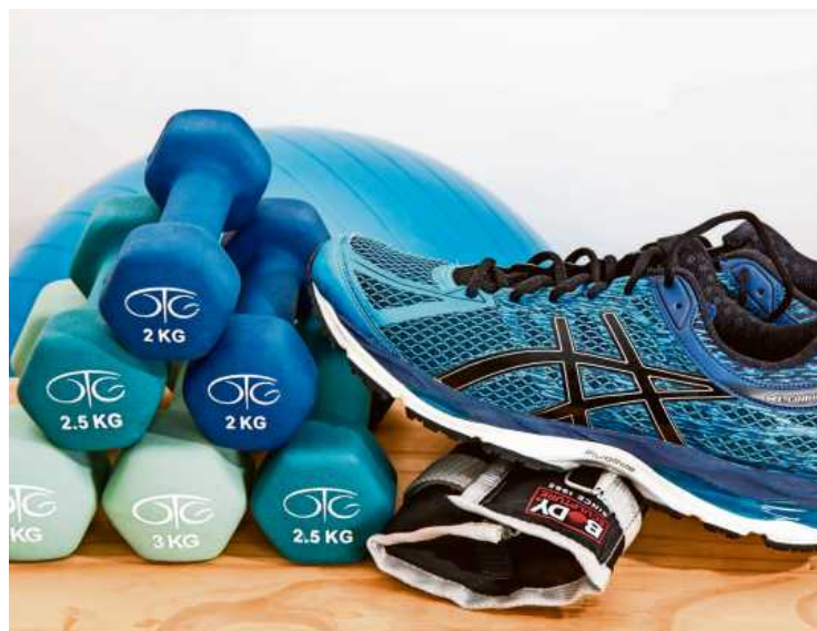
Im stressigen Alltag ist die richtige Sportart mit regelmäßigen Sporteinheiten umso wichtiger. Mit der passenden Ausrüstung macht es noch mehr Spaß.