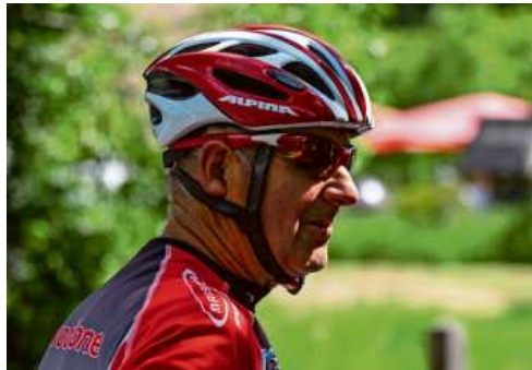
In jedem Alter kann man mit dem Sport anfangen.