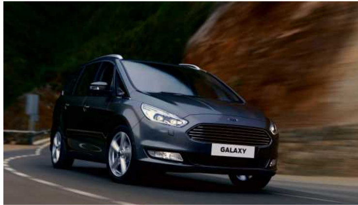
Der Ford Galaxy bietet viel Platz – wie schlägt sich der Van sonst als Gebrauchter?

Die Erwartungen an ein Auto, das auch Familien auf Reisen begleiten soll, erfüllt der Galaxy III hinsichtlich Raumangebot und der Sitzmöglichkeiten, aber auch