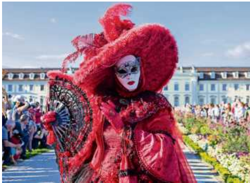
Prachtvolle Kostüme sind zu bewundern.

Etwas länger als die gewohnten zwei Jahre, die üblicherweise zwischen zwei Venezianischen Messen liegen, mussten die zahlreichen Fans warten; nach der pandemiebedingten Absage 2020 geht das farbenfrohe Spektakel vom 9. September bis 11. September 2022 wieder auf dem Marktplatz an den Start.