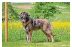
Robby braucht lange Spaziergänge.

Kleintiere: Die Zwergkaninchen Tanja (kastriert, 2021 geb.) und Berry (kastriert, 2021 geb.) suchen nur gemeinsam ein neues Zuhause. Für den Winter wäre ein Innengehege nötig, da Berry sonst Augenprobleme bekommt. Tanja hat gelegentlich eine empfindliche Verdauung. Beide Hoppler benötigen entsprechend mehr Pflege, sind aber sehr zutraulich und lieb. bz