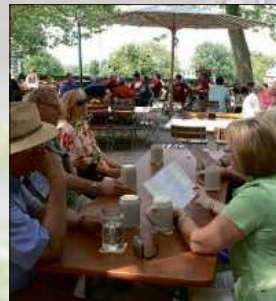
Auch im Biergarten sollte man auf die Nachbarn Rücksicht nehmen.