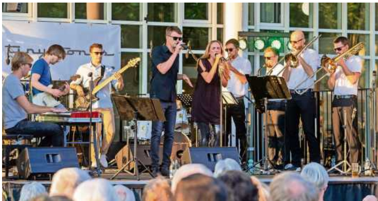
Spielen traditionell das Abschlusskonzert im Bürgergarten: Die Band Tiny Tones

Nach coronabedingter Zwangspause ist es endlich wieder soweit und die Tiny Tones sind zurück im Bürgergarten. Laut Mitteilung der Stadt Bietigheim-Bissingen könnte auch innerhalb der Band die Vorfreude kaum größer sein, dass sie endlich an altbekannter Wirkungsstätte wieder vor Live-Publikum auftreten können. Daher wird es als Abschluss des