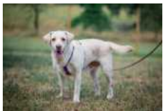
Mia kommt gut mit Menschen und Hunden zurecht.