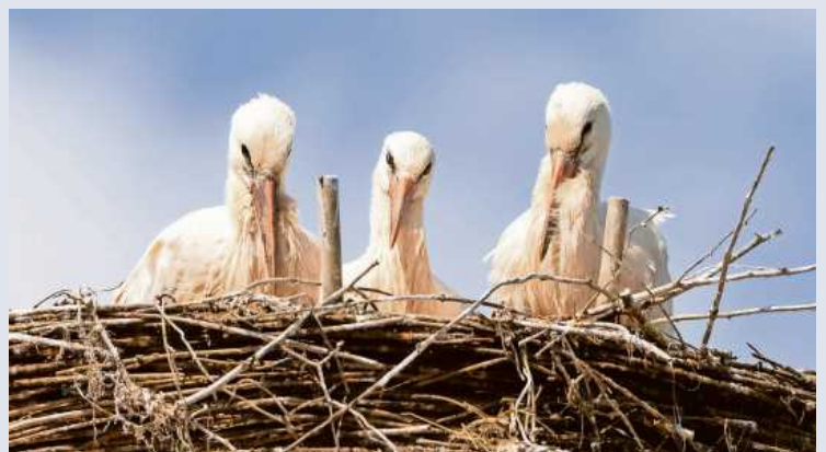
Auf dem Dach des Museums im Schloßle hat ein Storchennest drei Jungstörche großgezogen. Fotos von ihrer Entwicklung zeigt das Museum in seiner Ausstellung „Storchengeschichten“.

Niedergelassen und gebrütet hat dann ein Pärchen, es war jedoch heftigen Attacken und Angriffen anderer Störche ausgesetzt, trotzdem wurden zwei Storchenkinder geboren, die jedoch den Kälteeinbruch im April nicht überlebten.