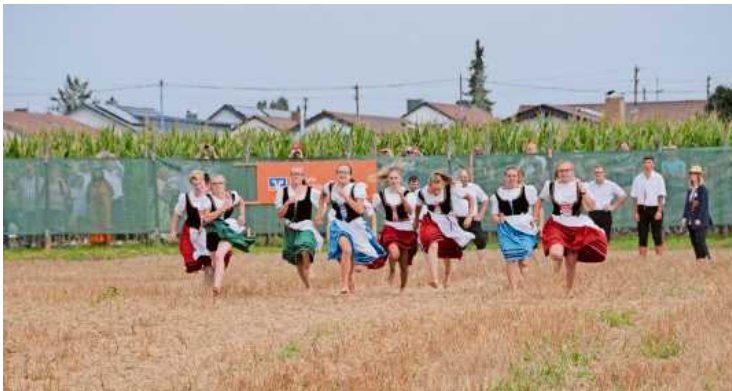
Ein Höhepunkt beim Schäferlauf ist der Wettlauf der jungen Männer und Frauen aus Schäferfamilien barfuß über das Stoppelfeld.

Seit Ende 2018 ist „die Tradition des Schäferlaufs und Schäferhandwerks in Markgröningen, Bad Urach und Wildberg“ als Unesco-Kulturerbe in das bundesweite Verzeichnis des Immateriellen Kulturerbes aufgenommen.