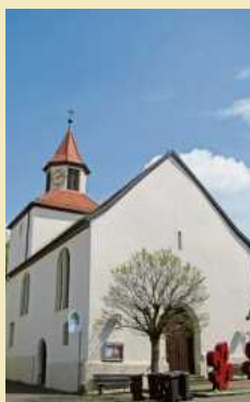
Die evangelische Martinskirche.

Weitere Informationen bei Gästeführer Hartmut Wilhelm, Telefon (07133) 5869 und online unter hawi43@web.de . bz