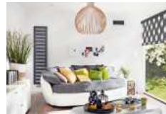
Durch den geregelten Luftaustausch hilft eine Wohnraumlüftung

Schlechte Luft in Innenräumen kann unserer Gesundheit schaden. Dies belegt nach Angaben des Lungeninformationsdienstes im Helmholtz Zentrum München eine aktuelle australische Studie. Ihr Ergebnis zeigt, dass Schadstoffe in der Raumluft über zehn Jahre hinweg zu einer Abnahme der Lungenfunktion beitragen. Ein regelmäßiger Luftaustausch kann die Schadstoffkonzentration deutlich verringern. Lüftungsanlagen sind dafür eine zuverlässige und energieeffiziente Lösung. Die Geräte tauschen die belastete, feuchte Raumluft automatisch gegen Frischluft aus und verhindern Schimmelbildung. Unter www.wohnungs-lueftung.de etwa gibt es weitere Informationen zur Systemtechnik. Durch die Filter werden Schadstoffe, Pollen und Feinstaub abgefangen. Sensoren überwachen Feuchte, CO 2 - und Schadstoffgehalt. djd