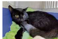
Ebly braucht viel Geduld und ein ruhiges Zuhause.