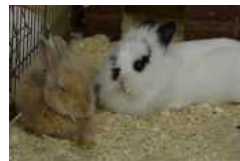
Tanja und Berry suchen nur zusammen ein neues Zuhause.

In Teilausgaben der heutigen Ausgabe finden Sie folgende