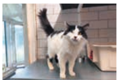
Kätzin Morgan sucht ein neues Zuhause als Einzelkatze.