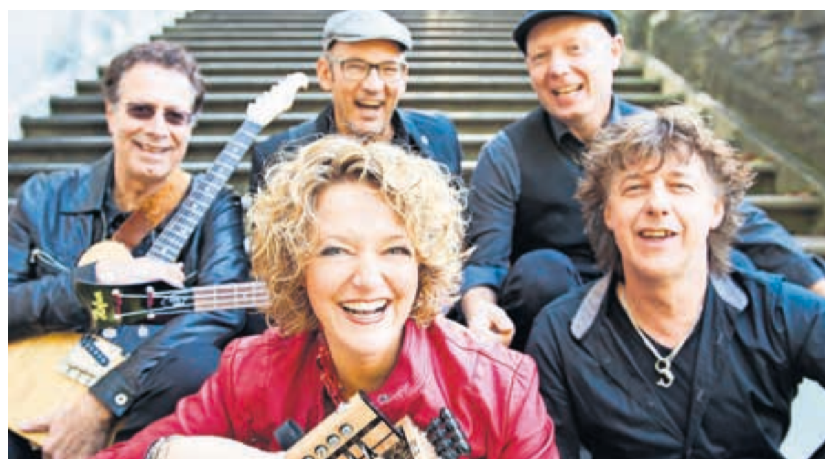
Die Band „Zydeco Annie & The Swamp Cats“ spielen im Bürgergarten.

Louisiana, als Teil der Südstaaten der USA, ist geprägt von großen Sümpfen und Bayous, bekannt durch den Mississippi und natürlich durch New Orleans: dorthin entführt die Band „Zydeco Annie & The Swamp Cats“ mit ihren selbstkomponierten Songs am Freitag, 12. August das Publikum mit ihrem Konzert im Bürgergarten. Verführt durch die reichhaltige musikalische Kultur von New Orleans, gepaart mit den eigenen Wurzeln und zahlreichen Erfahrungen, wollen die Musiker „ein Feuerwerk an farbenfroher Lebenslust, sehnsuchtsvoller Hingabe und pulsierender Energie“ entfachen, wie es in der Ankündigung der Stadt Bietigheim-Bissingen heißt.