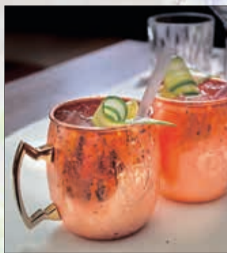
Gin mit Gurke ist ein beliebtes Getränk.