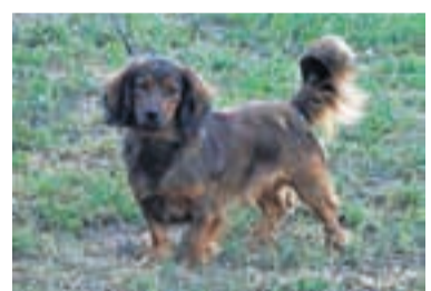
Zic möchte Dackelfreunde mit viel Zeit für ihn.