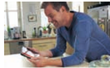
Stromverbrauch digital prüfen.

Region. Gut die Hälfte der Menschen in Deutschland (50,4 Prozent) wünschen sich mehr Transparenz zum eigenen Stromverbrauch. Besonders groß ist das Informationsbedürfnis bei den 18- bis 29-Jährigen: In dieser Altersgruppe geben sogar 69,9 Prozent an, über mehr Einblicke verfügen zu wollen. Zu diesen Ergebnissen kommt eine repräsentative Civey-Umfrage im Auftrag von E.ON. Wer wissen will, wo und wann wie viel Strom im Haushalt genutzt wird, benötigt dazu einen digitalen Stromzähler sowie als Hardware beispielsweise einen speziellen Stecker und die dazu passende E.ON Smart Control App. So werden visuell aufbereitete, leicht verständliche Analysen möglich, um den individuellen Verbrauch zu optimieren und Abschlagszahlungen besser in der Balance zu halten. djd