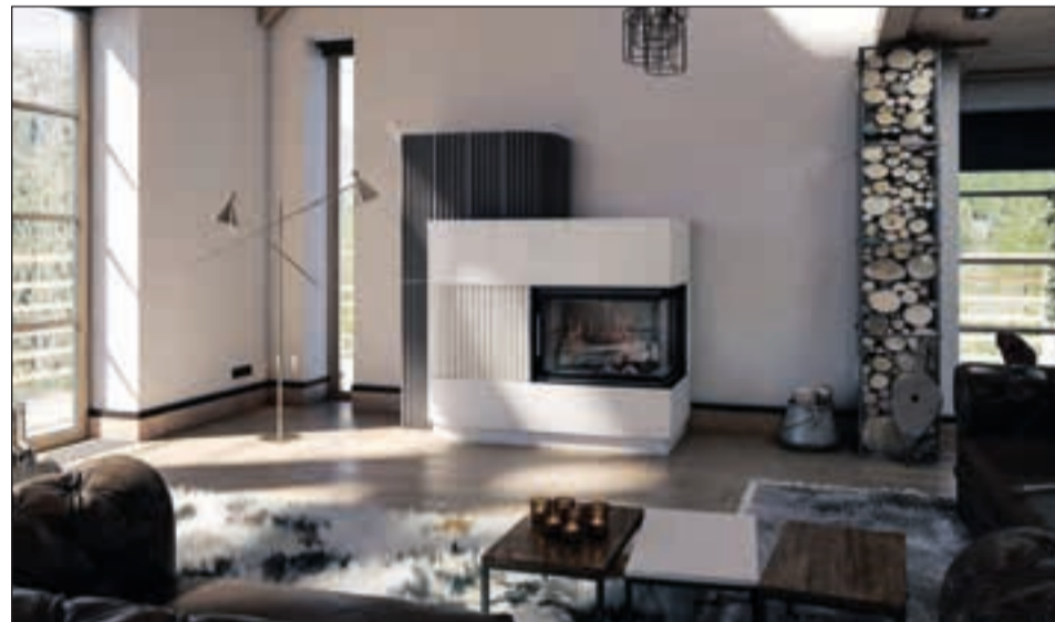
Die Nachfrage nach Holzfeuerstätten ist derzeit drei- bis viermal größer als noch vor einem Jahr.