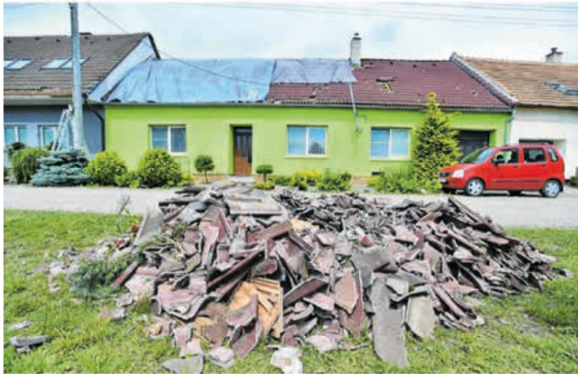
Auch der Zustand des Daches sollte regelmäßig überprüft werden. Kommt es bei einem Sturm zu Schäden, zahlt die Versicherung nur, wenn das Dach zuvor sorgfältig gewartet wurde.