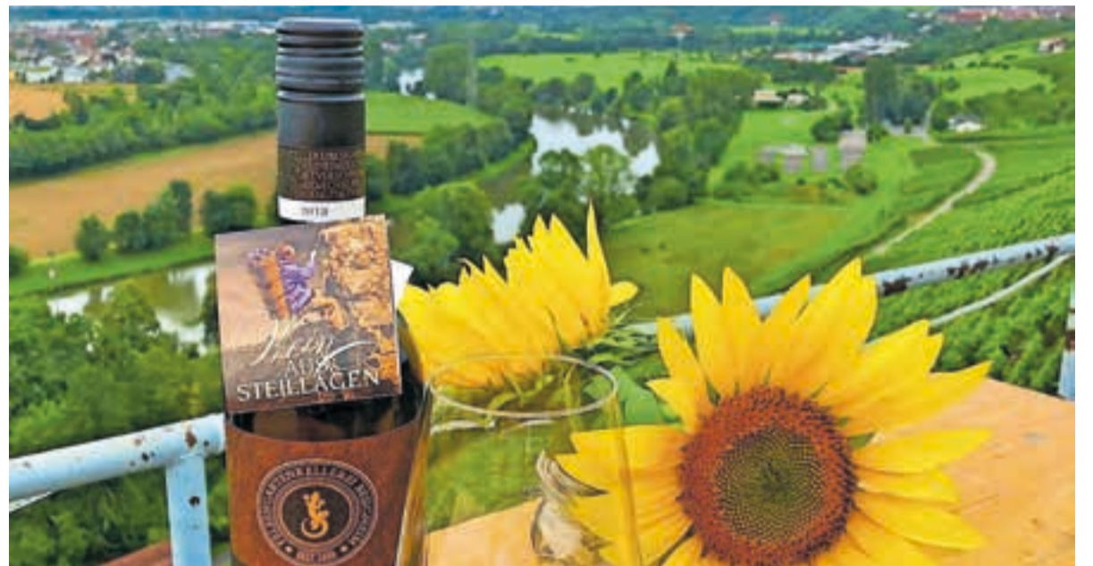
Ein besonderes Ambiente zum Feiern und Genießen bietet der Ausblick weit über das Neckartal von Kleiningersheim aus.

In diesem Jahr erwartet die Gäste am Samstag, 13. August ab 16 Uhr und am Sonntag, 14. August ab 11 Uhr an den Ständen der Weingärtnergenossenschaften aus Hessigheim und dem Stromberg/Zabergäu sowie den lokalen Weingütern Bento („Der Franzose vom Neckar“), Fink, Csicsai, Velte und dem Weingut Bähr (Erligheim) ein breites Angebot an ausgesuchten Weinen und dazu passend frisch zubereitete Speisen. Neben den Klassikern wie Pommes, Rote Wurst, Original Thürin-