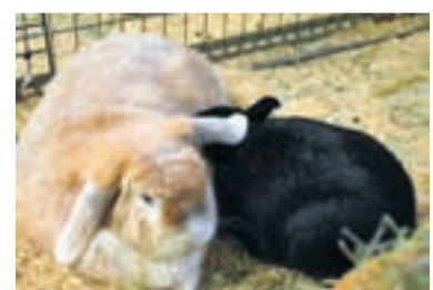
Charly und Gavin suchen nur zusammen ein neues Zuhause.

In Teilausgaben der heutigen Ausgabe finden Sie folgende PROSPEKTBEILAGEN