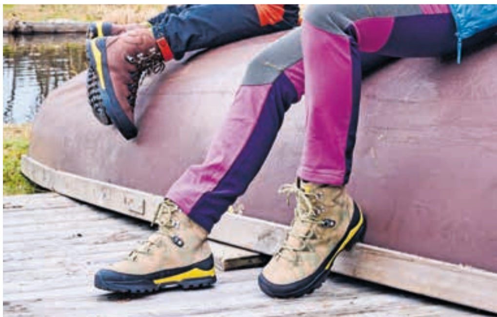
Die idealen Wanderschuhe für den Genuss-Wandertag auf dem 3B-Rundwanderkurs: Die Modelle „Bergkomfort“ bieten Schutz, Halt und Komfort.

Bietigheim-Bissingen. Barfuß laufen nur mit Schuhen - diese Kern-Philosophie verfolgt die Bär GmbH erfolgreich seit 1982. Wie das geht? Mit Bär ist das selbst in Wanderschuhen ganz einfach: Die Bär-Schuhe orientieren sich an unserer natürlichen Fußform und bieten hundertprozentige Zehenfreiheit. Dadurch können sich die Zehen vor allem beim Abrollen frei bewegen und spreizen. So entsteht ein Gefühl wie beim Barfußlaufen. Dieser Effekt wird durch das Bär-Nullabsatz-Konzept unterstützt. Damit kommt die Wirbelsäule in ihre natürliche Balance und das Körpergewicht wird gleichmäßig auf den ganzen Fuß verteilt. Das ist auch gerade beim Wandern wegen der Trittsicherheit und dem Schutz vor dem Umknicken ein wichtiger Aspekt. Das Wichtigste beim Wandern ist das richtige Schuhwerk. Mit dem Modell Bergkomfort von Bär wurde ein Wanderschuh und -stiefel entwickelt, der Schutz, Halt und Komfort bietet und jede Wanderung zum Genuss macht. Der Wanderstiefel Bergkomfort wurde von der Zeitschrift Wander-