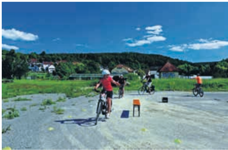
Der Fahrspaß kommt neben den Übungen zur Verkehrssicherheit bei den Pedelec-Kursen nicht zu kurz.

Mit dem Projekt „radspaß – sicher e-biken“ verfolgt der Landkreis das Ziel, die Fahrsicherheit von Pedelec-Fahrerinnen und -Fahrern zu erhöhen. Besonders für Neulinge bieten sich die kostenlosen Kurse an – bei denen neben Übungen zur Fahrtechnik, Koordination und Verkehrssicherheit vor allem auch der Fahrspaß im Vordergrund steht. Laut Mitteilung des Landratsamts Ludwigsburg werden aktuell sechs Kurse im Landkreis angeboten.