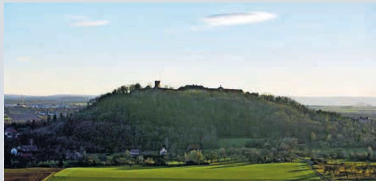
Der Hohenasperg zählt zu den einstigen frühkeltischen Machtzentren. Heute ist er durch die Festung Hohenasperg fast vollständig überbaut.