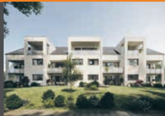
Birkenweg 10, Bietigheim-Bissingen