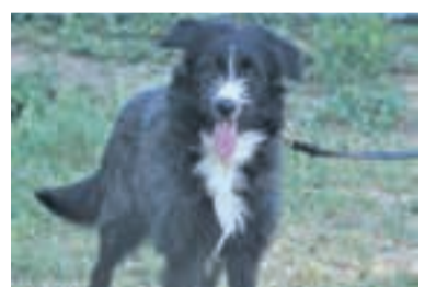
Amadeo braucht viel Beschäftigung.

higtem Gebiet. Kleintiere: Charly (Widder, kastr., 2018 geb.) und seine Herzdame Gavin (kastr., 2019 geb.) lernten sich im Tierheim kennen. Für beide war es Liebe auf den ersten Blick. Deshalb werden sie auch nur zusammen abgegeben. Die beiden Kaninchen suchen ein Außengehege, das auch groß genug für Charly ist. bz