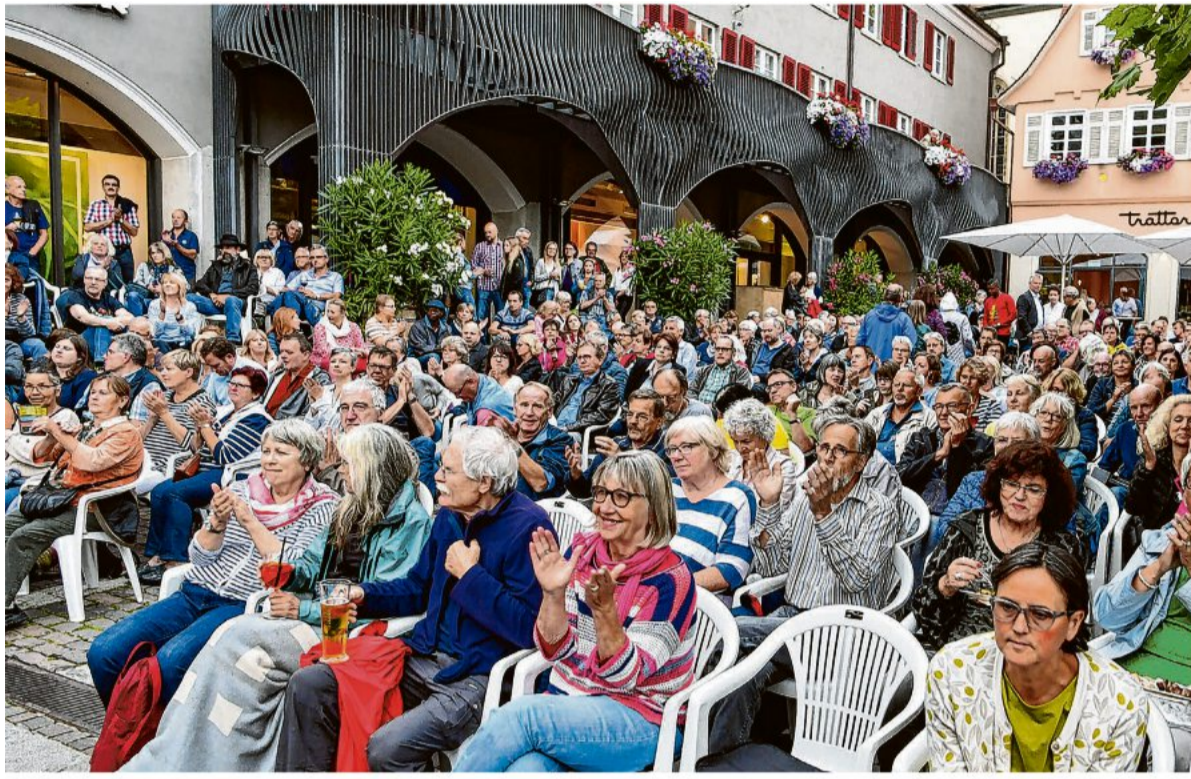
Gut besucht: Zuletzt fand das Best-of-Music-Festival auf dem Bietigheimer Marktplatz im Jahr 2019 statt.