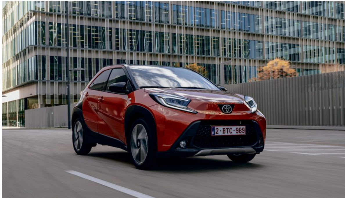
Kleinwagen mit SUV-Anleihen: Der neue Aygo X rollt als Crossover auf die Straße

Denn der Aygo X bietet ein paar Extras, die man in dieser Klasse eher selten findet – das farbige LED-Display hinter dem Lenkrad zum Beispiel, die Sitzheizung oder die LED-Scheinwerfer.