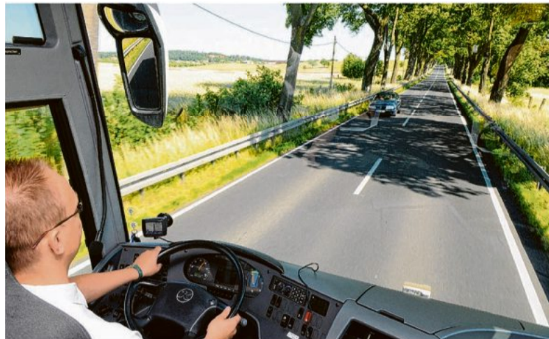
Der BDO sieht in naher Zukunft einen großen Fachkräftemangel im Bereich der BusfahrerInnen.

Prozent der privaten Busunternehmen unter FahrerInnenmangel. Das vergleichsweise hohe Durchschnittsalter der heutigen Fahrerinnen und Fahrer sowie die absehbare demografische Entwicklung und die allgemeine Ausbildungssituation in Deutschland werden diese Entwicklung in den kommenden Jahren sogar noch weiter verstärken. Davon gehen nach einer aktuellen Befragung des bdo 95 Prozent der Busmitelständler aus.