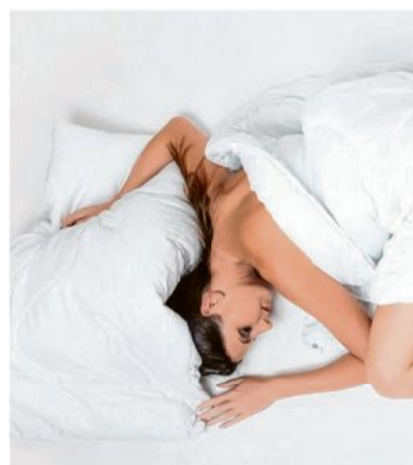
In der warmen Jahreszeit sollte man spezielle Sommerdecken benutzen.

Aber das muss nicht sein. Abhilfe bieten zum Beispiel spezielle Sommerdecken, die optimal auf die Klimasituation in der wärmeren Jahreszeit abgestimmt sind. Sie haben eine deutlich geringe-