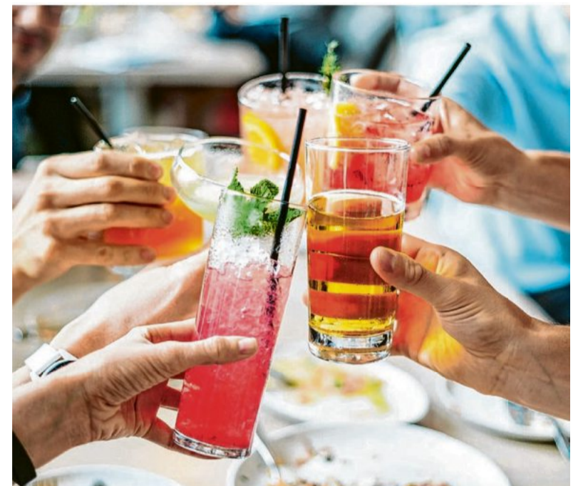
Am verkaufsoffenen Sonntag gibt es an der Löchgauer Strandpromenade auch Cocktails zum Genießen.

Strand geben wird. Unter dem Motto „Löchgauer Strandpromenade – Einkaufen und Genuss“ findet am 12. Juni von 13 bis 18 Uhr ein verkaufsoffener Sonntag in der Ortsmitte statt. Dazu wird fast die ganze Hauptstraße gesperrt. Die Gemeinde hat eine Hüpfburg für die Jüngsten und einen Partybus mit Getränken und Musik für die erwachsenen Besucher organisiert. Die teilnehmenden Löchgauer Gewerbetreibenden bieten ihren Kunden unter anderem kulinarische Spezialitäten oder Cocktails an.