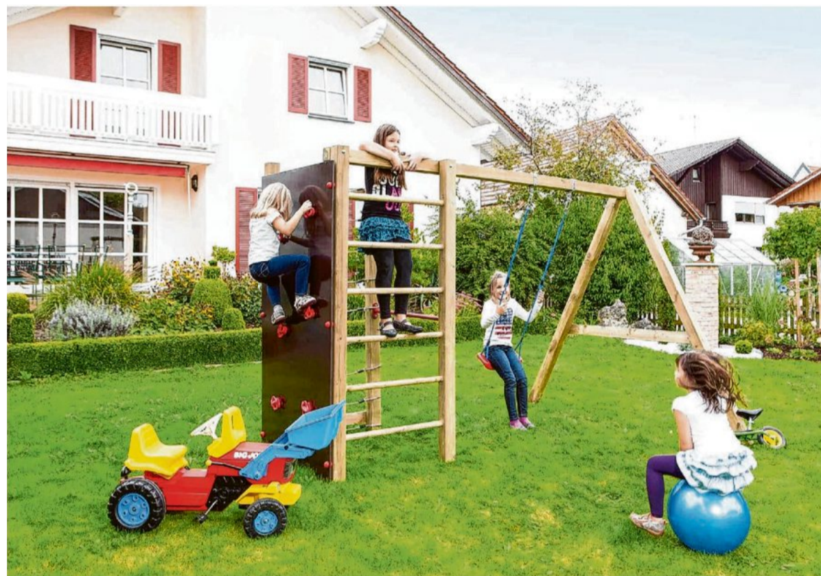
Ein Klettergerüst fördert die Motorik.

Trampolin garantiert für einen Ausgleich zum anstrengenden Schulalltag. Wenn die Temperaturen dann immer weiter steigen und sich alle nach einer erfrischenden Abkühlung sehnen, ist ein Swimmingpool genau das Richtige. Es gibt sie in unterschiedlichen Größen, mit viel oder wenig Fassungsvermögen. Manche Modelle wie beispielsweise Rundpools lassen sich ganz einfach im Garten aufstellen, ohne dass Arbeiten im Erdreich stattfinden müssen. Wenn Kleinkinder im Haushalt leben, sollte man eher auf ein Planschbecken zurückgreifen, in das man die Kleinen bedenkenlos reinsetzen kann. ips/dgd