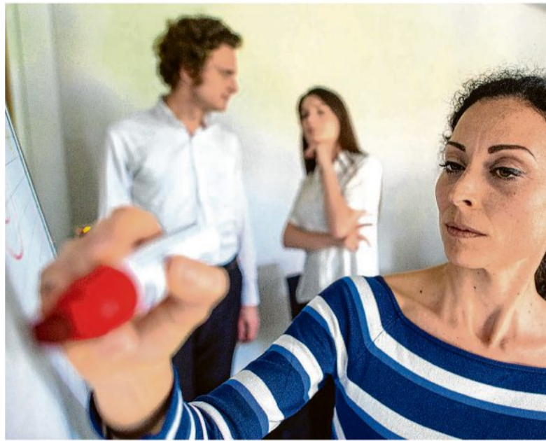
„Irgendwie ins Schnackchen kommen“: Neue Mitarbeiter stehen während der Probezeit unter Beobachtung. Aber auch sie selbst sollten die Gelegenheit nutzen und prüfen, ob das Unternehmen zu ihnen passt.