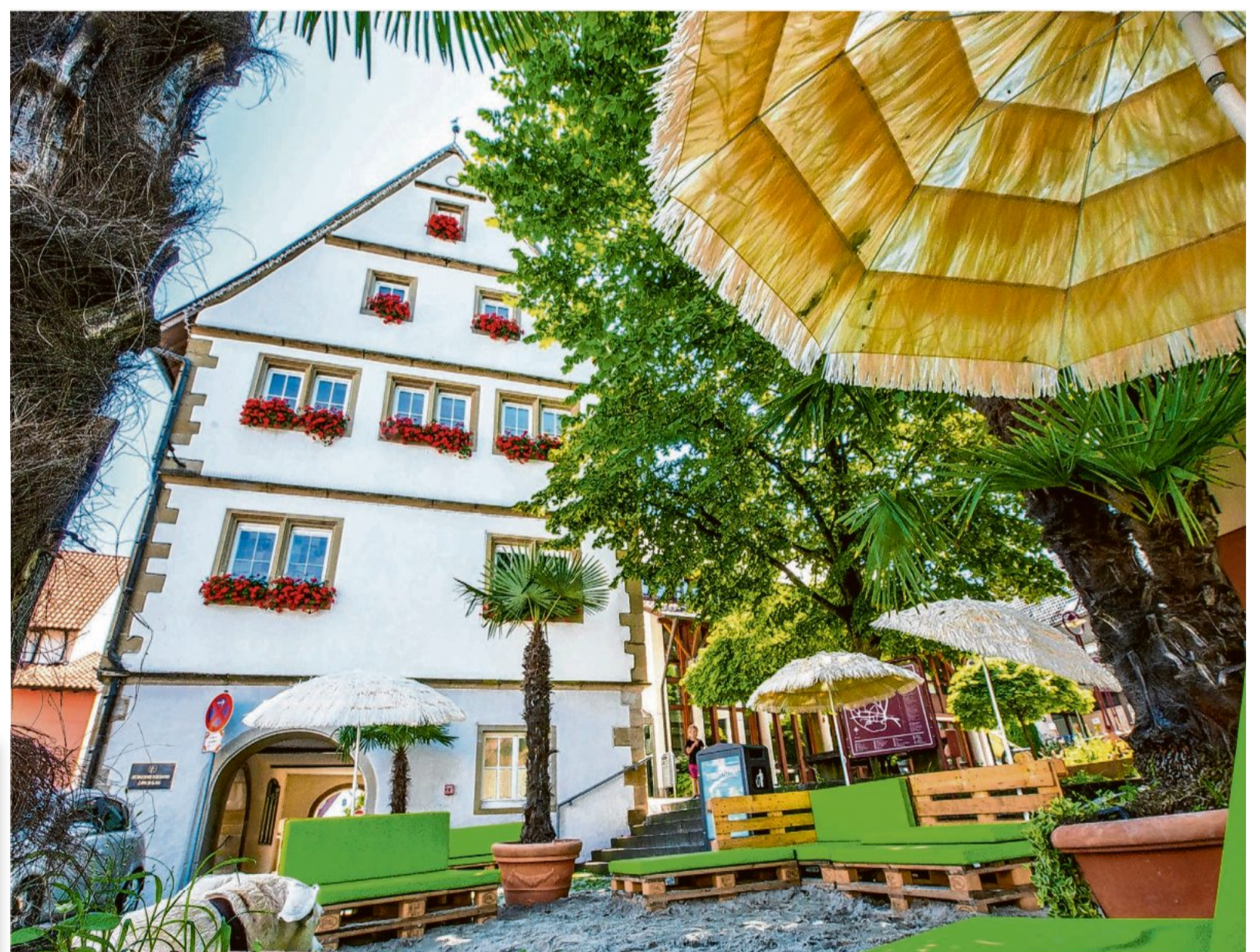
Südländisches Flair bietet die Ortsmitte von Löchgau mit ihrem Sandstrand, Sonnenschirmen, Palettenmöbeln und Palmen den ganzen Sommer über für die Löchgauer und Besucher der Gemeinde.