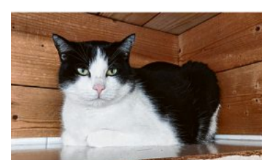
Günes sucht ein Zuhause als Einzelkater.

und zu auch seine Ruhe braucht. Er sucht ein Zuhause als Einzelkater, weil er mit Artgenossen nicht auskommt. Ansonsten ist er