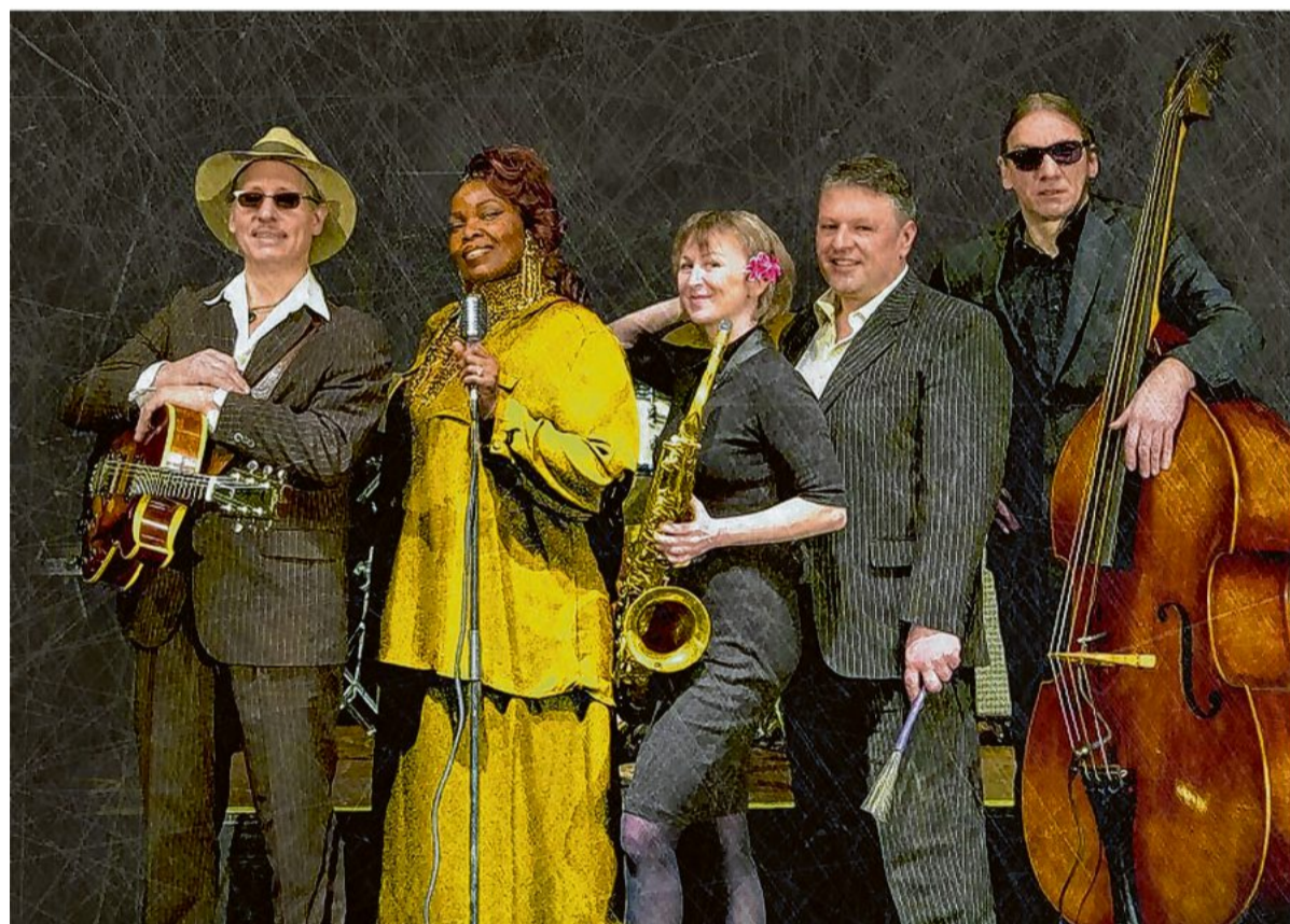
Zum Auftakt von Best-of-Music am Freitag, 15. Juli, bringen „The Ballroomshakers“ Swing und Rhythm & Blues der 40er- und 50er-Jahre nach Bietigheim.

Info Der Kartenvorverkauf für das Best of Music-Festival hat bereits begonnen. Vorverkaufsstellen sind die Tourist-Information in der Bietigheimer Altstadt und das Spillmann-Reisebüro am Bahnhof.