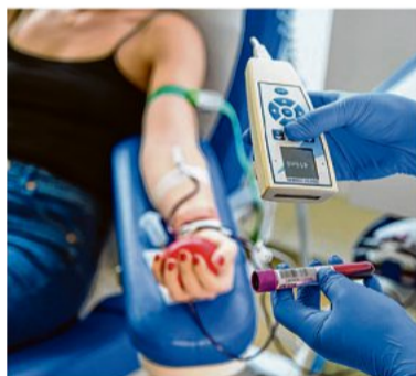
Blutspende in Walheim (Symbolfoto).

Walheim. Am Mittwoch, 1. Juni 2022 lädt der DRK-Blutspendedienst in der Zeit von 14.30 bis 19.30 Uhr in die Gemeindehalle Walheim, Weinstraße 18 zur Blutspende ein. Um gerade in Corona-Zeiten lange Warteschlangen vor der Blutspende zu vermeiden, bittet der DRK-Blutspendedienst darum, sich vorab unter dem folgenden Link https://terminreservierung.blutspende.de/m/walheim-gemeindehalle ein Zeitfenster zu reservieren. So kann jeder ohne Wartezeit und unter höchstmöglichen Sicherheits- und Hygienestandards Blut spenden. Informationen zu den aktuellen Schutzvorkehrungen der DRK-Blutspendetermine stehen unter www.blutspende.de/corona . Die DRK-Aktionsgemeinschaft Blutspende Walheim gibt nach der Spende zur Stärkung Lunchpakete aus. Spenden kann jeder gesunde Mensch ab 18 Jahren, Erstspende dürfen nicht älter als 65 Jahre sein. Damit die Spende gut übertragen wird, sollten die Spender über den Tag verteilt zwei bis drei Liter Flüssigkeit zu sich genommen haben. Zur Spende ist ein gültiger Lichtbildausweis und – falls vorhanden – der Spenderausweis mitzubringen.