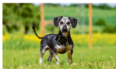
Das seidige, lange Fell von Till wird bald wieder nachwachsen.

und ihr Kumpel Fred (kast., 2013 geb.) sind freundliche und verschmüste Wohnungskatzen. Ihre Besitzerin hatte keine Zeit mehr für die beiden, deshalb brauchen sie jetzt ein Zuhause mit liebevoll-