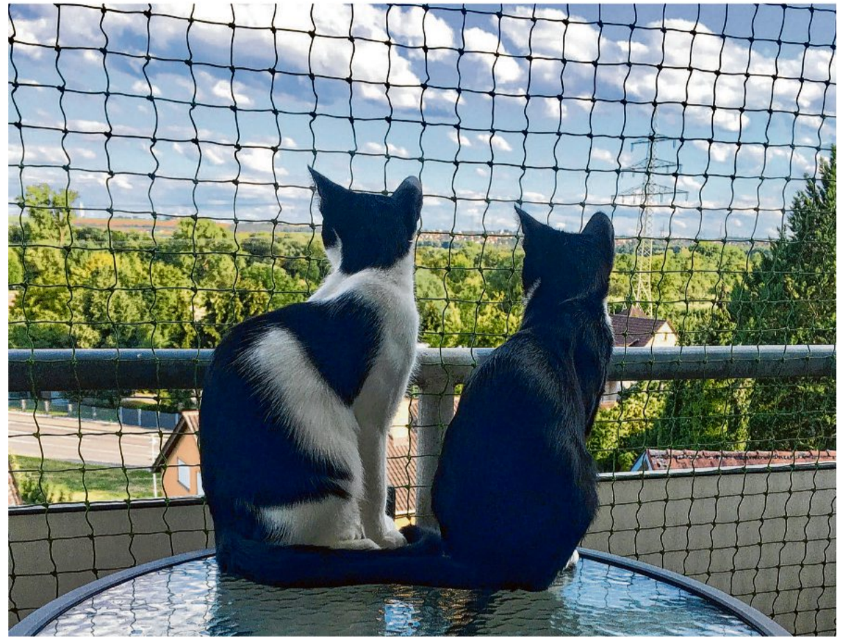
Katzen auf einem Balkon: ohne Netz lauert hier für die Tiere eine tödliche Gefahr.

schon ein Gartenstuhl, unter den sich das Tier bei zu viel Sonne verkriechen kann. dpa