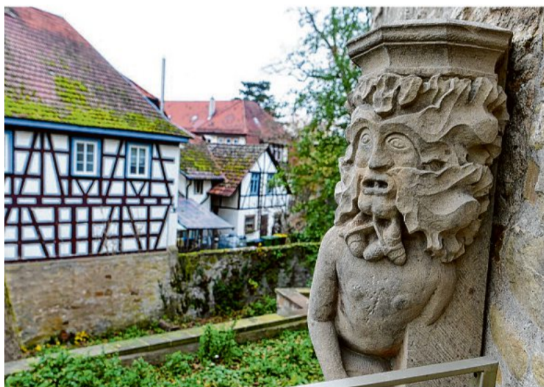
Das Klopferle am Sachsenheimer Wasserschloss ist eine alte Sagen-gestalt.

Die Sachsenheimer Sagengestalt „Klopferle“ ist ebenso Teil der Geschichte wie die evangelische Stadtkirche.