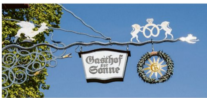
Die Zuversicht im Gastgewerbe steigt wieder.

Nach dem Wegfall der Corona-Auflagen zieht die Nachfrage im Gastgewerbe wieder deutlich an. Das geht aus einer aktuellen Umfrage des Deutschen Hotel- und Gaststättenverbandes (Dehoga Bundesverband) hervor, die der Verband in Berlin veröffentlicht hat. Danach lag der Umsatz im April zwar immer noch 17,0 Prozent unter dem Vorkrisenniveau im April 2019. Im Vormonat März fiel der Verlust mit einem Minus von 27,5 Prozent gegenüber März 2019 jedoch noch viel gravierender aus. Insbesondere bei der privaten Nachfrage geht es laut den Umfrageergebnissen aufwärts. Den positiven Trend belegt auch das Ostergeschäft, das in weiten Teilen der Branche erfreulich verlief. 43,2 Prozent der Unternehmer beurteilen es als gut bis sehr gut, 33,2 Prozent zeigen sich zufrieden. „Im Gastgewerbe wächst die Zuversicht“, sagt Dehoga-Präsident Guido Zölllick. „Die Streichung der Corona-Maßnah-