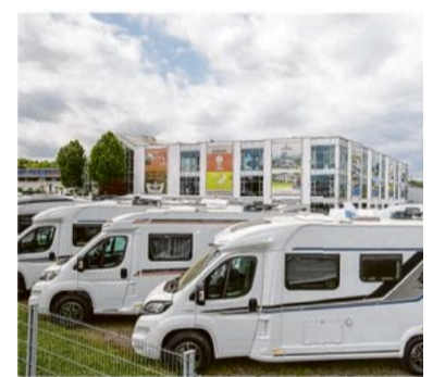
Große Auswahl an Reisemobilen und Wohnwagen bei Herzog.

Eine Besonderheit des Unternehmens ist es, dass für Besitzer von Wohnwagen und Reisemobilen ein gesicherter Abstellplatz gleich in der Nähe des Firmengeländes angeboten wird. Auf Service legt man im Unternehmen