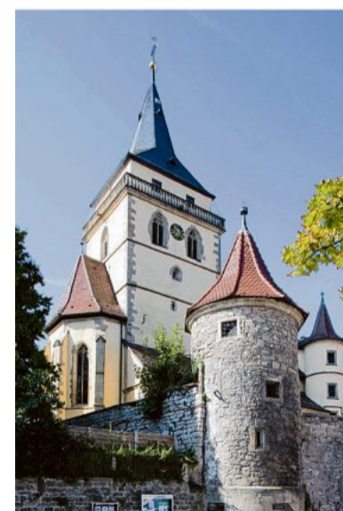
Die evangelische Stadtkirche wird aktuell renoviert.

Die evangelische Stadtkirche St. Fabian und Sebastian wurde urkundlich erstmals 1265 erwähnt. Der spätgotische Umbau der Kirche, wie sie sich heute präsentiert, erfolgte 1484. Weitere Umbauten fanden um 1600 und im 18. Jahrhundert statt. Renoviert wurde die Kirche 1953 bis 1955. Nach der letzten Außenrenovierung 1984 finden aktuell neue Renovierungsarbeiten an der Kirche statt. bz