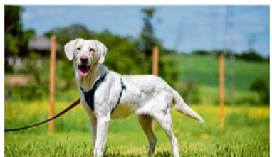
Emma liebt ausgiebige Spaziergänge.

Hunde: Emma (kast., 2019 geb.) ist eine sehr aktive und gelehrige Hündin, die sich mit allen Hunden versteht, ausgiebige Spaziergänge liebt und noch viel lernen möchte. Till (kast., 2019 geb.) hat eigentlich ein sehr langes, seid-