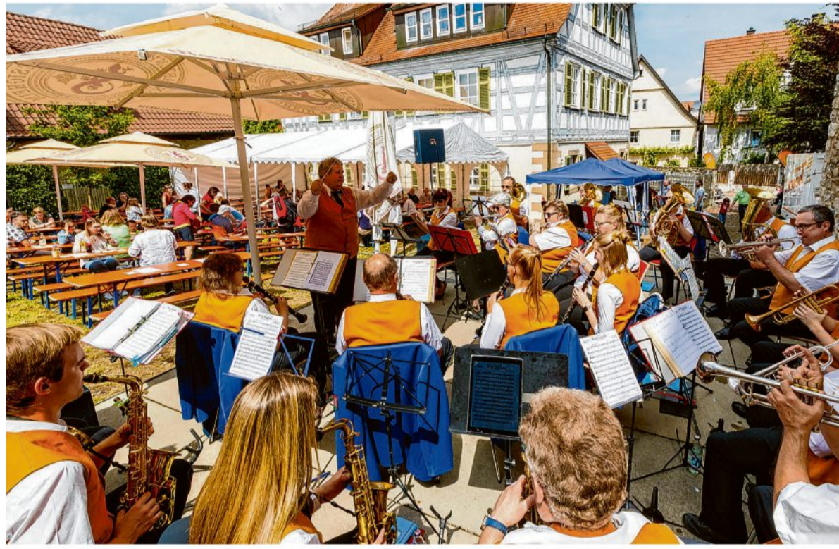
Das traditionelle Steinhausfest im Steinhausgarten mit der Stadtkapelle Besigheim.

Ab 11 Uhr spielt die Stadtkapelle Besigheim zum Frühschoppen auf. Und das Steinhaus ist ganz im Zeichen eines „Tages der offenen Tür“ der Musikschule geöffnet. Von 9.45 bis 18 Uhr ist Musik im Steinhausgarten, im Kleinen Saal und in verschiedenen Musikzellen geboten. Mit Vorspielen, offenem Unterricht, Begegnungen und besonderen Darbietungen kann das Unterrichtsangebot und das Steinhaus erkundet werden. Mit einem umfangreichen Programm stellen sich die Lehrkräfte und natürlich auch Schülerinnen und Schüler aus den einzelnen Unterrichtsklassen vor. Man kann zuhören, die Musik genießen oder sich für das Lernen