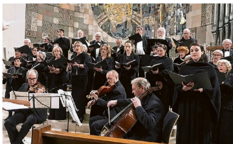
Die Stuttgarter Choristen treten in der evangelischen Stadtkirche in Sachsenheim auf.