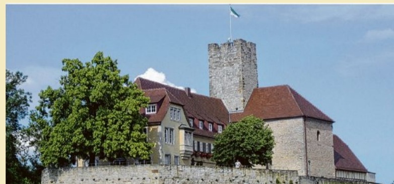
Die Grafenburg in Lauffen.

Am Sonntag, 29. Mai, macht der überregional bekannte Burgenforscher Nicolai Knauer eine öffentliche Führung durch die Burg der Grafen von Lauffen. Die Grafen - auch Popponen genannt - waren bis zu ihrem Aussterben männlicherseits um 1219 als Amtsträger des Reiches ein einflussreiches Adelsgeschlecht im Neckartal von Lauffen bis hin nach Heidelberg.