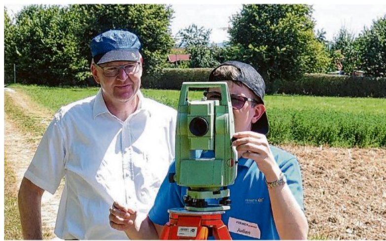
Ein Praktikum im Fachbereich Vermessung kann Lust auf den Beruf als Vermessungstechniker/-in machen.

Das Onlineportal wurde mit der Agentur für Arbeit, der IHK, den Schulen und der Firma Kon-