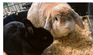
Charlie und Gavin möchten nur gemeinsam ein neues Zuhause.

Gavin (kast., 2019 geb.) verstehen sich großartig und suchen nun gemeinsam ein neues Zuhause, am besten in Außenhaltung,