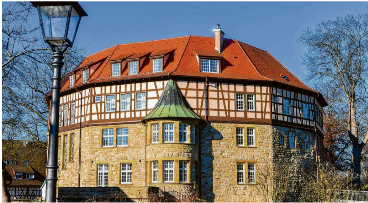
Das Wasserschloss aus dem 15. Jahrhundert ist eng mit der Geschichte Sachsens verbunden und strahlt nach der Renovierung in neuer Pracht.

Sachsenheim ist nicht nur eine Stadt im Ganzen, sondern besteht aus sechs Stadtteilen, die alle zusammen genommen die besondere Vielseitigkeit der „Wohlfühlstadt“ ausmachen. Dazu gehören Groß- und Kleinsachsenheim, Hohenhaslach, Ochsenbach, Spielberg und Häfnerhaslach, die sich 1971 zur Stadt zusammenschlossen haben, liegen an der Einmündung des Kirbachs in die Metter, die in Bietigheim-Bissingen in die Enz mündet. Die Ortsteile Hohenhaslach, Ochsenbach, Spielberg und Häfnerhaslach, die sich 1973 der Stadt anschlossen, liegen im Kirbachtal im Stromberg. Ein großer Teil des Stadtgebietes gehört zum Naturpark Stromberg-Heuchelberg. Aufgrund dieser Ausdehnung bietet Sachsenheim ländlichen Charakter ebenso wie urbanes Flair. Historische Fachwerkhäuser und ein Wasserschloss als Wahrzeichen auf der einen Seite, auf der anderen Seite ein wirtschaftsstarker Standort mit dem Gewerbepark Eichwald.