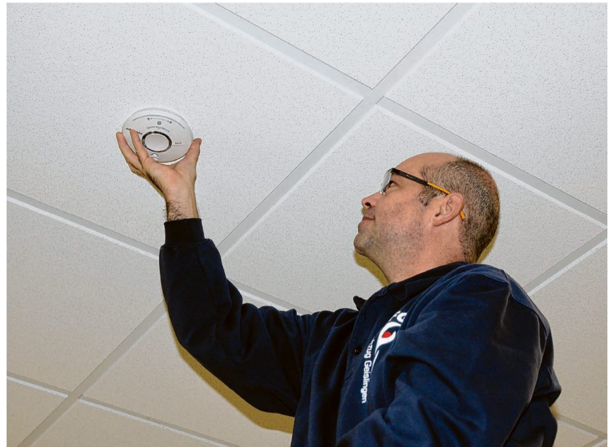
Rauchmelder: Die Geräte müssen möglichst zentral an der Zimmerdecke befestigt werden, und zwar mit einem Abstand von mindestens einen halben Meter zu Wänden und Ecken.

nur den Deckel vom Kochtopf hebt oder den heißen Ofen aufmacht.“ dpa