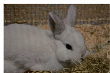
Felix gehört zu Bruder Sky.

Kleintiere: Die beiden Kaninchenbrüder Felix (smokefarbend, kastriert, August 2021 geb.) und Sky (rot/weiß) sind nur Innenhaltung gewohnt und müssten auch bis zum Frühjahr im Innengehege bleiben. Danach können sie an das Leben im Außengehege gewöhnt werden. Felix und Sky werden nur zusammen abgegeben. Kontakt: www.tierheim-lb.de .