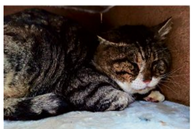
Teddy hat schon viel erlebt.

Teddy (Kater kastriert, 2011 geb.) hat schon sehr viel mitgemacht. Er ist ein schüchternder, sensibler, aber freundlicher Kater, der sich gern streicheln lässt. Er sucht auf Grund seiner Vorerkrankungen und humpelnden Gang ein neues Zuhause ausschließlich als Wohnungskater, am besten mit einem schönen gesicherten Balkon oder einem großen Gehege.