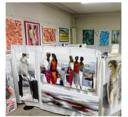
Die ausgestellten Bilder können gemietet werden.