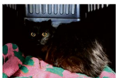
Fairy ist sehr schüchtern.

zin kastriert, 2021 geb.) und ihr Bruder Fabrice sind noch sehr schüchtern. Aber sie lassen sich schon streicheln. Bis sie Vertrauen fassen, wird es aber noch eine Weile dauern. Sie brauchen ein gemeinsames, ruhiges Zuhause bei geduldgigen Menschen. Nach der Eingewöhnung sollten sie die Möglichkeit zum Freigang in verkehrsberuhigtem Gebiet haben.