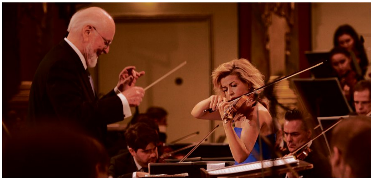
Anlässlich seines anstehenden 90. Geburtstag auf der großen Leinwand: der Komponist John Williams mit den Wiener Philharmonikern.

Das weltbekannte Orchester spielt Themen aus großen Kinoklassikern: E.T., Der Weiße Hai,