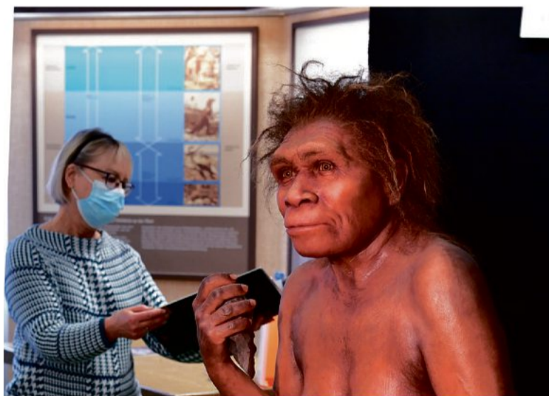
So könnte die Urmensch-Frau, deren Schädel 1933 entdeckt wurde, ausgesehen haben.

Das Urmensch-Museum wurde 1968 im sogenannten Hans-Trautwein-Haus eingeweiht. Hier erfährt man alles Wissenswerte zum Schädelfund des „Homo Steinheimensis“ sowie über die Entwicklung des Frühmenschen und die Großsäuger der damaligen Tierwelt.