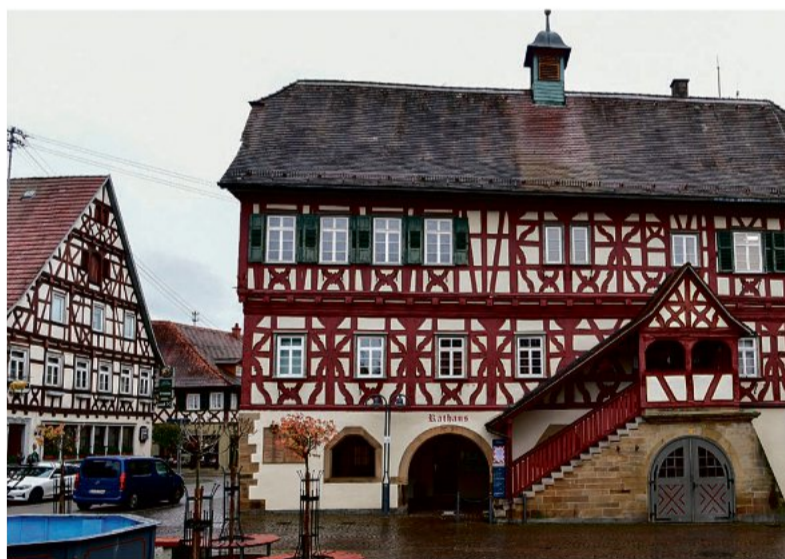
Auf dem steinernen Sockel von 1580 wurde 1686 nach einem großen Brand das Rathaus neu aufgebaut.

Von Schädelfragmenten bis Salzhandel - die Geschichte Steinheims ist vielfältig und überall präsent.