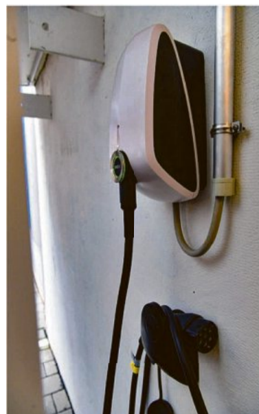
Wallbox für E-Fahrzeuge in der Garage.

baulichen Brandschutz zu überprüfen. Gerade bei älteren Bestandsgebäuden erreicht dieser nicht das aktuell von Bauordnungen verlangte Niveau. Auch wenn formal keine Anforderungen an die Verbesserung des Brandschutzes bestehen, sollten diese im Eigeninteresse verbessert werden.“ BVS