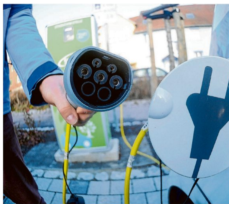
Bei der Anschaffung von E-Auto und Ladestation muss auch der Brandschutz bedacht werden.