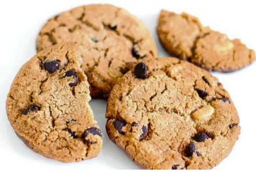
Kekse: rohen Teig, – egal, ob für Kekse oder anderes Backwerk – nicht roh verzehren, sondern stets gut durcherhitzen.

B acken macht Spaß: Für viele Hobbybäckerinnen und -bäcker gehört das Naschen von rohem Teig dazu. Doch roher Teig birgt Gefahren. Mehl kann Mikroorganismen, sogenannte Shigatoxin-bildende Escherichia Coli kurz STEC enthalten, die beim Menschen zu Magen-Darm-Beschwerden und weiteren Komplikationen führen können. Daher gilt: Finger weg vom rohen Teig! Seit einigen Jahren findet sich auf den allermeisten Mehl-Haushaltspackungen der Hinweis „Mehle und Teige sind nicht zum Rohverzehr bestimmt und müssen stets gut durcherhitzt werden.“ Damit machen die Unternehmen auf den bestimmungsgemäßen Umgang mit Mehl aufmerksam, der insbesondere für professionelle Verarbeiter von Mehl selbstverständlich ist. Werden die Grundregeln der Küchenhygiene eingehalten und werden Teige ausreichend erhitzt, gibt es kein Risiko für Verbraucherinnen und Verbraucher. So gilt unverändert, „Mehl ist ein Naturprodukt und ein wertvolles Lebensmittel!“