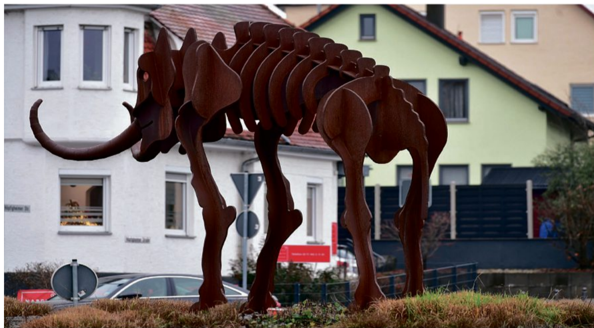
Der Steinheimer Steppenelefant „Steppi“ ist das Wahrzeichen von Steinheim und steht unübersehbar im Kreisverkehr.

Die Schädelkopie des „Steinheimer Urmenschen“ kann man im Urmensch-Museum besichtigen, ebenso wie weitere Exponate von der Altsteinzeit bis zur Würmeis-