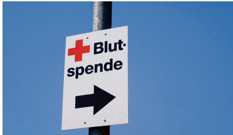
Termine zum Spenden sind online zu vereinbaren.

Aufgrund der bundesweit stark angestiegenen Corona-Neuinfektionen erhalten ausschließlich Menschen Zutritt zum Blutspendelokal, die den Status geimpft, genesen oder getestet erfüllen. Entsprechende Nachweise sind mitzubringen (Antigen-Schnelltest nicht älter als 24 Stunden, PCR-Test nicht älter als 48 Stunden).