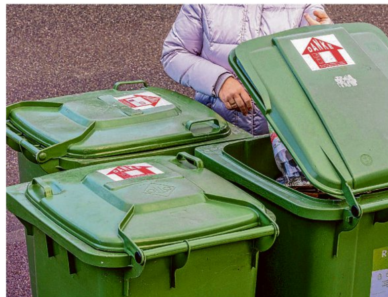
Die bisherigen „Rund“-Tonnen werden ab dem 17. Januar abgeholt. Die Abholtermine sind online zu finden.

nicht mehr geleert. Die dann übrigen und nicht mehr benötigten „Rund“-Tonnen sammeln die Unternehmen KURZ Entsorgung GmbH und PreZero Service Süd GmbH ab dem 17. Januar im gesamten Landkreisgebiet ein. Geplant ist die Einsammlung der