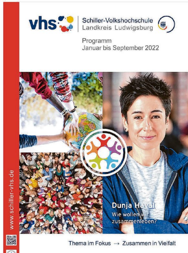
Das neue Programm der Schiller-VHS für den Kreis Ludwigsburg ist erschienen.

Die Corona-Pandemie stellt auch die Volkshochschule vor immer neue Herausforderungen. Das Hygienekonzept wird laufend der jeweils gültigen Corona-Verordnung angepasst. Dies macht oft kurzfristige Änderungen notwen-