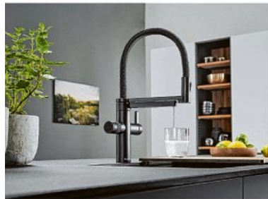
Ein spezielles Wassersystem.

Schwarz wird aufgrund seiner exklusiven Wirkung oft als „Farbe der Designer“ bezeichnet. Küchenspezialisten haben mit einer Armatur in neuem Look wortwörtlich „ins Schwarze getroffen“: Das Modell vereinfacht das Arbeiten in der Küche, spart Zeit, macht noch mehr Lust auf puren Wassergenuss und ist im matt schwarzen Outfit im Trend von Retro-Chic und Industrial-Style eine echte Augenweide. Moderne Wassersysteme können viel mehr als „nur“ gewöhnliches Wasser zapfen: Die Wasserqualität erhöht sich durch einen Filter, auf das Schleppen schwerer Wasserkränchen und zusätzliche Fahrten zum Getränkemarkt kann verzichtet werden – für mehr Komfort und weniger CO 2 . Besonders praktisch ist ein separates Drehrad zum Einstellen des Kohlensäuregehalts im gefilterten Trinkwasser, dessen Menge sich durch eine Click & Touch-Funktion bedarfsgerecht regeln lässt. Zwei separate Abläufe trennen veredeltes