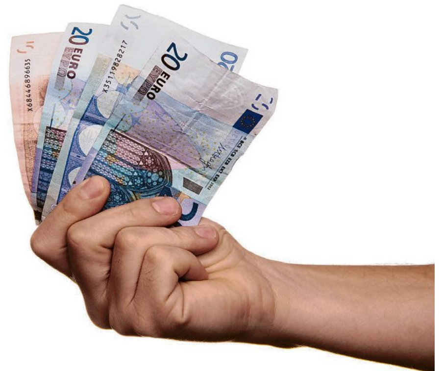
Das Honorar eines Hausverwalters darf nicht automatisch jährlich erhöht werden (Symbolfoto).