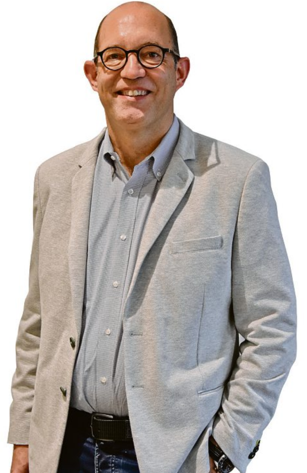
Das Team der Polsterwelt ENGELHARDT freut sich auf Ihren Besuch.