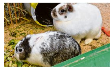
Susi und Flocke.

Kleintiere: Susi (braun/weiß, weiblich) und ihre Freundin Flocke (grau/weiß, beide ca. 2017/2018 geb.) wurden gemeinsam aus schlechter Haltung befreit und lange Zeit aufgefäpelt. Susi hat durch die lange Nicht-Behandlung ihres ehemaligen Besitzers einen schiefen Kopf davongetragen. Den beiden Mädels geht es nun sehr gut, so richtig gesund werden beide Kaninchen aber niemals werden. Da Susi und Flocke sehr aneinander hängen, su-