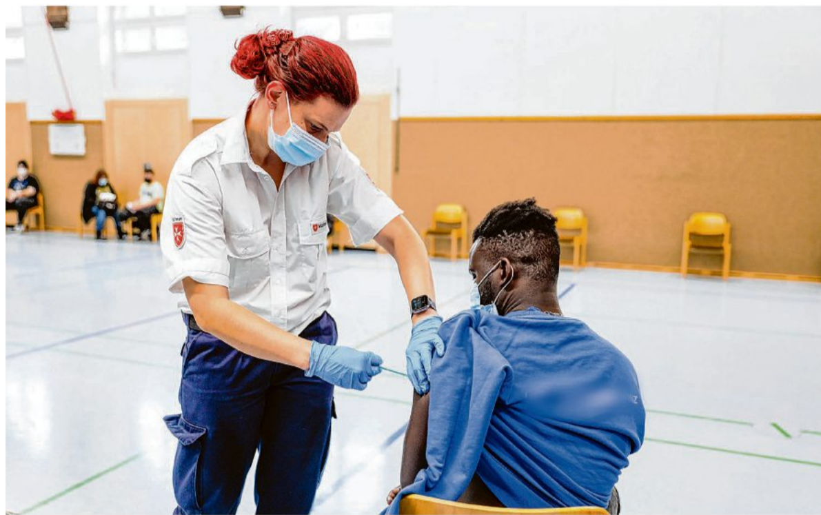
Überall im Land werden derzeit neue Impfstationen eingerichtet.

Vaihingen an der Enz startet im Januar nochmals kräftig durch beim Thema Impfen. An 30 Tagen (nur der Neujahrstag war ausgenommen) können sich Impfwillige den so wichtigen Pils abholen. Neben den DRK-Terminen in der Stadthalle können ab sofort auch Termine in Enzweihingen gebucht werden, und zwar unter https://termin.kizlb.de/online . Der Impfstützpunkt in Enzweihingen ist unter der Adresse Steinstraße 21 zu erreichen (Parkplätze sind ausgeschildert). Alle drei Buchungsportale (auch die des DRK) sind auch auf der