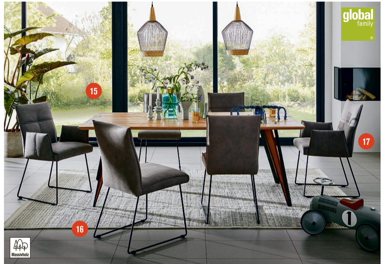
12 ECKBANK GLOBAL CARMELO , in Stoff light blue, 90% Polyester, 10% Rayon, Rücken glatt, Flachstahlkufen in schwarz, mit Federkernsatz, bestehend aus: Anbauecke mit offenem Abschluss links, Bankelement mit offenem Abschluss rechts, Stelmaß ca. 169x215 cm, 1798,- | 13 FREISCHWINGER GLOBAL CARMELO , in Stoff light blue, 90% Polyester, 10% Rayon, Vierkantrohr in Metall schwarz, BHT ca. 47x93x60 cm, je 369,- | 14 GLOBAL DINNER ESSTISCH 3533 , Wildeiche furniert, Scheren-Säule Wildeiche furniert in Kombination mit schwarz, mit Schiebepfattenfunktion, inkl. einer Einlegeplatte ca. 45 cm, BHT ca. 130/175x76x90 cm, 1298,- | 15 GLOBAL DINNER ESSTISCH 4093 , Tischplatte Balkeneiche massiv, strukturgehobelt mit Vintageeffekt, Metallgestell schwarz mit Inlay Eiche massi v, BHT ca. 180x76x100 cm, 998,- | 16 GLOBAL DINNER STUHL 6131 in Stoff Mikrofaser grey, 100% Polyester, Kufengestell Eisen schwarz, BHT ca. 48x89x58 cm, je 198,- | 17 GLOBAL DINNER STUHL MIT ARMLEHNEN 6132 in Stoff Mikrofaser grey, 100% Polyester, Kufengestell Eisen schwarz, BHT ca. 58x89x58 cm, je 249,-