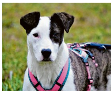
Manja ist erst zehn Monate alt.

Bewohner des Tierheims Ludwigsburg möchten adoptiert werden