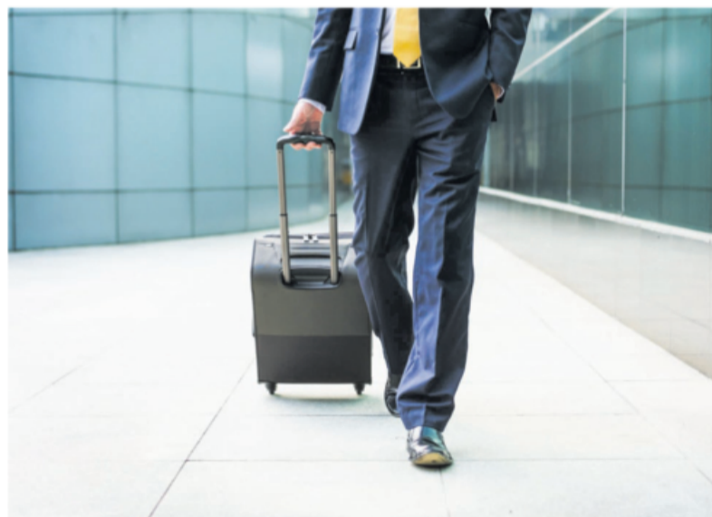
Die schwarzen Rollkoffer sind seltener geworden: Derzeit finden nur noch rund zehn Prozent der „vor Corona“ üblichen Dienstreisen statt.

„Wenn die Aufgaben auch anderweitig erledigt werden können, dann ist die Weisung an den Arbeitnehmer, die Reise trotzdem antreten zu müssen, unbillig“, sagt Schipp. Andererseits gehe ein Arbeitnehmer, der sich weigert zu reisen, „ein nicht unbeträchtliches Risiko ein“. Stellt sich im Streitfall heraus, dass das Unternehmen seinen Pflichten nachgekommen ist, dass es ausreichend Maßnahmen ergriffen hat, um Sicherheit und Gesundheitsschutz zu gewährleisten, drohen eine Abmahnung oder sogar eine außerordentliche Kündigung. Dass ein Konflikt um eine Reise trotz Corona-Gefahren derart eskaliere, sei in der Praxis aber selten, sagt der Arbeitsrechtler. „Meist gelingt es, sich zu ver-