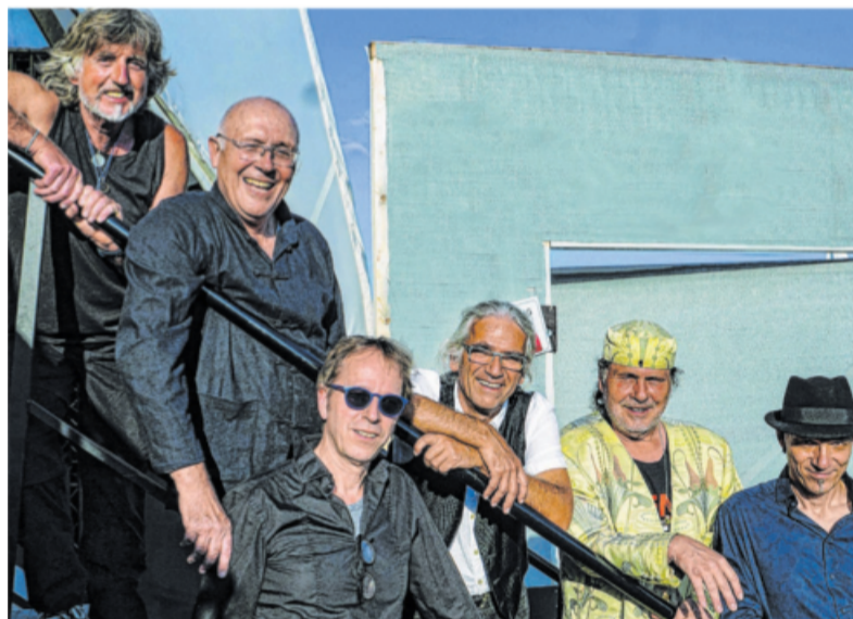
„Poems on the Rocks“ sind im Juli im Bönnigheimer Freibad zu erleben.