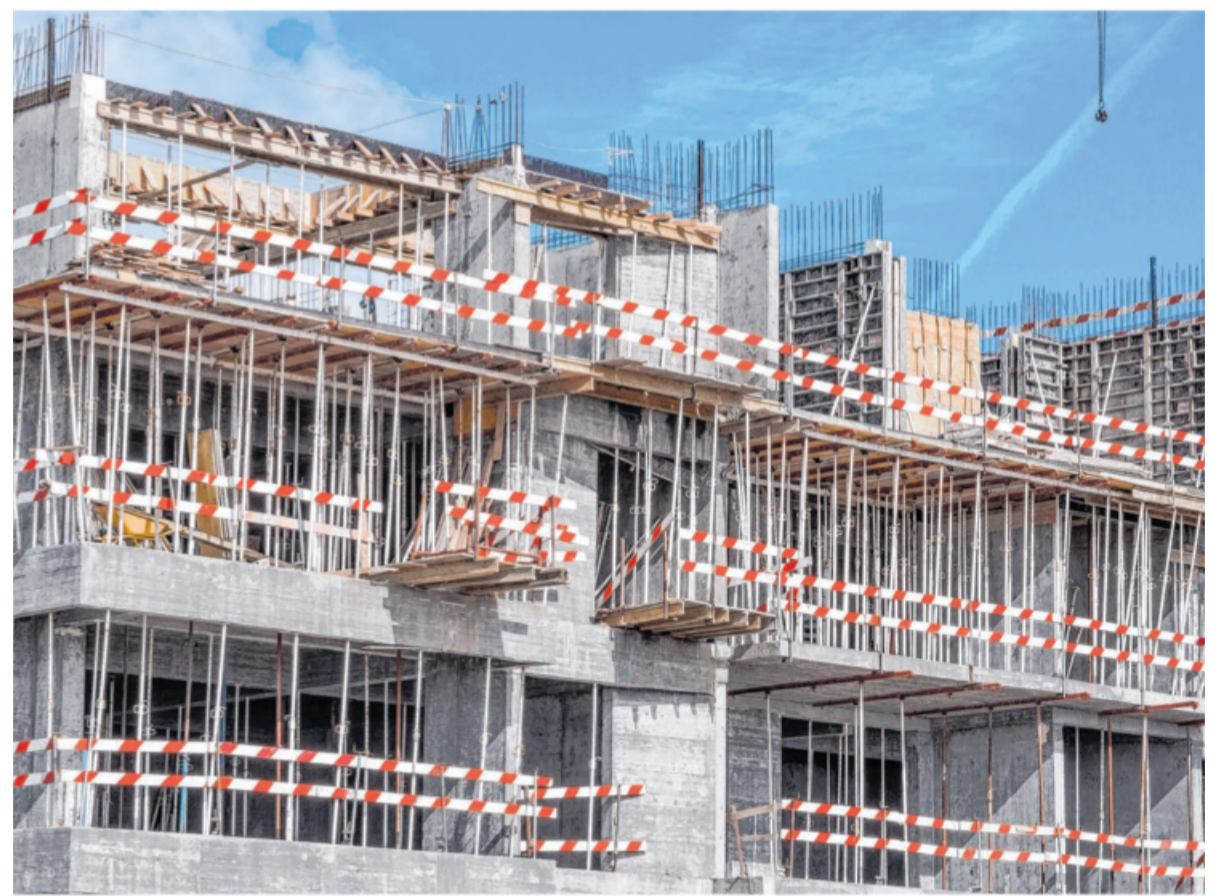
Vermieter können für neu gebaute Wohnungen im Jahr der Anschaffung oder Herstellung und in den folgenden drei Jahren Sonderabschreibungen in Anspruch nehmen.

Zu beachten ist außerdem, dass die Sonderabschreibungsmög-