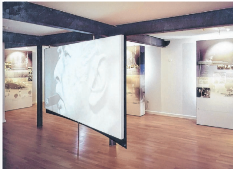
Das Theodor Heuss Museum in Brackenheim hat wieder an den Wochenenden geöffnet.

Das Theodor-Heuss-Museum in Brackenheim ist samstags und sonntags wieder geöffnet.