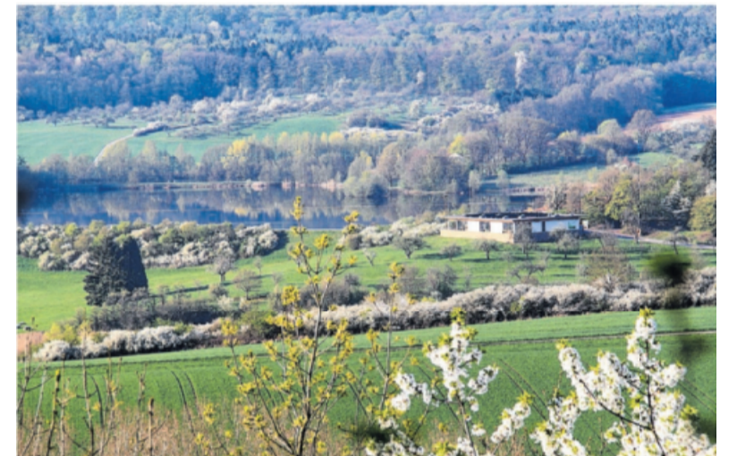
Am Zaberfelder Stausee Ehmetsklinge wird an den Wochenenden verstärkt kontrolliert.