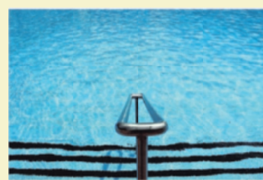
Beim Freibadbesuch gelten aktuell noch Einschränkungen (Symbolfoto).

Für den Zutritt zum Freibad muss aufgrund der aktuellen Inzidenzwerte des Landkreises Heilbronn kein Nachweis über