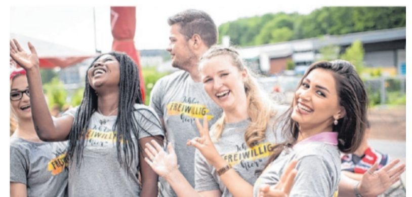
Ein Freiwilligendienst bei den IB Freiwilligendiensten Asperg gibt jungen Leuten die Chance, etwas für sich selbst und andere Menschen zu tun.

Während der Tätigkeit im sozialen Bereich sammelt der*die Freiwillige viele spannende Erfahrungen, die bei der Berufswahl helfen können. Ein Freiwilligendienst ist ein Jahr der persönlichen Bildung, des sozialen Engagements und der beruflichen Orientierung. In dieser Zeit leistet