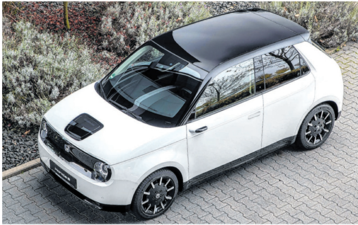
Kompakte Außenmaße, kleiner Wendekreis: Der Honda e ist das ideale Auto für die Stadt.

Die von Honda gezielt klein gehaltene 35,5 kWh-Batterie bedeutet zwar weniger Kosten bei der Anschaffung und weniger Gewicht, dafür ist die Reichweite