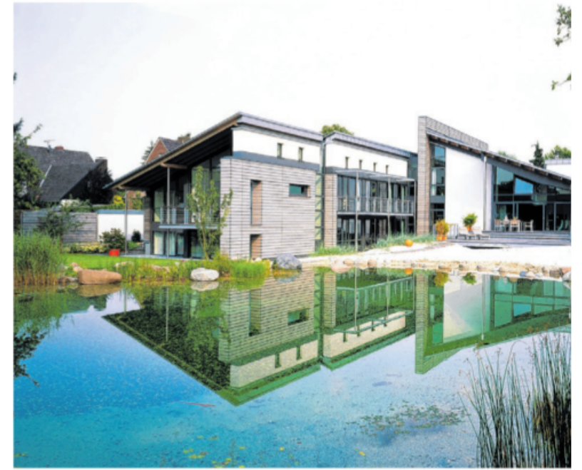
Natürlich schön, optimal geschützt: Damit Holz im Außenbereich gegen Regen, Wind und Sonne gewappnet ist, empfiehlt sich ein zuverlässiger Schutzanstrich.

Terrassenmöbel, Holzfasade, Sichtschutz oder Gartenhäuschen – bei vielen steht Holz als Baustoff für den Außenbereich hoch im Kurs. Kein Wunder, denn der nachwachsende Rohstoff ist nicht nur attraktiv und robust, sondern bietet je nach Holzart und farblicher Gestaltung großen kreativen Spielraum. Wichtig ist jedoch ein wirkungsvoller Schutz, der die natürliche Oberfläche vor Witterungsschäden bewahrt. Im Laufe des Jahres ist das Holz dank Regen, Wind und Sonne großer Beanspruchung ausgesetzt – da heißt es, rechtzeitig vorzusorgen. Wird neben zuverlässigem Schutz auch Wert auf natürliche Inhaltsstoffe gelegt, empfiehlt sich eine Einmal-Lasur. Ein Holzschutz-Anstrich auf Naturölbasis sorgt bereits nach einmaligem Auftrag für eine wasserabweisende, wetter- sowie UV-beständige Oberfläche und erhöht so die Haltbarkeit von Holzprodukten nachhaltig. Gut zu wissen: Produkte von Experten sind lösemittelarm und enthalten weder biozide Wirkstoffe noch Konservierungsmittel. Der getrocknete Anstrich ist gesundheitlich unbedenklich und damit prädestiniert für Kinderspielge-