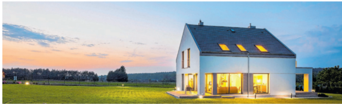
Häuser sind noch eher gefährdet, wenn es neben Eingangstüren und Fenstern ebenfalls Terrassen- oder Balkontüren gibt.

Welcher Einbrecher geht noch seinem „Beruf“ nach, wenn alle aufgrund von Ausgangsbeschränkungen zu Hause sind? Seit Beginn der Corona-Pandemie steht fest: Die Zahl der Einbruchsdiebstähle ist deutlich gesunken. So meldete das nordrhein-westfälische Innenministerium im Juli 2020 einen Rückgang von knapp 30 Prozent. Doch mit Herbst und Winter war wieder ein Anstieg zu erkennen – wenn auch kleiner als