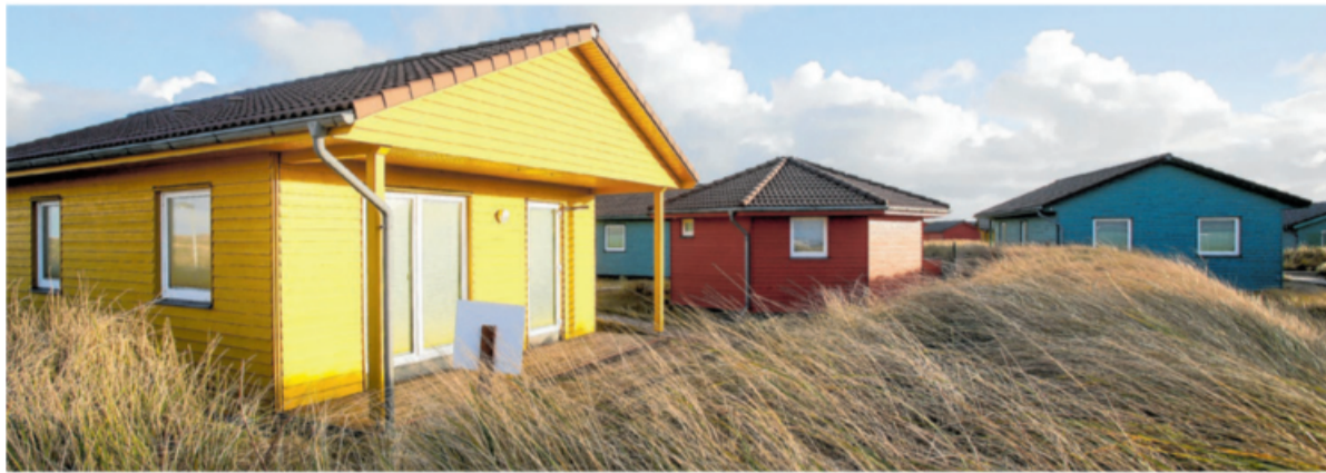
Wer zusammen mit Freunden eine Ferienimmobilie kauft, kann eine Gesellschaft bürgerlichen Rechts gründen. Das macht vieles einfacher.