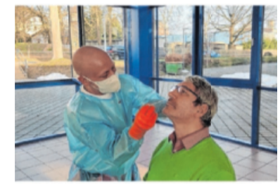
Offizielle Corona-Teststellen gibt es auch in Tamm.

Nach der erfolgreichen Terminvereinbarung erhalten die Bürgerinnen und Bürger per Mail eine Terminbestätigung, die sie dann per Smartphone oder ausgedruckt bei ihrem Termin mitbringen und so einchecken. Nach erfolgtem Test erhalten sie das Ergebnis per E-Mail passwortgeschützt als Zertifikat zugesandt. Ein Hinweis zum Testen im Tamm-DRK-Vereinsheim: Bitte nicht direkt im Hof des DRK-Heimes parken, damit diese bei etwaigen Einsätzen jederzeit ausrücken können.