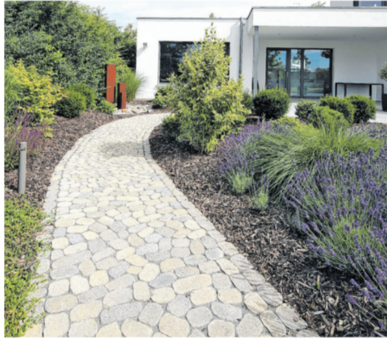
Die natürliche Kantengestaltung bringt in der Verlegung Leichtigkeit und Bewegung auf den Boden. Dabei sind die Pflastersteine dennoch optimal aufeinander abgestimmt, sodass das Schneiden einzelner Steine nicht nötig ist.