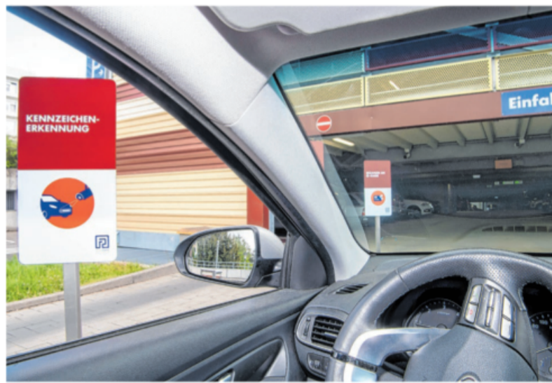
Parkhaus am Krankenhaus: Hier kann jetzt per Kennzeichenerkennung bezahlt werden.

Bei Ein- und Ausfahrt erfassen Kameras das Kennzeichen des Fahrzeugs. Das Kennzeichen ersetzt dabei das Ticket. Es gibt keine Schranke mehr – jedes Fahrzeug kann einfach und ohne anzuhalten ein- und ausfahren. Damit der Parkende erkennt, dass