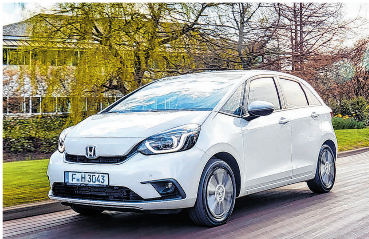
Der Honda Jazz mit Van-Design und ökologisch sinnvollem Hybridantrieb.

Keiner der anderen verspricht mit seinen Sitzen magische Momente. Der Tank schlummert unter den Vordersitzen. Das schafft Platz unter den Rücksitzen, deren Sitzflächen sich wie Kinosessel nach oben klappen lassen. Dann finden dort angesichts einer Höhe von 1,53 Metern und einer stattlichen Breite von 1,97 Metern quer auch mal ein Fahrrad (mit ausge-