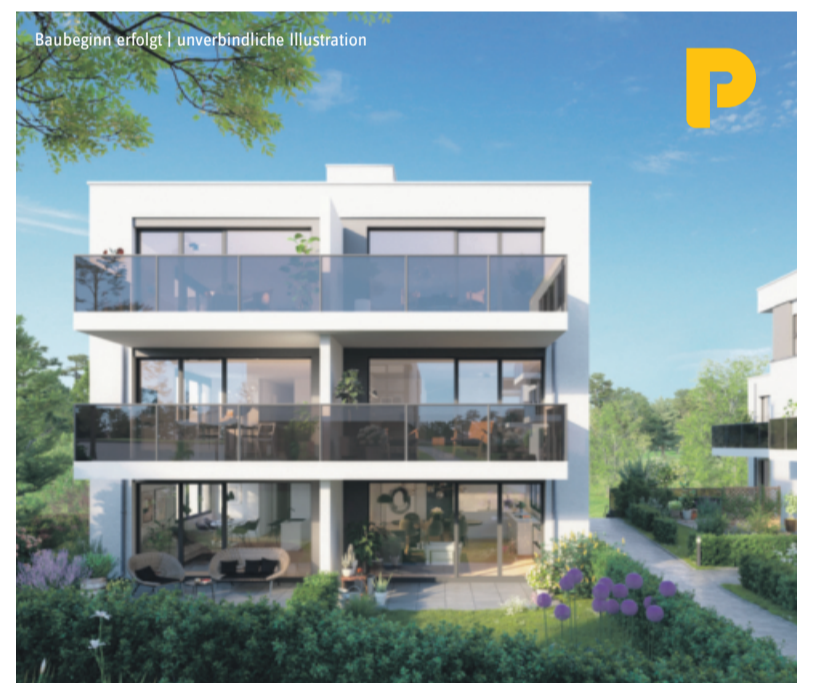
Bietigheim-Bissingen Hölderlin Höfe

3- bis 4-Zimmer-Wohnungen Pelletheizung | EnEV 2014 (Stand 1.1.2016)