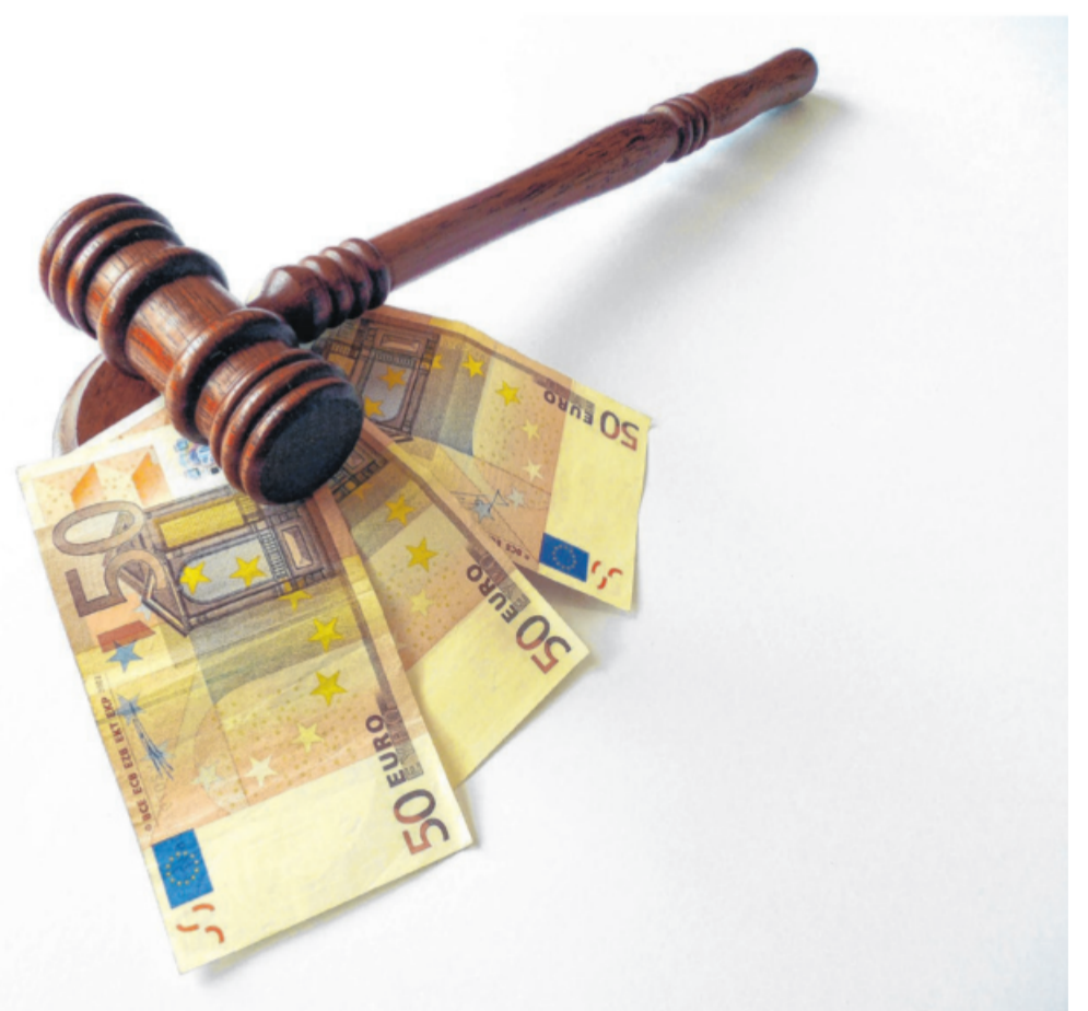
Der Bundesgerichtshof hat die Revision eines Untermieters abgewiesen.

Es ging um ein sieben Quadratmeter großes Zimmer, das der Beklagte vom Hauptmieter einer insgesamt 107 Quadratmeter großen Wohnung untermietet. Als der Hauptmieter Ende 2014 starb, forderte der Vermieter den Untermieter zum Auszug innerhalb einer Frist auf. Da dieser die Wohnung nicht freigab, verklagte er ihn erfolgreich auf Räumung. Es wurde eine Räumungsfrist bis Ende September 2016 gewährt. Im Oktober 2017 wurde der Untermieter zwangsgeräumt. Die Erbin des mittlerweile verstorbenen Vermieters verklagte den Untermieter nach dessen Auszug auf Schadenersatz von 2170 Euro. Das entspricht der möglichen Miete für die ganze Wohnung zwischen März und September 2016 – mindestens 310 Euro im Monat. Vor