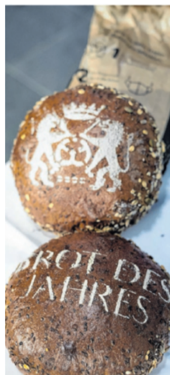
Brot des Jahres 2021: das Dreikornbrot.

Um über die Bedeutung des Brotes für die menschliche Ernährung zu informieren, wählt der Wissenschaftliche Beirat des Deutschen Brotinstituts jedes Jahr eine besonders traditionelle, beliebte und ernährungsphysiologisch hochwertige Brotsorte zum „Brot des Jahres“. Ziel ist es, das Wissen über die verschiedenen Brotsorten zu verbessern und die Deutsche Brotkultur als anerkanntes Kulturgut unseres Landes zu stärken. Das Brot des Jahres 2020 war das Roggen-Vollkornbrot, im Jahr 2019 wurde das Bauernbrot gewählt und 2018 das Dinkel-Vollkornbrot. Bei der Wahl des Brotes des Jahres hat sich 2021 erneut ein Klassiker durchgesetzt: Das Dreikornbrot. Seine Getreidevielfalt und die deutschlandweite Verbreitung waren nur einige der Beweggründe für die Entscheidung des Wissenschaftlichen Beirates des Deutschen Brotinstituts e.V.