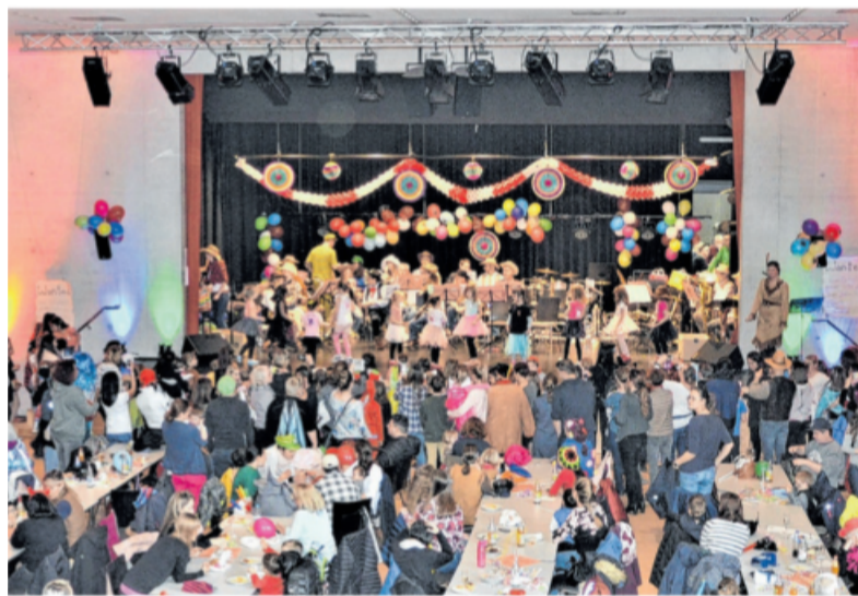
Fasching im Tamm Bürgersaal 2019: Bedingt durch Corona kann in diesem Jahr so nicht gefeiert werden. Doch der Musikverein hat eine Lösung gefunden.

Am Faschingsdienstag, 16. Februar, findet die Tamm Online-Kin-