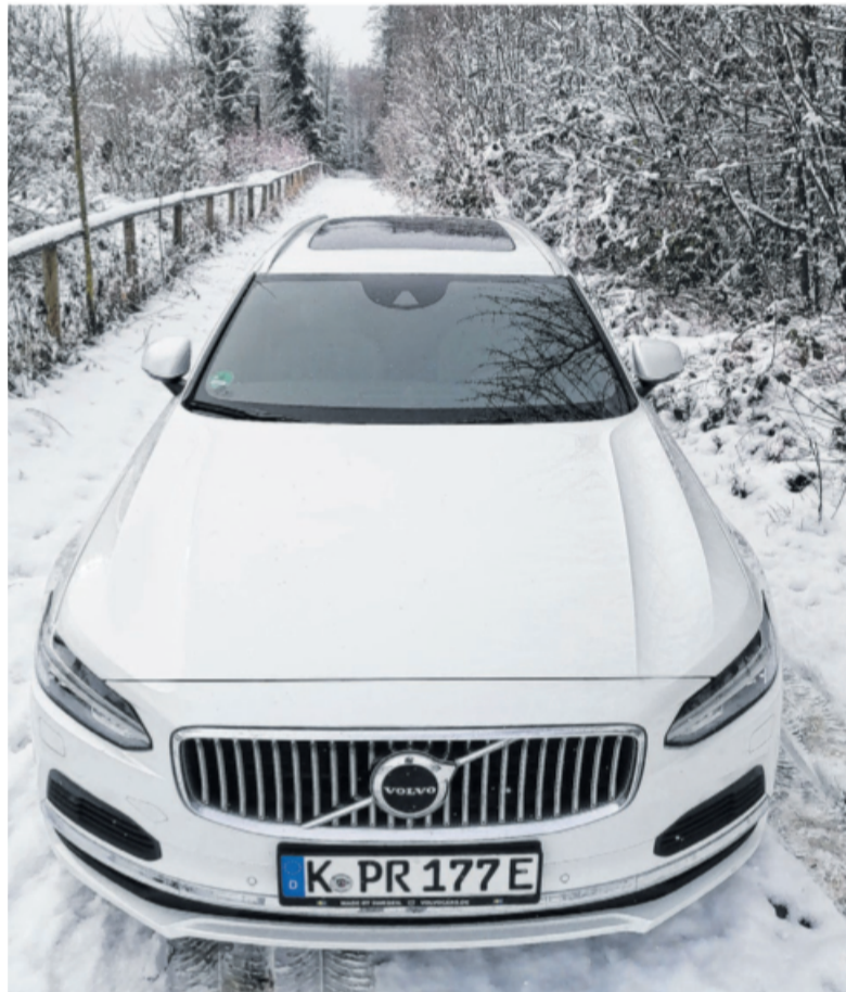
Ganz in Weiß gibt der V90-Premium-Kombi im Wintertest eine gute Figur ab. Er ist als Recharge-Variante erhältlich.

Auf Autobahnen fühlt sich der V90 besonders wohl. Exakt hier bastelt Volvo an einem Spagat. Zu Vier Benziner-Varianten und drei Diesel-Optionen gibt es nun dem Diktat der gewählten Elektrifizie-