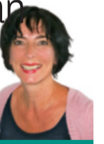
Inga Stoll Rundschau-Redaktion

Ein Planet rülps durchs All, Trolle kochen Pudding in Mordor, Pinguine eröffnen einen Saloon: Als ich das neulich las, fühlte ich mich ertappt: Woher weiß da jemand, wem ich nachts begegne? Doch ich bin nicht allein mit meinen nächtlichen Abenteuern. Gleich mehrere meiner Lieblingsmenschen hatten unabhängig von mir dieselbe Nacht in Absurdistan verbracht. Lieblingsmenschin Nummer eins zum Beispiel saß behaglich erster Klasse im Flieger nach Dubai, landete im Westerwald und stellte beim Auschecken fest, dass aus ihrem kleinen Koffer an allen Ecken und Enden indonesische Geldscheine herausquollen, was sie beim Zoll ziemlich ins Schwitzen brachte.