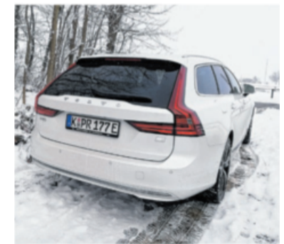
Auch das V90-Heck ist ansprechend.

In der Praxis im Winter sieht es so aus, dass die geräuschlose, rein elektrische Fahrt früher endet, der Benzinler sich dazugesellt und der Durchschnittsverbrauch bei Schneematsch und auch Minusgraden auf 7,8 Liter ansteigt – was immer noch ein guter Wert für einen Allrad-Kombi dieser Größe darstellt, der mit seiner bekannt guten Achtgang-Automatik überzeugt. Was Volvo auch in dieser Baureihe noch nicht abstellen konnte: Der Blinker hat gelegentlich „Schluckauf“ – will heißen: Er klickt unregelmäßig.