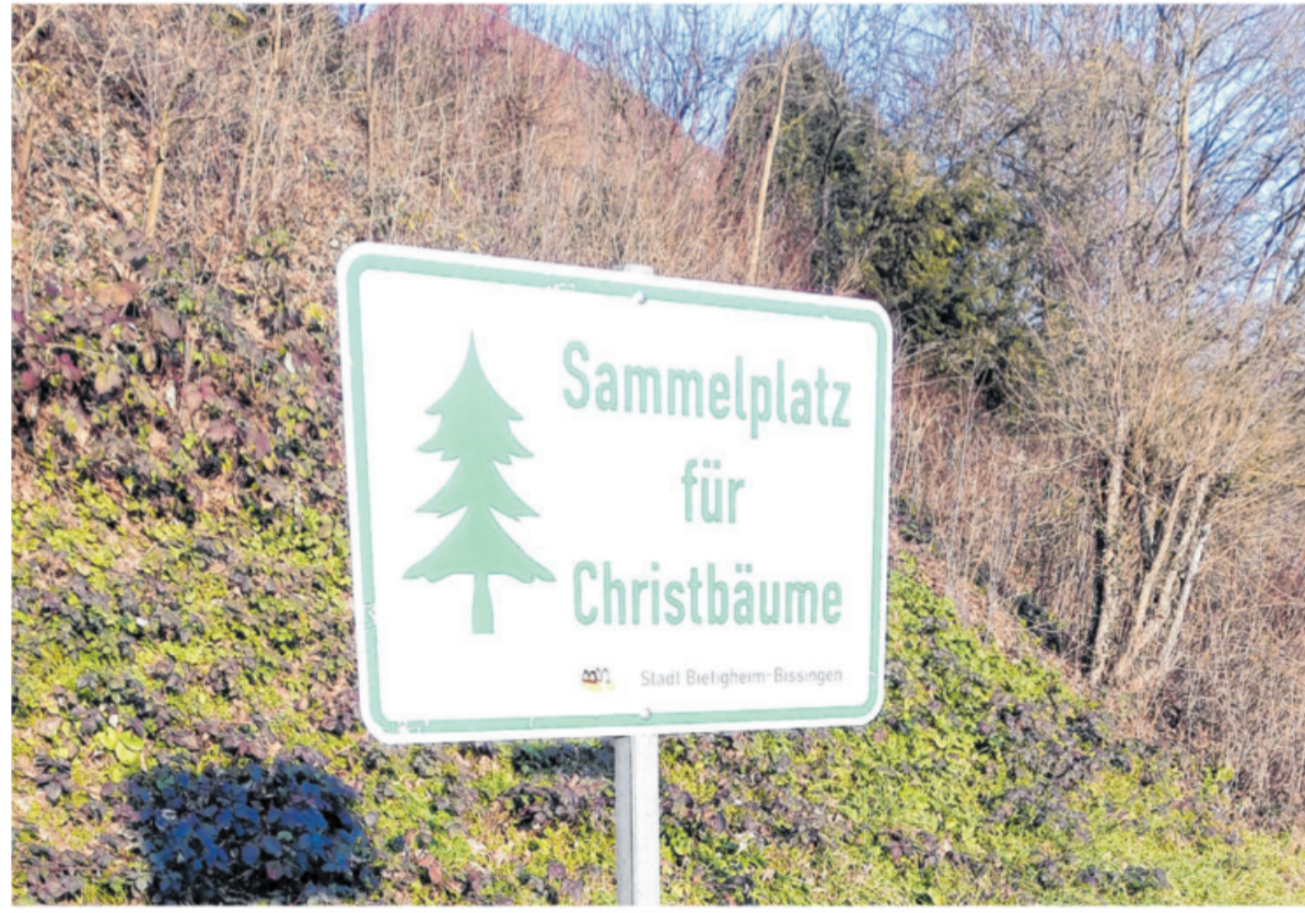
In diesem Jahr muss jeder seinen ausgedienten Christbaum selbst entsorgen – die Gemeinden haben Sammelpunkte eingerichtet.

Untermberg: Bissinger Straße / Kelterplatz, Am Türmler / Bushaltestelle.