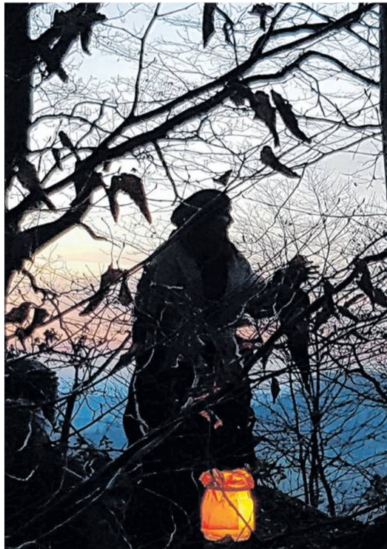
Mystik und Geheimnisvolles inklusive: Rauhnachtsmärchenwanderungen in der Region.

An verschiedenen Stationen können über einen QR-Code die Märchen gehört werden. Ein weiterer QR-Code gibt dazu Wissenswertes rund um die Rauhnächte preis und an jeder Station wartet