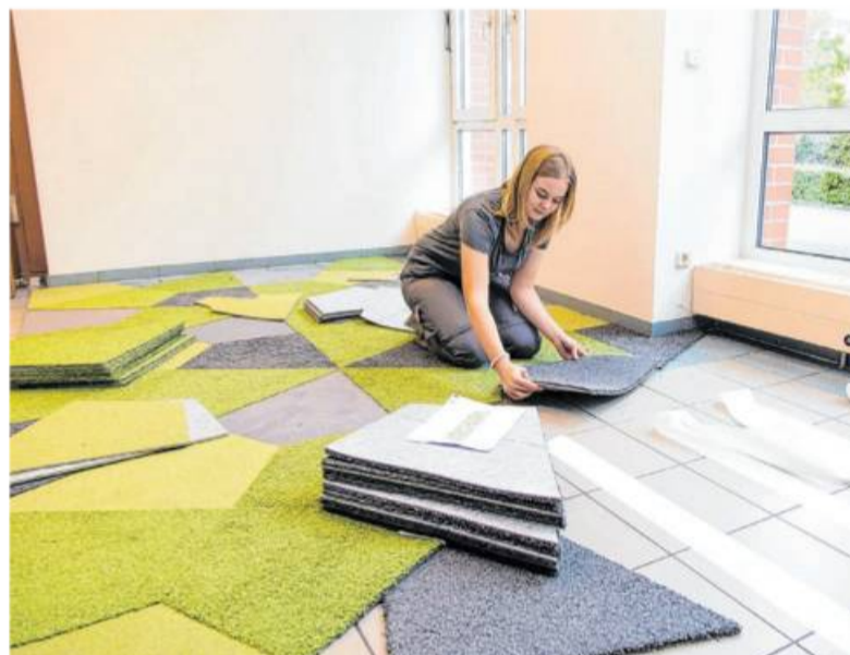
„Man weiß nie, was kommt“: Teppiche verlegen, Wände streichen, körperlich anpacken – von Raumausstattern werden viele unterschiedliche Kenntnisse verlangt.

Raumausstatter müssen informieren, beraten, Konzepte entwerfen. Deshalb sind in diesem Beruf neben handwerklichen auch kommunikative Fähigkeiten wichtig. Der Anspruch der