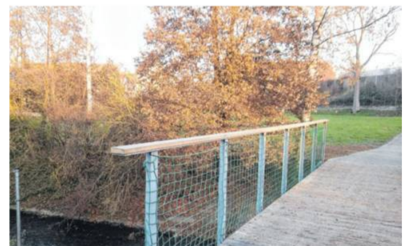
Die Aktionsgruppe von Maria, schweige nicht! hat einen besonderen Spaziergang entwickelt.

www.maria-schweige-nicht-suedlich-strohgau.net