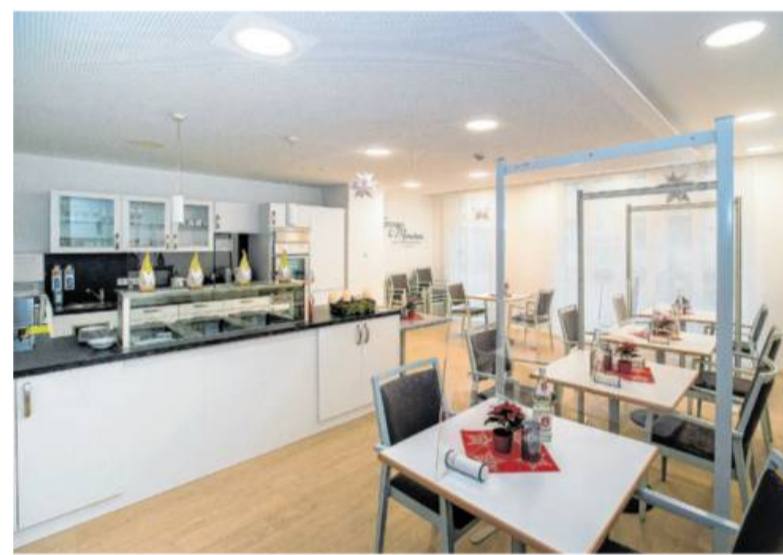
Blick in die Begegnungsstätte. Diese kann – nach Corona – auch für Feiern oder Veranstaltungen gemietet werden.

Die „WohnenPlus Residenz“ auf dem ehemaligen Cramer-Wanner-Gelände verfügt über 32 helle und großzügig gestaltete seniorengerechte Ein- bis Zwei-Zimmer-Apartments. Durch bodentiefe Fenster und Balkone zu jeder Wohnung gibt es viel Ausblick und Licht. Die Wände der Wohnungen sind in weiß gehalten, da-