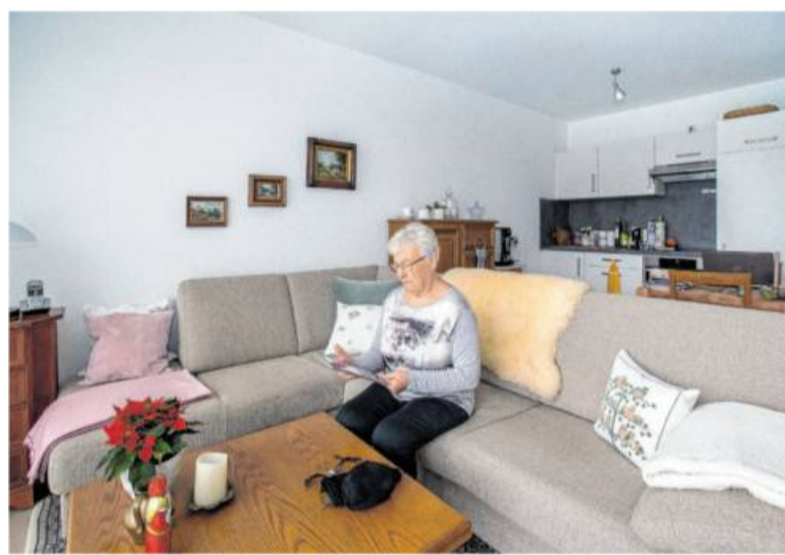
Die Wohnungen sind hell und geräumig. 18 sind bisher bereits vermietet.