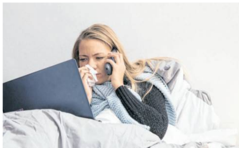
„Unverzüglich“ Bescheid geben: Spätestens am vierten Tag einer Krankheit muss die entsprechende Meldung beim Arbeitgeber vorliegen – in manchen Unternehmen auch früher.

Um welche Krankheit es sich handelt, muss der Arbeitgeber nicht erfahren. „Es gilt der Grundsatz, dass Art und Ursache der Krankheit Privatsache sind“, sagt Stach. Allerdings: „In Ausnahmen kann eine Pflicht zur Mitteilung bestehen“, erklärt Windirsch. Das ist bei ansteckenden Erkrankungen wie etwa Masern, Mumps, Hepatitis B oder Influenza der Fall, bei denen der Arbeitgeber Maßnahmen zum Schutz der Be-