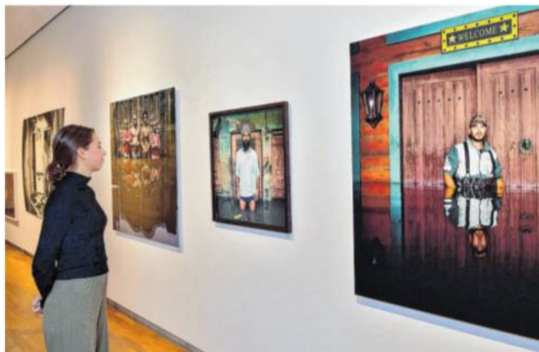
Die Städtische Galerie ist derzeit geschlossen. Aber: der Türen-Telefon-Talk bringt die aktuellen Ausstellungen „Keine Schwellenangst! Die Tür als Motiv in der Gegenwartskunst“ oder „Türen und Fenster – Drinnen und Draußen“ nach Hause. Foto: Martin Kalb

Somit müssen alle Kunstinteressierten leider bis auf Weiteres auch auf Veranstaltungen und Führungen verzichten. Aber: der Türen-Telefon-Talk bringt die spannenden und überaus aktuellen Ausstellungen „Keine Schwellenangst! Die Tür als Motiv in der Gegenwartskunst“ oder „Türen und Fenster – Drinnen und Draußen“ nach Hause! In dieser be-