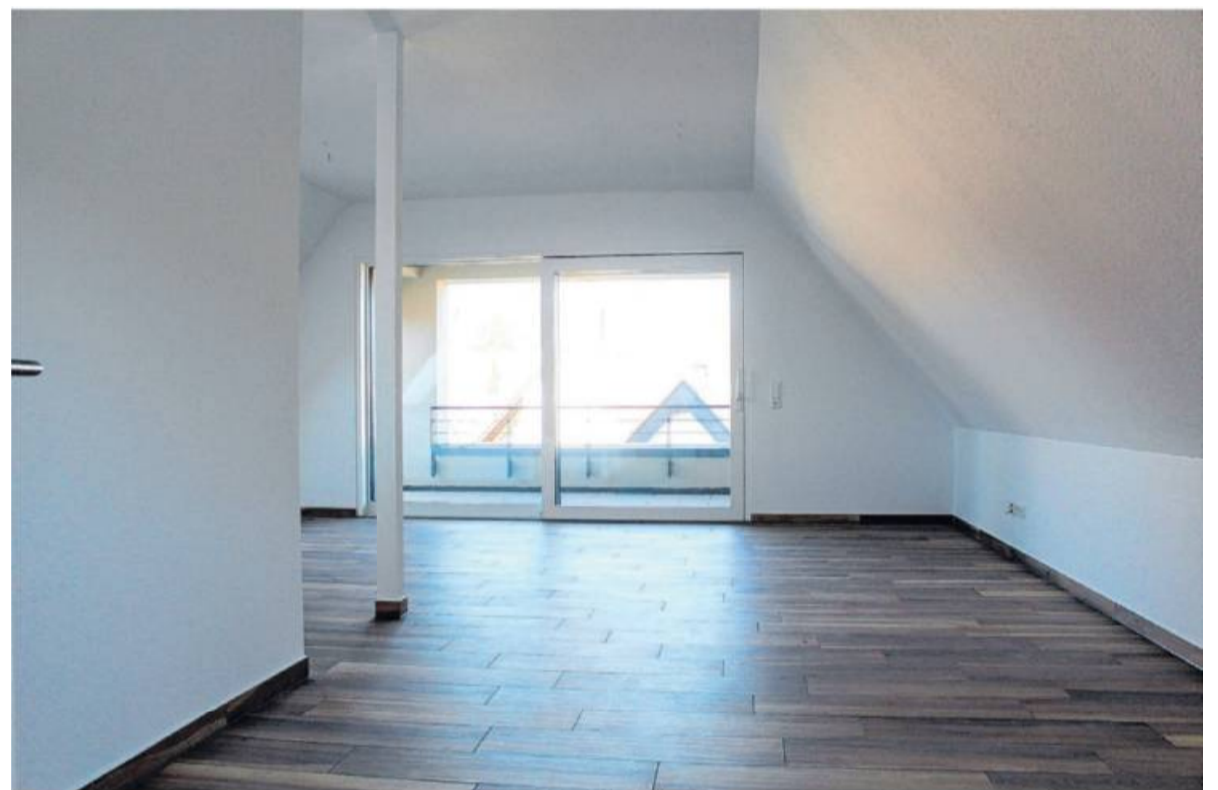
Blick in die Penthouse Wohnung. Sie ist noch zu haben.