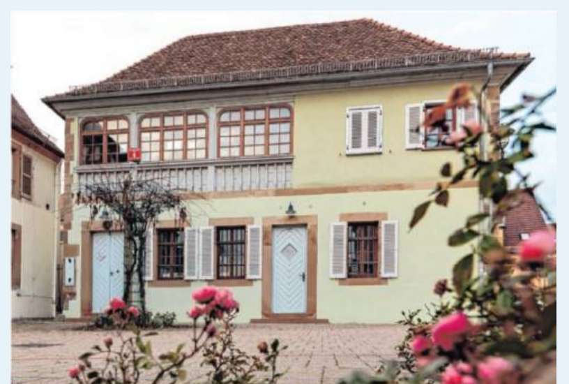
Am 19. Dezember öffnet die Vinothek zum letzten Mal in diesem Jahr ihre Türen für einen Flaschenweinverkauf.

Bei Abnahme von mindestens drei Flaschen Wein oder Sekt gibt es auch wieder 15 Prozent Ermäßigung. Das ganze Team bedankt sich für die Unterstützung in diesem besonderen Jahr.