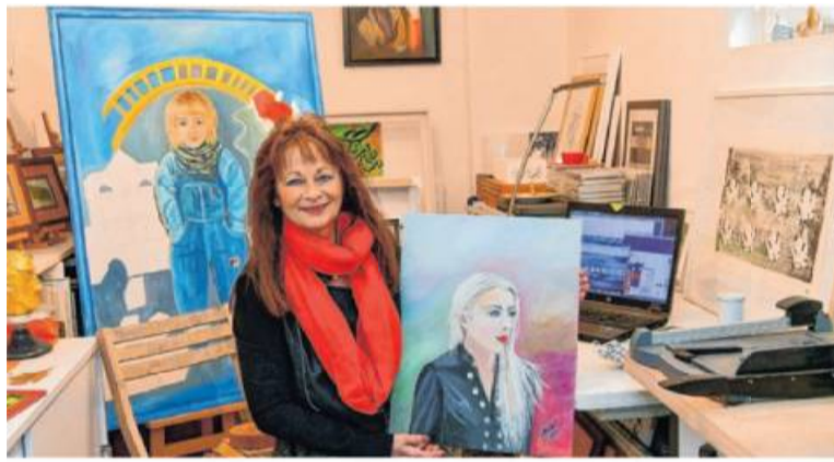
Die Künstlerin in ihrem Atelier, hier mit einem Porträt ihrer Tochter.

Ein besonderes Werk hat sich jedoch schon zum zehnjährigen Bestehen herausgebracht: die Mineralquelle Sulzbrunnen Spielberg als Radierung in geringer Auflage“.