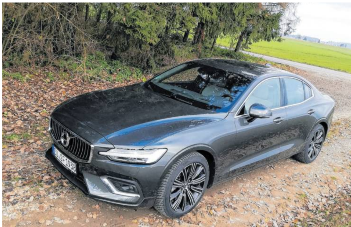
Die Volvo S60-Limousine fällt durch eine elegant gezeichnete Linienführung auf.

Volvo bietet beim S60 für eine Limousine reichlich Platz, auch das Kofferraum-Volumen von knapp 400 Liter geht in Ordnung. Besonderes Augenmerk haben die Schweden einmal mehr auf die Verarbeitung der Materialien ge-