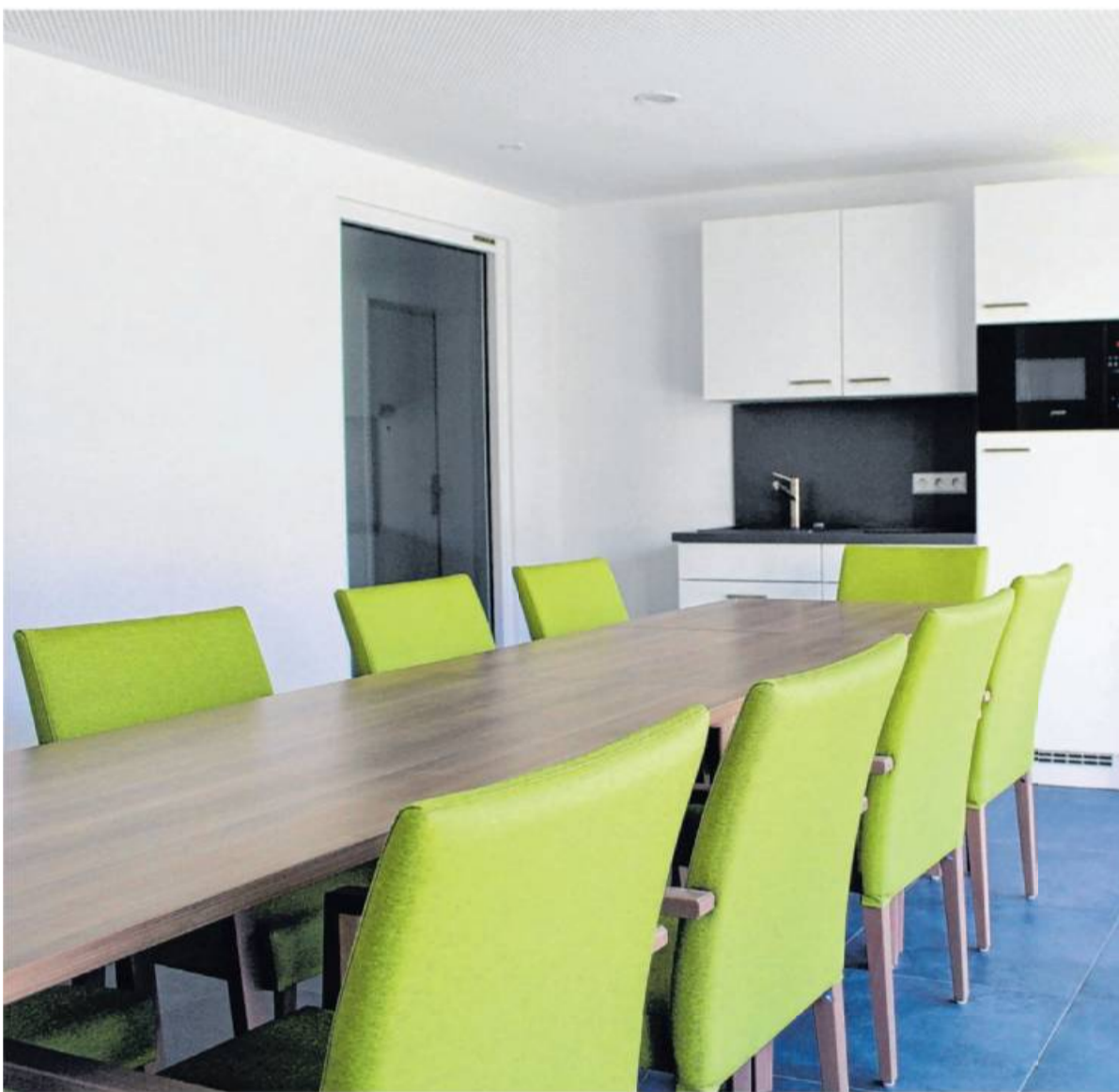
Im Gemeinschaftsraum kann man zusammenkommen und sich austauschen.

„Keine Frage, dass wir bei allen unseren Bauvorhaben in Niedrigenergiebauweise bauen, baubiologisch einwandfreie Materialien verwenden und – wo möglich – auch die Sonnenenergie nutzen.“