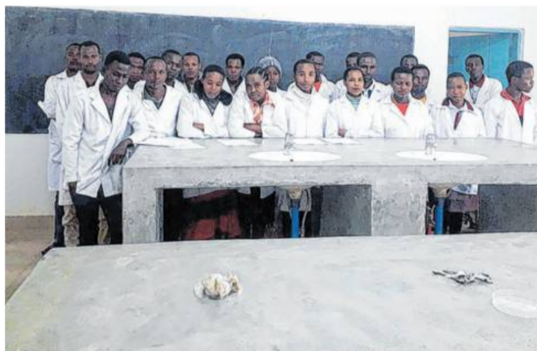
Die Studenten des Erstsemesters des Laboranten-Kollegs.

ten wird. „In dieses Projekt fließen BZ-Aktions-Spenden, für die alle Betroffenen wieder sehr dankbar wären“, hofft Rolf Schnee