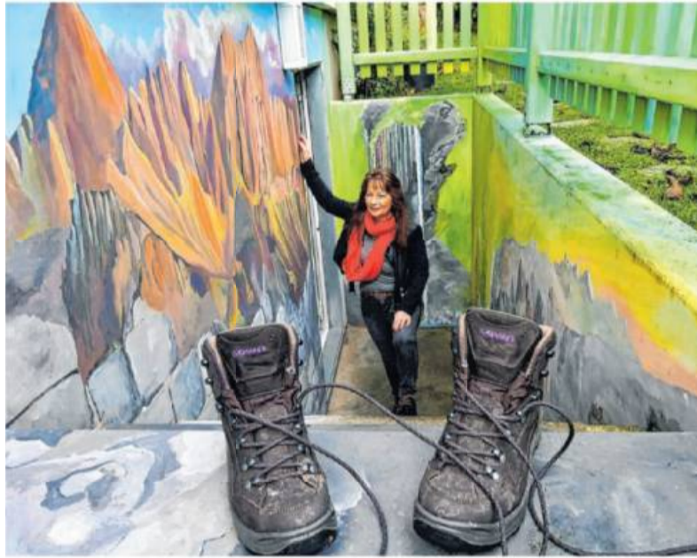
Die Künstlerin bringt auch Farbe in ihr Haus: hier hat sie einen Treppenabgang mit Motiven aus den Dolomiten verschönert: ein fast reales Urlaubsfeeling besonders in Zeiten von allgemeinen Reisebeschränkungen.