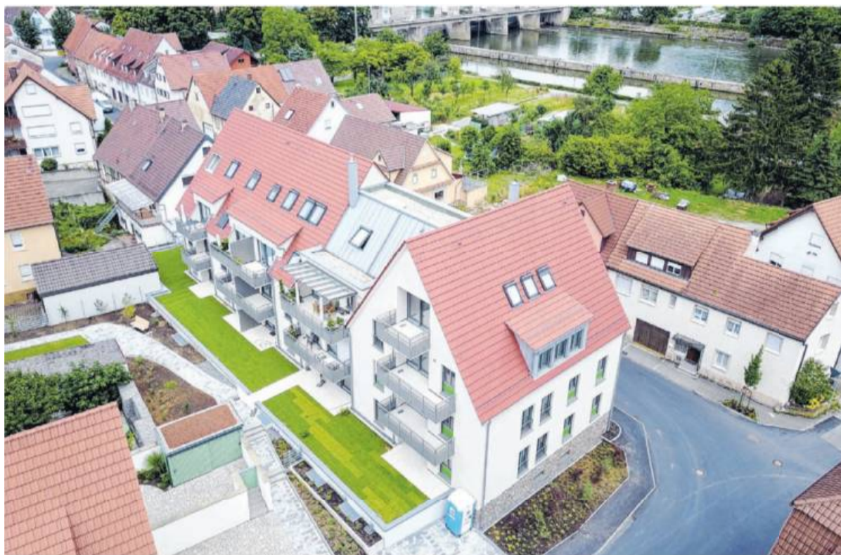
Mehrgenerationenhaus in zentraler Lage: Blick auf die Hinterseite der neuen Häuser.

Info Nähere Auskünfte zu den noch erhältlichen Wohnungen bekommen Interessenten bei der Paulus Wohnbau GmbH, Badstubenstraße 2, 74385 Pleidelsheim, Telefon (07144) 88 98 30, Telefax (07144) 8 89 83 15, Email info@paulus-wohnbau.de, www.paulus-wohnbau.de.