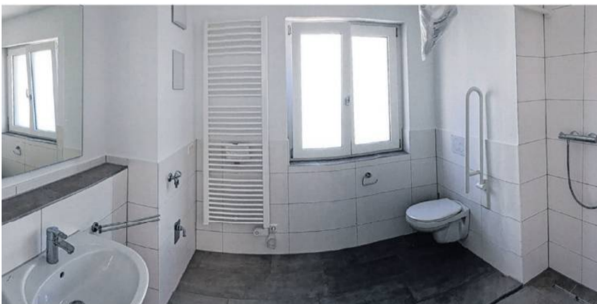
Blick in eines der barrierefreien Badezimmer in den Seniorenwohnungen.