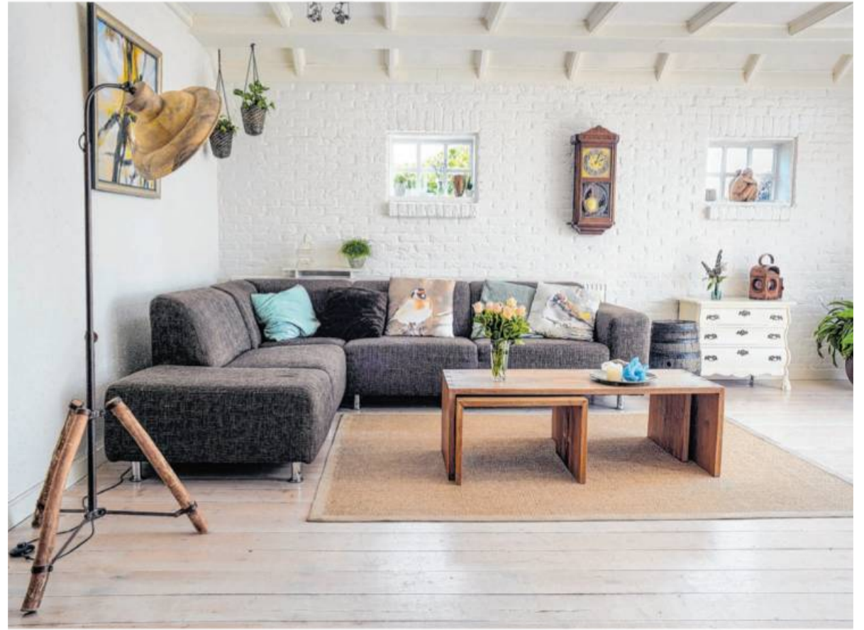
Kosten für Einrichtungsgegenstände und einen angemieteten Pkw-Stellplatz einer Zweitwohnung dürfen zusätzlich abgerechnet werden.

Das Finanzgericht stellte hingegen klar: Die Ausgaben für Hausrat, Möbel und den separaten Stellplatz gehören nicht zu den auf 1000 Euro begrenzten Un-