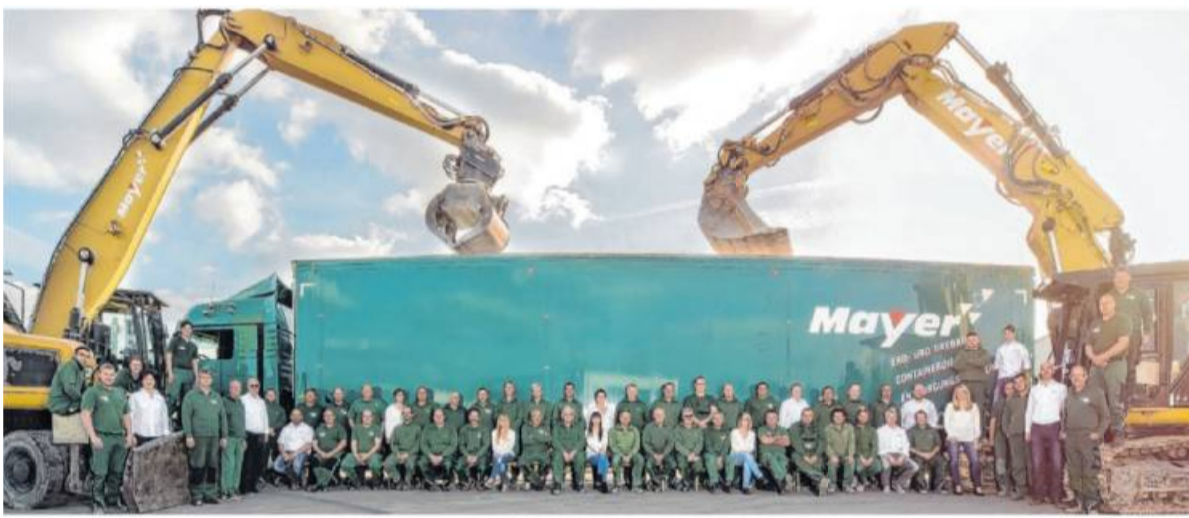
Das Team der Eugen Mayer GmbH & Co. KG (Archivbild).

Info Näheres zu den angebotenen Lei- stungen im Internet unter mayer- kirchheim.de/