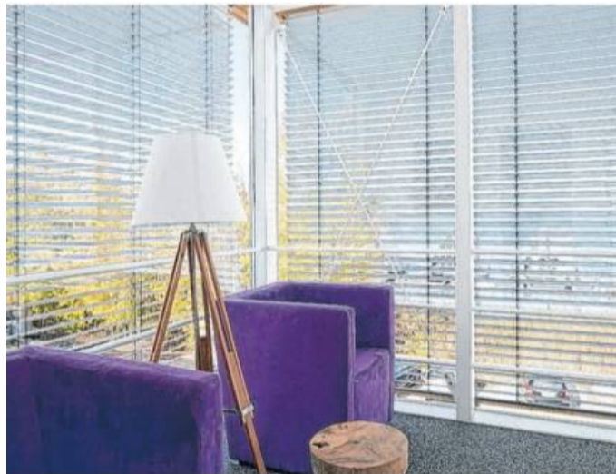
Raffstoren tragen maßgeblich zum Wohlfühlklima im Eigenheim bei.