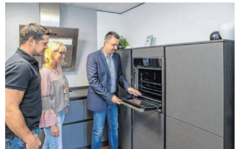
Über 20 Jahre Erfahrung auf dem Markt zeichnen das Team des Küchentreffs in Bönningheim aus: hier finden Kunden 30 Ausstellungs-Küchen für jeden Geschmack auf über 1000 Quadratmetern – von grifflosen Hochglanzküchen bis zum Landhausstil. „Gerne organisieren wir auch ihren kompletten Küchenumbau“, so das Angebot des Küchentreff-Teams, „und sind selbstverständlich immer bereit zu einem unverbindlichen Beratungsgespräch.“