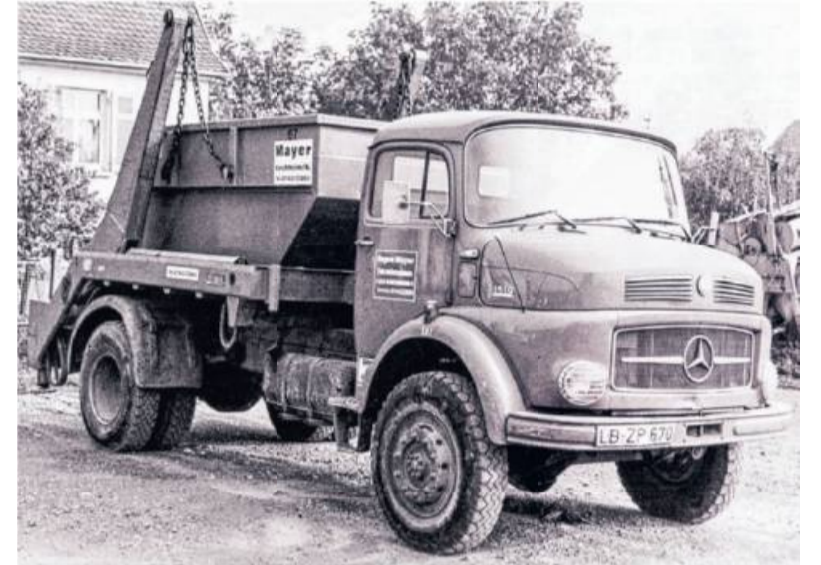
Hier ist einer der ersten Containerlastwagen zu sehen.