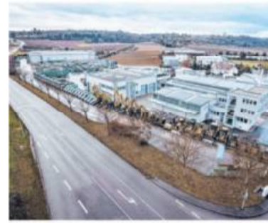
Blick aus der Luft auf den Fir- mensitz in der Max-Eyth-Strasse 13.