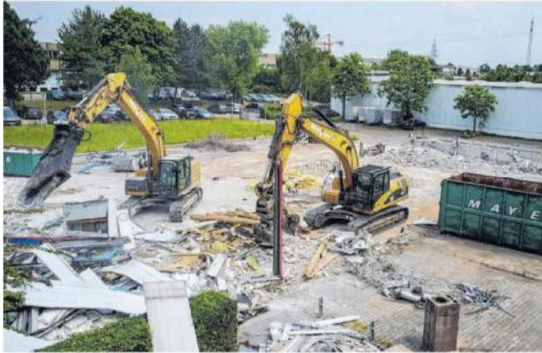
Abbruch ist eines der zahlreichen Geschäftsfelder des Unternehmens.

Auf dieser Bilderseite finden sich einige Eindrücke, die sich mit der Firma Eugen Mayer GmbH & Co. KG verbinden lassen.