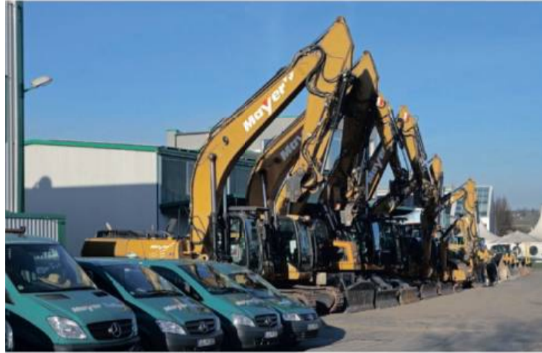
Blick auf einen Teil des umfangreichen Fuhrparks in der Max-Eyth-Straße 13.