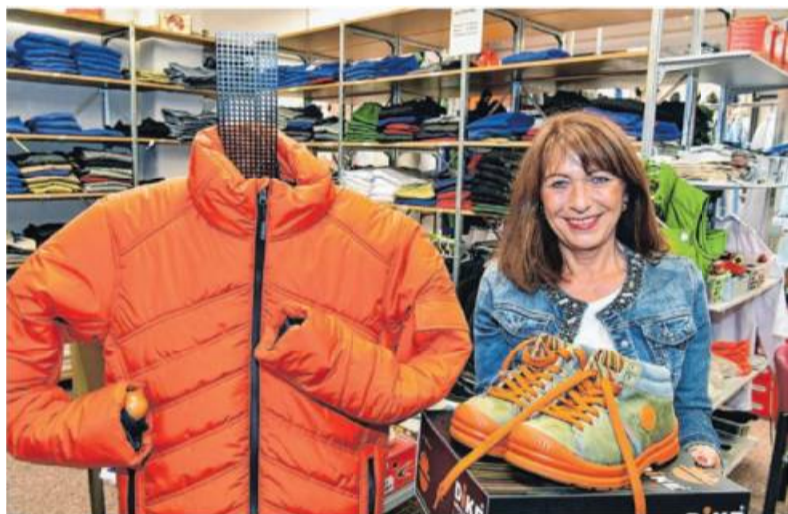
Auf rund 250 Quadratmetern Verkaufs- und Lagerfläche bietet die Firma BB-Berufsbekleidung in der Blumenstraße 45 in Bönningheim seit über zehn Jahren alles, was in puncto richtiges Schuhwerk, Kleidung und Kopfbedeckung den Arbeitsalltag sicherer macht – ohne dabei modische und branchenspezifische Aspekte aus den Augen zu verlieren. Bei BB Berufsbekleidung gibt es für jede Berufsgruppe die passende Arbeitskleidung nach dem Motto „Sicher, modisch, firmenspezifisch“.