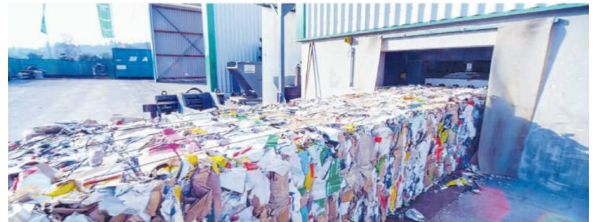
Beeindruckend: Die in der Halle untergebrachte Ballenpresse presst den Abfall in 600 Kilogramm schwere Ballen.