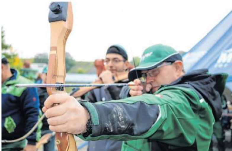
Bei Ausflügen können die Mitarbeiter zusammen Spaß haben und Neues ausprobieren.