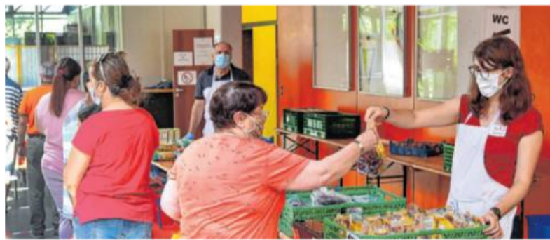
Der Tafelladen Bietigheim-Bissingen braucht neue Mitarbeiter

Im Schnitt besuchen zwischen 140 und 160 Kunden an jedem der drei Öffnungstage pro Woche die Tafel, und mehr als 100 Mitarbeiter sorgen dafür, dass sie sich mit dem Grundbedarf an Nahrungsmitteln eindecken können. Durch