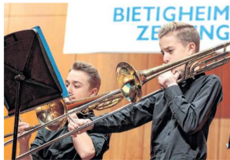
...wie das Benefiz-Konzert im Kronenzentrum, das die Musikschulen auf Bietigheim-Bissingen, Besigheim und Bönnigheim seit sieben Jahren präsentieren.

Kreissparkasse Ludwigsburg, DE82 6045 0050 0007 0300 04