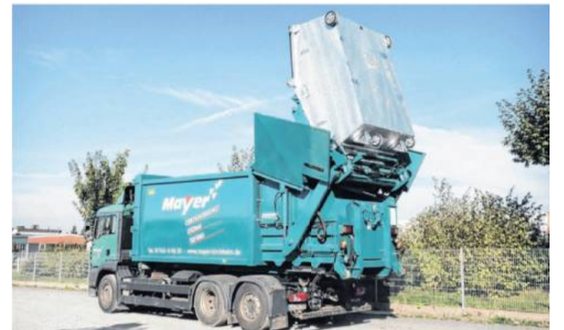
Seit 75 Jahren ist die Eugen Mayer GmbH & Co. KG auf zahlreichen Geschäftsfeldern aktiv. Auch bei der Entsorgung.