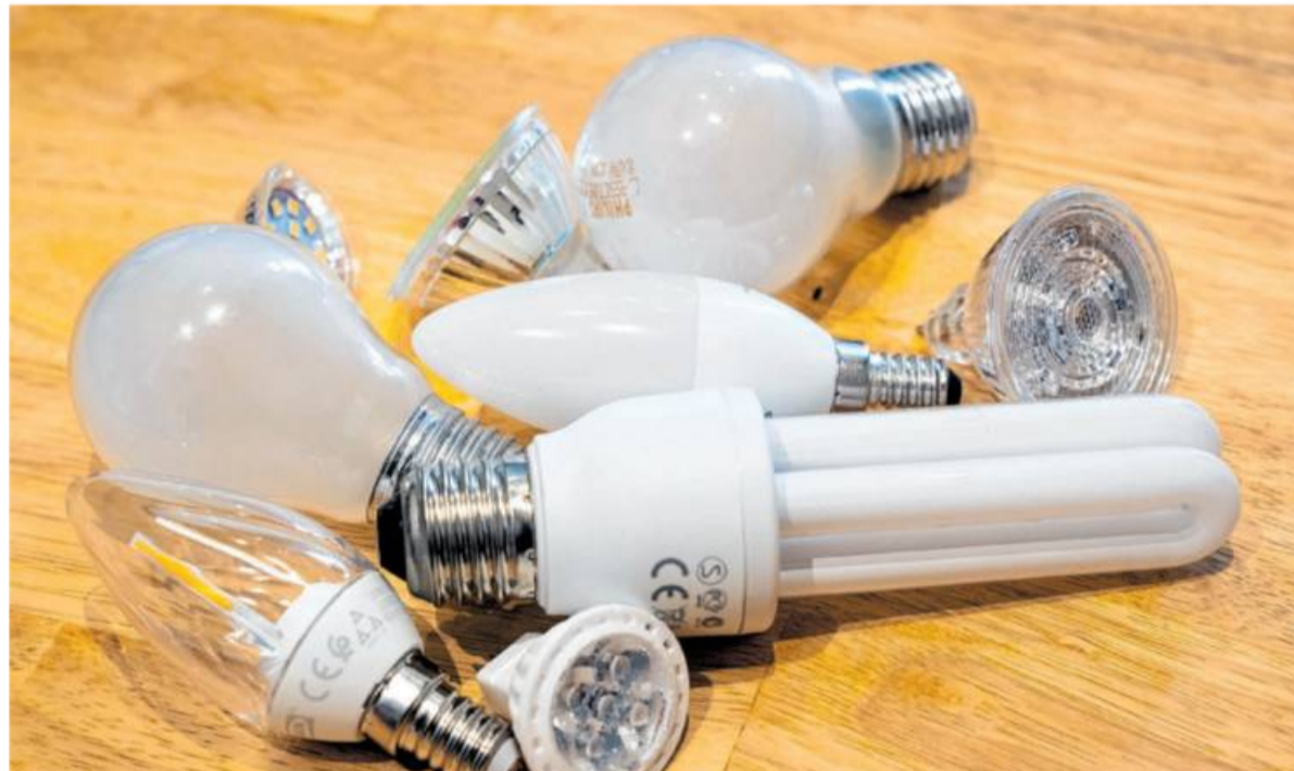
Glühlampe, LED, Halogenstrahler: Angebote gibt es viele auf dem Markt. Heutzutage werden vor allem LED-Leuchtquellen verwendet.

„Die Technik ist so weit fortgeschritten, dass eine LED bis zu zehnmal so viel Licht wie die frü-