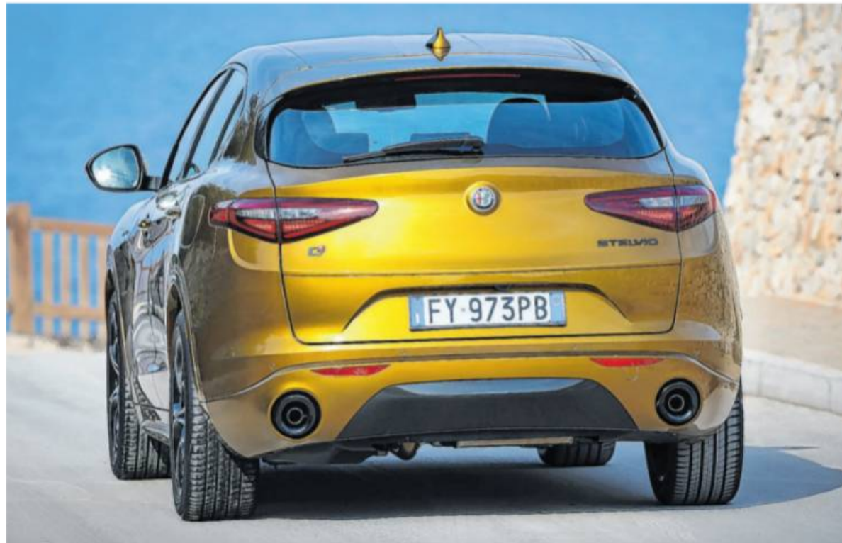
Keine unnötige Schwere: Das Stelvio Heck ordnet sich dem sportlichen Auftritt unter.

Diverse Sicherheitseinrichtungen sind an Bord: Beispielsweise ein Kollisionswarnsystem (Forward Collision Warning, FCW) mit autonomer Notbremsfunktion (AEB) und Fußgängererkennung, ein Spurhalteassistent (Lane Departure Warning, LDW) sowie eine adaptive Geschwindigkeitsregelanlage (Adaptive Cruise Control). Diese passt die eigene Geschwindigkeit nicht nur