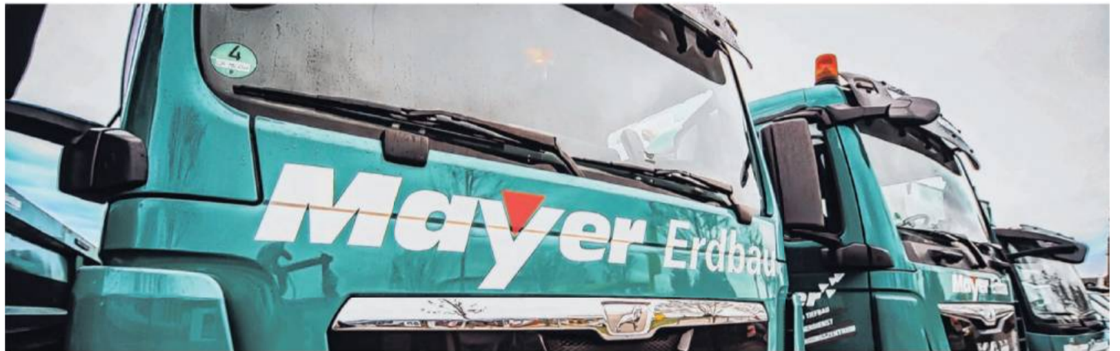
Die grünen Lastwagen mit dem markanten Schriftzug sieht man häufig auf den Straßen der Region. Im Umkreis von rund 40 Kilometern um Kirchheim ist die Eugen Mayer GmbH & Co. KG aktiv.