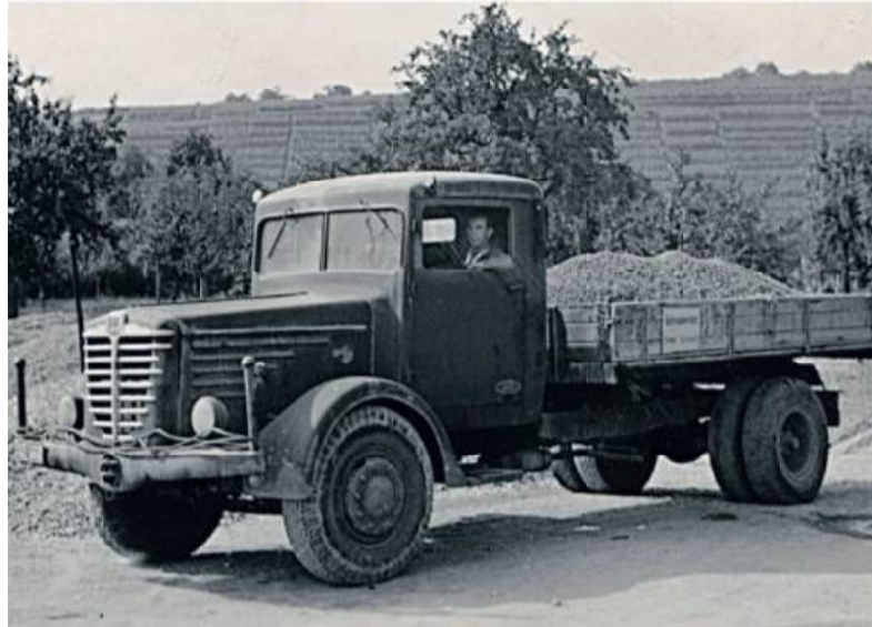
Dieses Bild zeigt den Firmengründer Eugen Mayer im ersten Lkw, der 1945 angeschafft wurde.

1972 wurde der erste Bagger angeschafft. Heute wird mit modernsten Maschinen und Geräten gearbeitet.