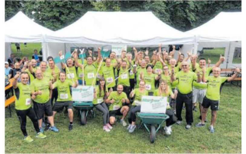
Auch sportlich sind die Mitarbeiter regelmäßig aktiv und laufen für ihr Unternehmen.