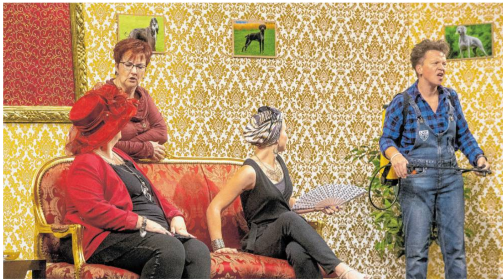
Die BZ-Theaterabende in der Bietigheimer Kelter mit den Löchgauer Fleckabutzern, auf dem Foto bei ihrer Premiere „Oifach versnobbt“ in der Gemeindehalle Löchgau Anfang Oktober, fallen in diesem Jahr genauso aus...

BZ-Aktion. Auch 2020 gelte es, „mit den Spenden dort Not zu lindern, wo wir häufig nicht hinsehen“.