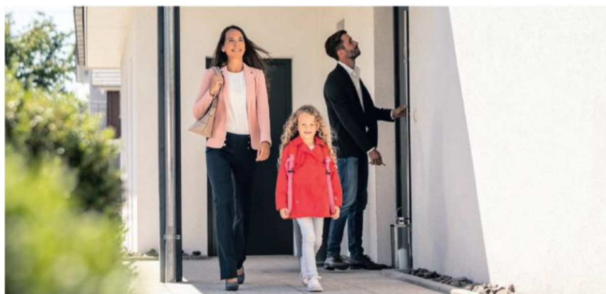
Die Haustür beim verlassen des Hauses immer abzuschließen, ist eine wichtige Grundregel.