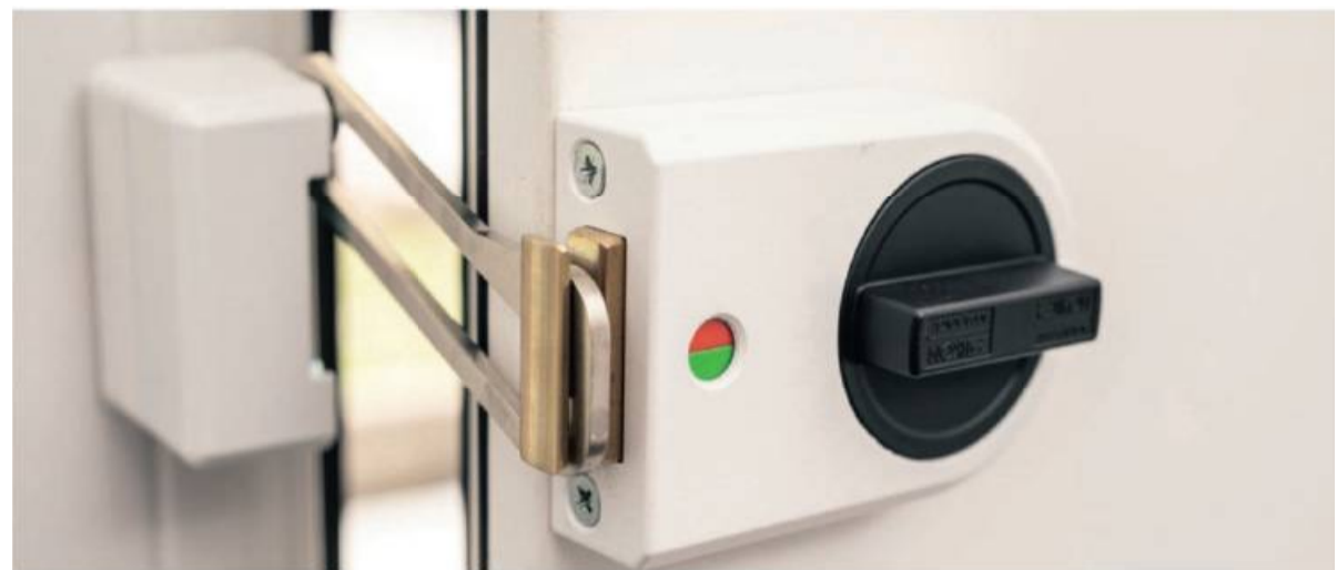
Ein Kastenriegelschloss ist eine gute Ergänzung für die Haustür.

zu nötig sind, fasst das Faltblatt „Einbruchschutz zahlt sich aus“ zusammen. Das von der Polizei gemeinsam mit der Stiftung Deutsches Forum für Kriminalprävention (DFK) herausgegebene Faltblatt ist bei jeder (Kriminal-)Polizeilichen Beratungsstelle kostenlos erhältlich. Es kann außerdem unter www.k-einbruch.de/medienangebot/detail/227-einbruchschutz-zahlt-sich-aus/ heruntergeladen werden.