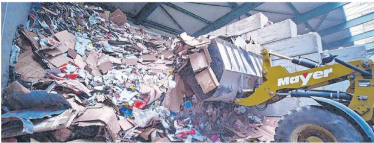
Im Entsorgungszentrum Neckar können sowohl Privatpersonen als auch Gewerbetreibende ihre Abfälle entsorgen.

Nähere Auskünfte zum Angebot gibt es unter Telefon (07143) 89 53 11.