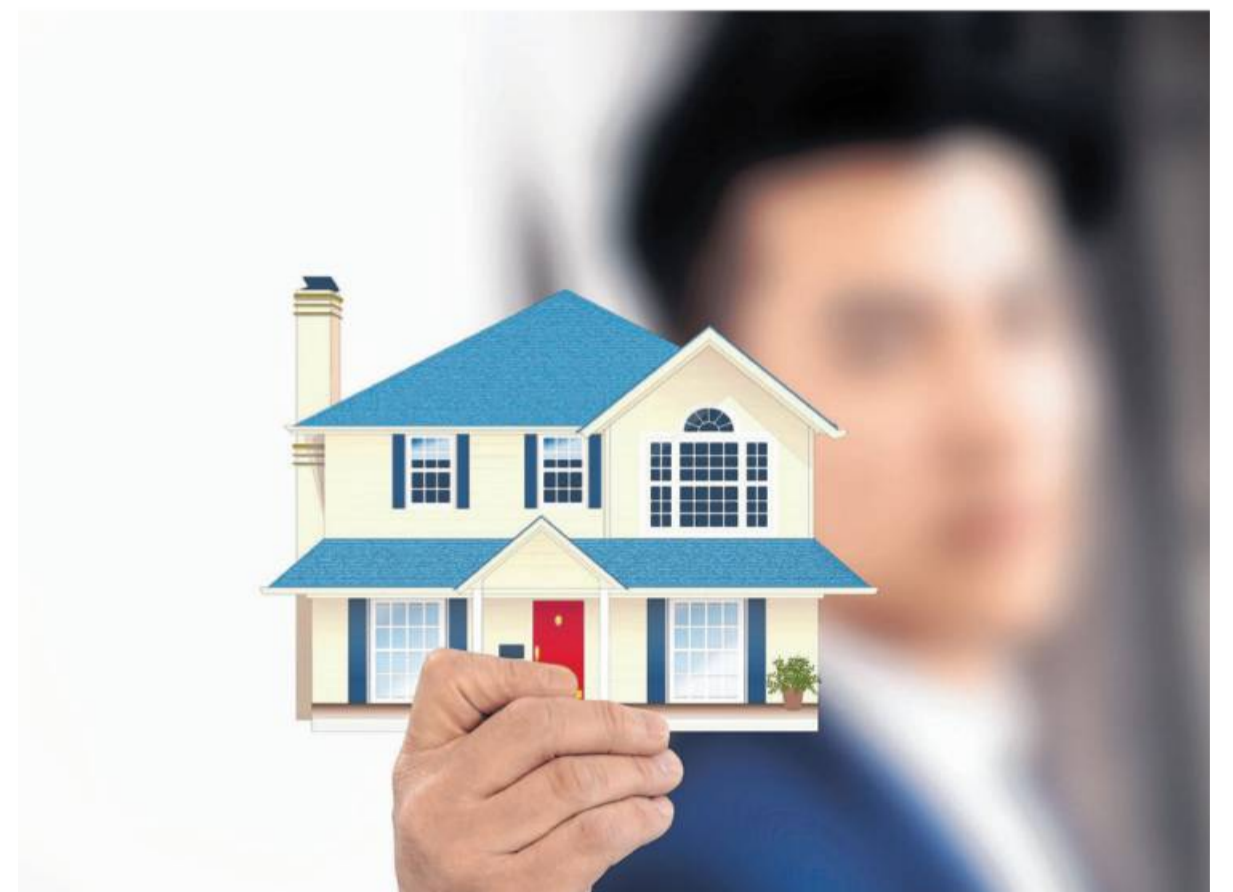
Wer aus beruflichen Gründen eine neue Wohnung benötigt und für die Suche einen Makler beauftragt, kann die Provision als Werbungskosten von der Steuer absetzen.

Bei Kaufimmobilien gilt diese Regelung allerdings nicht. Selbst wenn der Umzug aus beruflichen Gründen stattfindet, ist die Provision nicht absetzbar. Denn beim Kauf einer Immobilie gehören die Maklergebühren zu den so genannten Anschaffungsnebenkosten – und die sind nicht absetz-