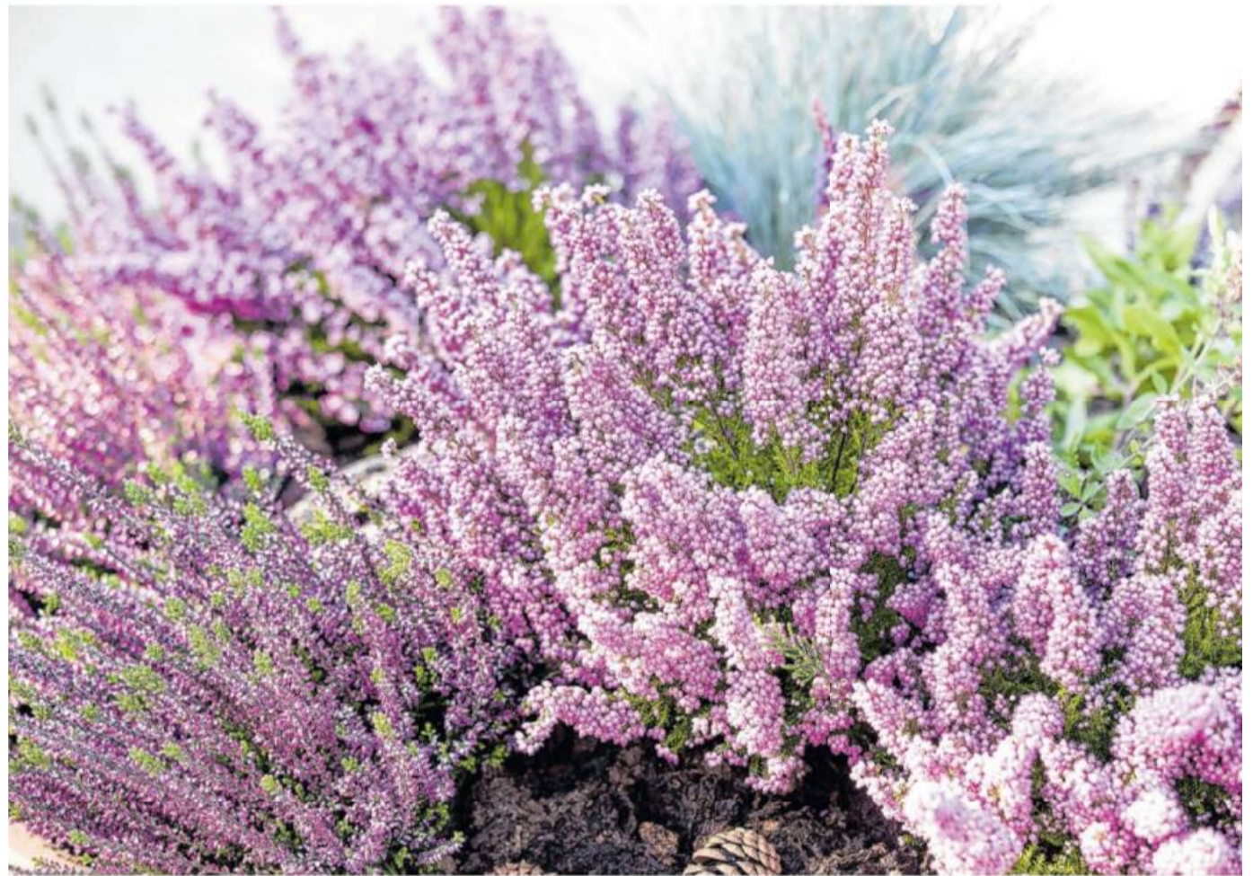
Heidepflanzen setzen im Herbst mit unzähligen Blüten in leuchtenden Farben Akzente.