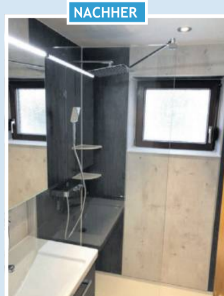
Nachher: Zusammenführung zu einer Bad-Oase