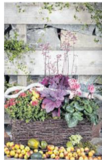
Eine herbstliche Kombination aus rosa Alpenveilchen, rostroten Chrysanthemen und purpurner Heuchera.

Im Herbst wird das Wetter grauer, die Tage kürzer und viele Pflanzen gehen in die Winterruhe. Zum Glück gibt es aber auch für diese Jahreszeit attraktive Blumen und Pflanzen. Besonders schön sind jetzt Kombinationen aus Blüten, Blättern und Halmen. Die Gartenexperten von „Blumen - 1000 gute Gründe“ empfehlen ein paar Klassiker: Blütenstars im Herbst sind sicher die bekannten Herbst-Chrysanthemen (Chrysanthemum) und Astern mit ihren sternförmigen Blüten, die die Stauden in großer Zahl bedecken. Ebenfalls eine tolle Flächenwirkung haben Heide-Gewächse (Erica und Calluna), die über und über in einer Farbe blühen. Beruhigung ins Arrangement bringt man mit Blattschmuckpflanzen in kühleren Tönen. Hierfür sind zum Beispiel Zierkohl (Brassica oleracea), Silber-Greiskraut (Jacobaea maritima) oder Purpurglöckchen (Heuchera) gut geeignet. Ziergräser sorgen