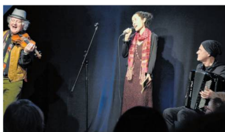
„La Vie en Rose“ lautet die erste Veranstaltung der Reihe: ein Chansonabend am 18. September auf dem Marktplatz Besigheim.

„Wir dachten, wir seien Götter“, heißt es am 25. September ab 19 Uhr auf dem Marktplatz: eine Hommage an die Woodstock-Generation – ein Abend mit grandio-