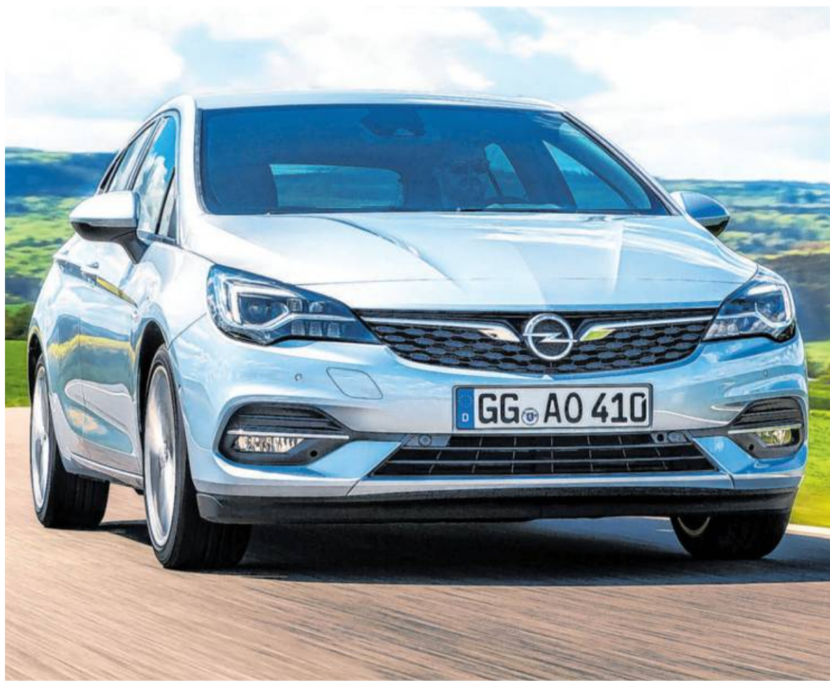
Auffällig: Die schlanke Chromspanne im Kühlergrill in Insignia-Manier.

Unter der Haube setzt Opel beim Astra ausschließlich auf Dreizylinder aus eigener Entwicklung, die noch zu GM-Zeiten begonnen hatte. Erst die kommende zwölfte Astra-Generation wird komplett auf PSA-Technik basieren. Jetzt ist für die Turbobenziner 1,2 Liter die Maßzahl für den Hubraum. Aus ihm können 110 PS für das Basismodell geholt