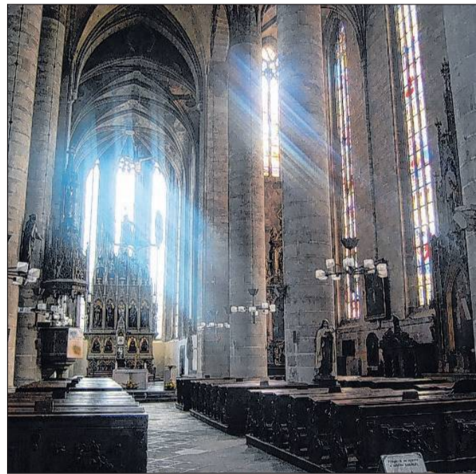
Ob man sich für eine Trauerfeier in einer Kirche oder bei einem Bestattungsunternehmen entscheidet, ist von den Vorstellungen des Verstorbenen abhängig.

einem freien Redner oder einem Angehörigen geleitet werden. Hierbei ist es möglich, eine persönliche Rede zu halten oder Gedichte vorzulesen. Zudem besteht die Möglichkeit, die Trauerfeier musikalisch zu unterlegen. Auch hierbei empfiehlt es sich, bei der Wahl der Musik den Geschmack des Verstorbenen zu berücksichtigen. Generell ist bei einer Trauerfeier, ganz gleich welcher Art, eine Sitzordnung üblich. So sitzen üblicherweise die engsten Angehörigen des Verstorbenen in der ersten Reihe der Trauerhalle oder Kirche. Danach folgen weitere Verwandte und enge Freunde sowie entfernte Verwandte und Bekannte des Verstorbenen. Auf dem Weg zum Grab begleiten die engsten Angehörigen die Urne oder den Sarg in vorderster Reihe. Während des Trauerzugs wird Stille bewahrt und persönliche Gespräche zwischen den Trauer Gästen vermieden. lps/jm.