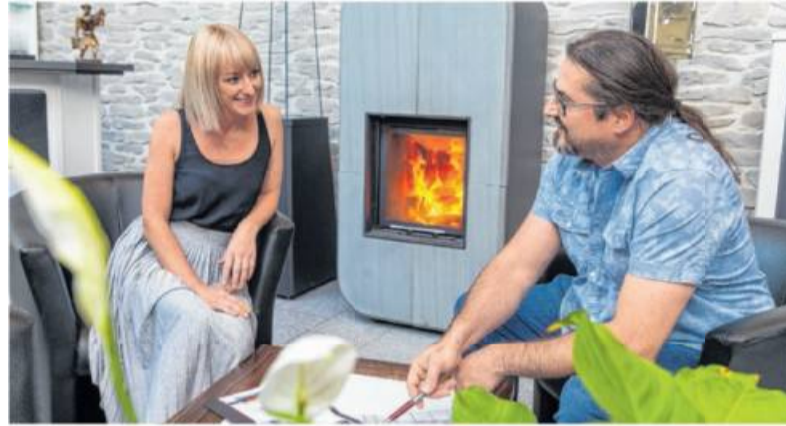
Ausführliche und persönliche Beratung zur aktuellen Gesetzeslage ist bei Novaline selbstverständlich.

fo-Wochenendes beim Kaminofenhersteller Novaline am 19. und 20. September können sich alle Kaminofen-Besitzer darüber informieren, ob ihr „alter“ Kaminofen noch betrieben werden darf, worauf man beim Kaminofen achten sollte und welche Vor-