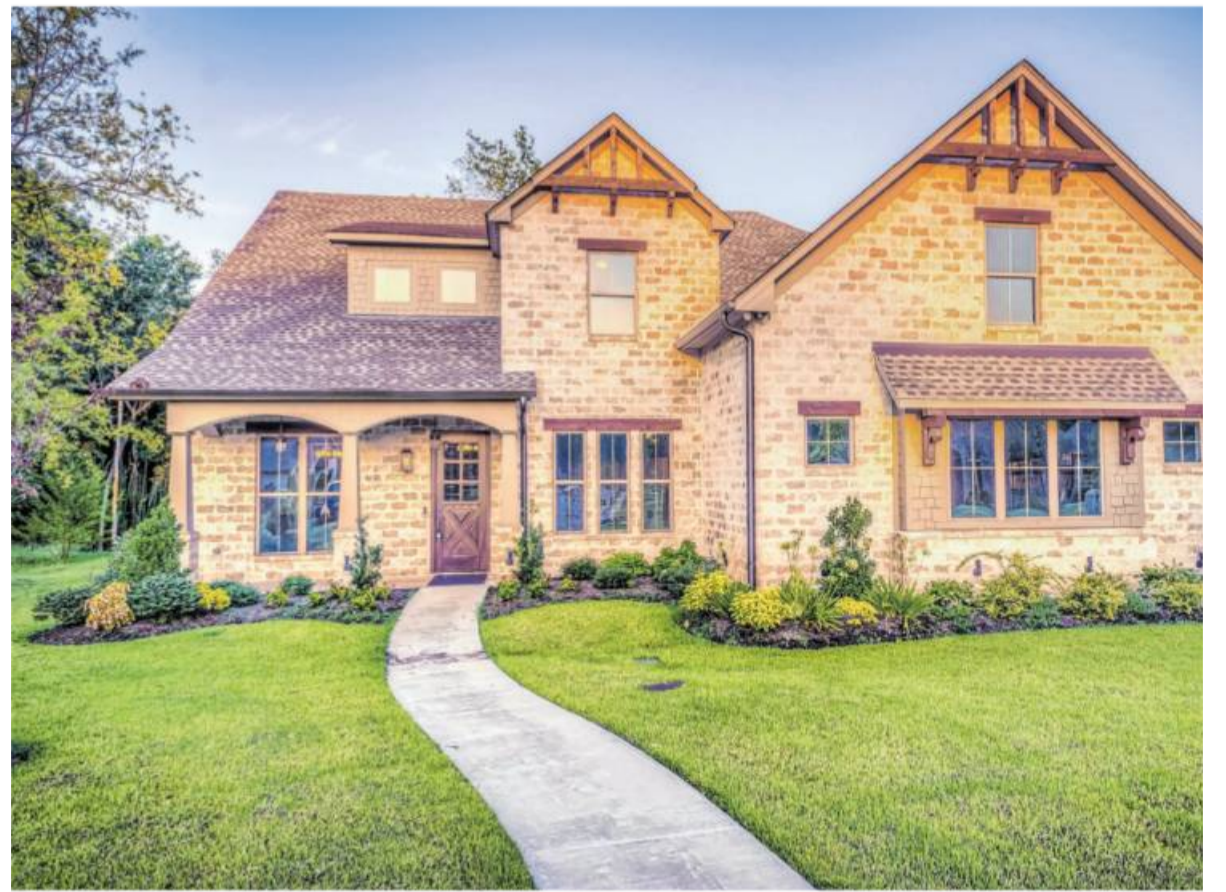
Wohnen Mieter und Vermieter unter einem Dach, kann der Vermieter kündigen – und zwar ohne einen gesetzlich anerkannten Kündigungsgrund.

Beruft sich der Vermieter auf dieses Recht, verlängert sich die Kündigungsfrist des Mieters um drei Monate. Bei einer Mietdauer von bis zu fünf Jahren wären das dann sechs statt drei Monate. Außerdem können sich Mie-