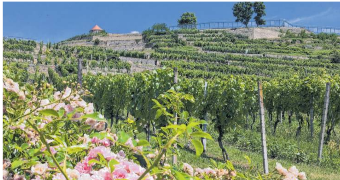
Um „Wengert, Wahn und Weiberzeche“ geht es bei der Wein- und historischen Erlebnistour am 20. September am Hohenasperg.

Unterhaltsame Anekdoten zum Wein und zur Geschichte des Asperger Bergs runden die Veranstaltung ab. Die Teilnehmer lernen einen Asperger Wengert kennen, und bei einem letzten köstlichen Tropfen wird schließlich das Geheimnis des Tränenbergs gelüftet.