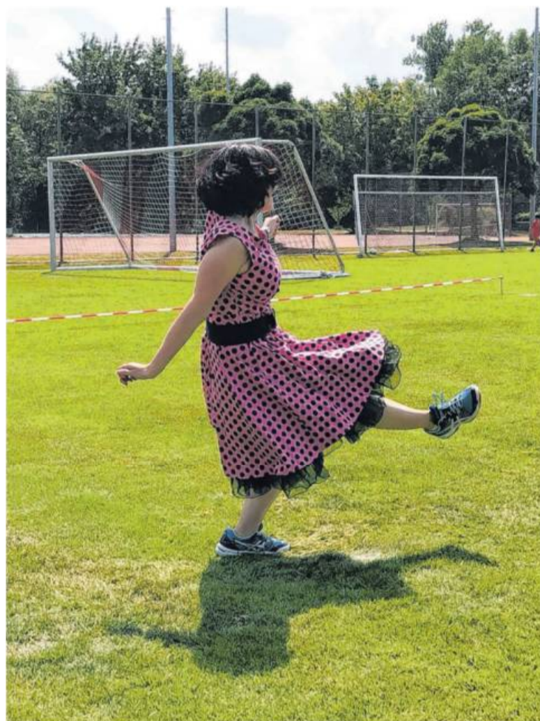
Der Spaß steht im Vordergrund des Turniers: den Gewinn erhält zum Beispiel nicht der Turniersieger, sondern die Mannschaft mit dem originellsten Erscheinungsbild.

Spaß am Ball in originellen Outfits: Wo „Hembeerle“ gegen „Die 7“ antreten. Von Inga Stoll