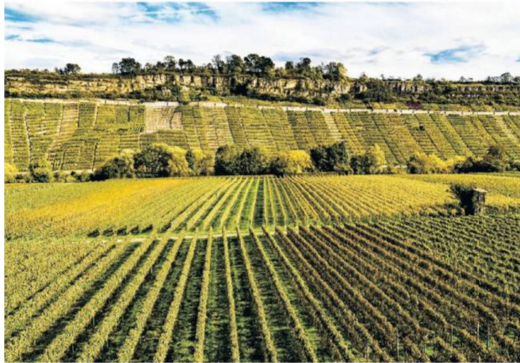
Auch hier wird Wein angebaut: die Felsengärten in Hessigheim.

Im Stuttgarter Raum und in der Esslinger Gegend wachsen an den Steilhängen des Neckartals füllige, cha-