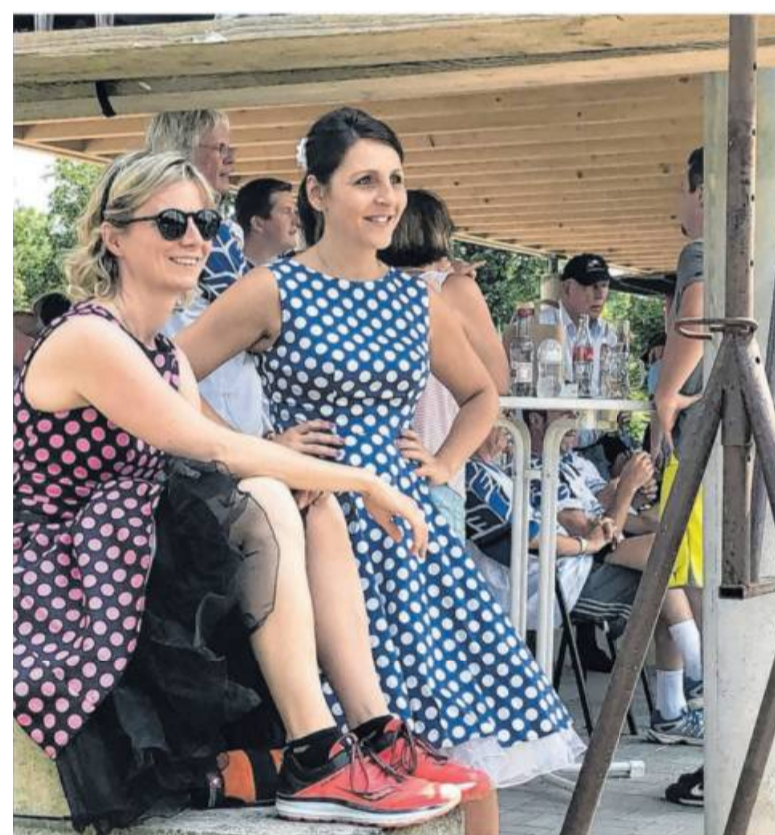
In stilechtem Outfit: Mitstreiterinnen vom Team Rockabilly beim Elfmeterturnier 2018.

Auch das leibliche Wohl kommt nicht zu kurz: Versorgt werden Teilnehmer und Zuschauer mit Roter Wurst, Currywurst, Pommes oder Fleischbrot vom Holzkohlegrill, Bier vom Fass, Wein, Sekt und verschiedenen alkoholfreien Getränken.