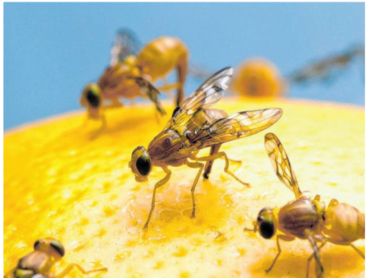
Störenfriede wie etwa Fruchtfliegen kann man mit natürlichen Mitteln loswerden.

Vorbeugend sollten Arbeitsflächen immer gründlich gereinigt