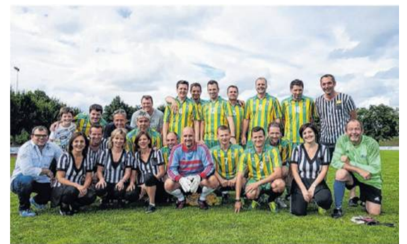
Auch die Mannschaft des FC Wiesenkicker ist in diesem Jahr wieder mit dabei.

Zum sechsten Mal ist das Sportgelände Fischerwörth in Großingersheim Schauplatz eines Elfmeterturniers mit Mannschaften, die sich aus Firmen, Vereinen, Stammtischen und anderen Gruppen gebildet haben.