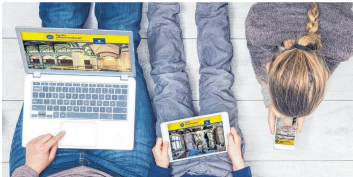
Auf der Website des Aktionstags kann jeder die Denkmale digital entdecken.

Beispiel das Eglosheimer Rathaus und die Friedenskirche: Ein Film zeigt die historischen Besonderheiten des Rathauses, und ein Video mit Bildergalerie illustriert den Wandel von der Garnisonkirche zur Friedenskirche. Noch viele weitere Denkmale sind bundesweit an diesem Tag online zu erleben.