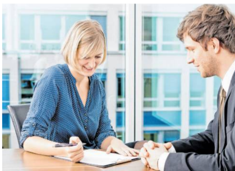
„Was muss ich besser machen?“ Das Mitarbeitergespräch ist eine Gelegenheit, konkrete Fragen zu stellen. Für fachliche Kritik sollten beide Seiten offen sein.