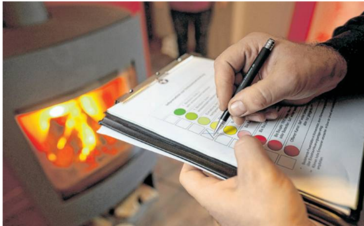
Der Bezirksschornsteinfeger prüft, ob ein Holzofen den vorgeschriebenen Schadstoffausstoß einhält und noch betrieben werden darf.

Betroffen von den Maßnahmen sind ummauerte Feuerstätten mit einem industriellen Heizeinsatz und einer Leistung von mindestens vier Kilowatt, die zwischen 1985 und 1994 errichtet wurden und deren Emissionswerte für