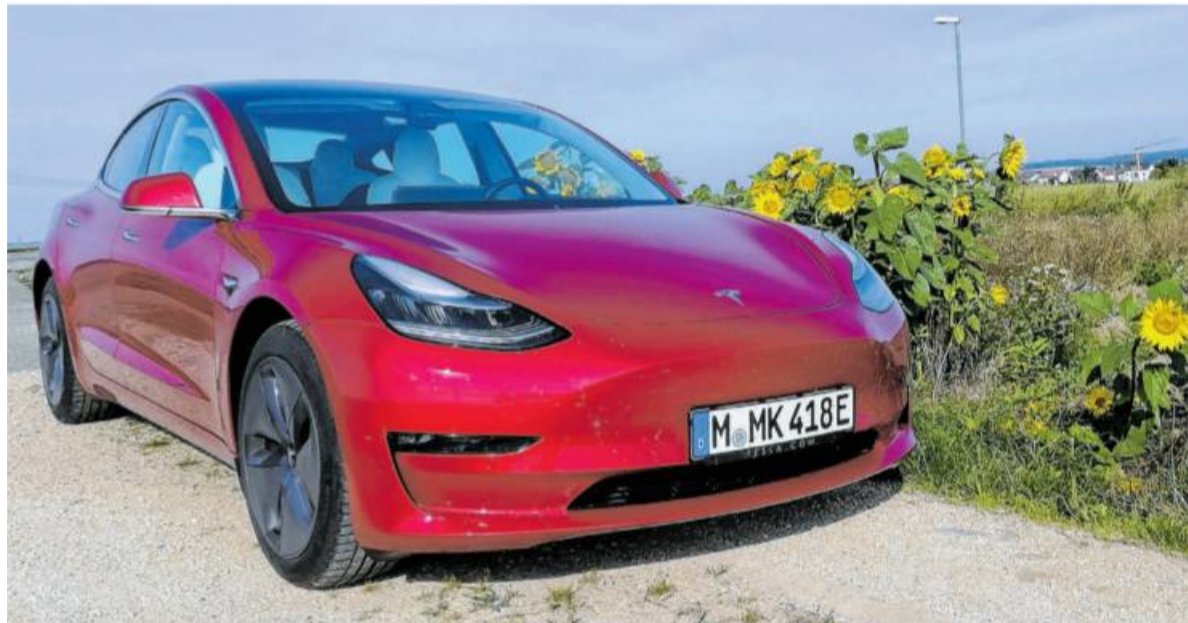
Achtung Fußgänger und Radfahrer: Hier rollt der lautlose Tesla Model 3 vorbei. Der Vollstromer wird erst ab etwa 150 km/h auf der Autobahn lauter, dann durch Windgeräusche im Innenraum.

W arum sehen alle Elektro-Autos – vorsichtig formuliert – so unschön aus? Dies war eine viel diskutierte Frage, als vor Jahren die ersten E-Fahrzeuge auftauchten mit zugegebenermaßen sehr kuriosen Modell-Zeichnungen. „Das Hässliche-Entlein-Image“ hat sich seither stark gewandelt und die Entwicklung zum „stolzen Schwan“ durchlaufen. Vorzeige-Exemplare hat neben anderen Tesla hervorgebracht wie zum Beispiel der „Kleinste“ der Kalifornier, „Model 3“ genannt.