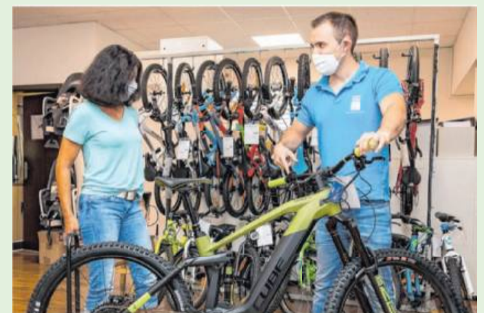
Ausführliche und kompetente Beratung sind bei Fahrrad Imle selbstverständlich.

Sowohl hier als auch im dazugehörigen Cubestore in Ludwigsburg, Teinacherstraße 54, kann der Kunde aus dem Vollen schöpfen. Gerade der Hersteller Cube hat die Zeit während des Lockdowns genutzt und hat entgegen vieler anderer Hersteller sein Vorratslager aufgestockt, so dass die Produktion nach der Schließung sofort wieder anlaufen konnte. Ein zweiter Vorteil: Cube stellt über 90 Prozent seiner Fahrräder und E-Bikes in