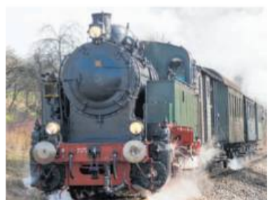
Der „Feurige Elias“ fährt wieder auf seiner Stammstrecke.

Am Sonntag, 13. September, kann der Museumszug „Feuriger Elias“ der GES Stuttgart e. V. wieder auf seiner Stammstrecke Korntal – Weissach fahren. Zum Einsatz kommt die 1928 gebaute, vereinseigene Dampflok mit der Bahnnummer 16. Sie zieht die betriebsfähigen Personenwagen des einzigartigen, ins Ladesdenkmalbuch eingetragenen Hohenzollernzugs aus der Zeit um 1900. Auf den offenen Plattformen der Waggons können die Fahrgäste die Fahrt durch das landschaftlich reizvolle Strohgräu hautnah erleben, in den Waggons herrscht das Flair der „Holzklasse“ vor und