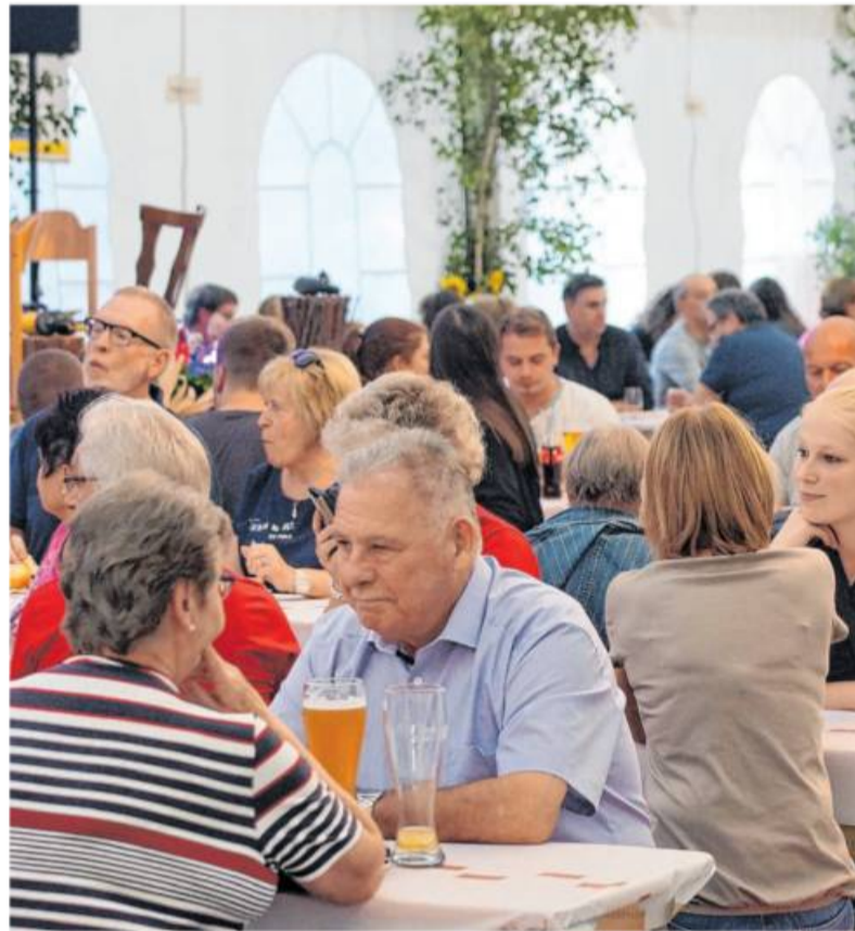
Gut besucht: So war es bisher beim „Gemmrigheimer Herbst“. In diesem Jahr gelten wegen Corona andere Regeln.

Musikverein nicht Halt gemacht. Die Fixausgaben etwa für die Jugendausbildung und die Dirigentengelder sind geblieben, die Möglichkeiten, Geld einzunehmen dagegen wurden mächtig eingeschränkt. Frei nach dem Motto #SonstKommtIhrZuUns-JetztKommenWirZuEuch! marschieren verschiedene Gruppen der drei Orchester durch den