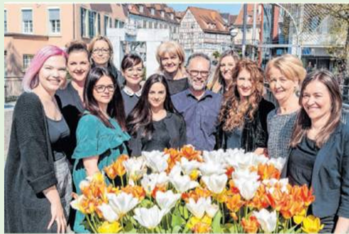
Unser Archibild aus dem Jahr 2019 zeigt das Team von Schrenk Frisöre und Beauty Lounge.