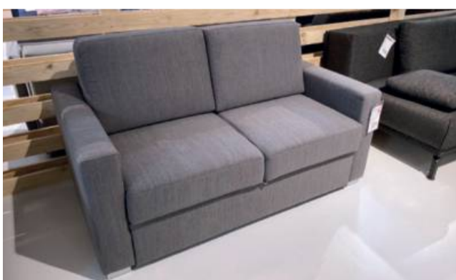
Schlafsofa Mara , ca. 158 cm breit, Liegefläche ca. 123 x 208 cm statt 1050,- jetzt nur 699,-

Zwischenverkauf vorbehalten. Alle Preise Abholpreise. Lieferung und Montage gerne gegen Mehrpreis.