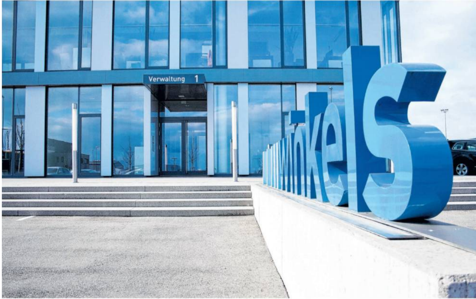
Der Umweltgedanke ist Teil der Unternehmensphilosophie der Winkels Gruppe – angefangen bei der Gebäudebilanz bis hin zum Mehrwegsystem.

Mehrwegflaschen, treibstoffsparende LKW oder neueste Technologien: hohes Umweltbewusstsein bei der Winkels Gruppe. Von Inga Stoll