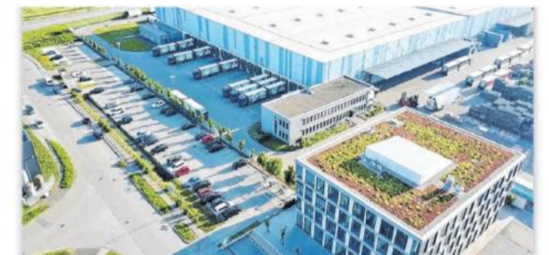
Die Winkels Logistik im Sachsenheimer Gewerbegebiet Eichwald.