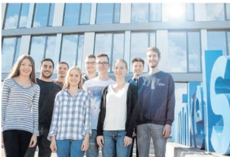
Mit einer Übernahmequote von über 90 Prozent bietet die sogenannte „Talent Quelle“ vielversprechende Zukunftsaussichten.

Dabei werden die Studiengänge BWL-Handel (Bachelor of Arts) und BWL-Industrie (Bachelor of Arts) angeboten.