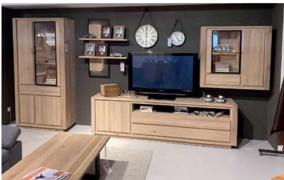
Natura Anbausystem Amber , massive Eiche white wash, ca. 349 cm breit, incl. Beleuchtung statt 4283,- jetzt nur 2499,-