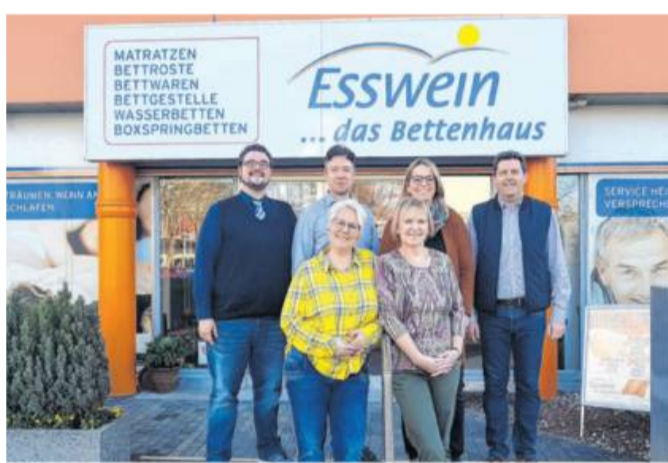
Bettenhaus Esswein: Der Service am Kunden wird hier noch großgeschrieben.

Eine Stunde im Bettenhaus Esswein ist eine Stunde für Gesundheit und Wohlbefinden.