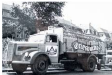
Firmenlogistik damals ...