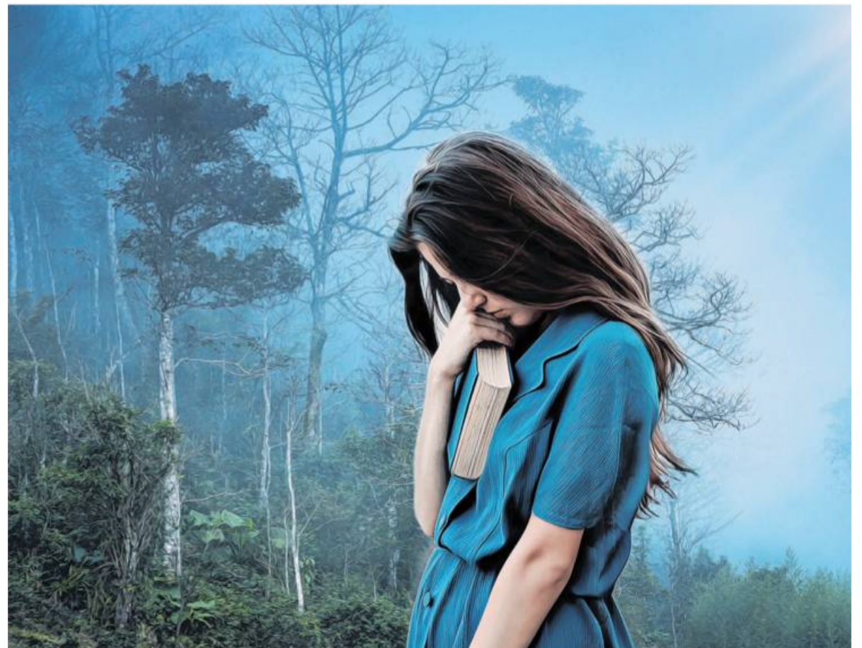
Auch wer an einer Depression leidet, muss seine Miete rechtzeitig bezahlen.

Ist der Mieter für die Zahlung der Miete auf öffentliche Stellen angewiesen, trägt er das Risiko, dass diese pünktlich zahlen.