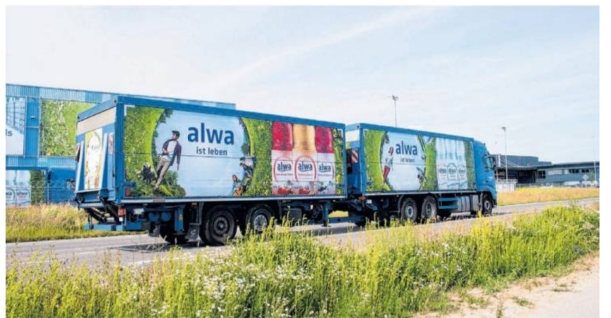
Auch bei den Themen Fuhrpark und Logistik setzt die Unternehmensgruppe auf Nachhaltigkeit.

Und da es sich im Falle der Winkels Gruppe um ein regionales Unternehmen handelt, sind die Transportwege ohnehin überschaubar: Winkels liefert fast ausschließlich in Baden-Württemberg und in angrenzende Regionen.