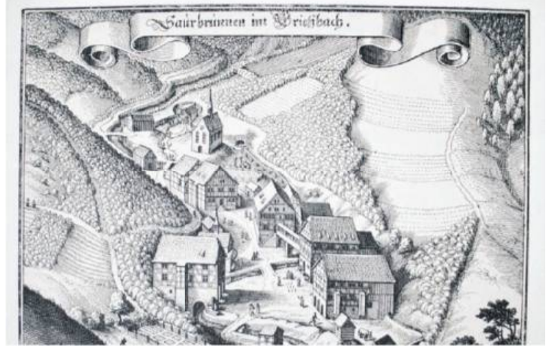
Der Griesbacher Brunnen auf einem Kupferstich.

Weitere innovative Investitionen in den darauf folgenden Jahren bis hin zum Erwerb der Rietenauer Mineralquellen folgen, ebenso ein Umzug der Verwaltung nach Sachsenheim, Bau eines neuen Zentrallagers in Östringen, Ausbau der Gastronomie-Aktivitäten und diesbezüglicher Ko-