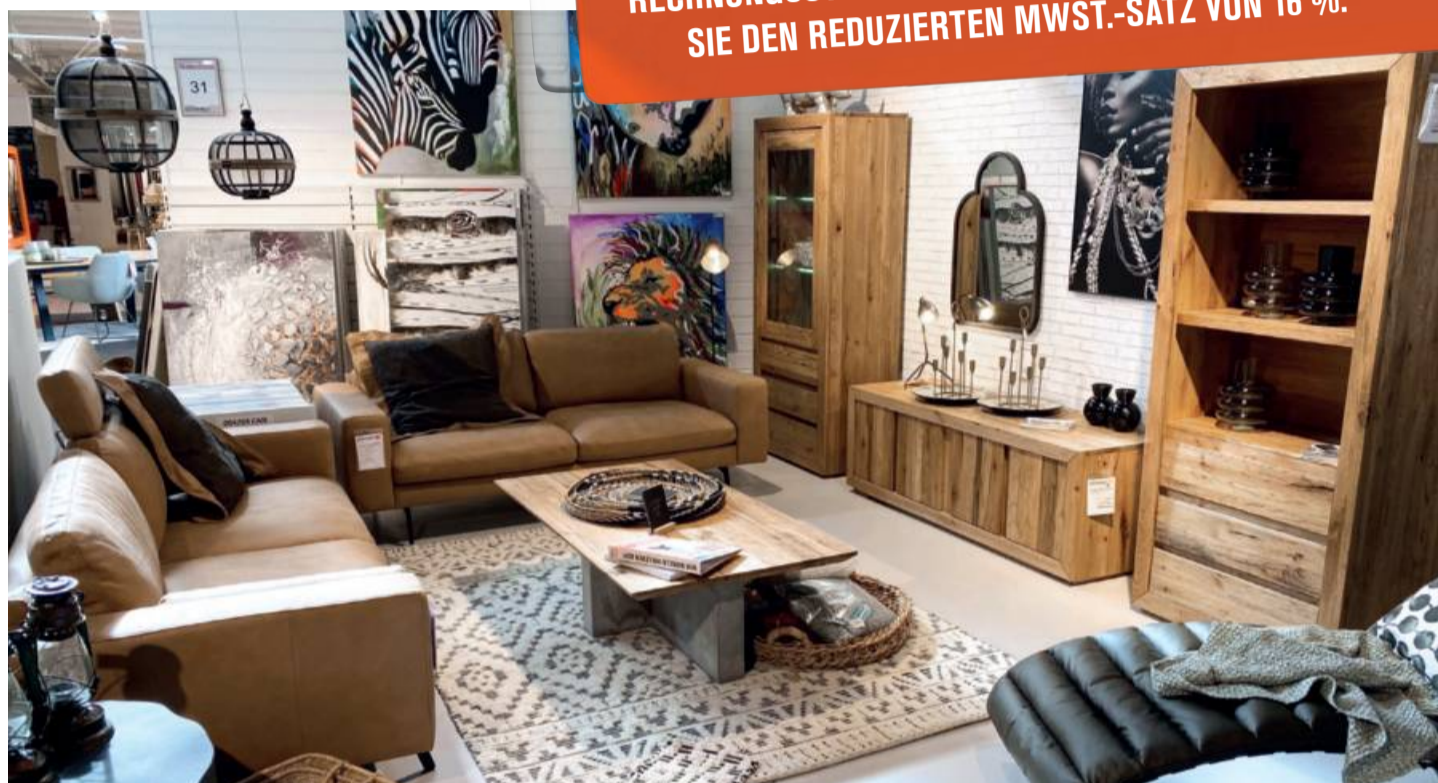
Exclusive Polstergruppe Styles United Tumaco , feinstes Leder, Sofa 216 cm + 196 cm breit, incl. 2 große Zierkissen komplett 4943,- jetzt nur 2799,-