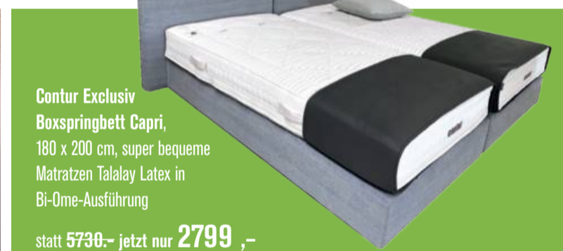
Contur Exclusiv Boxspringbett Capri , 180 x 200 cm, super bequeme Matratzen Talalay Latex in Bi-Ome-Ausführung statt 5730,- jetzt nur 2799,-

JETZT SOFORT LIEFERBAR MIT ATTRAKTIVEN MUSTERSTÜCKEN AUS UNSERER AUSSTELLUNG.