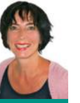
Inga Stoll Rundschau-Redaktion

Der Klassiker Casablanca von 1942. Alte Krimis aus den 60ern oder 70ern. Filme, die erst kürzlich gedreht wurden, deren Handlung aber im letzten Jahrhundert stattfindet. Sie alle haben eines gemeinsam: die Protagonisten rauchen, was das Zeug hält und trinken Whisky, Brandy, Cognac & Co. am helllichten Vormittag. Im Büro! Mit Geschäftspartnern und Kollegen! Ist das zu glauben?