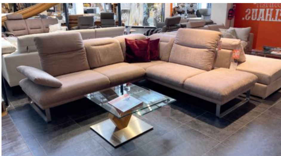
Polstergruppe Kolibri , mit Sitztiefenverstellung, Kopfteilverstellung und Armlehne klappbar, ca. 239 x 276 cm, incl. 2 Zierkissen komplett 3953,- Sonderpreis 2499,-

KONJUNKTURPAKET - AUCH FÜR ALTAUFTRÄGE! FÜR ALLE LIEFERUNGEN UND ABHOLUNGEN MIT RECHNUNGSSTELLUNG AB DEM 1. JULI 2020 ERHALTEN SIE DEN REDUZIERTEN MWST.-SATZ VON 16 %.