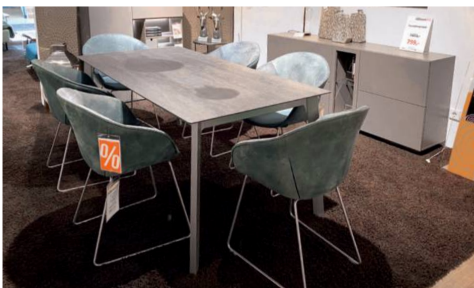
Global Keramiktisch Talavera , 90 x 180 cm, ausziehbar auf 260 cm statt 1814,- jetzt nur 1199,-

ALLE PRODUKTE UND NOCH VIELES MEHR AUS ALLEN WOHNBEREICHEN SOFORT LIEFERBAR.