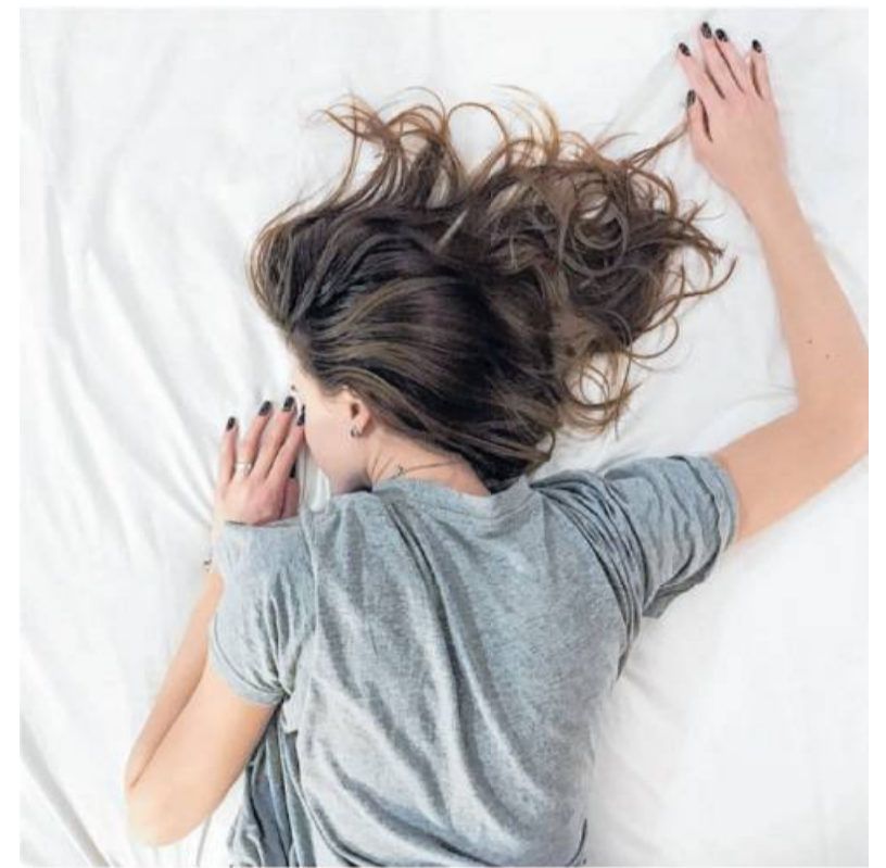
Wer gut schläft, stärkt sein Immunsystem.

beheben. Hier hilft meist ein Besuch im nächsten Bettenfachgeschäft, wo speziell ausgebildete Fachberater für guten Schlaf und richtiges Liegen gerne weiterhelfen. vdb