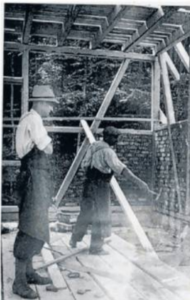
Winkels-Mitarbeiter der ersten Jahre.

90 Jahre Winkels Historie: das sind neun Jahrzehnte kluger Entscheidungen und sprudelnder Ideen – oder auch: sprudelnder Quellen, die man achtsam nutzt.