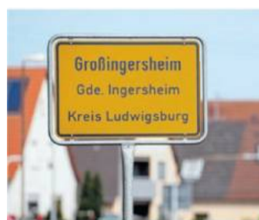
Ingersheim ist reich an Sagen.

Man fand nur aufgewühlten Boden und einen schwarzen Fleck an der Stelle, an der sie gestan-