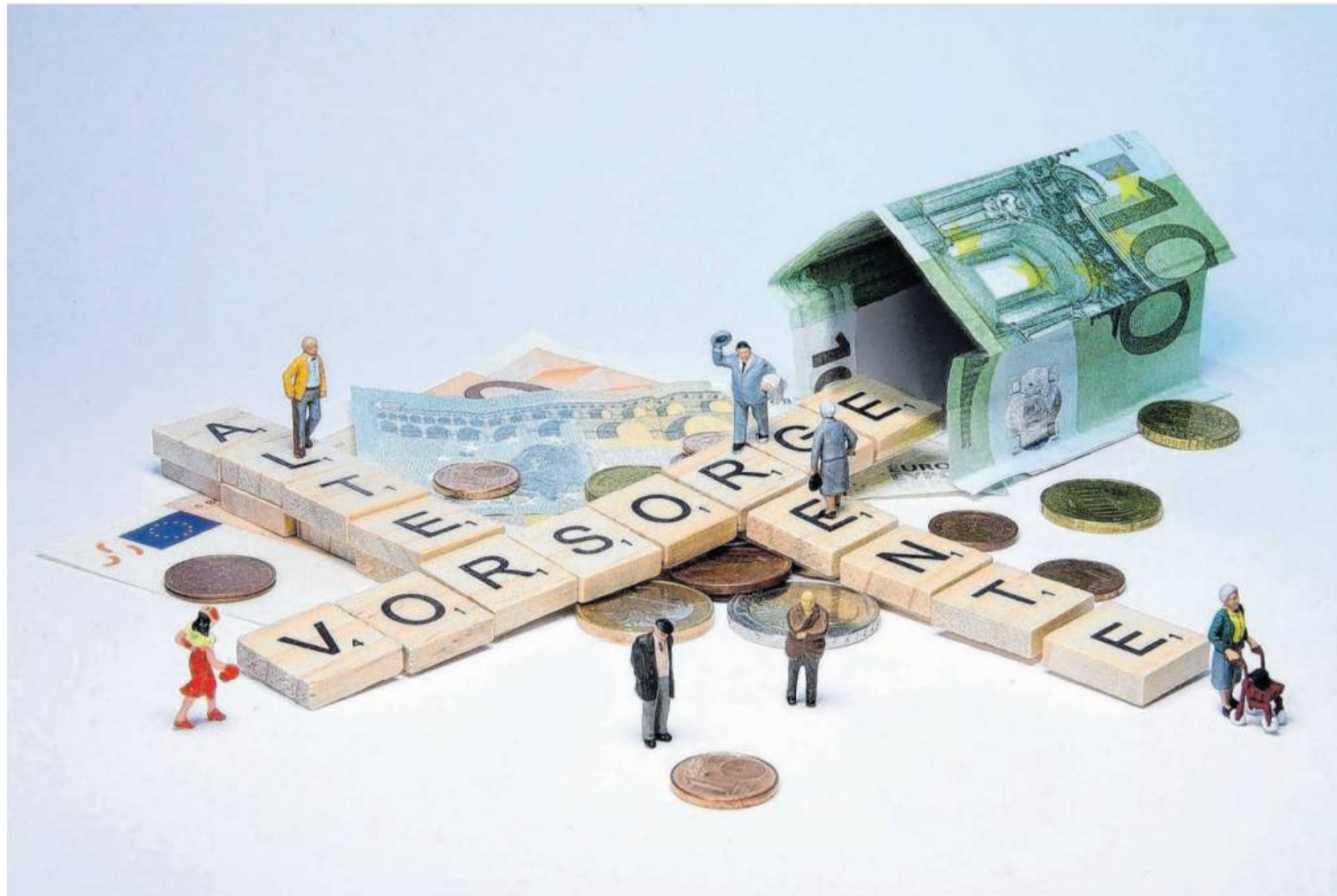
Welche Geldanlage für welche Person mit welchem Ziel bei welchen finanziellen Möglichkeiten? Bei der Auswahl nach einer individuellen Lösung sind gute Ratgeber gefragt.

Prioritäten setzen bei der Finanzplanung: Tipps der Verbraucherzentrale