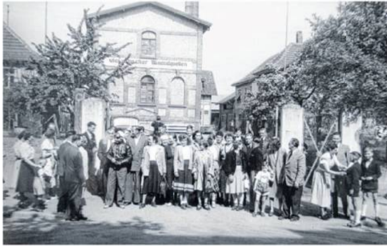
Die Wertschätzung der Mitarbeiter gehörte schon in den Anfangsjahren zur Unternehmensphilosophie – das hat sich bis heute nicht geändert.

Auszubildende und dual Studierende werden in der Winkels Gruppe buchstäblich „mit allen