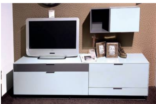
Contur Lowboardkombi , feinstes Lack matt, ca. 212 cm breit, 3-tlg. ohne Deko statt 2498,- jetzt nur 1499,-