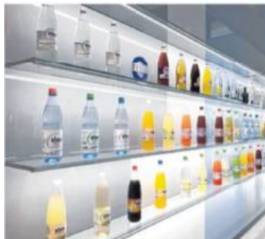
Ausgewähltes Sortiment der Winkels Gruppe heute.