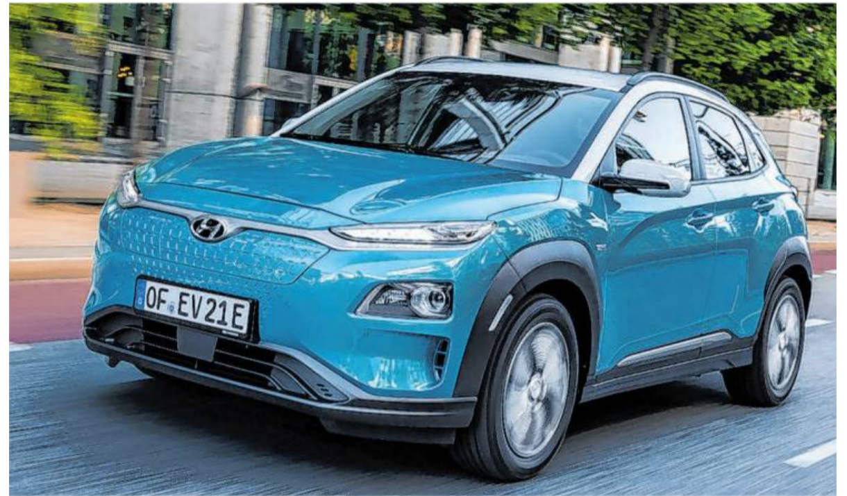
Hyundai hat die Produktion des Kona Elektro enorm hochgefahren.

Ganz passt der Vergleich mit den eineiigen Zwillingen nicht. Denn es gibt ein wesentliches Unterscheidungsmerkmal zwischen den beiden Familienmitgliedern aus Korea und Tschechien: Der Europäer hat immer die „dicke-re“ Batterie an Bord, die dem