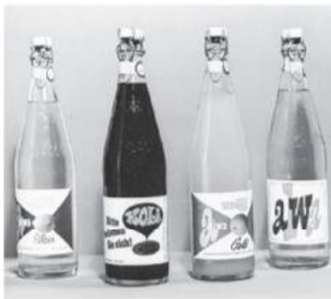
alwa-Sortiment in den 70er Jahren .....