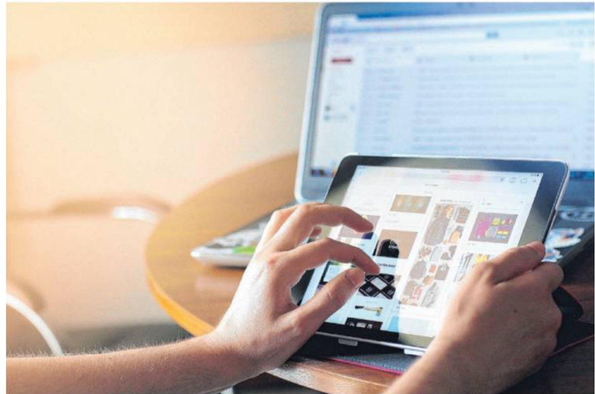
Einkauf in Zeiten von Corona: viele kaufen jetzt online ein.

Lieferung, Beratung, Hilfe und Rat in Zeiten von Corona – viele kaufen online ein