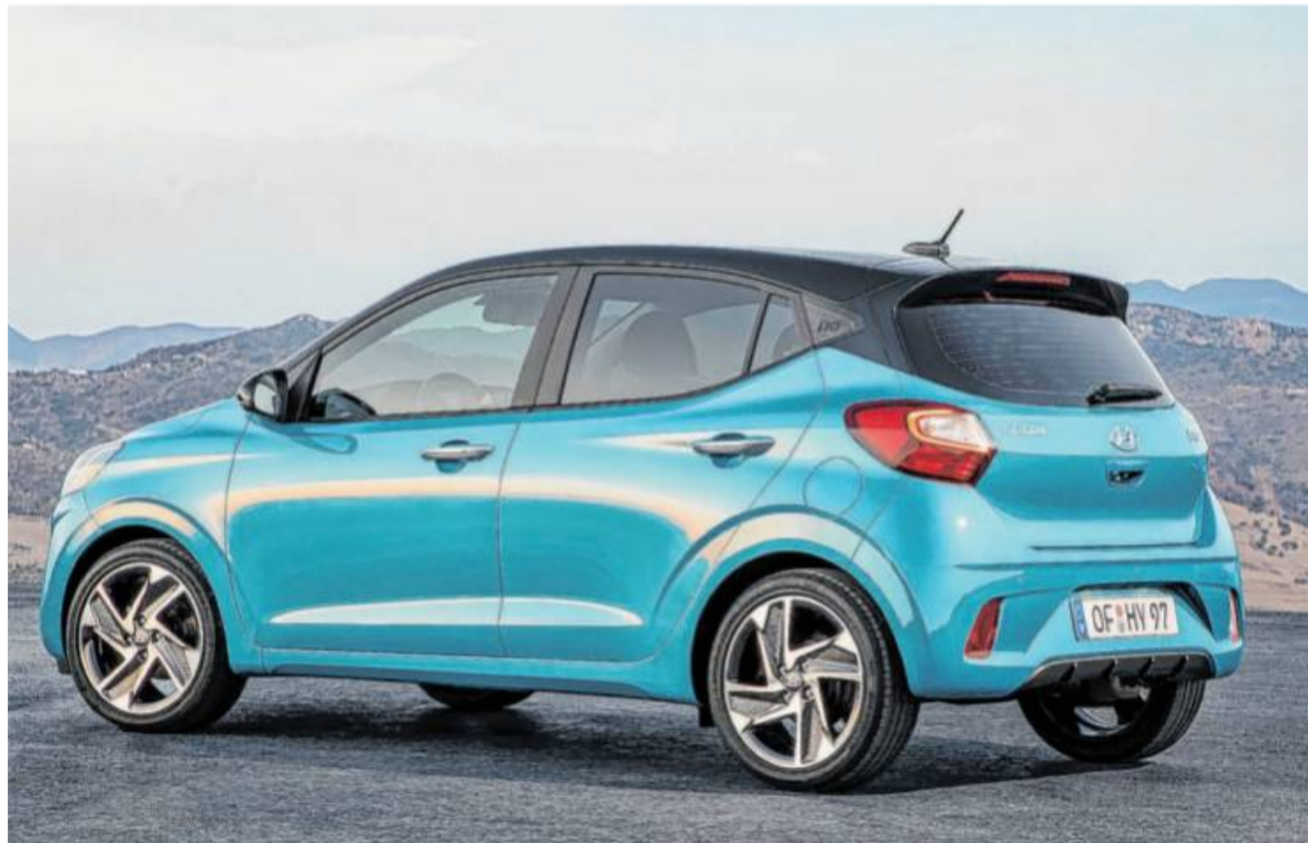
In Zweifarben-Optik erhältlich: Der Hyundai i10 wirkt schick.

Das Auge fährt mit – darum gibt es den neuen i10 mit seiner auffälligen, x-förmigen C-Säule erstmals auch in drei frischen neuen Außenfarben und in den Versionen Trend und Style mit einer Zweifarben-Lackierung mit schwarzem oder rotem Dach. Das Innendesign ist komplett neu, etwa mit einem 3D-Wabenmuster auf Armaturenbrett und Türverkleidungen. Die neue Formgebung schafft mehr Platz und ein besseres Raumgefühl für die Frontpassagiere. Dazu bietet Hyundai auch im Kleinwagen-