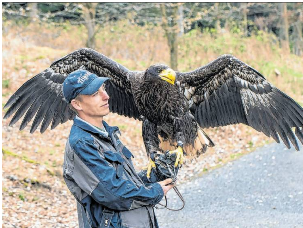
Die Riesenseeadlerdame „Katharina die Große“ muss zu ihrem Falkner ein besonderes Vertrauensverhältnis aufbauen.

den Flugvorführungen mitmachen kann, ist es wichtig, dass die Falkner zu ihr ein besonderes Vertrauensverhältnis aufbauen.