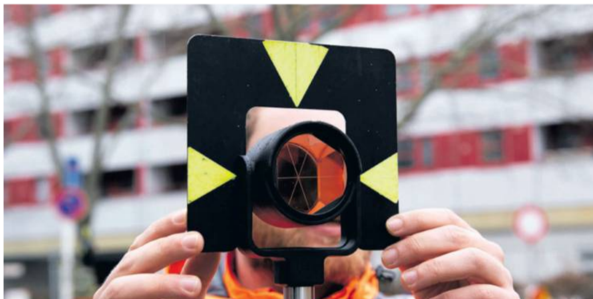
Vorbereitung für die Baustelle: Vermessungstechniker bestimmen Lage, Neigung und Höhe eines Grundstücks. Mit den Daten zeigen sie an, wo Grundstück gebaut werden soll.