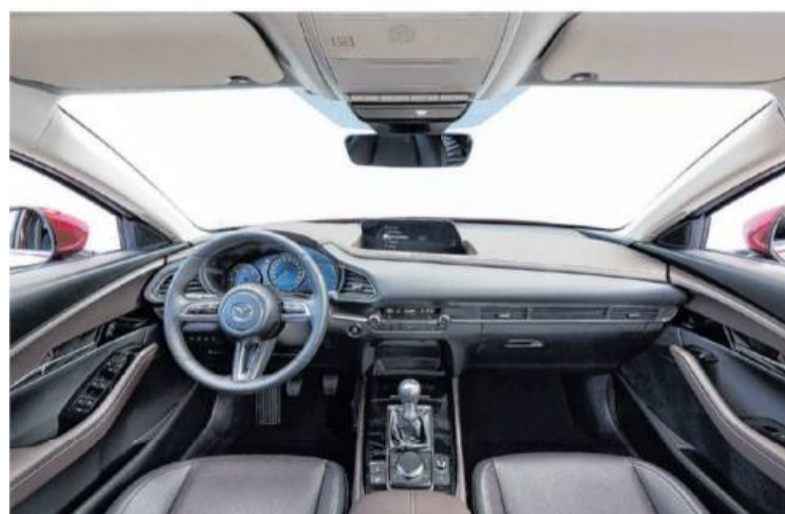
Reichlich Platz im Inneraum gibt's beim Mazda CX30 für Fahrer und Beifahrer.

Der Zusatz „M“ Hybrid im Namenszug des Crossover-SUV