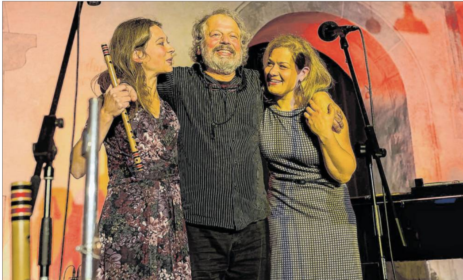
Die beiden für dieses Jahr terminierten Lepp-Live-Konzerte sind jetzt auf Freitag, 23., und Samstag, 24. April 2021 verschoben worden.

Und die beiden Lepp-Live-Konzerte werden am Freitag, 23. April 2021 und Samstag, 24. April 2021, ebenfalls in der Vaihinger Peterskir-