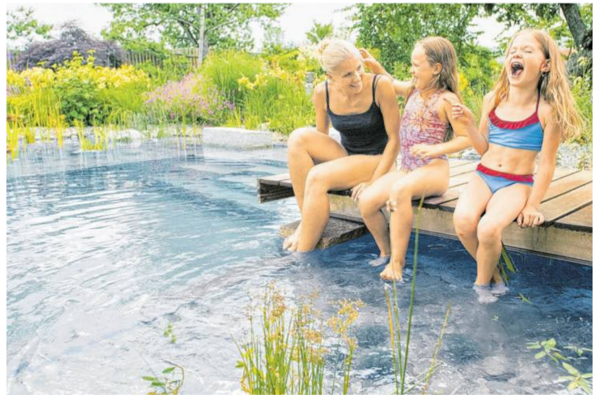
Badespaß ohne Ende: Mit Naturpools und Schwimmteichen wird das Zuhause zum Ferienparadies.