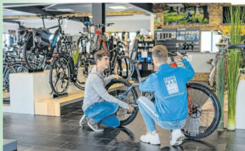
Beratung von Angesicht zu Angesicht: in Zeiten von Corona derzeit leider nicht möglich. Und doch kann man bei Fahrrad Imle weiterhin Fahrräder und Zubehör kaufen.

Regional und trotzdem online kaufen, wie geht das? Fahrrad Imle bietet Lösungen