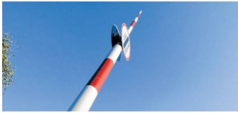
Expertenrat: Die Europäische Union sollte konkret eine aktivere Außenhandelspolitik betreiben.

Der Wissenschaftliche Beirat der Stiftung Familienunternehmen benennt klare Anforderungen an eine nationale wie auch europäische Industriestrategie. „Die Antwort auf die weltwirtschaftlichen Herausforderungen besteht in einem Zweiklang: Wir brauchen bessere Rahmenbedingungen für unsere Unternehmen vor Ort und eine selbstbewusste Politik, die europäische Interessen auf internationaler Ebene entschlossen vertritt“, sagt der Gremiovorsitzende und Vorstand der Stiftung Familienunter-