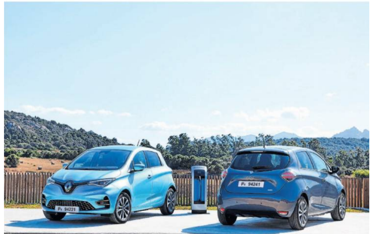
Die jüngste Evolutionsstufe des Elektro-Bestsellers präsentiert sich mit bis zu 395 Kilometer Reichweite im WLTP-Testzyklus attraktiver denn je.

Renault bietet für die neue ZOE Generation Antriebsvarianten mit 80 kW/108 PS und 100 kW/135 PS an, die mit ihrer Motor- und Getriebecharakteristik ein ausgeprägtes souveränes und entspanntes Fahrgefühl gewährleisten. Beide Elektroaggregate sind als fremderregte Drehstrom-Synchronmotoren konzipiert und wurden von