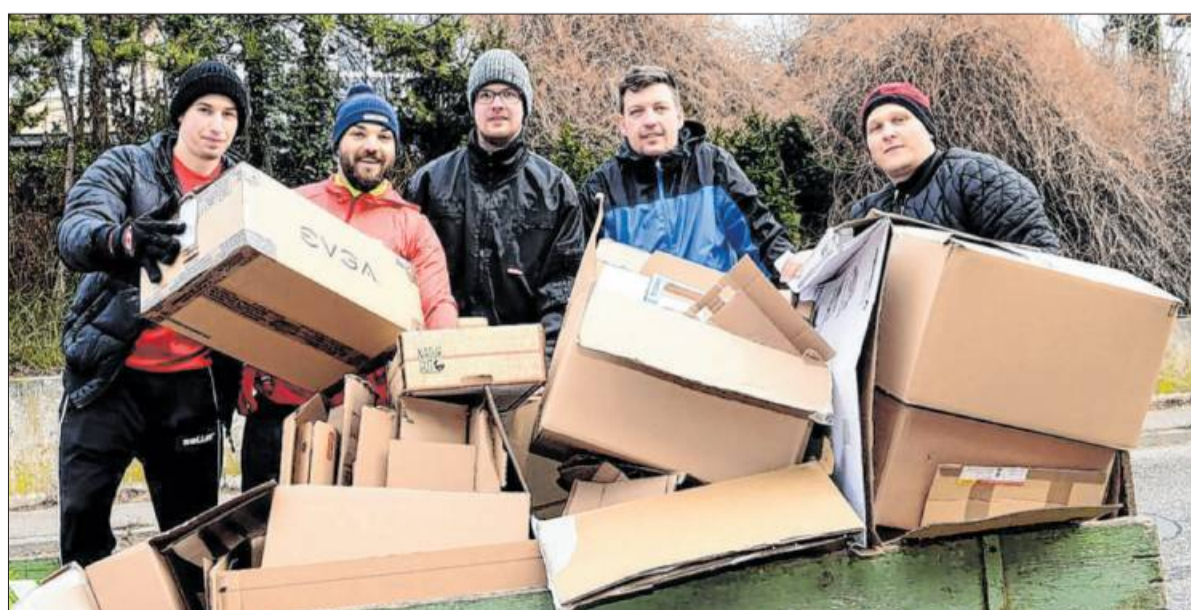
Die AVL gibt Entwarnung: Altpapiersammlungen finden auch weiterhin statt.

Dieses Jahr werden alle geplanten Termine, die auf AVL-Homepage aufgelistet sind, durchgeführt.