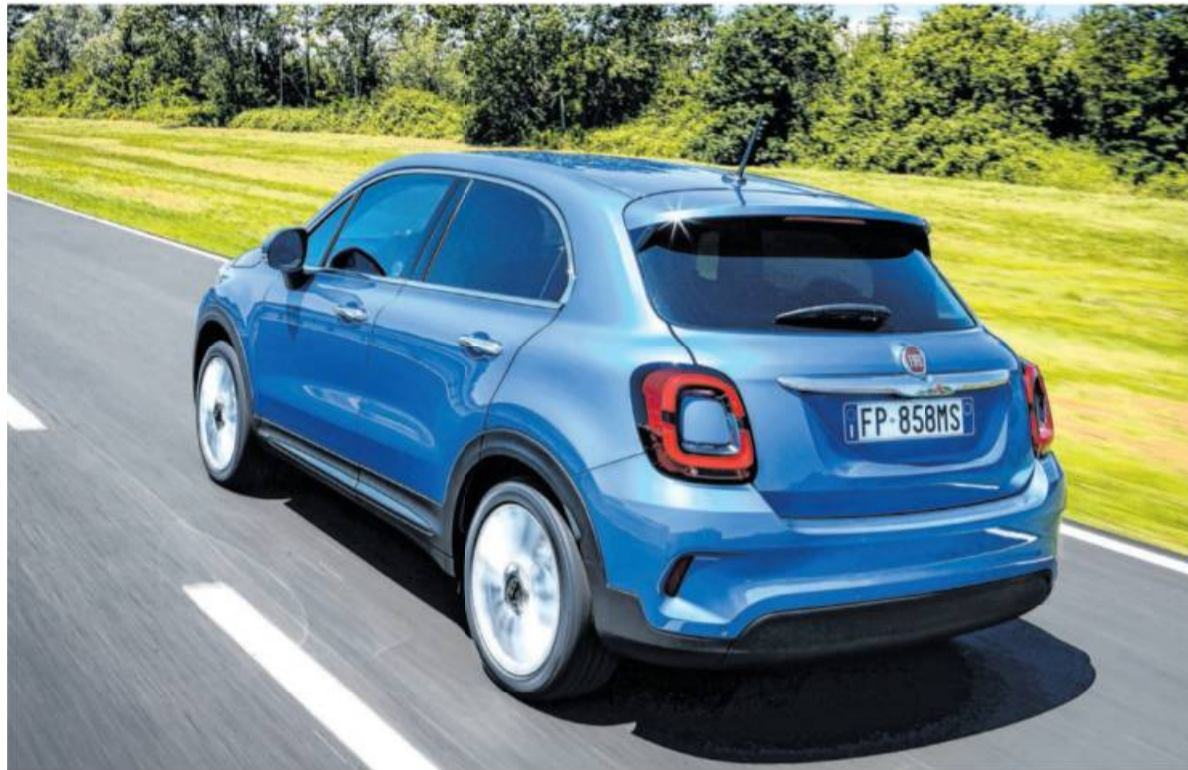
In der neuen Modellgeneration des 500X stecken nun Fire-Fly-Antriebe.

Wer sich für den 500X interessiert, der sollte jedenfalls eine Testfahrt machen, da die Preis-