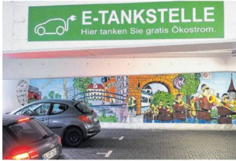
Autos mit Elektroantrieb werden immer beliebter.

Die Zulassungszahlen für Fahrzeuge mit alternativen Antrieben sind gestiegen. Auch Hybrid verzeichnet ein Plus.