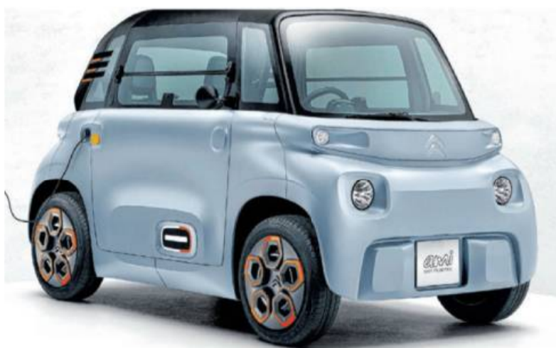
Das E-Gefährt namens Ami ist für zwei Personen geeignet und soll 70 Kilometer weit kommen.

Der Ami – das ist französisch und heißt Freund – darf in Deutschland schon mit 16 Jahren gefahren werden. Eine neue Zielgruppe, die gerade dabei ist, dem Auto den Rücken zu kehren. Nicht nur optisch bietet der kleine Stromer eine unkonventionelle Antwort auf Fragen individueller Mobilität wie seinerzeit mit dem längst zur Ikone erhobenen 2CV. Der Ami soll mit seinen kompakten Abmessungen, einem Wendekreis von 7 Metern und seinem rein elektrischen Antrieb eine emissionsfreie und wetterfeste Alternative zu öffentlichen Verkehrsmitteln und Zweirädern bieten und überdies bezahlbar sein. Er ist ab 6900 Euro erhältlich. Ein 6 kW starkes Elektromotörchen beschleunigt den 485