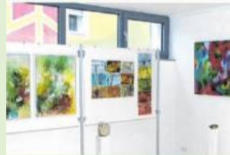
Die Ausstellung „Tatort Atelier“ wird im Rathaus Riet gezeigt.