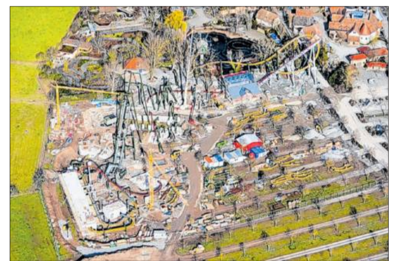
An der Baustelle vor den Toren des Erlebnisparks geht es voran.

Info Weitere Informationen über die aktuelle Situation werden fortlaufend auf www.tripsdrill.de veröffentlicht.