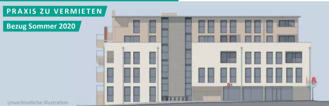
PRAXIS ZU VERMIETEN