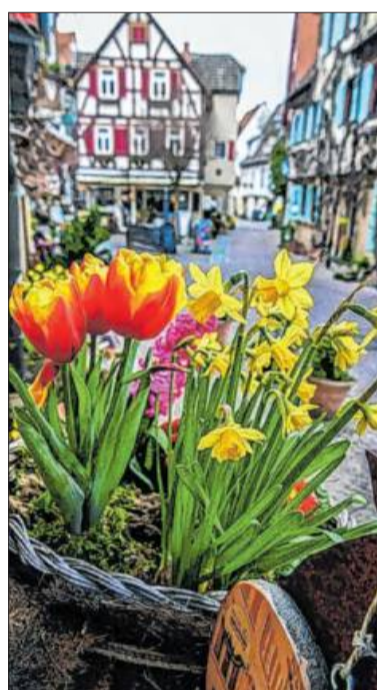
In der Besigheimer Kirchstraße.