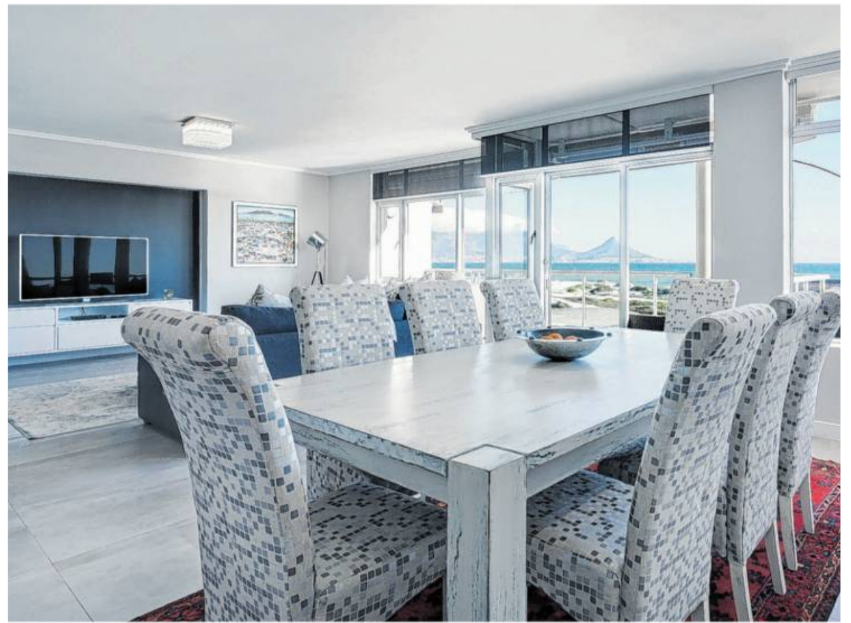
Mieter können an eine Mieterhöhung gebunden sein, obwohl ihre Wohnung in Wirklichkeit ein gutes Stück kleiner ist als vom Vermieter angegeben.

Nach einem früheren BGH-Urteil können Mieter die zu viel gezahlte Miete zurückverlangen, wenn ihre Wohnung in Wahrheit deutlich kleiner ist. Der Dresdner Mieter wollte mehr als 6000 Euro zurück. Doch auch unter Berücksichtigung der wahren Fläche liege die Quadratmetermiete immer noch unter der in Dresden üblichen, entschieden die Richter.