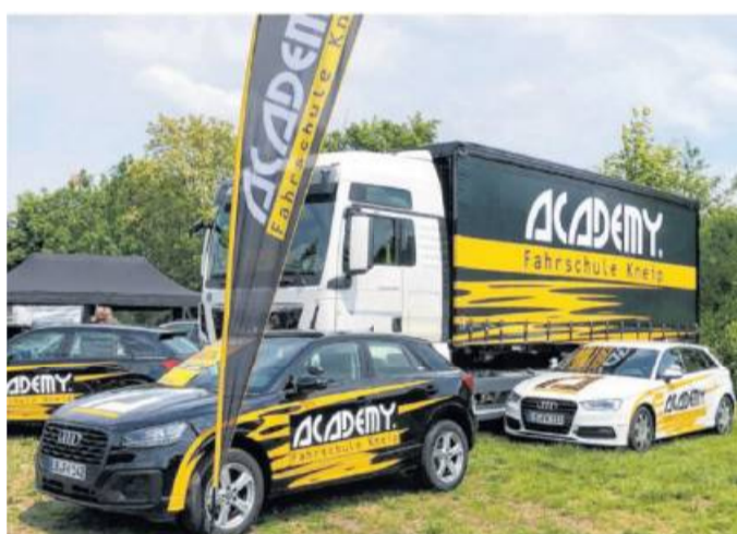
Ein vertrautes Bild in der Region: Ausbildungsfahrzeuge der Academy Fahrschule Kneip.

Academy Fahrschule Kneip an vier Standorten in der Region