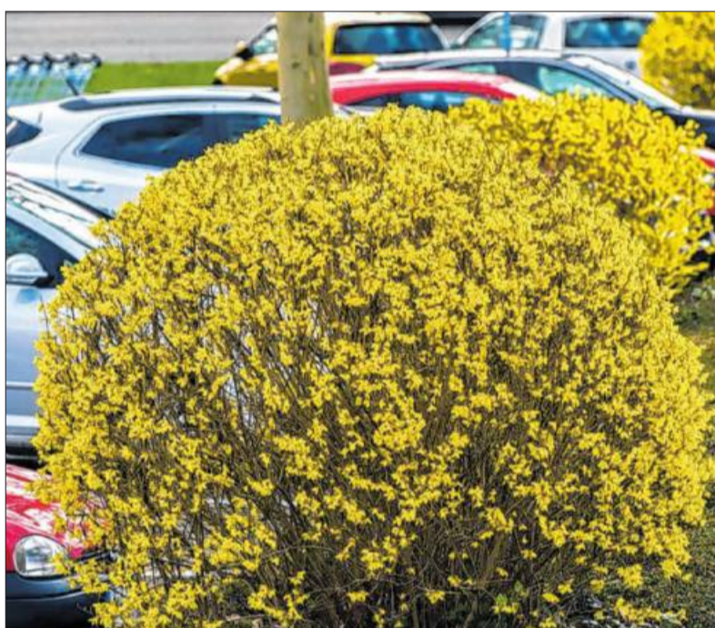
Blühende Forsythien-Büsche auf dem Mühlwiesenparkplatz in Bietigheim.

Die Natur ist auch während Corona nicht zu bremsen und sorgt draußen für bunte Farben