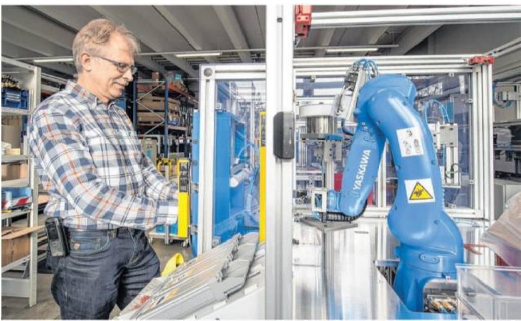
Die Digitalisierung nimmt auch im Mittelstand zu.

IfM Bonn: Die Digitalisierung verändert die Art, wie unternehmensübergreifend Innovationen entwickelt werden.