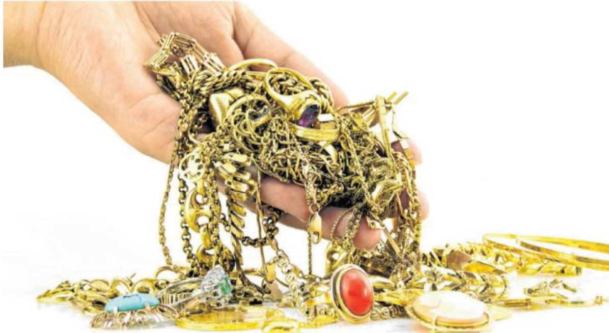
Der Goldpreis ist in den vergangenen 12 Monaten rasant gestiegen. Deswegen lohnt sich der Verkauf jetzt besonders.

Beim Goldankauf Martin nimmt man sich viel Zeit für die Kunden und zahlt immer einen guten Preis für Gold und andere Wertsachen.