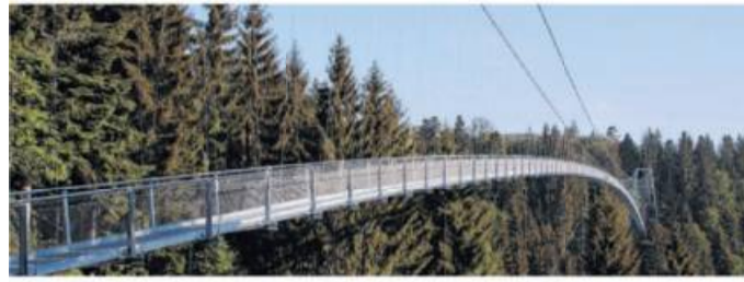
Hängebrücke in Bad Wildbad.

Der Enztal-Radweg führt von der Quelle der Enz im nördlichen Schwarzwald bei Enzklösterle bis zu ihrer Mündung in den Neckar in Walheim. Die Wegstrecke beträgt etwas mehr als 100 Kilometer und ist in zwei Tagen gemächlich zu bewältigen. Flussabwärts ist die Tour ohne nennenswerte Steigungen für jede Altersgruppe geeignet. Die gängige Tour orientiert sich von der Enzquelle als Ausgangspunkt von Enzklösterle bis zum Endpunkt in Walheim. Selbstverständlich ist die Tour auch in umgekehrter Richtung sowie ab allen Orten unterwegs befahrbar, dann allerdings, so weiß der sportliche Fahrer, nehmen die Steigungen vor allem in Richtung Quelle zu.