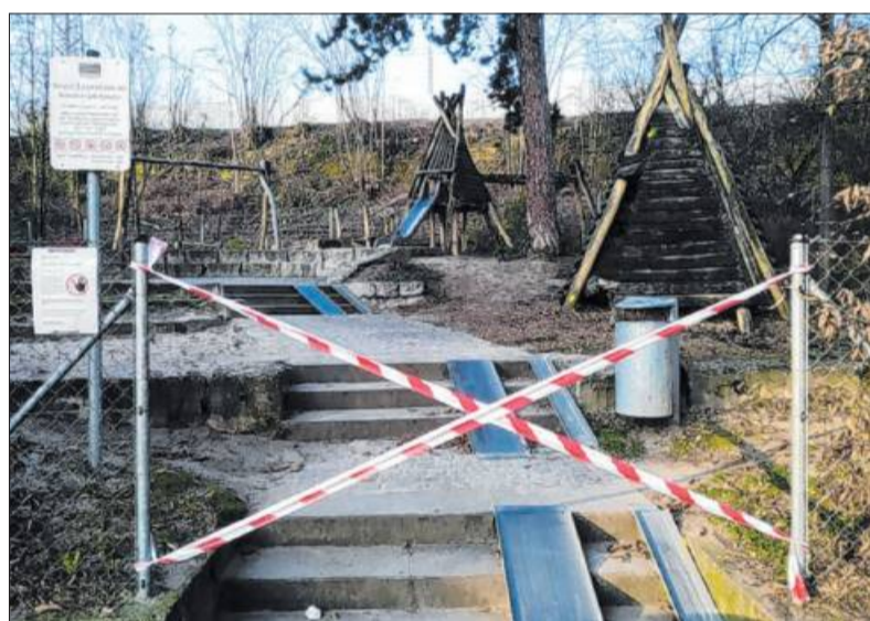
So wie hier in Ludwigsburg sieht es derzeit überall aus: Spielplätze sind bis auf weiteres geschlossen.

„In der momentanen Situation geht es darum, die Ausbreitung des