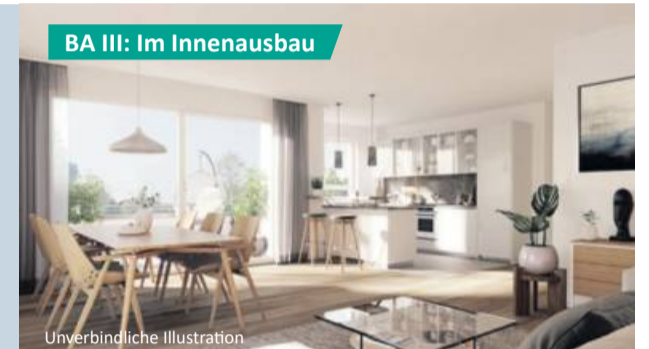
BA III: Im Innenausbau