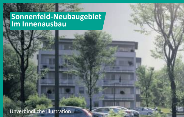
Sonnenfeld-Neubaubereich Im Innenausbau