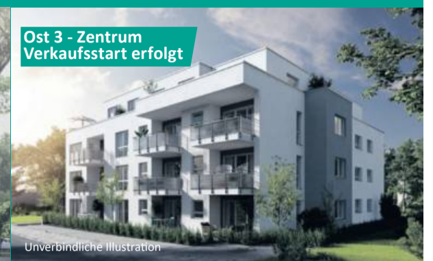
Ost 3 - Zentrum Verkaufstart erfolgt