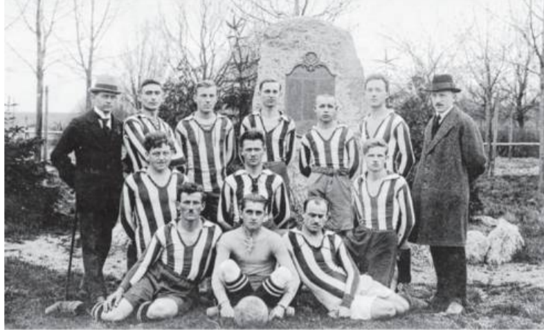
Wie alles begann: Ein Foto vom VfB aus dem Jahr 1920 – zu Besuch beim MTV Ludwigsburg.

Achtung: die ersten beiden Jubiläumsveranstaltungen werden wegen Corona verschoben