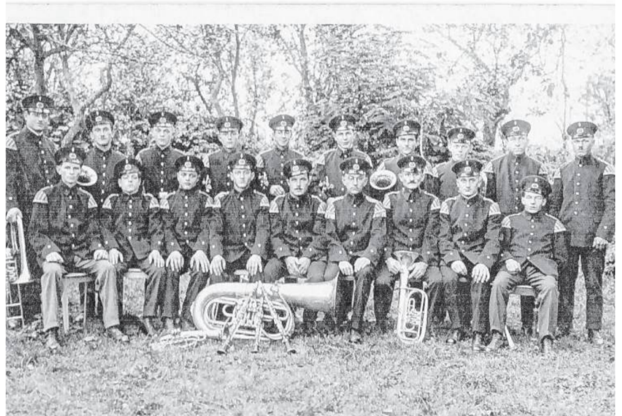
Der Musikverein Unterriexingen e.V. 1925: die Musiker in ihren ersten Uniformen.

Im Jahre 1959 wurde erstmals seit Bestehen des Musikvereins