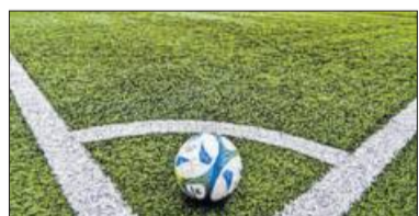
Derzeit ruht der Ball.

Die Bietigheim Steelers sind vor einer Woche aus den Playoffs der Deutschen Eishockey-Liga 2 (DEL2) ausgeschieden. Aber selbst wenn sie noch im Wettbewerb wären, kämen sie am Wochenende nicht mehr zum Einsatz. Denn sowohl die beiden unabhängigen höchsten Ligen als auch der Deutsche Eishockey-Bund, der mit seinen Landesverbänden für den gesamten restlichen Spielbetrieb zuständig ist, haben die komplette restliche Saison abgesagt. Somit ist auch der SC Bietigheim-Bissingen betroffen. Für die Steelers-Amateure hätte am Freitagabend das Playoff-Finale gegen den Lokalrivalen Heilbronner EC Eisbären begonnen. Die Bietigheimer sind amtierender Meister der vergangenen beiden Jahre. Auch die U17 ist von der Absage schwer betroffen. Sie