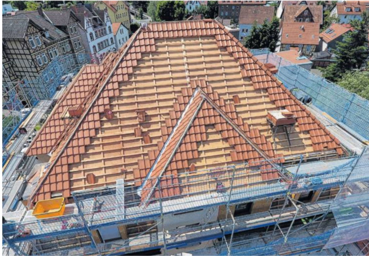
Auch beim Dach: Für Hausbesitzer gibt es Steuer-Erleichterungen für zahlreiche Sanierungsmaßnahmen.

K urz vor Jahresende 2019 haben Bundestag und Bundesrat den Steuerbonus für energetische Sanierungen durchgewunken. Damit ist das geänderte Gesetz zur Umsetzung des Klimaschutzprogramms 2030 wie geplant zum 1. Januar 2020 in Kraft getreten. Für Hausbesitzer bedeutet das Steuer-Erleichterungen für zahlreiche Sanierungsmaßnahmen. Der Steuerbonus gilt für 10 Jahre. Der Zentralverband des Deutschen Dachdeckerhandwerks (ZVDH) zeigt sich erfreut: „Wir haben ja schon fast nicht mehr daran geglaubt, aber dann hat der Bundesrat mit seiner Zustimmung doch noch den Weg frei gemacht für mehr Klimaschutz. Eigenheimbesitzer können sich jetzt über Steuervorteile freuen und Dachdecker über Aufträge, die nicht nur den Geldbeutel füllen, sondern unser Gewerk zu einem wichtigen Erfüller des Klimaschutzprogramms machen. Nun muss allerdings schnell Klarheit zum Beispiel über die genauen Anforderungen geschaffen werden. Hier darf jetzt nicht wieder nutzlose Zeit für unnötige Bürokratie verschwendet werden. Das Dachdeckerhandwerk steht jedenfalls bereit, für