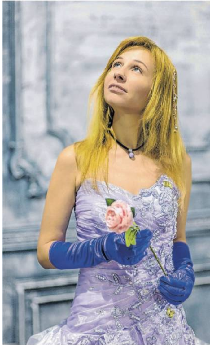
Zum Abiball festlich gestylt – egal, ob klassisch, cool, lässig, romantisch oder verspielt: Die neue Frühjahrs- und Sommermode bietet jede Menge Möglichkeiten. Übrigens nicht nur für „Prinzessinnen“ – auch für „Prinzen“.

Klassisch elegant oder ausgefallen: Festtagsoutfits nach jedem Geschmack