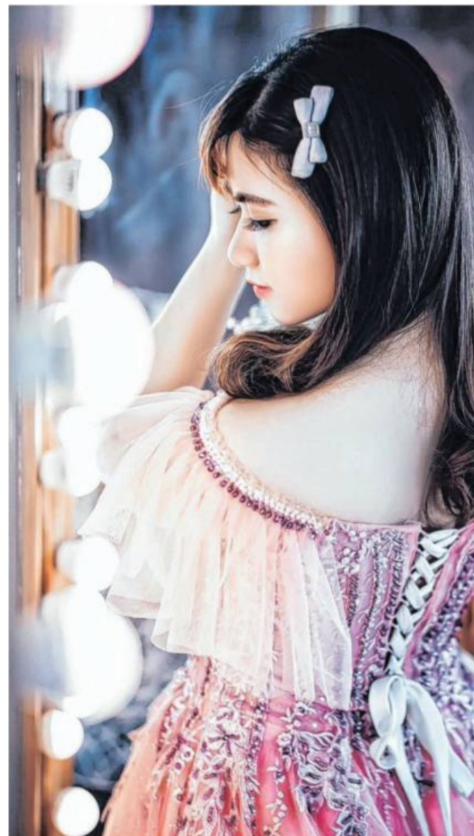
Auch Vintage-Mode mit zarter Spitze sind ein Traum für ein unvergessliches Fest.

Viel wird auf coole, intensive Blautöne, frisches Grün sowie beerige Rot- und Rosatöne gesetzt. Neutrale Nudes und klassisches Schwarz dürfen bei der Festmode natürlich auch nicht fehlen. Die besonders feminine und verführerische Note der Kollektion VM by Vera Mont spiegelt sich in Form von ästhetischen Cut-Outs, Off-Shoulder-Styles, V-Ausschnitten, Nude-Optiken und Beinschlitzern sowie reizvollen Rückenschnürungen wieder. Für einen unvergesslichen Anblick sorgen daneben zarte Spitze, aufwendige Panneaux-Stickereien, florale Applikationen sowie glamouröse Pailletten- und Perlenstickereien. Ge- paart mit voluminösen Glitzer-Tüllröcken, hochwertigem Glanzsatin und figurbetonten Oberteilen, lassen diese Kleider Prinzessinnen-träume wahr werden. Um die Hochzeits-, Ball- und Konfirmations-Looks stilvoll zu ergänzen, kommt die Kollektion mit Boleros in Bouclé, weichem Strick mit Lurexgarn und einer fancy Federoptik.