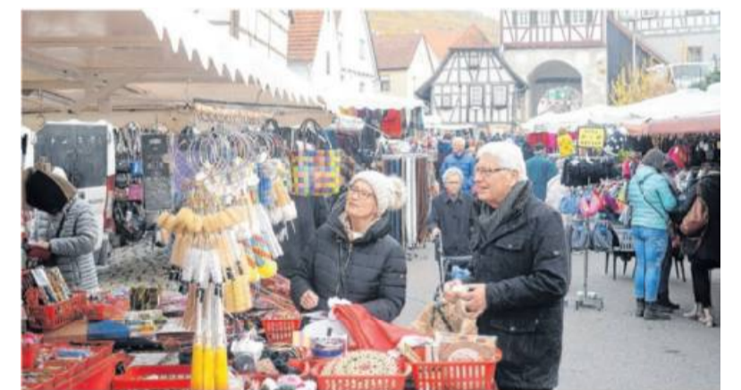
Der Martinimarkt gehört neben dem Pfingstmarkt zu beiden großen jährlich abgehaltenen Märkten in Mundelsheim.

Als Ergänzung dazu bieten die sechs Waldwanderwege Wanderrern und Spaziergänger Erkundungstouren durch den schönen Mundelsheimer Wald.