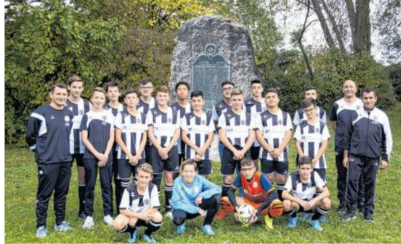
99 Jahre später: die VfB-D-Jugend 2019 an derselben Stelle, an der schon ihre „Vereinsvorfahren“ 1920 standen: dem MTV-Gedenkstein.“

Tamm. „Am 21. Juni 1920, also vor fast 100 Jahren, entschlossen sich 43 mutige, junge Männer dazu, in Tamm einen neuen Sprössling mit Namen ‚Fußball‘ zu pflanzen“, so beschreibt Wolfgang Kellner vom VfB Tamm die Anfänge des Vereins und fügt hinzu: „Aus diesem Sprössling ist ein tief verwurzelter Baum geworden, der heute viel mehr kann als ‚nur‘ Fußball und ganz im Sinne seiner Gründer reife Früchte trägt.“