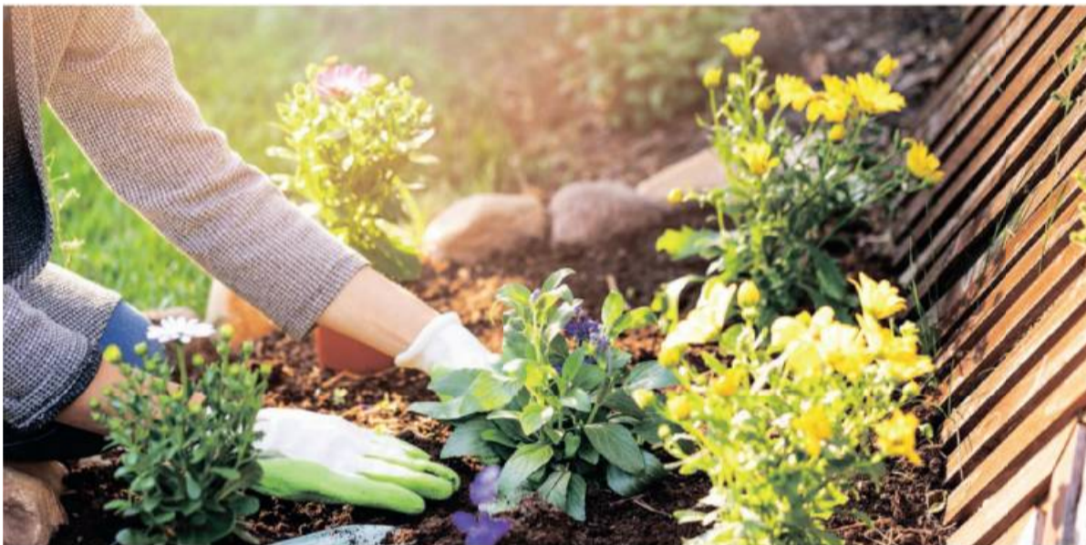
Gartenbesitzer freuen sich jetzt schon darauf, tatkräftig im Garten zu werkeln und die ersten Sonnenstunden an der frischen Luft zu genießen.