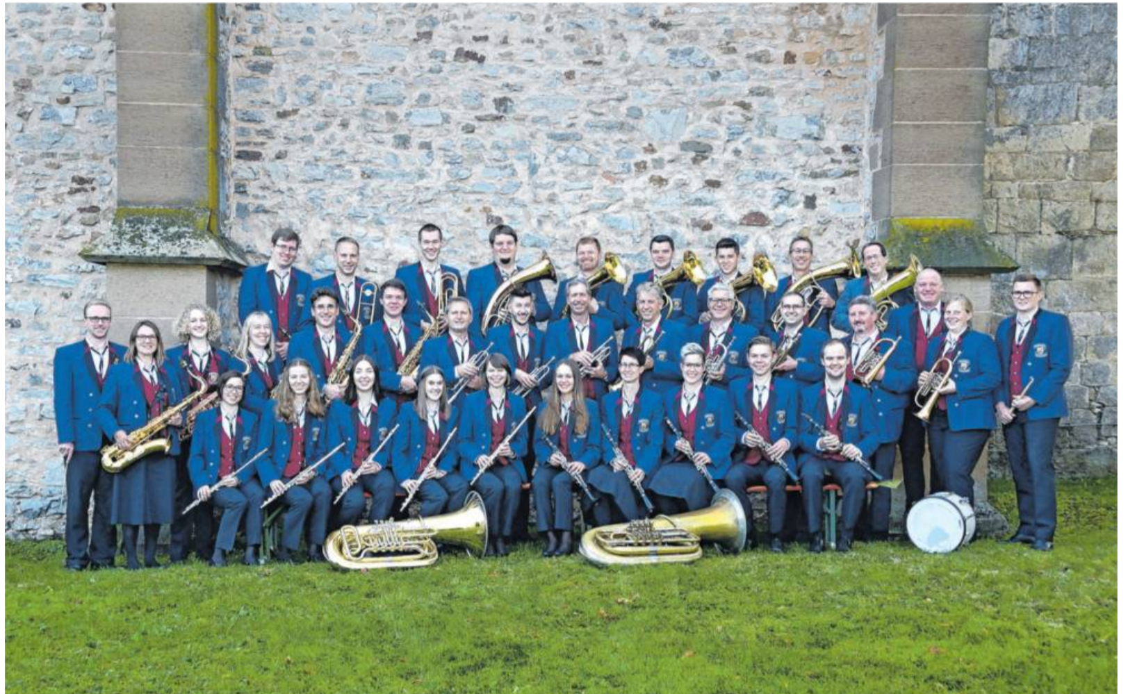
Der Musikverein Unterriexingen e. V. im Jubiläumsjahr 2020.