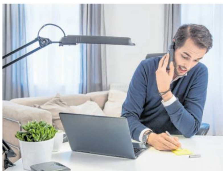
Immer verfügbar: Wer zuhause arbeitet, steht oft vor dem Problem, stets erreichbar zu sein. Dagegen hilft, feste Arbeitszeiten zu vereinbaren.

Werde das Thema Homeoffice nicht strukturiert angegangen, könne das etwa dazu führen, dass die Beschäftigten sich selbst überschätzen, sagt Altun. Und: Die Grenze zwischen Arbeit und Freizeit verschwimmt. „Laut Studien stellen Betriebe, die keine Regelungen und Vereinbarungen getroffen haben, immer wieder fest, dass Arbeiten im Homeoffice nicht zu einer Motivation, sondern eher zu einer Demotivation der Beschäftigten führt“, so Al-