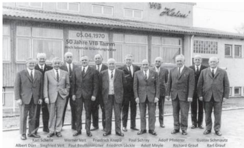
Ein Foto aus dem VfB-Archiv: Gründungsmitglieder des Vereins bei der 50-Jahr-Feier 1970.

Die vorläufig letzte Veranstaltung des VfB im Jubiläumsjahr ist die Jahresfeier mit Ehrungsabend am 7. November im Bürgersaal der Gemeinde Tamm.