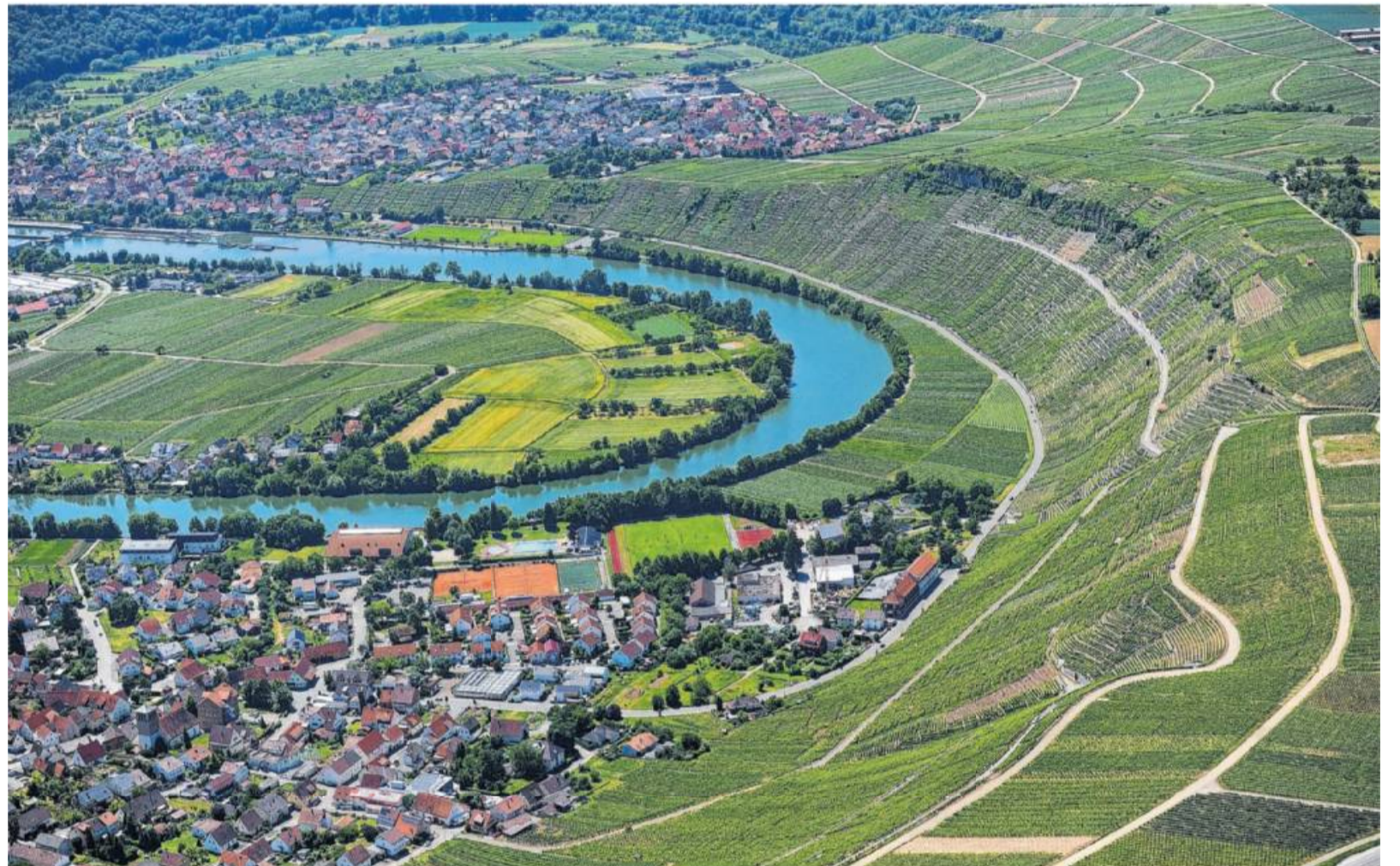
Idyllisch an der schönsten Neckarschleife gelegen, umgeben von Rebhängen und Obstanlagen, bietet Mundelsheim viele Attraktionen rund um Wein- und Obstbau, Geschichte und Landschaft.

Mundelsheim bietet eine hervorragende Infrastruktur und ein reges Gewerbe.