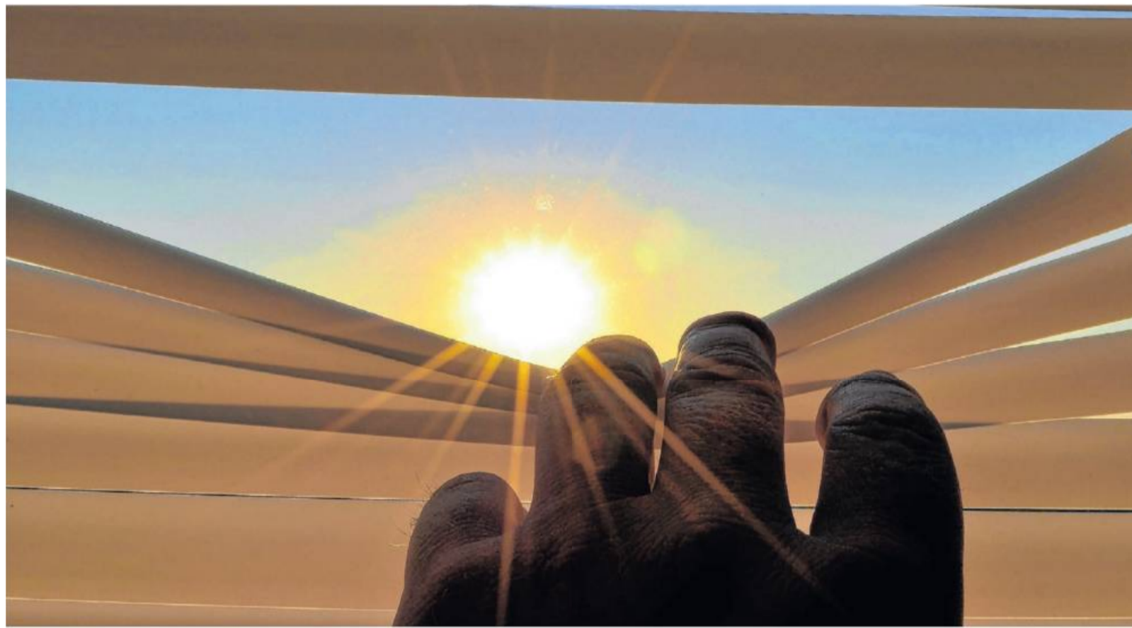
Sonnenschutz beginnt bereits im Innenraum: Die Fachbetriebe informieren über die Möglichkeiten für Innen und Außen.

Am Anfang steht meist das Beratungsgespräch in den Ausstellungen der Betriebe. Danach begutachten die R+S-Profis vor Ort, welche Produkte geeignet sind, um den gewünschten Effekt zu erreichen. Entscheidend ist, neben der Ausrichtung des Hauses, die korrekte Ermittlung des Sonnenstands für die gesamt-