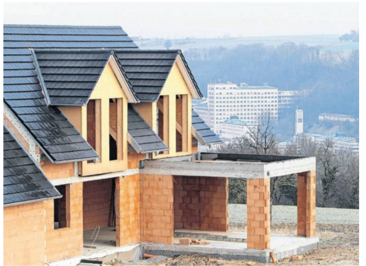
Wenn der Bau nicht weitergeht: Bauherren sollten auf die Vereinbarung eines Fertigstellungstermins bestehen.

Die Arbeitsgemeinschaft Bau- und Immobilienrecht im Deutschen Anwaltverein (ARGE Baurecht) betont: Bauherren sollten auf die Vereinbarung eines Fertigstellungstermins bestehen. Denn laut Paragraf 650 k, Absatz 3 im Bürgerlichen Gesetzbuch ist dieser laut Verbraucherbauvertragsrecht zwingend zu nennen. Und selbst wenn die Baufirma keinen konkreten Fertigstellungstermin angeben möchte, weil etwa die Finanzierung noch nicht gesichert ist, muss ein Zeitraum der Bauausführung im Vertrag stehen. Dauert der Hausbau am Ende doch länger als vertraglich vereinbart, besteht ein Anspruch auf Schadenersatz, so die Erfahrung der ARGE Baurecht. Das ist jedoch nicht der Fall, wenn die Bauherren selbst schuld an der Verzögerung sind, weil sie etwa ihre eigenen Pflichten aus dem Vertrag nicht erfüllt haben.