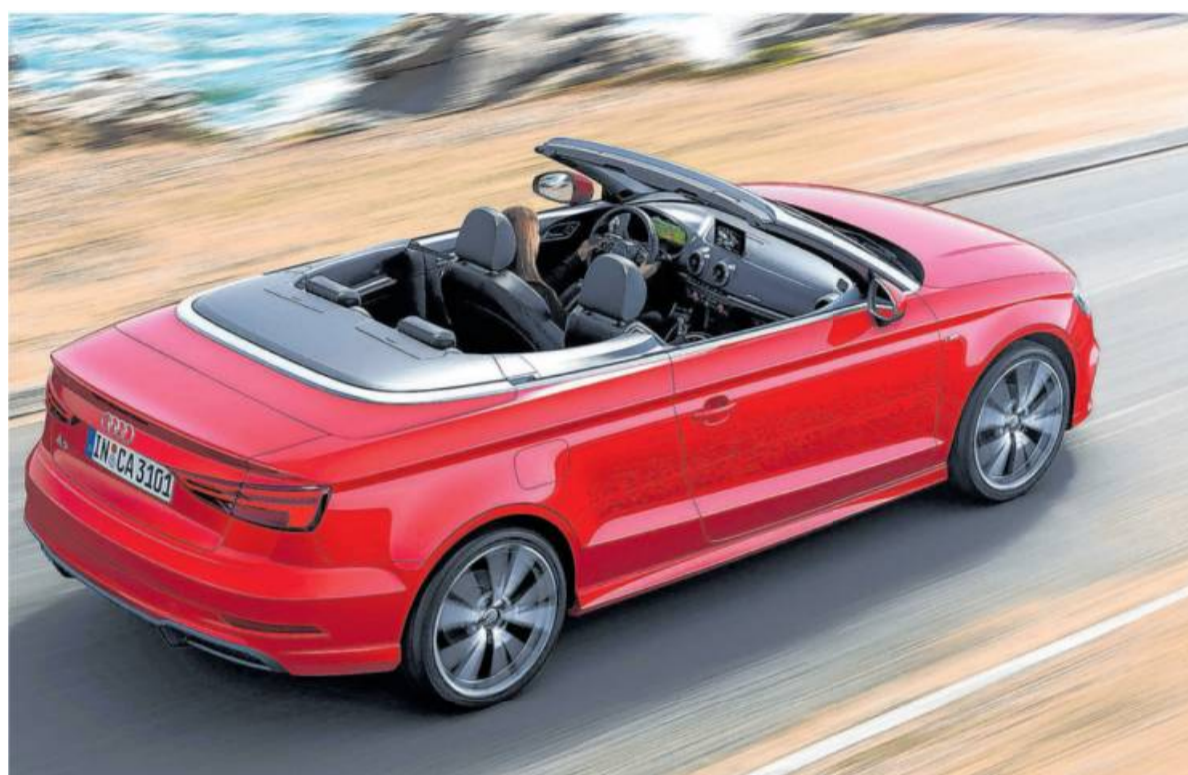
Für alle Wetter gerüstet: Das A3 Cabriolet von Audi.

Dass aber ein Windschott – im Winter schließlich unerlässlich – bei den Ingotstädtern ein Extra ist und bei einem immerhin 45 000 Euro teuren offenen Auto mal