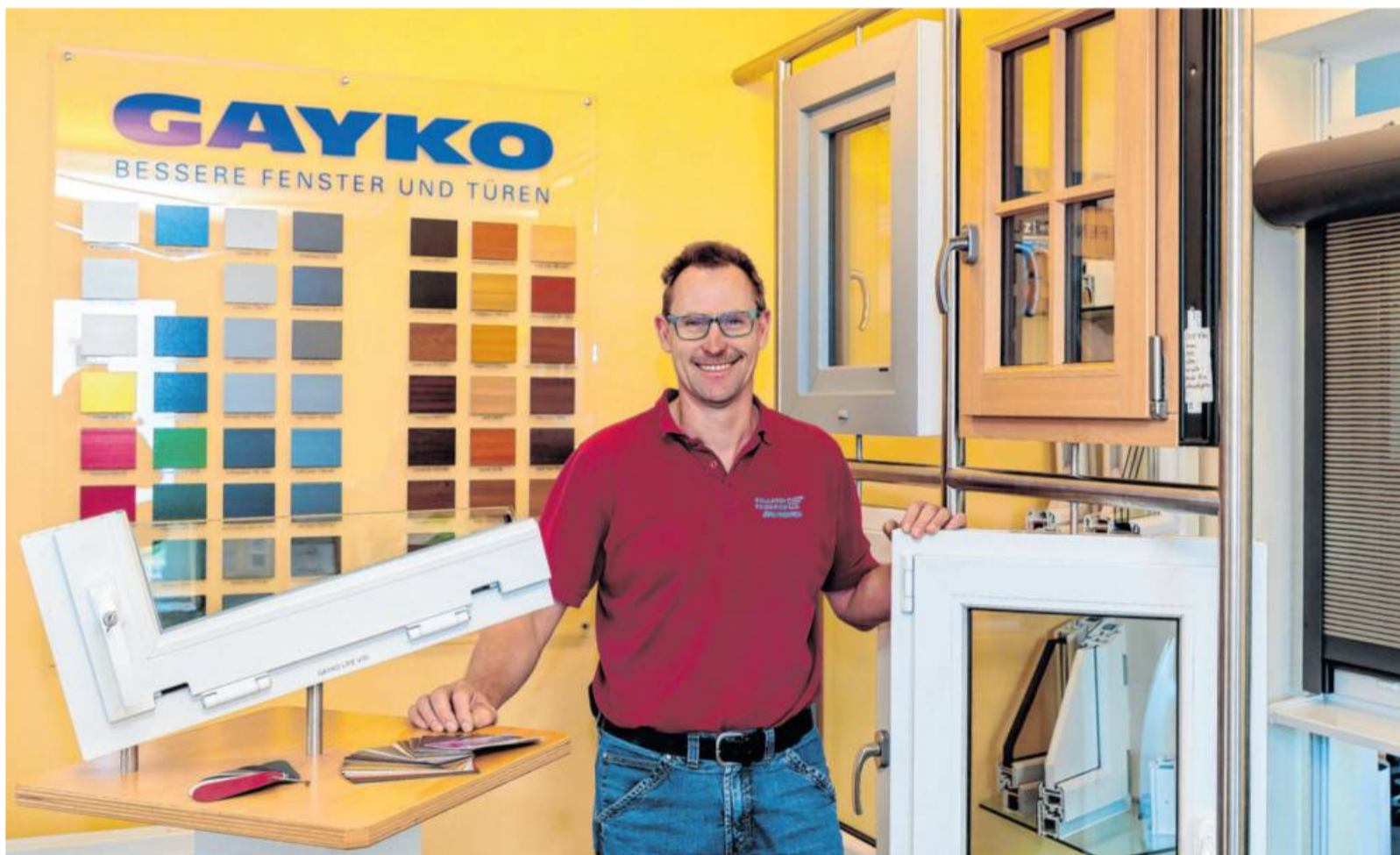
Auch Fenster und Türen finden sich im Angebot.