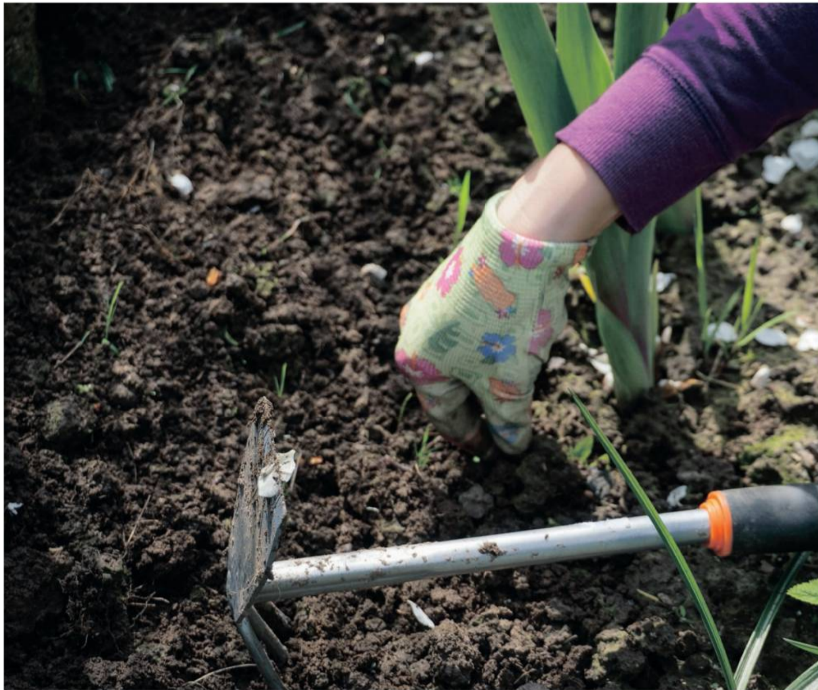
Jetzt ist es Zeit, die Voraussetzungen für blühende Oasen zu schaffen.

Wer seine Obstbäume nach dem Frost bzw. zum Frühjahr hin zurückschneiden möchte, sollte sich in jedem Fall fachmännischen Rat – zum Beispiel in den Baumschulen vor Ort – einholen. Denn Laien kann dabei doch der ein oder andere Fehler unterlaufen und im schlimmsten Fall die nächste Ernte im Sommer oder