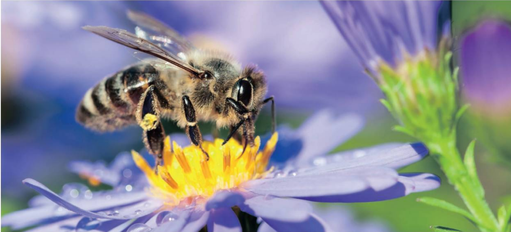
Es lässt sich einiges dafür tun, damit die eigene Naturoase nicht nur den menschlichen Genießern gefällt.

Wer bei der Frühlingspflege ein paar Tipps beachtet, erschafft eine blühende Oase und tut gleichzeitig der Natur etwas Gutes