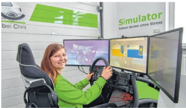
Bei der Fahrschule AbC kommen modernste Lernmedien zum Einsatz. Hier zum Beispiel der Fahrsimulator.

Weitere Infos gibt es online unter folgenden Adressen: www.fuehrerschein-abc.de , facebook.com/fahrschuleabc , Instagram.com/fahrschule_abc , B196 Video: www.youtube.com/watch?v=PEEBP0zXGII