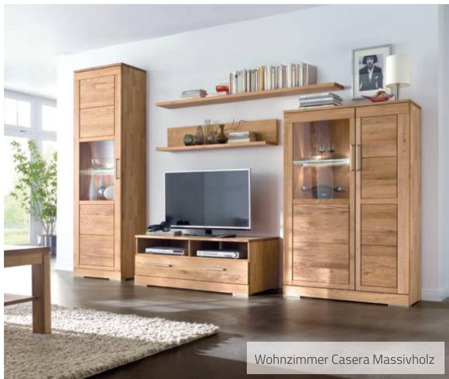
Wohnzimmer Casera Massivholz

PRE OPENING INFO PARTY FREITAG 06. MÄRZ 2020 19 BIS 22 UHR