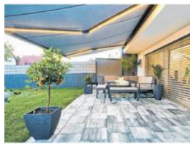
Design-Markisen bieten hochwertigen Sicht-, Sonnen- und Wetterschutz.

chungen kreieren einen hochwertigen Außenraum und Markisen spenden in erster Linie angenehmen Schatten, gestalten aber auch die Optik der Fassade. Experten für Sonnenschutztechnik bieten für jedes Ambiente und jede Situation die passende Lösung. Stilvoll schaffen Markisen, Designer-Pergolen und innovative Lamellendächer neuen Lebensraum. Mit farbenfrohen Stoffdessins und vielfältigen Gestellfarben etwa stehen spezielle Markisen-