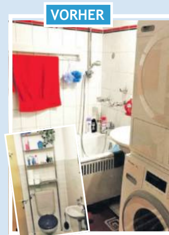
Vorher: Bad und Toilette getrennt