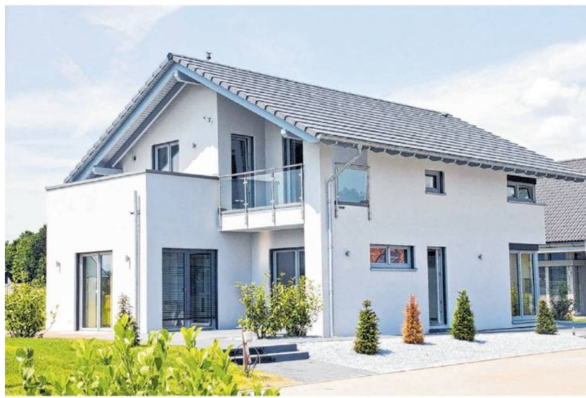
Eigenleistungen ja oder nein? – Das ist eine von vielen Fragen beim Fertighausbau.

Insgesamt sind rund 50 Fertighaushersteller QDF-zertifiziert. Sie alle sind Mitglied im Bundesverband Deutscher Fertigbau, der die hohen Qualitätsstandards im Jahr 1989 als Voraussetzung für den Eintritt in den Verband festgelegt und seitdem regelmäßig an den Stand der Technik angepasst hat.