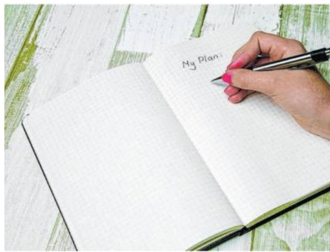
Ips/ML. Die Auseinandersetzung mit der Planung des eigenen Ablebens entlastet Angehörige.