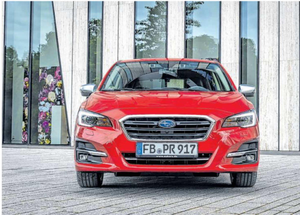
Und plötzlich fehlt die Hutze auf der Haube: Der Subaru Levorg startet neu durch.

So zum Beispiel Sitzheizungen (vorne), eine Zwei-Zonen-Klimaautomatik, Licht- und Regensensor, ein aktiver Supralte-Assistent sowie Abstandswarner plus Notbremsassistent mit Fußgänger- und Fahrradfahrer-Erkennung, die durch gelbe und rote