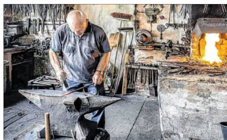
Die Museumsschmiede gibt Einblicke in ein altes Handwerk.

Das Ludwigsburg Museum ist von Dienstag bis Sonntag, 10 bis 18 Uhr geöffnet.