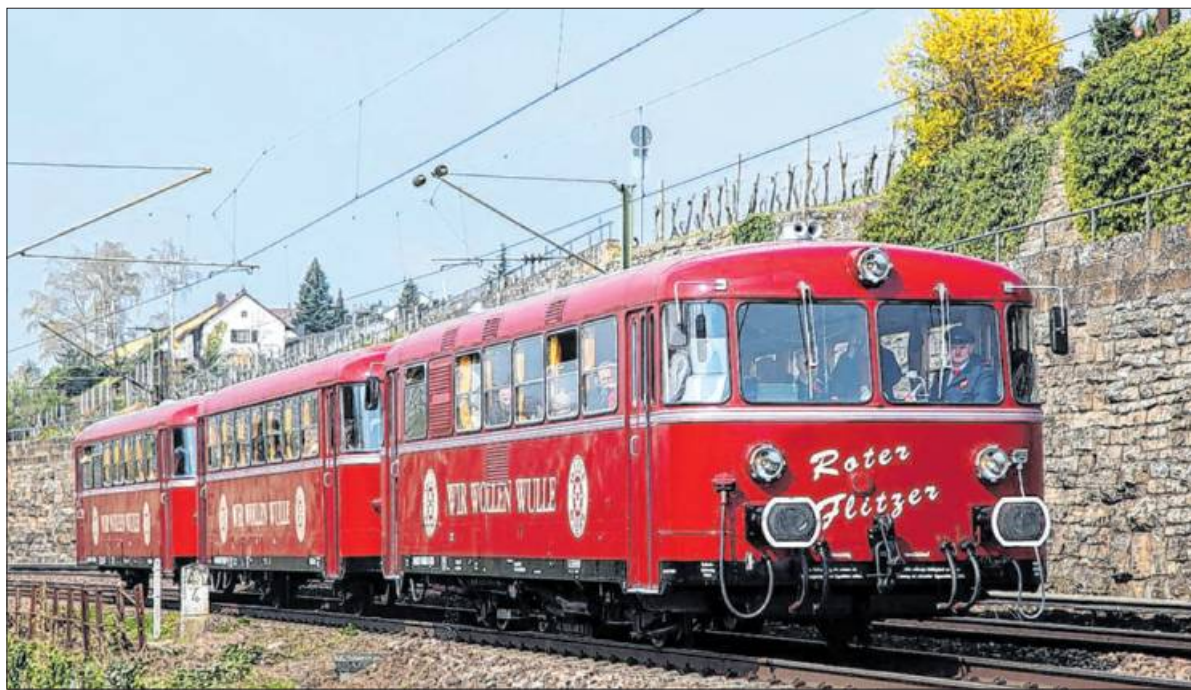
Ab dem 29. März ist der Rote Flietzer wieder in der Region unterwegs.

Kurz mal weg“ ist das Motto für das Fahrtenprogramm des Roten Flietzer im Sommerhalbjahr 2020, das der Förderverein Schienenbus e. V. nun der Öffentlichkeit vorgestellt hat. Zwischen März und Oktober werden mit den historischen Schienenbussen in diesem Jahr viele neue attraktive Ziele angefahren, die einen erlebnisreichen Tagesausflug garantieren. Los geht es bereits am 29. März mit einer Schwarzwaldrundfahrt zum „Frühlingserwachen im Freilandmuseum Vogtsbauernhof“. Schon am 25. April folgt einer der Höhepunkte der Saison, wenn der Rote Flietzer nach Konstanz zu einer exklusiven Bodenseerundfahrt mit dem historischen Raddampfer „MS Hohentwiel“ fährt. Am traditionellen Familienausflug- und -wandertag 1. Mai geht es dann schon fast traditionell ins malerische Krebsbachtal zur Maiwanderung. Wer unterwegs noch in die Saline Bad Friedrichshall einfahren möchte, steigt unterwegs aus und wandert