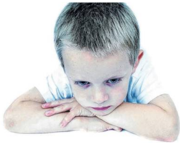
Kinder trauern anders als Erwachsene

Natürlich müssen dabei nicht alle Details erläutert werden. Dennoch ist es meist nicht hilfreich, die Kinder vor der Trauer der Eltern und den anderen Familienmitgliedern abschirmen zu wollen. Ein offener Umgang mit Emotionen kann allen Beteiligten helfen, die Trauer zu verarbeiten.