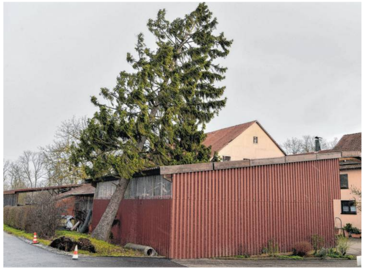
Sturm Sabine hat Spuren hinterlassen: Die meisten Schäden sind versichert, doch manche brauchen einen extra Versicherungsschutz.

Die Wohngebäudeversicherung mit Elementarversicherungsschutz übernimmt die Kosten für die Reparaturen im und