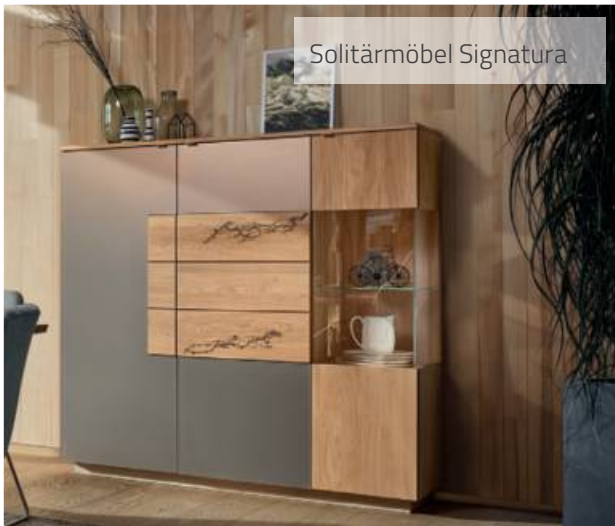
Solitär Möbel Signatura