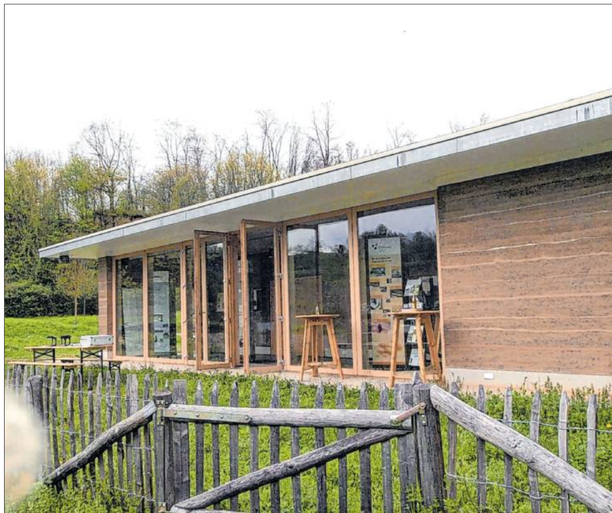
Das Naturinfozentrum Casa Mellifera wird wieder zur Bühne für Themen und Beiträge rund um den Neckar.

„Bengalisches Feuer und nächtliches Baden... Historische Zeitungsmeldungen vom Ludwigsburger Neckar“, lautet der Titel des dritten Themas. Als Studierende an der Akademie für darstellende Kunst ist