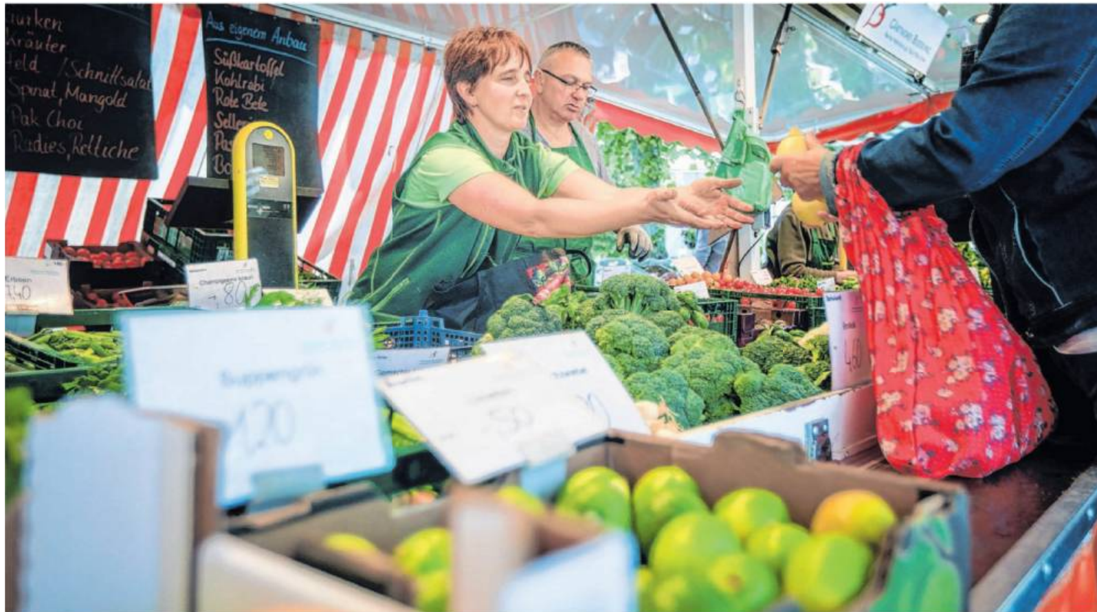
Wer sein Obst und Gemüse auf dem Wochenmarkt oder direkt beim Erzeuger kauft, bekommt beste Qualität.

Die Verbraucherzentrale definiert ein regionales Produkt als „Produkt aus der Region für die Region“: Denn: Der Begriff „Region“ ist gesetzlich nicht definiert und wird daher unterschiedlich verwendet. Viele verstehen unter dem Begriff Region den Großraum, ihren Wohnort – zum Beispiel ihren Landkreis, ihr Bundesland oder Ähnliches. Für Verbrau-