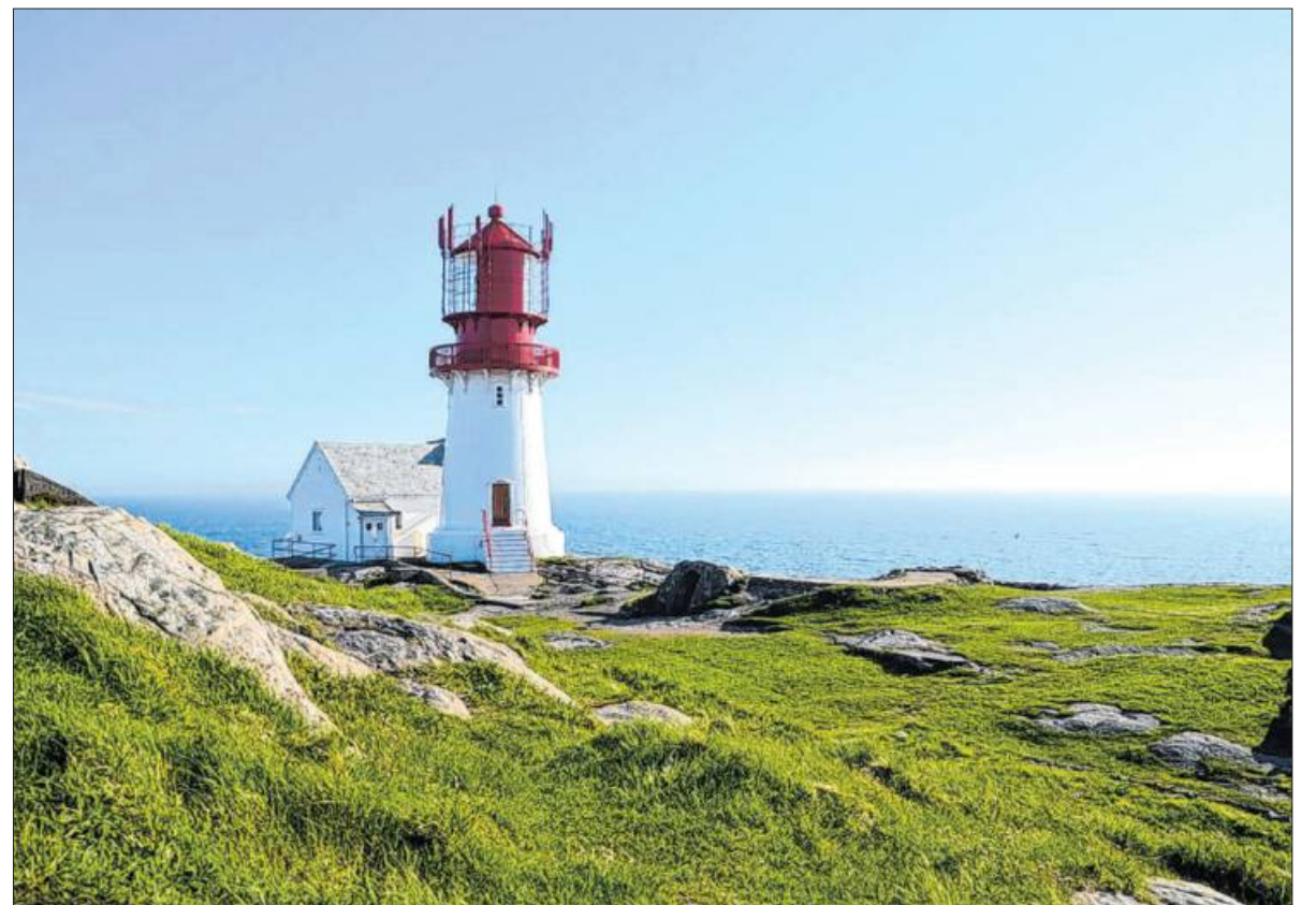
Zu Fuß durch Norwegen: Simon Michalowicz berichtet von seinen Erlebnissen.

Wer einmal mit dem Nordlandvirus befallen ist, der wird es so schnell nicht mehr los. Auf einer solch langen Wanderung den Lauf der Jahreszeiten hautnah zu erleben ist dabei sicher ein ganz besonderes Privileg. Ebenso den freundlichen und offenen Norweger auch