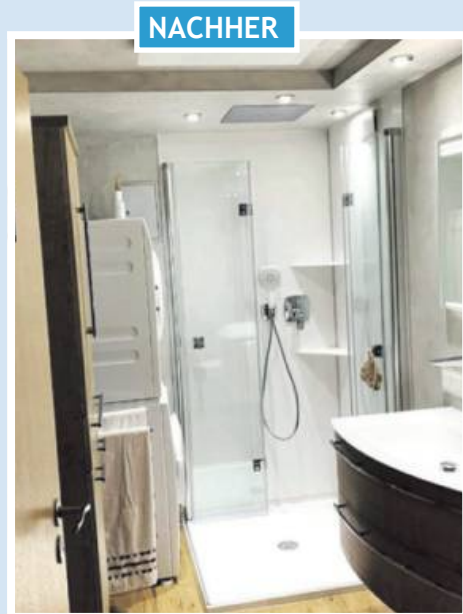
Nachher: Zusammenführung zu einer Bad-Oase