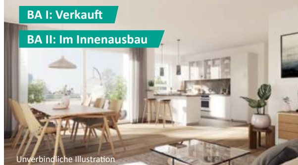
BA I: Verkauft