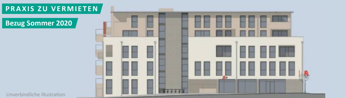
PRAXIS ZU VERMIETEN